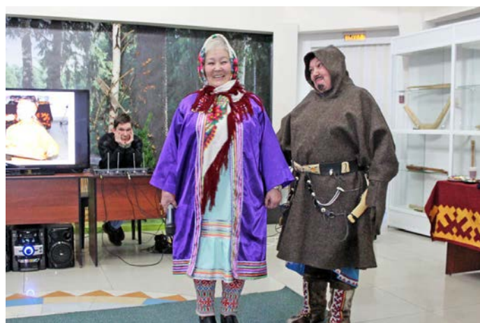
«Петуц-Петуц кумие» ар аридәнән