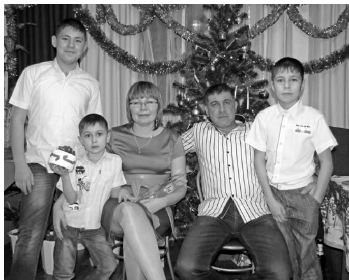
Новьюховәт-Рагимовәт хоттелд әх

кәслаңән. Щи тумпийн «Лыжня России» па «Кросс нации» мәнты пурайн кәсләт. Вән пухд еңк хәрн хәтәтләты вера вәндтыйлд, щипи күтн теннисн юнтты яңхәл.