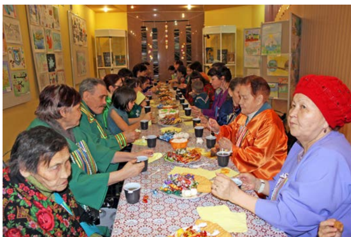
Мавәң пәсанән шай яньщдәт