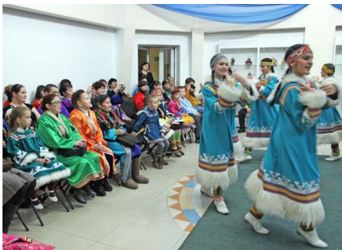
«Гжель» немуп тӓхи эвет яклӓт