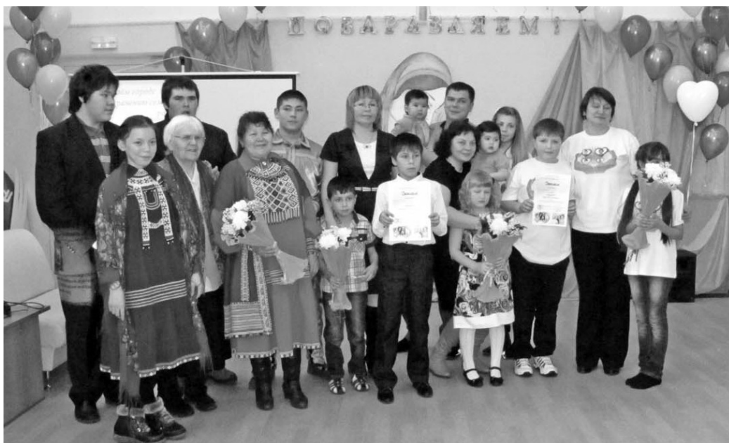
«Ма хоттел ёхдам» хуши кәсты ёх