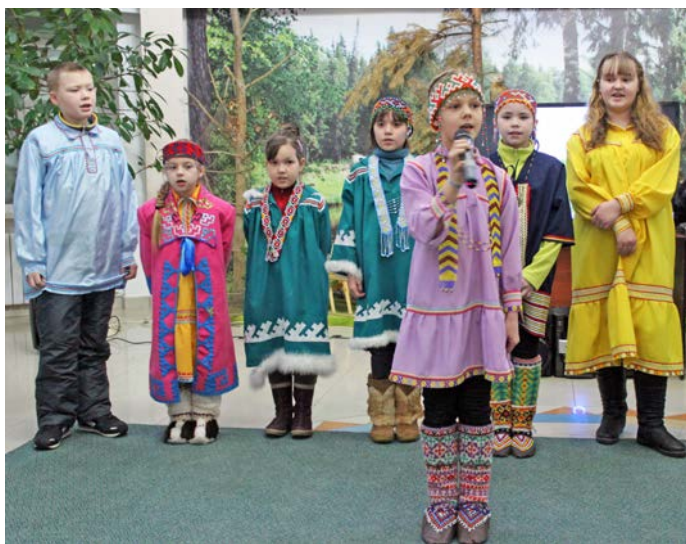
Хӓнты ар аридӓт