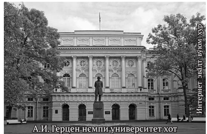
А.И. Герцен немпи университет хот

Целевой тәхи тәта шеңк шимл мәды. Щит пәта мосл, сыры лупем ширн, рәт мұвн мосты непекәт ләщәтты. Хән щәлта непек кит-