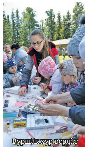
Вурщӑк хур верлӑт