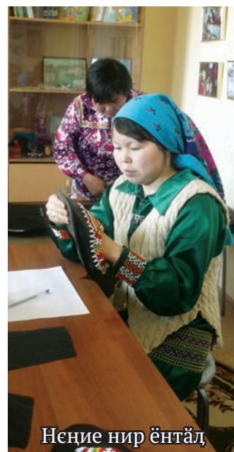
Неңие нир әнтәл

Ши хәтләт мәр мет вудана вәс ши вер, хуты «Нумто» немпи тәхи оләңән аршәк мир уша ат павәтсәт. Щит пата «день открытых дверей» вәйтәнтупсы лэщәтсы. Н.И. Вылла шив юхтыдум «Русское географическое общество» хуятәт оләңән па хәнтәт па юрнәт пурмәсәт әвәлт вандтупсы верәс. Верәнтты па мойң хуятәт уша версәт, мәта мир тәм мұвн вәд, муй пата щимәщ мұв-авәт давалды тәхет мосләт.