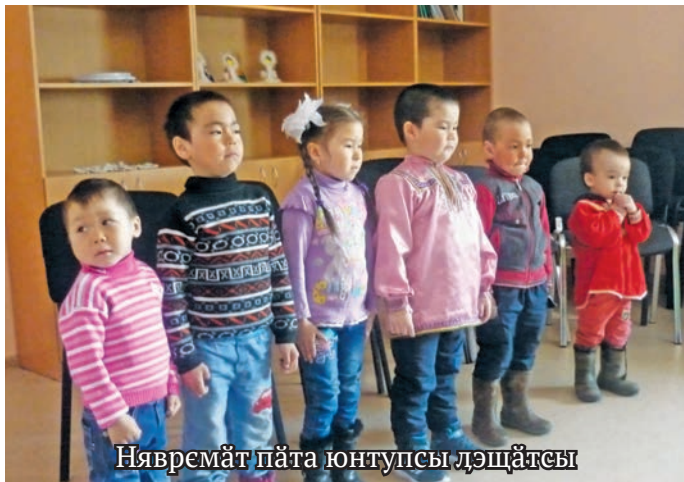
Нявремат пата юнтупсы лэщатсы