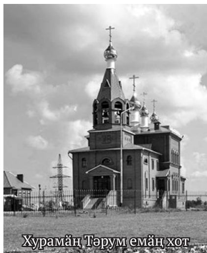
Хурамәң Тәрум емаң хот