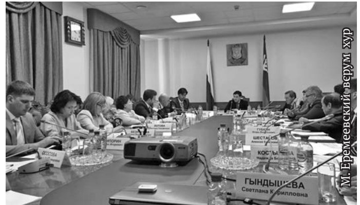
М. Еремеевский-верум хур

Елды кәщә ех әкмум хотн нух вантса щи вер, муй иты Ёмвош округн вәдты хәнтәт, вухалят па юрнәт атәдта нух хәншман па дўнәтман тайты. Тәмәщ мир нух дўнәтты непек арсыр нәтупсы верәт тәса дәщәтты кешә мосл. Щимәщ непек эвәлт питд кәдты, мәта хуят вәнт мўвн вўды лавәдман, вой-хўд вәдпәсдман па воньшумутәт әкәтман вәд. Еша вәд-