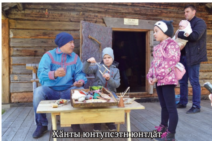
Хӑнты юнтупсӑтн юнтлӑт