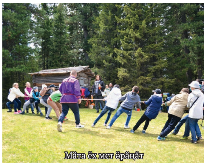
Мӑта ӑх мет ӑрӑнӑт