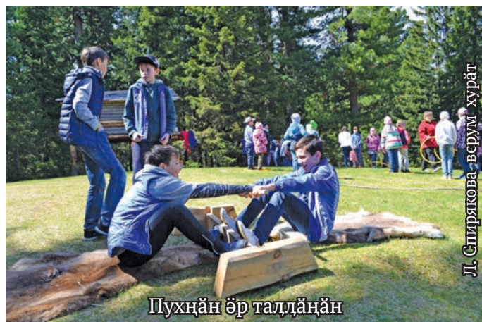
Пухӑн ӑр таллӑн

Лыпӑт енумты тылӑш 1-митн нявремӑт лавӑлты хӑтлӑтн ям тӑрум, хӑтлӑн хӑтл вӑс. Тӑмхӑтл «Торум Маа» музей хуща Конда юхан хонӑн вӑлты вухаль мир «Вурщӑк емӑнхӑтл» постӑсы.