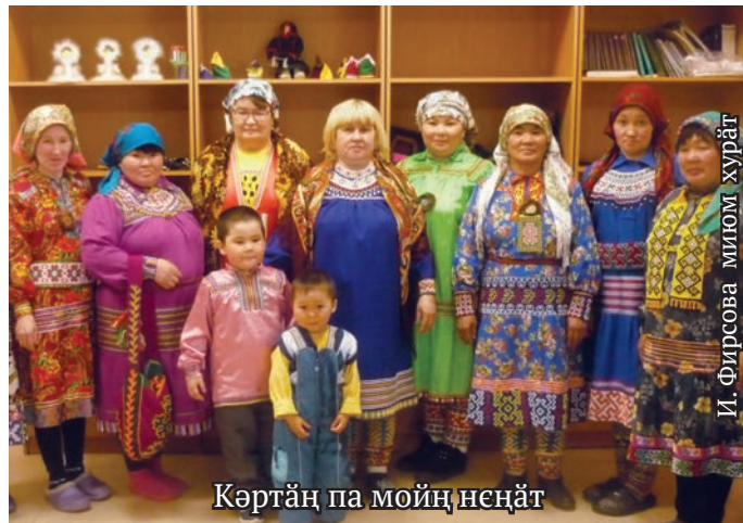
Кертан па мойң неңат