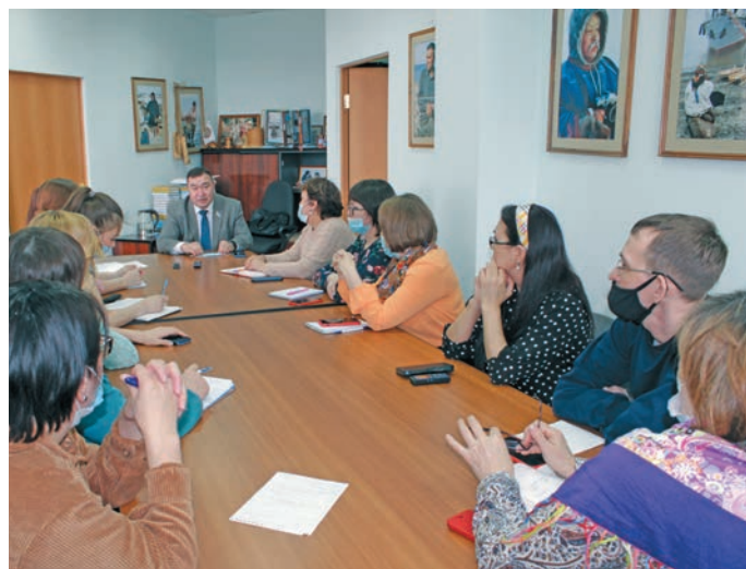
Вѳйтантупсы пурайн. Н. Меров верум хур

» Мет йм, хуты округевн хѳнты па вухаль ясѳнѳнѳнѳн айкелѳт лѳщѳтты ѳх вѳлдѳт. Нын ѳнтѳ тѳп ѳнѳки ясѳнѳн шуши мирлўва айт павѳтлѳты, нын рѳт ясѳнѳн лѳрамтлѳты па елды шавиман тѳйлѳты. Округевн вѳлды хѳнтылўв, вухальлўв па юрнлўв нын лѳщѳтум газетайнѳн