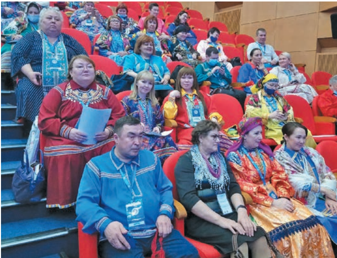
Югра мўв делегатат