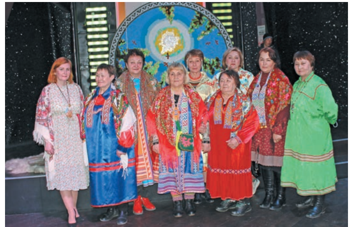
Нефтеюганск вошаӑ хӑнты неӑӑт