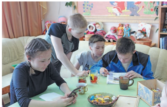
Касум вош интернатн вәлты нявремәт