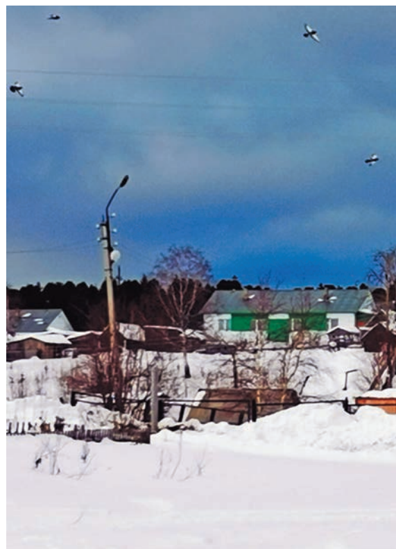
▲ Вэн Аңклум кэрт

Лариса Александровна эви опращ нәмл Пендыхова, лүв Шәншвош кэртән сема питәс па енмәс. Щәта ашколайл етшуптәслә па елды вәнлтыйлды нумәс верәс. Щи пәта Серов воша штукатура-малляра йиты пәта мәнәс. Тәп щи вер сәмла ән рәхәс. Лүв пиркашека йиты шеңк ләңхас па тәп немудт ән тывәс, щиты щи Шәншвошла юхи вәлты юхтәс. Еша вәс 1981-мит олн Вэн Аңклум кэрта имайл хуши мойна яңхәс. Щи тәхи щи мурта сәмла питәс па щиты кэртән щи хәщәс.