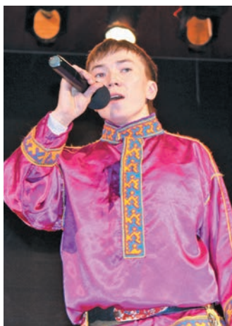
И.Э. Сандрин якты-ариты хотн

олдн етшуптәссем па елды Санкт-Петербург воша государственной полярной академияйн «гидрогеоэколог» щирн вәндтылдытты вўсыюм. Мўң вәндтәсыюв, муй щирн мўвәт-йиңкәт лавәлды, вой-хўл велпәсәт