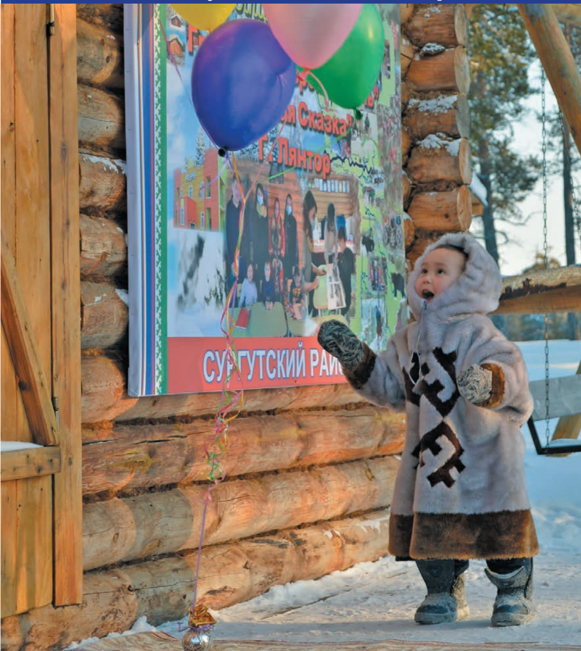
Вўды давўлды ханты айлат хє Клим Кантеров пухиел, И. Самсонова вєрум хур