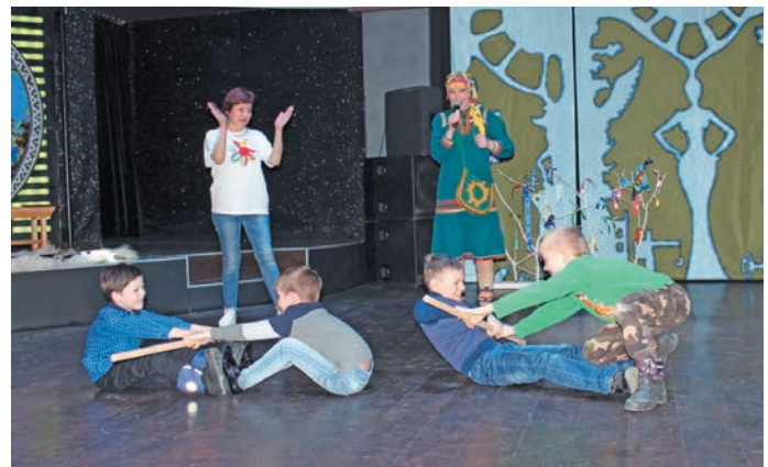
Пухӑт ӑр таллӑт. У. Данило верум хурӑт

» Катра вурӑа хӑтл вера ӑн постыйлса. Йис ясӑӑ щирн вурӑа вера амтӑтылӑл йилпа ай ныврем сема питтыйн. Вантӑ, лӑв кӑрӑӑл ай ныврем енмӑлты полты пайн хошмӑлӑтл. Нефтеюганск вошн 2000-мит ол вӑш эвӑлт «Вурӑа хӑтл» постӑты питсӑв. Тӑм ёмӑӑхӑтл «Центр национальной культуры»,