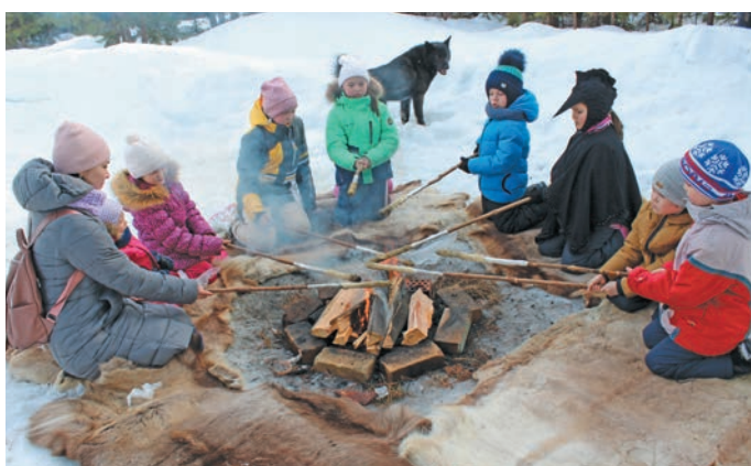
Йюха ювәрмунан нянь шаритләт. Н. Рагимова верум хурңән

Ар мир арсыр тәхет эвәлт рўтыщаты Касум воша юхтыйлләт: Москва, Ростов, Санкт-Петербург, Екатеринбург, Пермь вошәт, Марий Эл, Удмуртия мўвңән, Нуви сәңхум вош, Лыхма, Октябрьское, Приобье, Нягань па па вошәт эвәлт. Итәхәт кимит па хәлмит пўш тыв юхтыйлләт. Иса ёх мосман тәта лавәлдыйт. Музея рўтыщаты юхтаты!