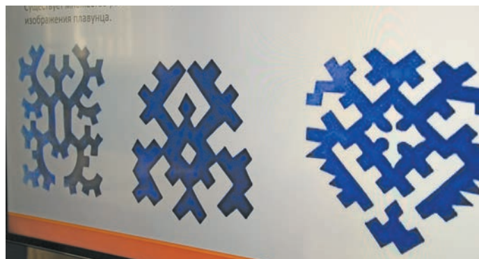
▲ Хумлэх ханши хурас. В. Енов верум хурат

сыр-сыр киникайт каншас, арсыр тэрма керлэты щират уша павтас. Эхат велщит тамаш наука щирн маны непек верас.