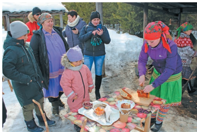
Мойң ёх епләң каврум нянь версәт па десәт