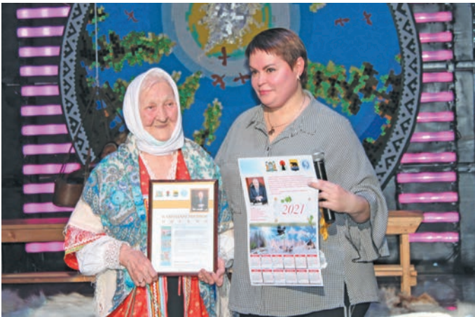
Ольга Ефимовна мойлупсыйн катлуптӑсы