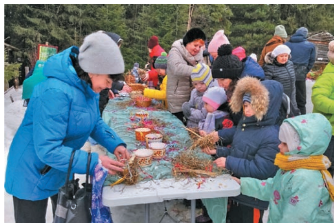
«Ёмвош ёх» немпи арЌ-якЌ неЌиет. Л.Гурьева верум хурЌЌн