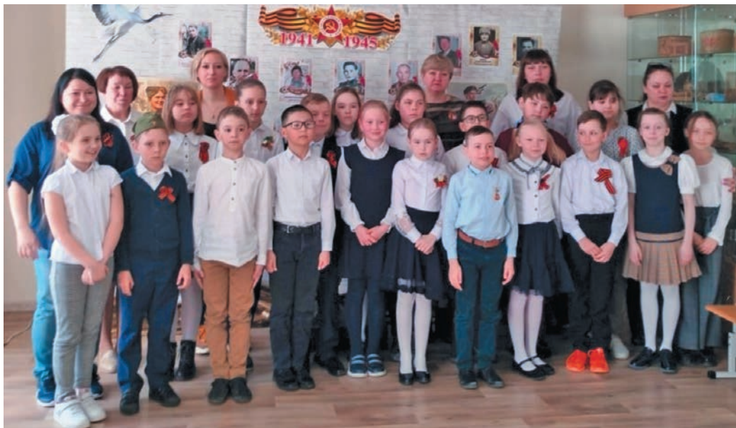
▲ Лүнтупсыя юхтум Ёмвошәң нявремәт

2023-мит оло Ас нопатты тылдьыт 13-мит хатлэн Ёмвошн ай нявремәт увас мир культура, рэт ясҕата вәндтәты «Лыдәң союм» (интәм ДЭКОЦ тәхия альщәлы) тәхийн «Нәмлэв» немуп лүнтупсы вәс.