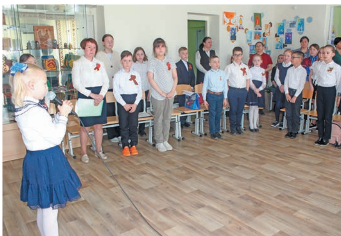
▲ Пушхәт «Торәт» немпи ар аридәт

Тәта әктәшум Ёмвошәң әшколайтн вәндтәйлдты 7 ол вүш эвәлт па 15 ол вәнты 29 няврем дала янхум, дала хәрн ухдал пунум па дала пәта тарма рәпитум вән опрашдал олаңән айкел тәсәт, лүңтарәт лүңәтсәт па дала арәт мойң мир ешалт вәндтәсәт.