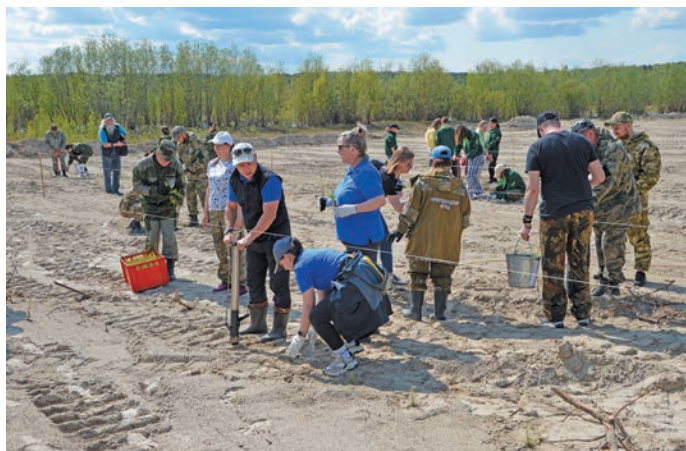
^ Юхтум ёх рәпитләт

Ёмвош районән Ас нопәтты тыләщ 25-мит хәтлән кашәң ол верты «Сад памяти» немпи акция вәс. Тәмәщ вер мўв илпи таш вўты па мўвәт-автәт давалды верәт тәты департамент ёх ләщәтсәт. Лывела лесной хозяйства Федеральной агентства па «Министерство природных ресурсов» тәхеңән ёх нәтсәт.