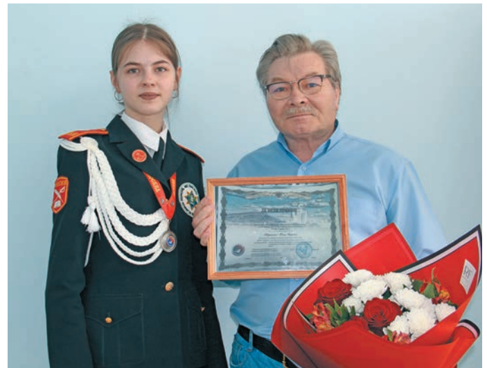
Всероссийской научной конференцияйн нух питум эви Ю. Дворяшина ханты моньщăт ханшты хэ В.Е. Енов пила

Щи пата ханты ёх арсыр йис путрăт па моньщăт хўлăт муй войт олаңан тайлăт. Лыв нявремдал ищиты, ма щиремн, щимăщ хурамăң моньщăт хэлăнтман єнумсăт. Мўң, ашколаев хущи