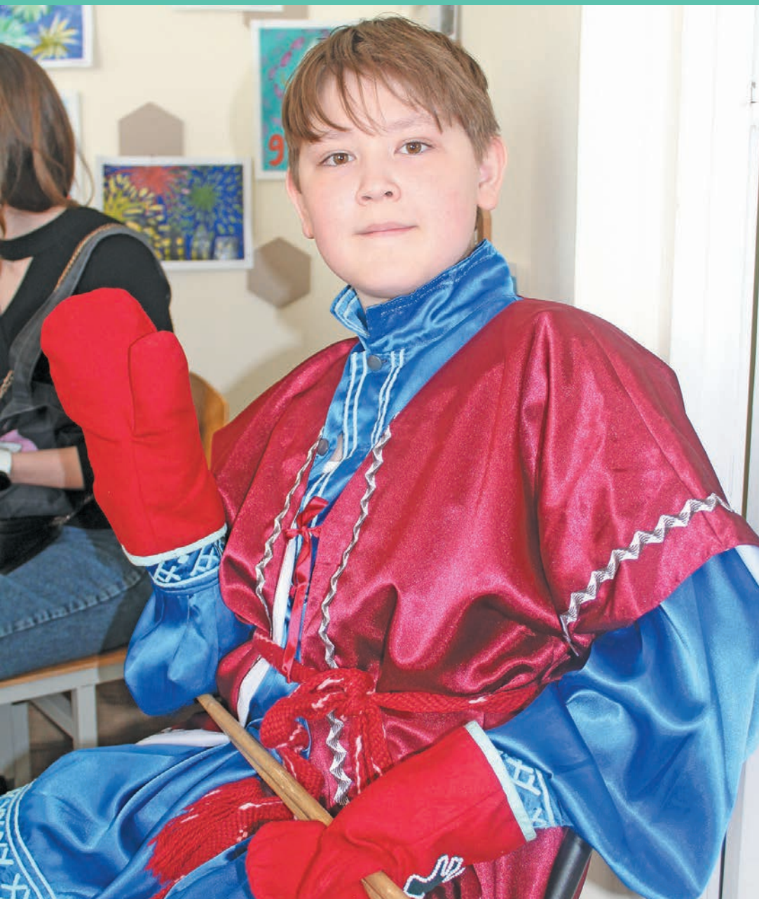
Санжар Нуркасымов «Похатур як» якәс. И. Самсонова верум хур

Мүвтөлү мир нявремәт дәвәлты хәтлү пила!