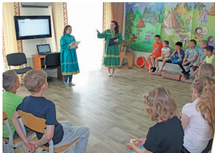
«Лыләң союм» хуши нявремат йилуп верат уша паватлät. Н. Рагимова верум хур

» Мўң олаң пўш щи прог- рамма хўват нявремат пәта рўтьщаты хәр ләщätсўв. Сыры товийн ашколаятн рўтьщаты пурайн еша ищимәщ вер тәсўв. Мўң дывты рät мўвев йис верат сәмәңа тайты вәндтәлўв. Кашәң хәтл нявремат йилуп верат олаңән уша паватты питлät. В.С. Меров