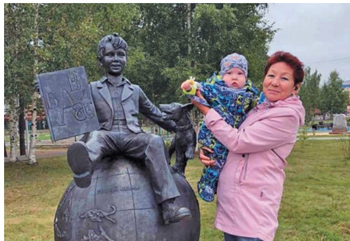
▲ Е.Г. Тарлина Кирилл хилэд пилд