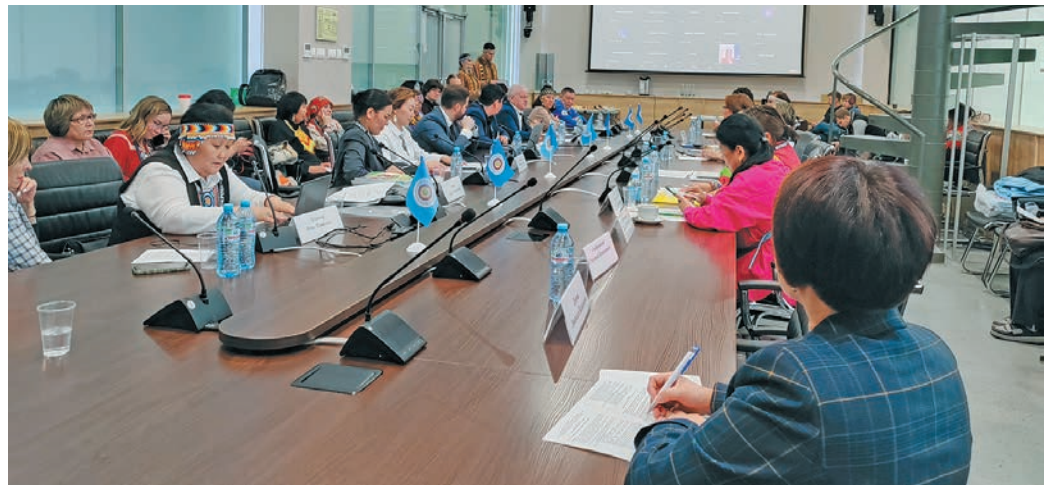
Мирхот пурайн. Н. Вах верум хур

Тәм товийн Москва хон вошн «Сокровища Севера. Мастера и художники России - 2023» вән ёмәңхәтл пурайн немасыя мирхот верәнтсы. Щәта шуши мир нявремәт әшколайн вәндтәты непека́т олған путәртсы. Тәм мирхот Увәс мўв, Сибирь па Дальний Восток Ассоциация хуятәт па Россия мўвн вәлты мирәт рәт ясәт әхтыйн кәпәртты федеральной институт ёх ләщәтыйлсәт.