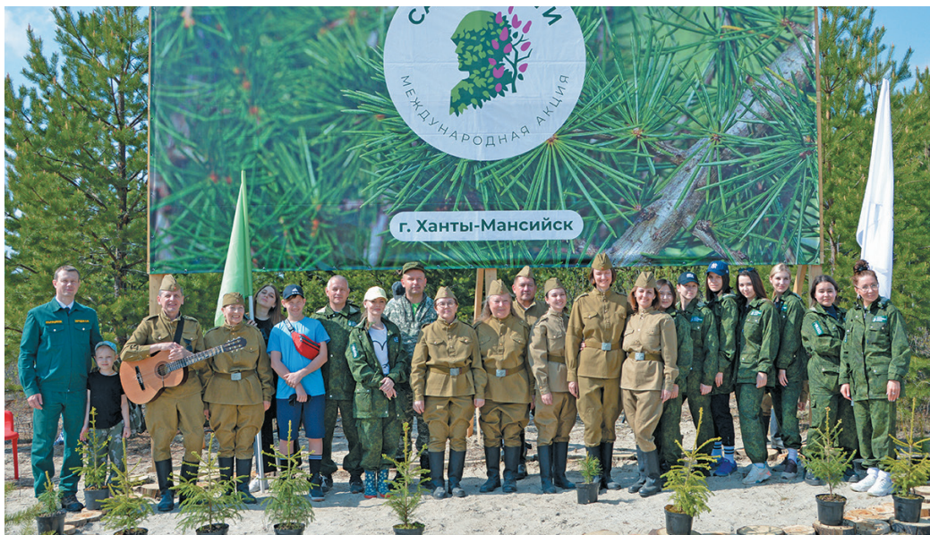
^ Ариты ёх. П. Молданов верум хурәт

Па лупты мосл, лўң тәрумн сыр-сыр тўтәт сорум вәнт мўвәтн сора вўщемәләт, вәнтлўв давалды пәта Ас нопәтты тыләщ 25-мит хәтл вўш эвәлт Югра мўвев хуца вәлды вошәң мира вәнта яңхты иса ән рәхл.