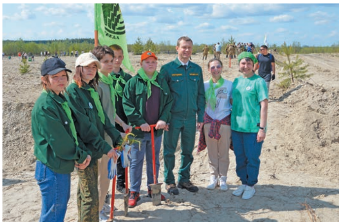
^ Юх омсәлтәты ёх