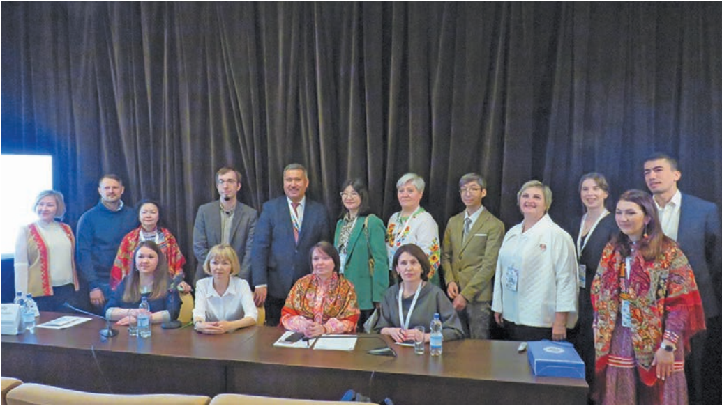
▲ Ёнта пәсанән рәпитум ёх.

Щимәщ нем тайс ёнта пәсан, мәта ут Россия мўвтел, мир кўтәлн ләхсәңа вәлты IV-мит мирхот пурайн вәс. Тәм мирхот хәнты мир айлат учёной не И. Молданова па «Ассамблея народов России» тәхи кәща дәңкәр хә Н. Абдуганиев кәтңән тәсңән.