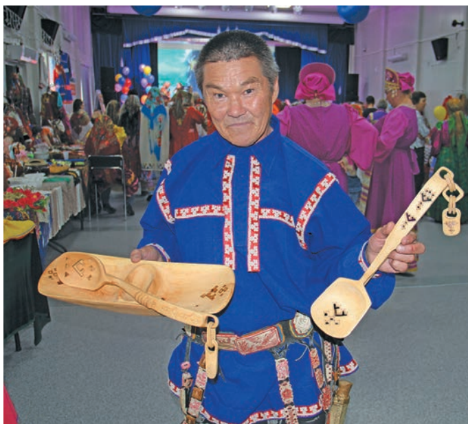
Verāнтты хē В.К. Пырысев хўв анāl па дывдал пидā. В. Енов верум хур

Ащел ики ясāт юпийн Владислав еша юлн рўтыщās, щālта увās мўв пелка рēпата кāншты ши мāнās.