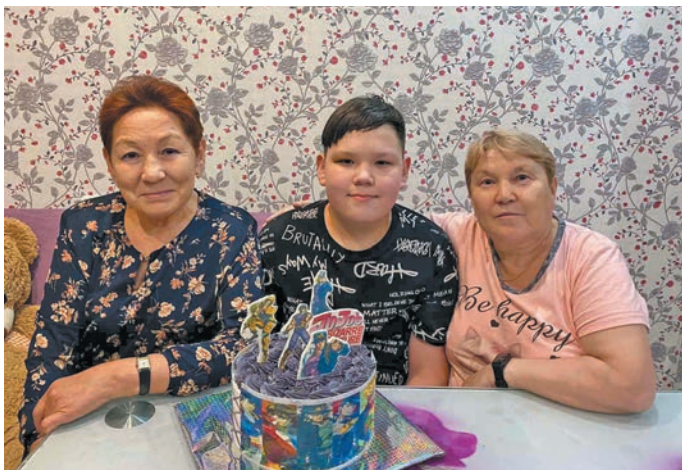
▲ Екатерина Герасимовна Вова хилэд па Лилия Илларионовна Букаринова пилд