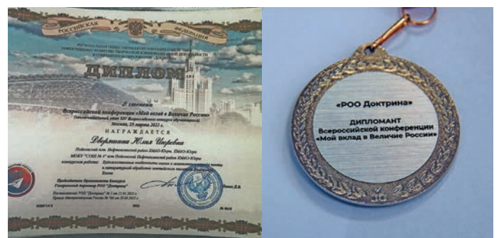
«Диплом II степени» непек па «Мой вклад в Величие России» немуп мевл пос