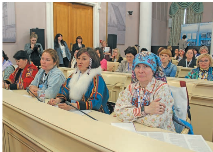
Мирхот пурайн. Л. Гурьева верум хурңан

Тәм тәхийн неңәт путәртсәт, муй щирн лыв мұвела мойң ёх тәтылты верат ләщәтман вәлләт. Щи тумпи нұшайт олаңан лупсәт – щив мұвәт хұвн