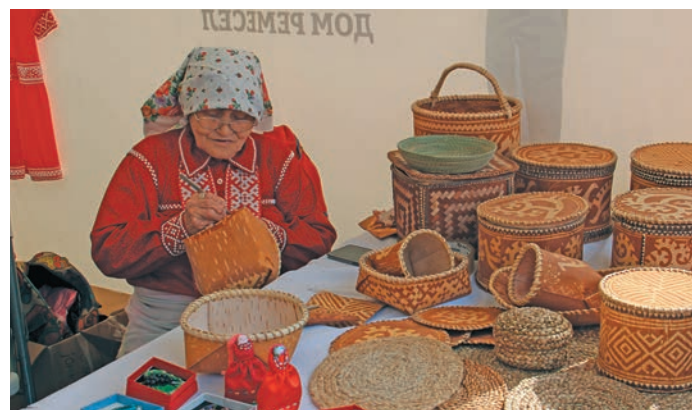
Йиңдәт тәса верты хәнты ими пурмәсәң ванлдупсы пурайн

Тәп етна пелка «Нөрүм мўв дыл» вән ёмәңхәтләт, пўншысы. Кәщайт иса щимәщ верәт оләңән әл хәннехуятәтәт путәртсәт, муй щирн дыв сырыя рәпитсәт па муй хурасуп ванлдупсәт ямсыева ләщәтты веритсәт. Әхәт дыв якты-ариты хәр мойң хәйт-неңәт елпийн ләщәтсәт. Шеңк әмәщ вәс уша павәтты, муй щирн шуши мирәт культура хот хуща рәпитты айлат хәннехуятәт хәнты, юрн, сәран, рўщ ясңәтн хурасәңа ариләт па ар щирн тәса якләт.