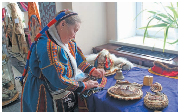
Юрн ими пурмәсәң ванлдупсы верл

Оләң хәтәдн мўвтел мир шуши хәннехуятәт ийха юхәтсәт па кәсупсәт арталәты кәщайт вантсәт, муй щирн дыв якты-ариты тәм күтн питләт.