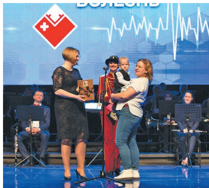
» Мирхот пурайн. admsurgut.ru сайт эвәлт вўюм хур

Мосл лупты, щит вән мирхота хәнты ма́шәт эвәлт яма́лдум ёх иши