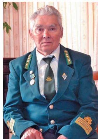
▲ Д.И. Юхлымов сема питум хәтләдн

муп тәхия китсы, хута стратегической ширәтн тәйтә ракетной войска хуца питәс. Щәта арсыр йилуп космонавтика верәт кашаң пўш вантәс па уша верәс. Армияйн вәлум ширәт оләңән Дмитрий Иванович тәп йәм нумсәт па хурамәңа путрәт тәйл. Лүв ясәдл хуваһн уша версүв, хуты тәп армияев унтасн кашаң хә няврем нумсәд па елды вәлты-холты вәлупсы ширд такмад па ушаңа-сащәңа керләл.