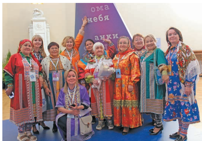
» Югра мұв эвәлт мирхота юхтум неңәт

Әхәт лўв В.И. Матвиенкоя «Нух питум хәтл» ар Увас шуши мир ясәтн»