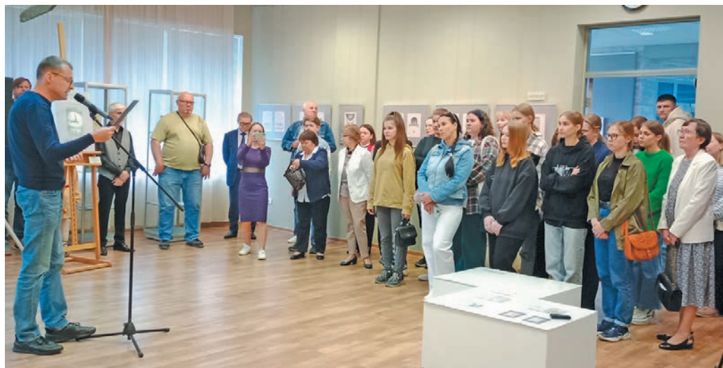
△ Вандтупсыя юхтум ёх. Л. Гурьева верум хурат