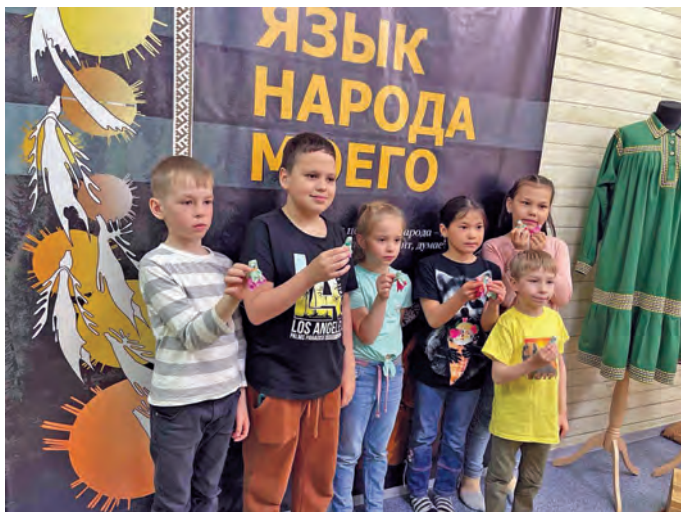
Нявремәт акань версәт