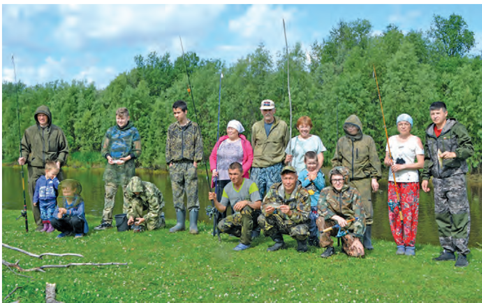
Хул нйшты кәсупсыя юхтылум хуятәт