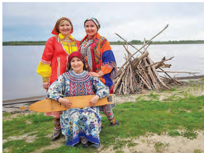
▲ Пиднеңдал пила