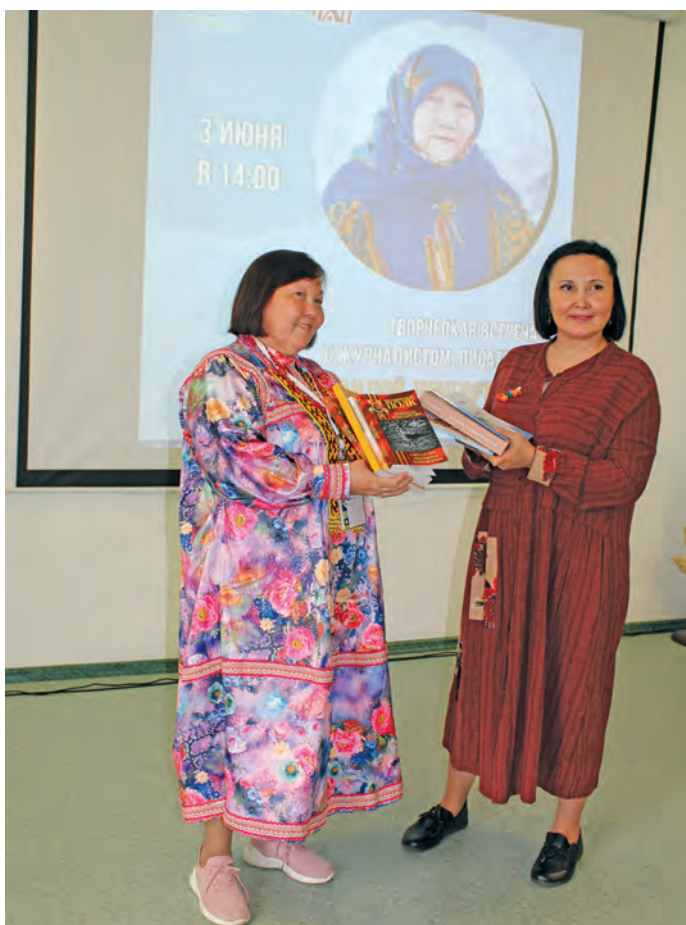
▲ З.В. Лонгортова киникайдал мойлҢлдлҢ

Мосл, лупты, хуты тҢм киника есҢлды пҢта округ