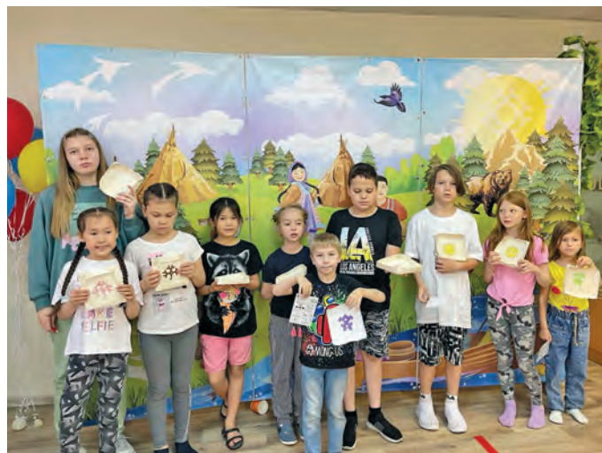
Верум пурмәсдәл пида