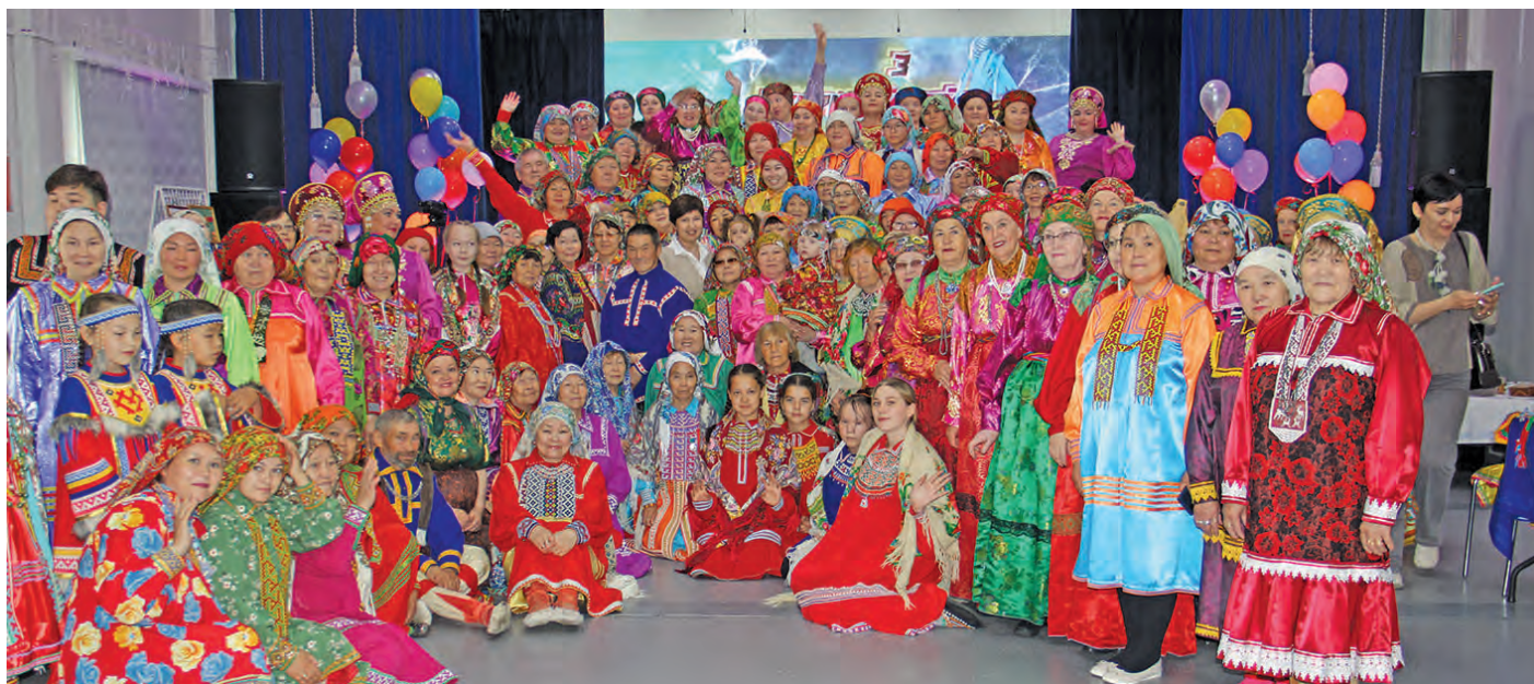
Арсыр тэхет эвэлт ёмәңхәтлә актәшум хәннехуятәт

Тәта мосванән лыпәт тыләщ 25-мит хәтл вүш эвәлт па иса 26-мит хәтл вүш вәнта Муши вошн Дорвош районән Ямал мўвн «Ма Дорвош район мирем» хәлмит ёмәңхәтл вәс. Ши пурайн Пулңавәт, Дәпәтнәңк, Ёмвош, Тек кәрт, Коми мўв па район арсыр вошәтн па кәртәтн вәлты хәнтәт па сәранәт ийха юхтыйлсәт па ёмәңхәтләл ймсыева пориләсәт.