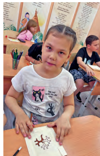
«Лыдәң союм» тәхия йңхты эвие

рүтьщәты хәрн нявремәт Россия мүйев йис верәт олдәңн иши путәртсәт, муй арат арсыр мир тәта вәл, муйсәр ар хурасуп вәлупсы па йис вер дыв тәйлдәт.