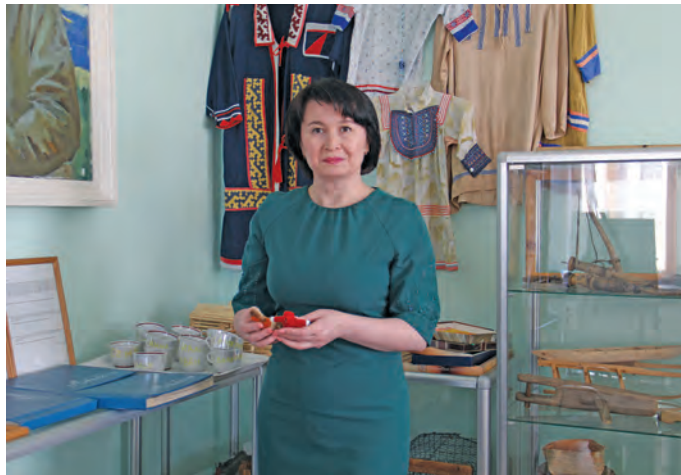
▲ Г.Х. Курманалиева. В. Енов верум хур.

Муйсәр әмәщ верәт пилә нәң йилуп рәпатаенән хуща вәйтантсән?