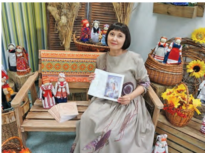
▲ ОлҤнмит киникайл пила