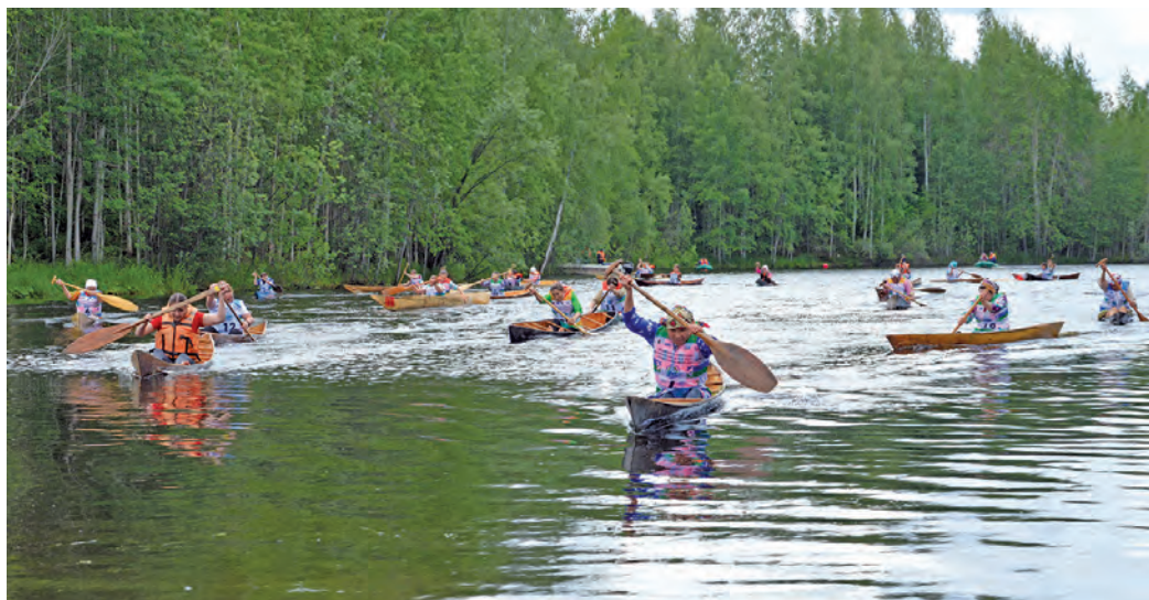
Ай хопатн кәсупсы.