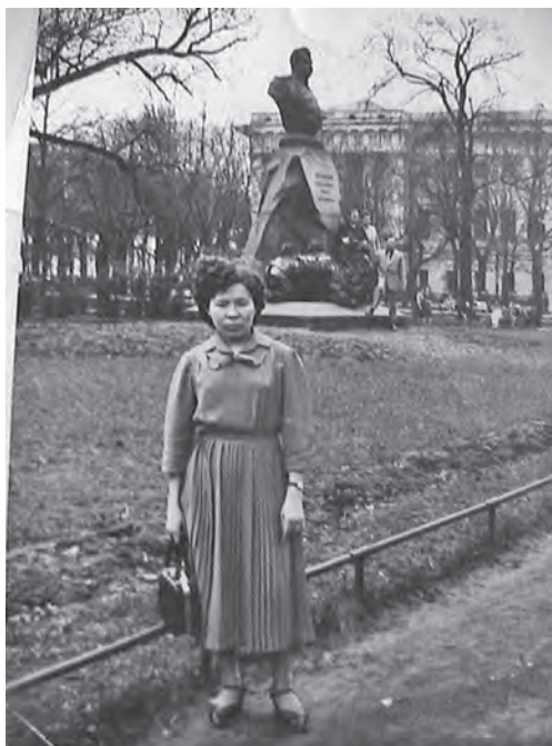
▲ Ленинград вошн вәндтылдмал пурайн

Ар ол мәр Евдокия Александровна Сўмәтвош район Саранпауль кәртән няврөмәт вәндтуман вәс. Аләң саты ашколая мәнл па тәп пәтлам мәрн юхи керләл. Вантә, уроклад етшәләт, лўв па мәшәң няврөм хуца, мосәң, атма пушхәт енмәлты хоттел ех хуца путәртты щира