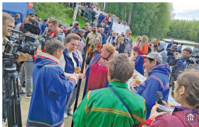
Әмәңхәтла юхтум мойң ех

» Вўща вәдаты, тынәң ех! Шуши мирәт йис щирн, нын мулты ям вер версәты, порессәты па щи юпийн ёрта йил, щит мет ям. Щирн тәмхәтл нын ёртәң хәтлән кәсләты, щит ищи ям. Мўң шуши мирәт йис вәлупсы лавәллүв. Ветхушьяң муй хәс ол юхлы щимәщ кәсупсийн тәта тәп хәт ай хоп вәс, тәмхәтл – 60