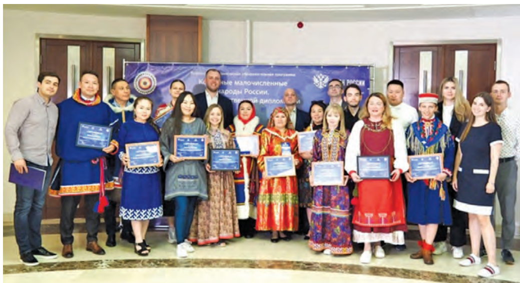
Вәндтәты хәра юхтум хуятәт

«Оса дипломатия верәтә вәндтәты ашкола» хәлум щирн ләщәтман вәл. Оләңмит вәндтәты хәр интернет хўват онлайн щирн верман вәс – тәта иньчәсты верәт,