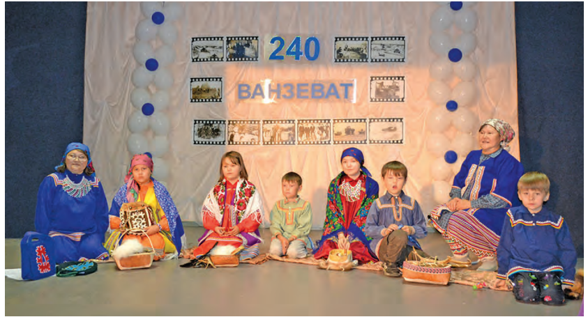
▲ «Хӑрсурт ӗх» ариты-якты тӑхи