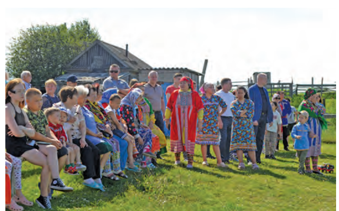
▲ Кӑртӑң мир ӗмӑңхӑтла юхӑтсӑт. Н. Вах верум хурӑт

Щӑлта кӑртӑң мир ешалт ариты-якты хуятӑт тӑс арӑт па якӑт ванлтӑсӑт. Кӑртӑң поэт хӑ Владислав Молданов Ваньщавӑт кӑрт па щӑта вӑлды хӑннехуятӑт олӑңн хӑншум стихдал лӑңтӑс. Касум па Нуви сӑңхум вош эвӑлт юхтум мойң ӗх ищи яксӑт па