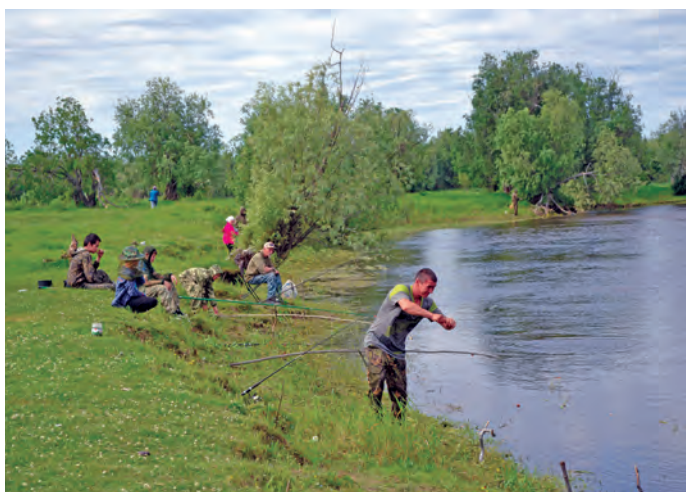
Ай пуслән хул велпәсләдәт