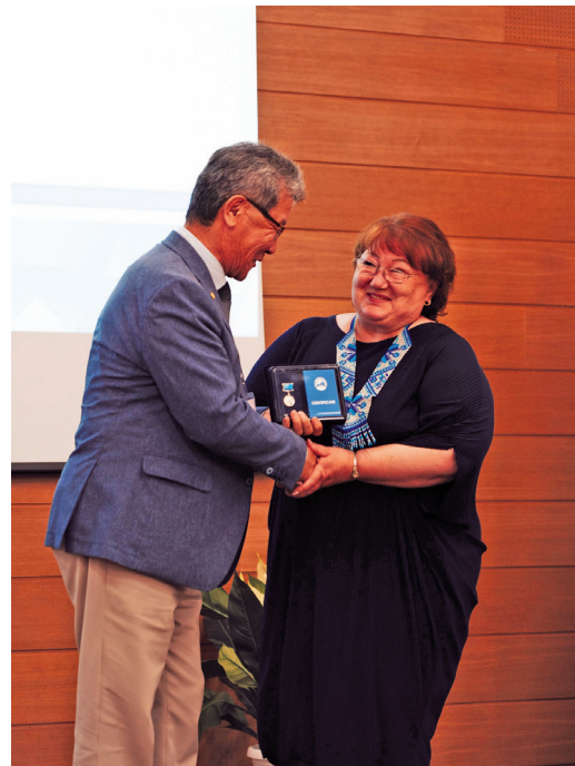
Л.А. Алфёрова мевд пос еша павтәс. ВКонтакте эвәлт вўюм хурҗән

ния ширн тәдәт. Ищиты дыв хәләнтсәт сыры олаңн Северной Форум әхтыйн рәпитты кәщә ех, муй ширн дыв рәпитсәт па мәта верәт мосты ширн тўңматсәт. Щәдта 2023-2025-мит олаңа хәншум рәпата верәт пәта еш нух алумсәт.