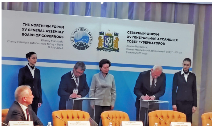
^ Кәща хуятңән ёш пос пунсәңән

вер нух адумты, дәлн мойңа юхтыылды хуятәт шуши мирәт летутәт уша ат версәт. Кашәң увәс мўвн вәлды шуши мирәт культура па йис верәт тәса вандтәты пәта мойң хәннехуятәт ищи юхтыылды питләт. Иса туризм вер нух адумты пәта мосл хәннехуятәт щи вера тўңщирәңа вәндтәты, дәлн дыв щит әхтйин мосты щирн ат рәпитсәт.