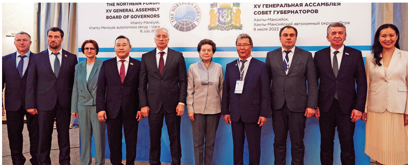
^ XV-мит Генеральной ассамблея вэн мирхотн. northernforum.org тәхи эвәлт вүйом хур