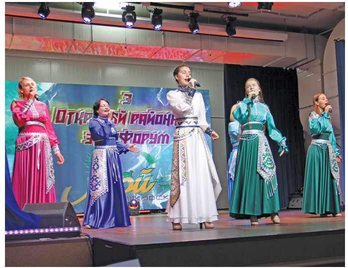
Ёмәңхәтл пўншум кўтн рўщ эвет ариләт. В. Енов верум хурңән

гарита Константиновна ищиты пурайн тәс ар хәнштыя веритл. Ащеләңкел оләңән лўв тәмәщ ар па сәмәңа вермәл: