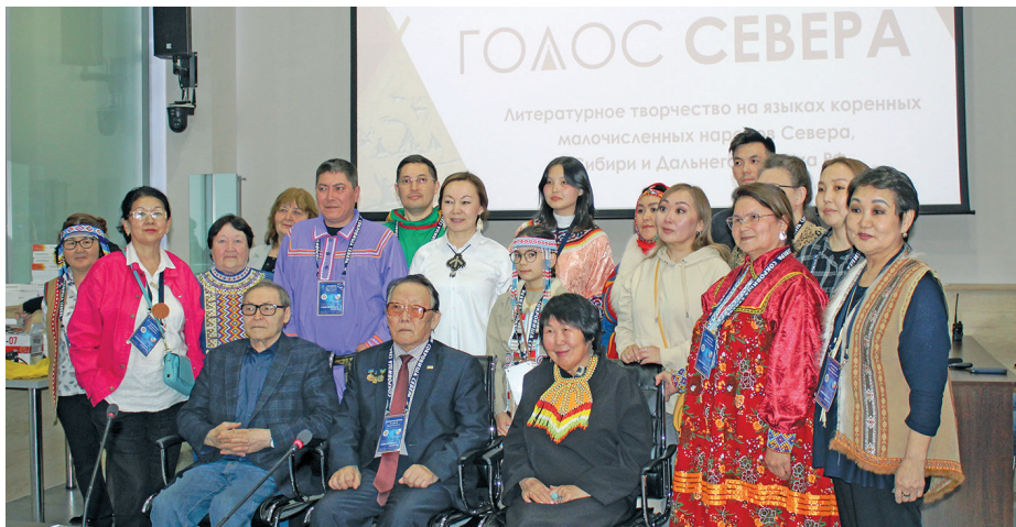
▲ Вäйтантупсы пурайн.