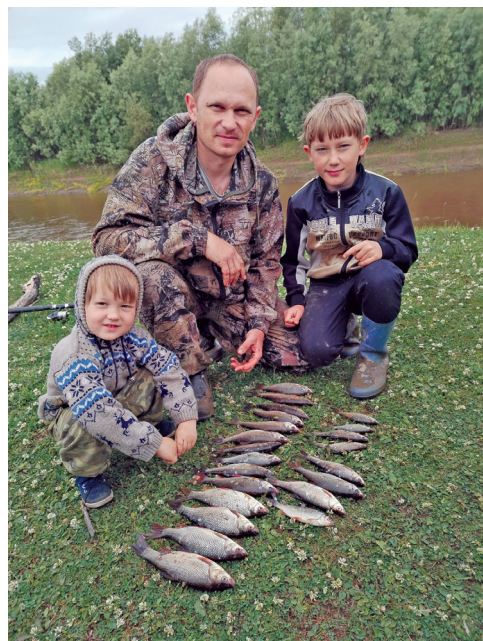
^ Хўд няшты кӑсупсыя юхтум хуятӑт