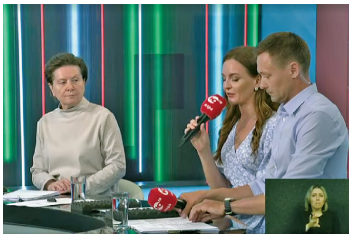
Н.В. Комарова хоттел, ёх пида путэртис

Югра мўвев няврем сема питты щирн иса Россия мўв луваттейн хэтмит тэхийн вэл. Ёмвош округевн кўтуп хэннехэ вэлупсы – 75,4 тэди, Россия мўвн – 72,7 тэди вэл. Ар нявремэң хоттел, ёх кашэң ол 10 % аршэка иил.