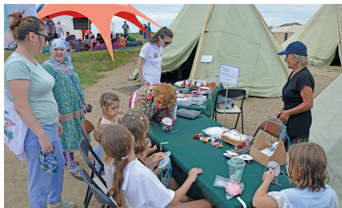
» Пушхӑт акань верлӑт

пӑта мосл непека иса утӑт хӑнши. Ат ӗхн вӑлы, муй вӑрн ийсн довӑлдсӑв, пушкан ӗсӑлдсӑв, холуп омӑссӑв, холуп вантсӑв.