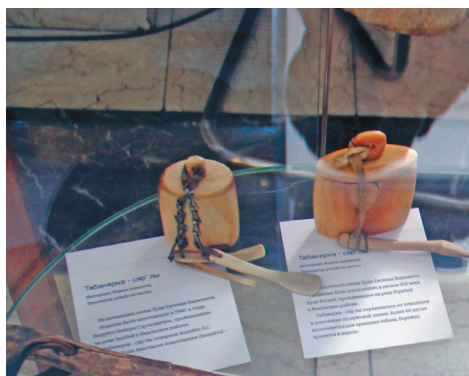
▲ Лүв верум оңатшәпңән