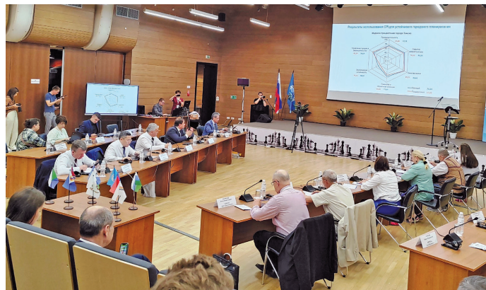
^ Ёнта пәсан пурайн