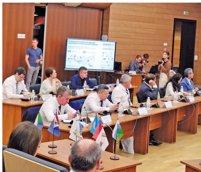
Ёнта пәсанән рәпитләт. Н.Вах верум хурәт

Югра мұв «Русское географическое общество» оса тәхи ех па «Ассоциация по содействию развитию северных