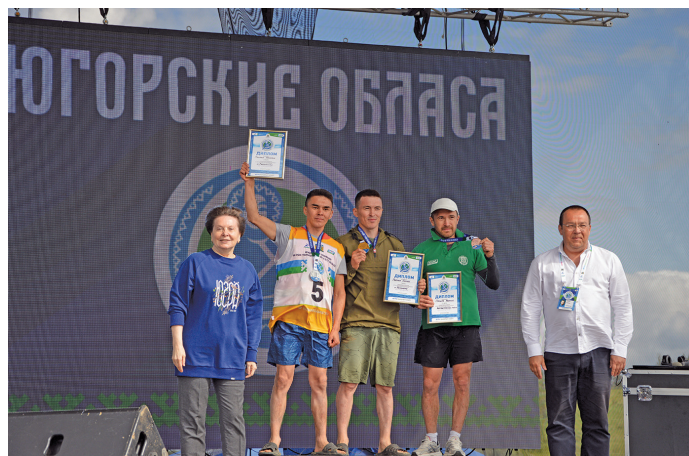
Нух питум хуятәт мойдәсыйт

Ёмәңхәтл, пўншум юпийн масс-старт олңитса, щит хән иса кәсты мирев и мухты яха кәссәт, тәп имет атәлтәта па икет атәлтәта. Тәм пўш вера вотәң хәтл, вәс, вера кә-