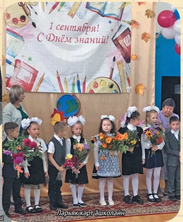
Ларьяк кәрт ашколайн