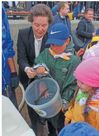
Сэх хўд нйлкăт есăлдăт

«Сэх хўд енма!» немпи вер тăм ол вэн кер тылăщ 10-мит хăтл вўш эвăлт лыпăт тылăщ 15-мит хăтл вэнта мăнăс. 134 хуят па и рэпитты тăхи тăм вер вантман тăйс. Кашăң хăннехэ тăта вантты веритăс, хутыса хўдыет енмăллăт па муй щирн лытуп эвăлт нйлак стл. Щиты тăм ёх унтасн 3145 арат ай