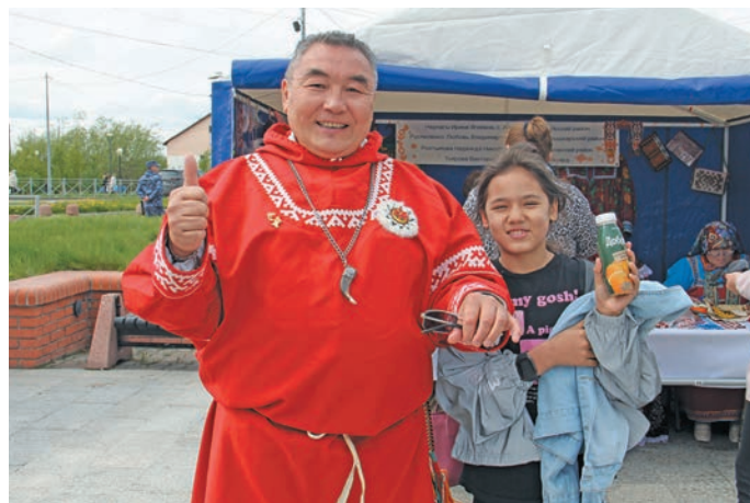
▲ Р.Х. Яндо хилнеңәл пилә Пулңавәт вошн. В. Енов верум хурңан

Роман Хасавович, муйсәр верәт пәта нәң тәм ёмәңхәтлә юхәтсән?