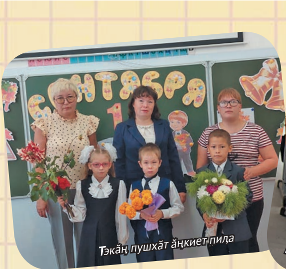
Тәкәң пушхәт әңқиетпида