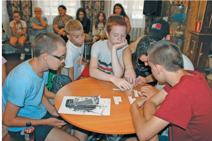
▲ Киника лүңәттү хотн

Вулаң Отечественной далъ пураин тәм хот рәпатнекәт мұң мұвев эвәлт вуракәт вошитты мәнсәт, щирн киника хотн еша пасыр рәпатайт тәты питсыйт – тәта далъ олаңан айкеләт тәсыйт, далън пәрум ех олаңан «похоронка» не-