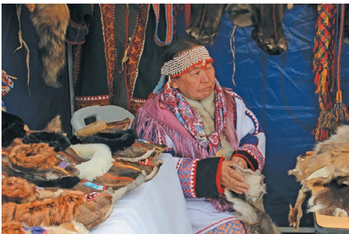
▲ Юрн ими ёмәңхәтл пурайн ләмәтсүхәң ванлупсийн