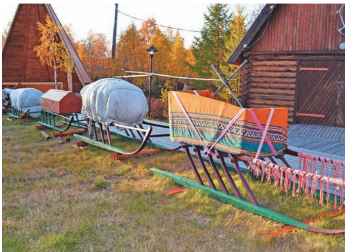
Вўдең онас. Н. Вах верум хурңан