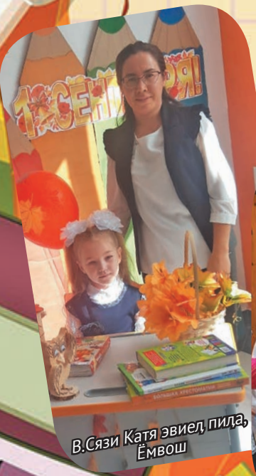
В.Сязи Катя эвиел пида, Ёмвош