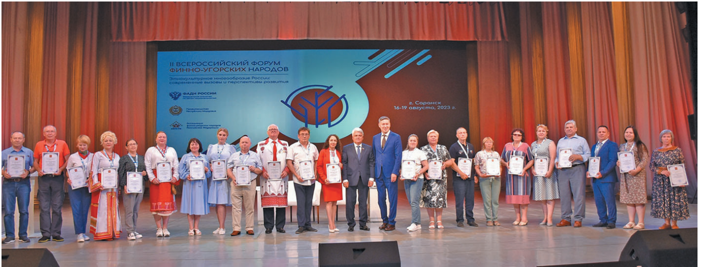
^ Мирхота юхтум хӑннехуятӑт мойдӑсийт. Т. Мерова верум хур