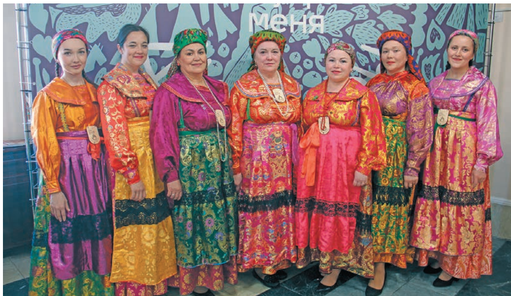
«Чилан чиламьес» якты-ариты хот неңāt

вәнты «Чилан чиламьес» якты-ариты тāхия тәп хәт не араттәлн йāңхты питās.