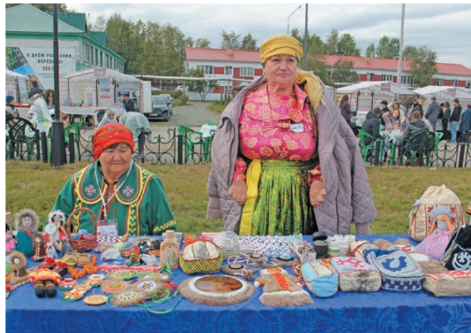
«Элалы» тәхи неңәт пурмәслад пида. В. Енов верум хур

Мет олаң хәтәлн маләң вўш эвәлт Сўматвош вош хўлы хўватн машинайт мәнсәт, мәта утәтхуцаомсумхәннехәйт тәмәщ вулаң ёмәңхәтл пәта арсыр ям вўща ясаң вошәң мўхәйта китсәт, ләлн па елды вәлты-холты щирелн ищиты тумтака па ямсыева вәсәт, вецката рәпитсәт, айлат ёх енмәлсәт па дыв ийсәңәнәптәңа ювум вошел па сәмәңа елды тәйсәл.