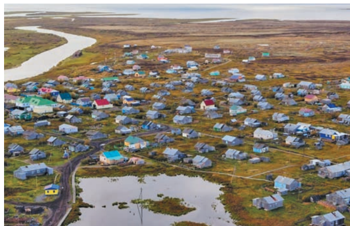
Колгуев пәхәрн Бугрино кәрт. 24minus.ru сайт эвәлт вўюм хур

мәтсүхәт ентсәңән. Ин па арсыр әмәщ пурмәсәт верты па хурамтәты вәндтәыләс. Ин сыр-сыр утәт ентты па верты хошл, арсыр ванлтупсәта, вәйтантупсәта яңхәл.