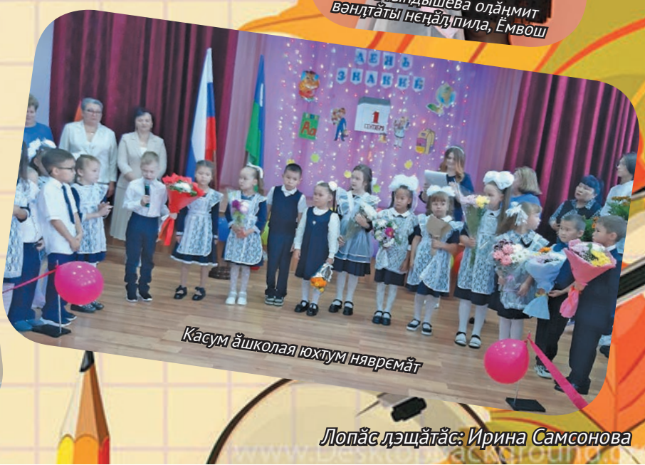
Кәсум әшколая юхтум няврәмәт