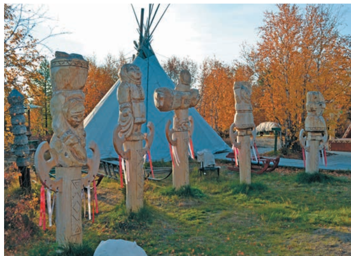
Горнокнязевск природно-этнографической тэхийн

гогической училища етшуптас. Лўв ищи юрн ясәң тәс па нявремат хурат ханшты вэнлтас. Лын манем Ямал рэт мўвем сэмәңа тайты вэнлтасән. Лын итана ма ищи нявремат вэнлтаты хуята йиты ләңхасум. Ленинград вошн хурат ханшты па декоративно-прикладной щирн учителя вэнлтыйлдсум.