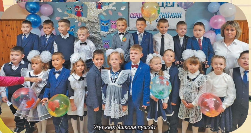
Угут кәрт ашкола пушхәт