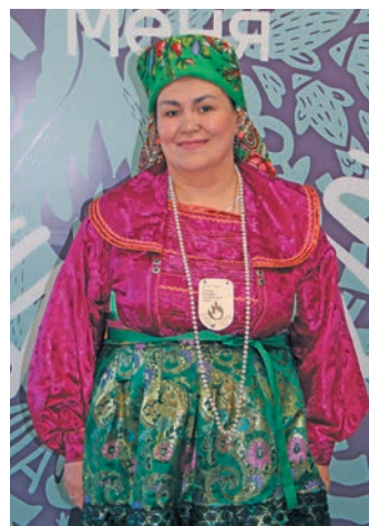
Якты-ариты хот кәщә не С. Бухарова

Щи тумпийн тāта верāнтты па ёнтāсты хāйт па неңātтәса па хурамāңа лэщātтум пурмāсāң-ләмāтсухāң ванлтупсэт кашāң пўш вәлләлāt. Россия хон пелāk хуща вэлты финно-угорской