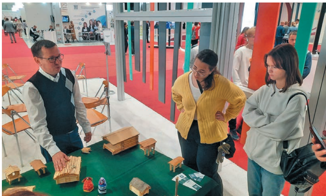
Мирхот пурайн вәндтупсәт ләщәтсыйт

Мосл лупты, хуты тәм вәйтәнтупсы 2016-мит ол вўш эвәлт ләщәттты питсы. Округ луваттйин нявремәт вәндтәты хәйт па неңәт пәта щит вера әмәщ па нумсәң мирхот. Вантә, тата әктәщум пушхәт пила рәпитты ёх күтәлн путәртләт па вәндтәләт, муйсәр йилуп щирәт вәндтәты вера ләщәттты, ләлн пушхәта мет әмәщ арсыр урокәтн ат вәс.