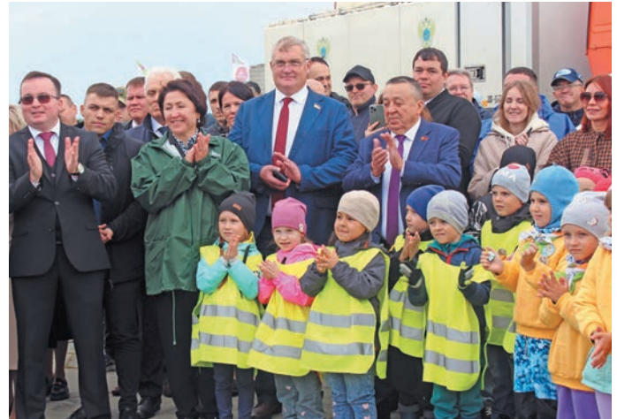
Намн актăщум ёх. И. Самсонова верум хурăт

» Юхи хăщум хэлум ол мўң немасыя сэх хўд енмăлды па лавăлды вер вантман тăйлўв. Вантэ, тăм хўд «Вўрты непека» хăншман вэл. Россия мўвтел, мир хўд