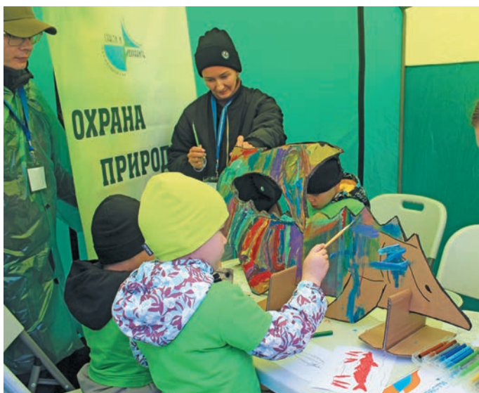
Сэх хўд йох хурас олюпн нерлăт

» Елды тăм вер яма мăнл ки, «Вўрты непек» эвăлт сэх хўд йира вўлўв, щи юпийн тăм тынăң хўд велпăслăты кăшăң хăннехэ щир тăйты питл. Щит шеңк еплăң хўдые!