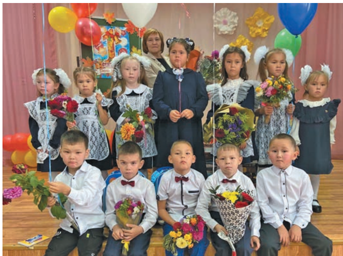
▲ Касум вошн 1-мит класса мәнты пушхиет.

Ешәк нявремәт, айдәт ёх, пушхәт вәндтәты хуятәт па әңкет-әщет! Йилуп вәндтйылды ол олңитум вер пәта вўща ясаң нынана китлум!