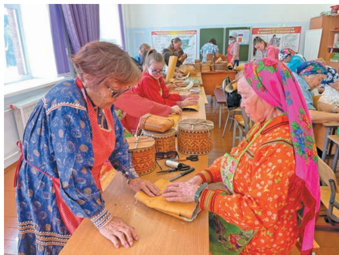
▲ Имет рәпитдәт

Йис пурайн хәнтәт па вухаль ёх тәм увәс мўевн тайты сыр-сыр утәт эвәлт мет хурамәң пурмәсәт верәнтыйлсәт. Тунты эвәлт верәнтты арсыр хушапәт, сәнәт, йиңләт кашәң хәнты мўвн, кашәң вухаль мўвн иса пўш ар хураспет. Щимәщ хурамәң ар хурасуп пурмәсәт – щит мўң тәм йис ташев. Щит пәта щи верәт әхтыйн рәпитты ёх щи йис верәт елды тәты пәта сәмләл хошидәт. И вер ям, увәс мирев тәм хурасуп хурамәң пурмәсәт хулна хотләлн шавиман тайләл, ин па йилпа енумты айлат ёха щи верәта мулды вўрн катлуптәты мосл.