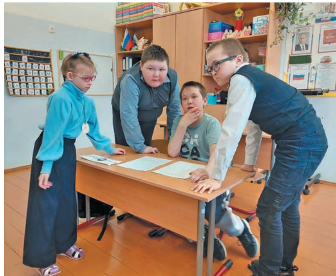
Тәк кәртәң январемәт ашколайн. Тәк ашкола сайт эвәлт вўюм хур

Щиты тәлаңтедн 2025-мит ол вәнта округ хўваттын 15 йилуп ашкола ов пуншәл: Когалым вошн – 1, Нефтеюганск – 2, Нягань – 1, Сәрханл – 1, Урай – 1, Ёмвошн – 3, Сүмәтвош мўвн – 2, Манстәр район хуца – 2, Сәрханл мўвн – 1. 2024-2026-мит олаңтн Югра мўв 12 муниципальной тәхетн 19 ашкола йилпатлы.