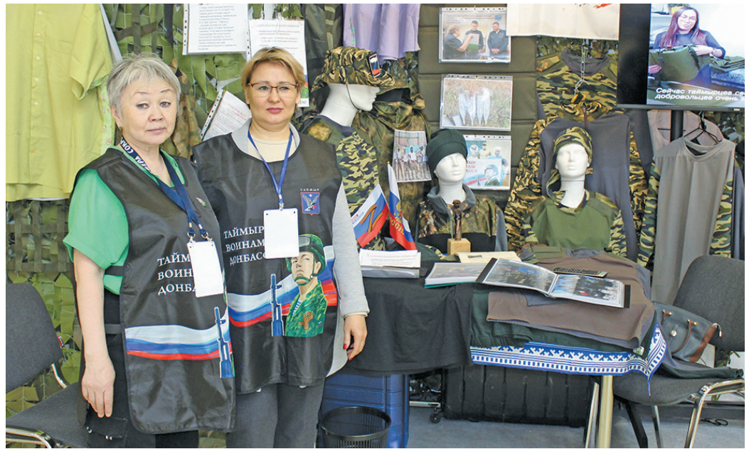
Даласты ёха нётты Таймыр мўв неңән. Н. Рагимова верум хур

Мосл лупты, щн неңәт «ёнтәсты не» вулаң непек ән тәйләт, арсыр тәхетн рәпитләт – нявремәт вәнлтәты ёх, дыв саттәла вердал тәйты неңәт, экономистәт па па ёх. Лыв иса мосты ләмәтсух ёнтты вәнлтәйлсәт, щит милләт, кофтайт, иштанәт, «защитный костюм» ләмәтсух. Ин щәта даласты ёх рәт мўвела рўтыщәты юхтылтәлн дыв хущәла юхәтләт па лупләт, па муй ёнтты мосл.