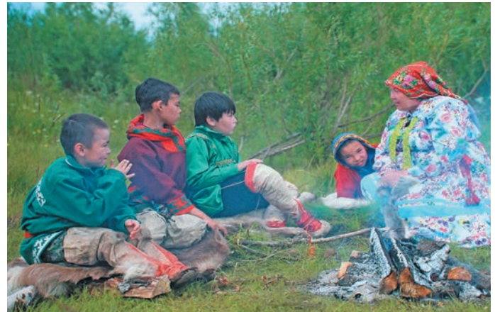
» «Ими Хилды» кинайн верум хур

» Ши пухие мўң күтэвн вәл, лўв мўңты, вән хуятәт, шоп кәншты, ям верәт верты, тәса вәлтты вәндтәл. Там кинайн ши пухие рәпата пелы сәмәңа вәл, тәп нявремат па вән хуятәт лўв пиләда атма путартсәт, ан нәтсәт. Лўв яма рәпитәс, вой-хўл велпәсләс. Ләмәтсух ан тайс, вәлупсәл давәрт