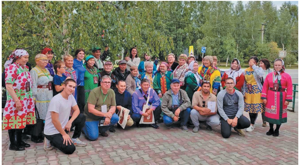
Фестиваля юхтум ӗх