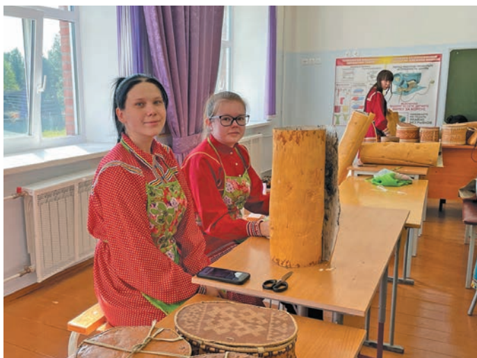
▲ Айдат эвет семинарн