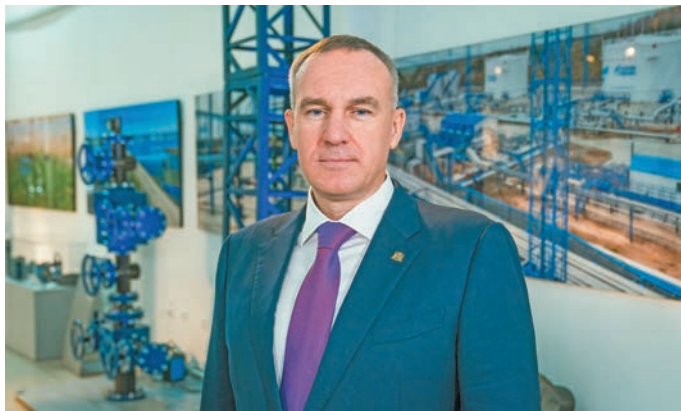
▲ Р.Н. Кухарук. admhntao.ru сайт эвәлт вўюм хур

Газ щира ки лўңәтты, Югра мўвев ши верн кимәт тәхийн вәд. Природной па попутной газ нух вўты верәт яха ки лўңәтты, тә- нял ол мўң 31,5 млрд ку-