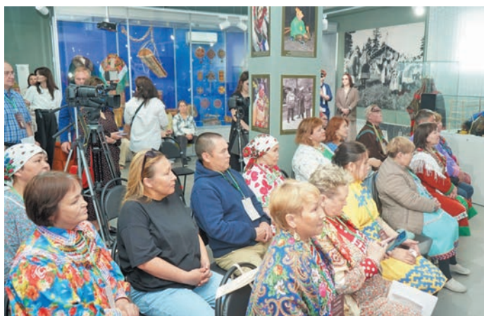
▲ Мирхот пурайн