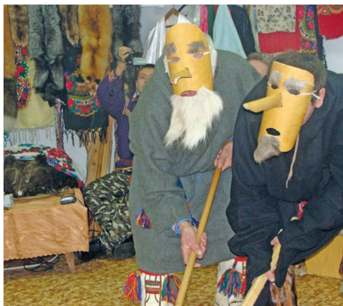
Эндрю Уигет ханшум путар ханты ясаңа тулмащтас: Пётр Молданов Т. Молданова мижом хурат

◆ Лўв ши щира верман, кашаң хуят арсыр тахи эвалт, планшет муй смартфон мухты вантты пакал.