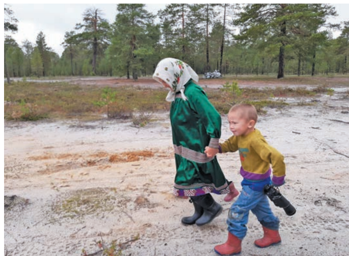
▲ Одаңмит класса мәнл