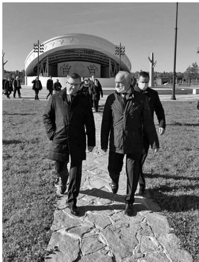
^ С.П. Маненков мойң ех пидä. www.admbel.ru эвдлт вүюм хур

» Тынаң пил ехлүв, мүң ищи щимäщ ай мүвн вәлүв, щирн яма вәлэв, хутыса лавärt ай вошät хурамäна, яма верты. Наталья Владимировна, вән пәмашипа, хути мүнэв тыв вохлätы. Мүң күтэвн вантман елды вәнлтыйлдүв. Ма щиремн, ши рүтьщаты