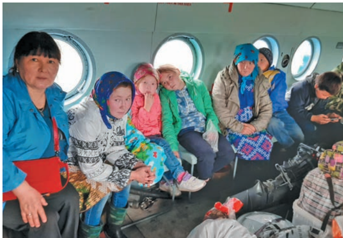
▲ Нявремәт вертолётн ашколая тәдыйт