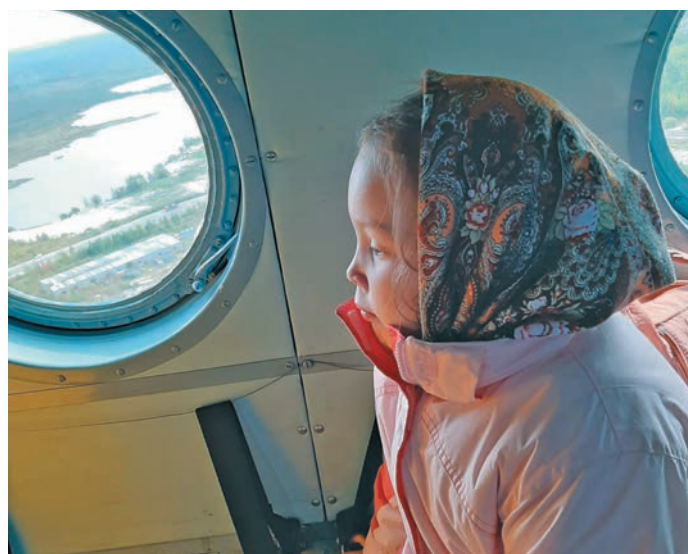
▲ Рәт кәртәд эвәлт ашколая мәнл.