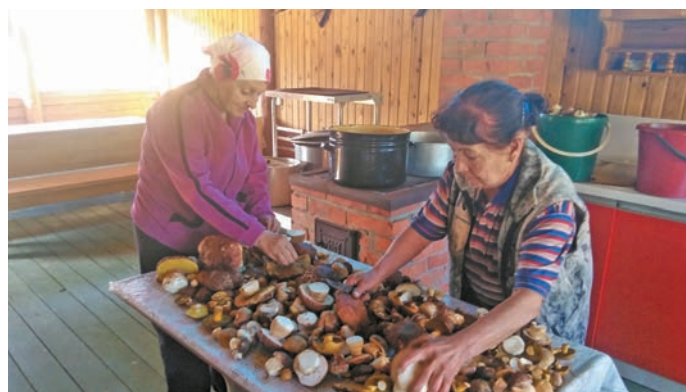
«Мулымья» община ёх тулхат лэщатлăт

Хўл верат елды тэты щира 2 миллион 434 шурăс