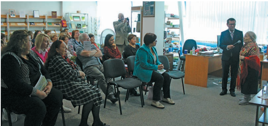
▲ М.К. Волдина икел олаңан путартал. Л. Гурьева верум хур

«...Әмәш сыйт ин ма хәдсум. Нарәсый щит амәт тәс, Щит пала хойс суваң ар. Арсув хәдман елды мәнлүм...»