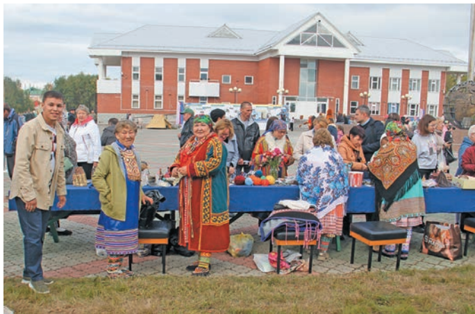
Сүмätвошaң мир 430 ола питум ёмaңхaтл, постaдaт