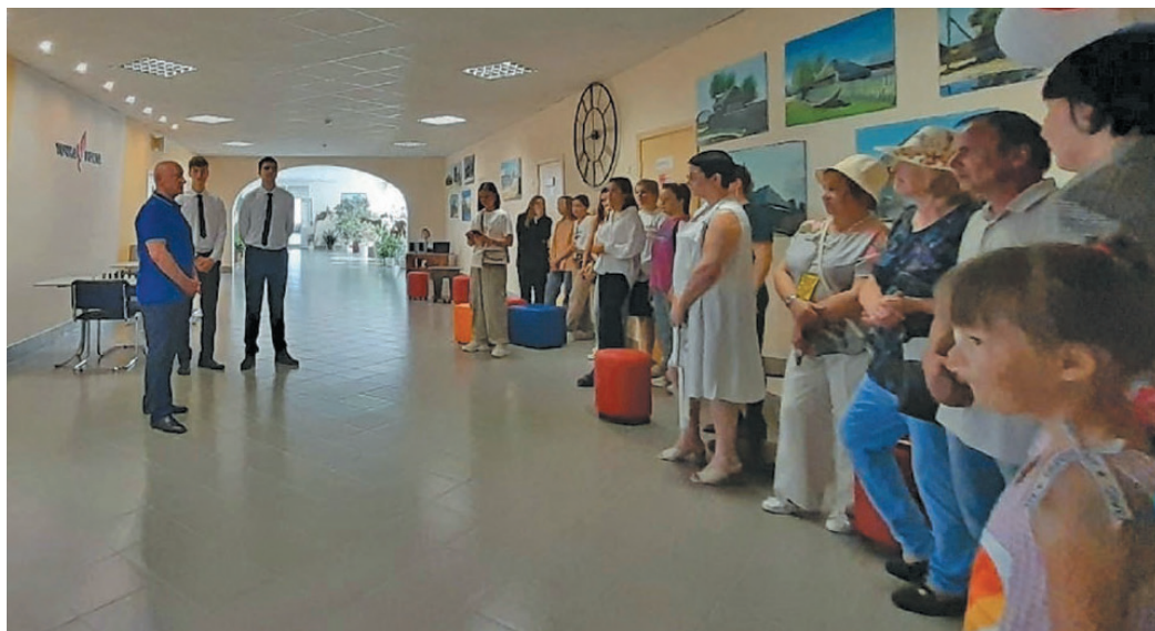
▲ Нуви сәңхум район кәща хә С.П. Маненков вўща верл

Тәм тәхийн эвет-пухәт әнтә тәп информатика, физика, биология, химия олаңән аршәк уша верты питлät, щит туппи тәм йис йилуп верәт олаңән ищи айкелät акаҗтты палўнәтты питлät, научной рәпатайт хәншты питлät па арсыр нумсаң, кәсупсәтн кәсты.