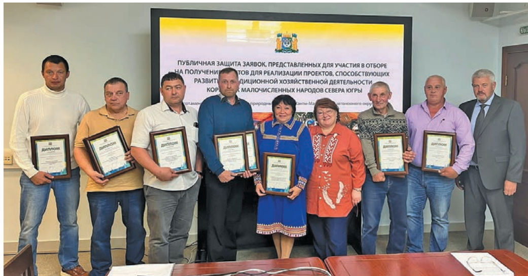
Грант нётупсы вух холумтум ёх

Хўл велпăслăты, ваньщты, сулитты, соралды па па щирн арсыр летут лэщатты щира ищиты 3 миллион 800 шурăс шойт