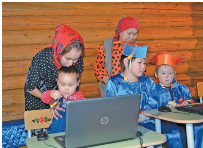
К. Кантеров вәнт кәртән нявремәт вәндтйилдәт. 2021-мит оҕ

Хәлумъяңкем оҕ юхлы юрн мир поэт, писатель, вўдең хә Юрий Вәлла (Айваседа) вўт кәртәлн пушхәт пәта ашкола пўншты нумса юхтәс. 12 оҕ лўв атәлт вўт кәртәлн ашколайл тайсәлэ. Юрн мир философ ики шеңк ләңхас, ләдн нявремлал, хилыдал хулыева вўт кәртәлн ат вәсәт, рәт ясәңән ат путәртсәт, йис верәт яма ат тайсәт, вўләт давалдсәт, увәс мир сыстам ләтут ат ләсәт. Хидеңән ая вәлмелн щиты щит вәс,