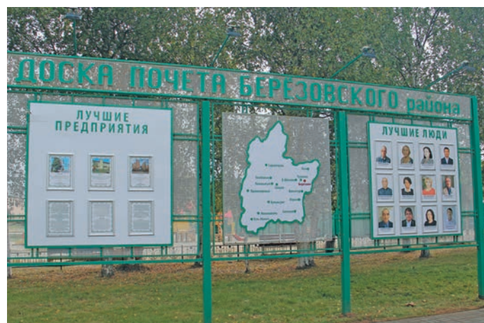
▲ Районән йма рәпитты хәннехәйт Ишәкты сохәл

мәтвош районән вән воша лўңтәсл па лўв хущеда йртъяң арсыр ай кәртәт, хута ар пеләк вухалят па сәранәт вәлдәт, щив нух хәншман тәйлдыт. Ма кашәң вер ймсыева вантман па арталуман щи оләтн тәйсум. Ма щиремн, ищипа щи тәхийн кеншәк рәпитты вәс.