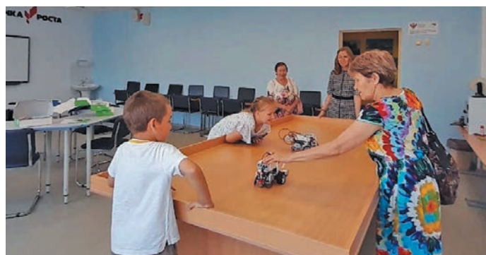
▲ Йилуп тәхийн иса ёха әмәщ

» Ин мўң лавәллүв, хән тәта урокät олңитлät, имухты юхтыйллүв, – эвет-пухәт ястәсәт.