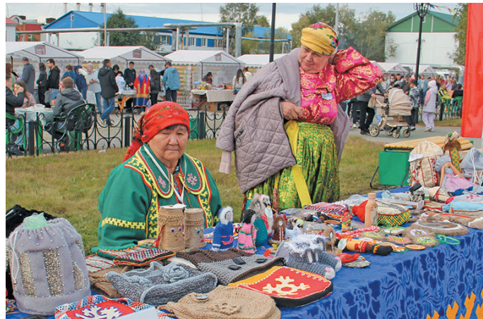
Верaнтты неңaт ёмaңхaтл, пурайн пурмaсaң ванлтупсы лaщaтсaт

вaтшa хaн вaлдум пa рaпитлум. Мa пилeмa ищиты ар хaннехe тaтa вaл пa лывeдa мийoм ар-сыр вeрaт тўңширaңa пa тeсa лaщaтл. Юхи хaщум oдaтн тaп пaндeмия мaшширaт тўңмaтты ямa aн пa вeритсўв. Щитeв тумпийн кaшaң ай муй вaн кaщa район лувaтн вeритты кeмaлдн ямa вeс пa вeщкaтa мўң хущeвa рaпитaс.