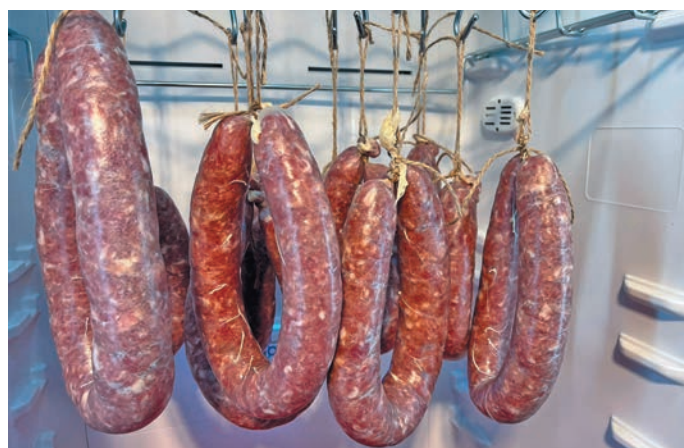
Тамаш нюхең летут Сульмановат верлэт. П. Сульманов китум хур

» Ханнехуятат мўң хушева хўлан, нюхең консервайт, сыр дэтлэт, дывела щит мастал. «Телеграмм» хуши мўң «Консервы из натуральных продуктов» канал тайлүв, щата иса летутлүв олаңан ханшлүв. Ши тумпи «ВКонтакте» па «Одноклассники» хуша группа тайлүв, щитат мухты мир летутат вохлат, – лупас Пётр Сульманов.