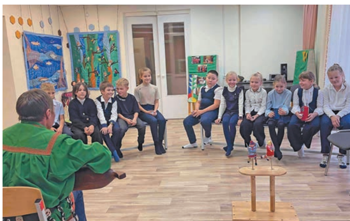
▲ В.С. Меров нявремәт пәта нарәсл

«Хутыса мет каркам па нумсәң хуята йиты? Мосл ивудап вәндтыйлдты». В. Стасов