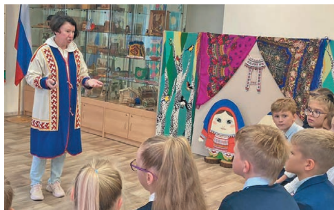
▲ И.Б. Белявская вухаль мир йис вәлупсы олаңән путәртәл

«Хутыса мет каркам па нумсәң хуята йиты? Мосл ивудап вәндтыйлдты». В. Стасов