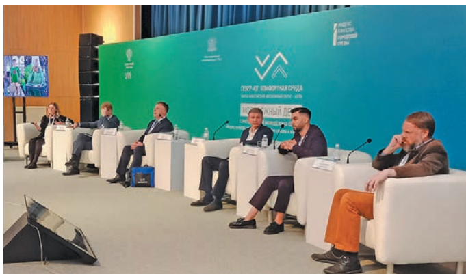
▲ Айлат архитекторат мирхот пурайн. Л. Гурьева верум хур

» Юхи хэщум олэтрн округ кашайт нётупсэт унтасн Ёмвошн йилуп микрорайонат, 50 мосты