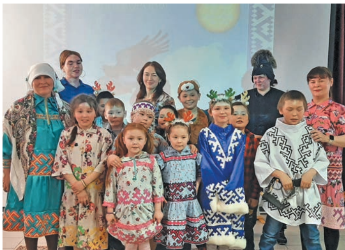
Муравленко вошн интернатн вѳлты нявремѳт вѳндтѳты неңдал пида

Наталья сѳма питмѳдн аңкел-ашѳл вўлы ташѳл пида касѳлсѳнѳн, щирн лўв Надым юхан хонѳнѳн сѳма