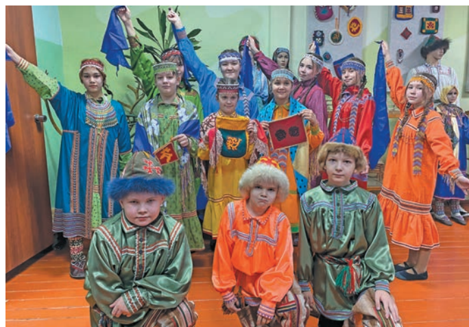
^ «Ма мўвем» якты-ариты хот нявремәт