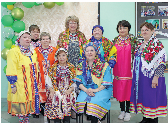
«Сорнең ёш» тэхия яңхты имет

Щимáщ сорни ёшуп ими пида Поднавáт кэртáн вáйтантайлсум.