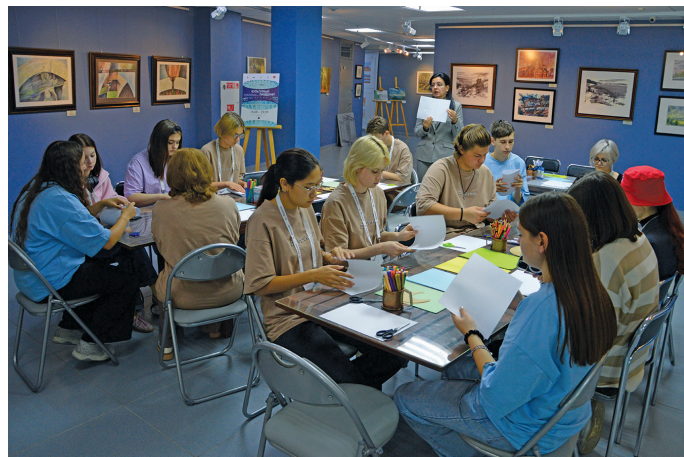
Г.С. Райшев пāта верум āшколайн айлат ёх вәндтйллāt

Па вера ар хур Райшев йис хāнты па вухаль вәлупсы олāңāн тāйл. Лўв олāңāн щиты луплā, тām