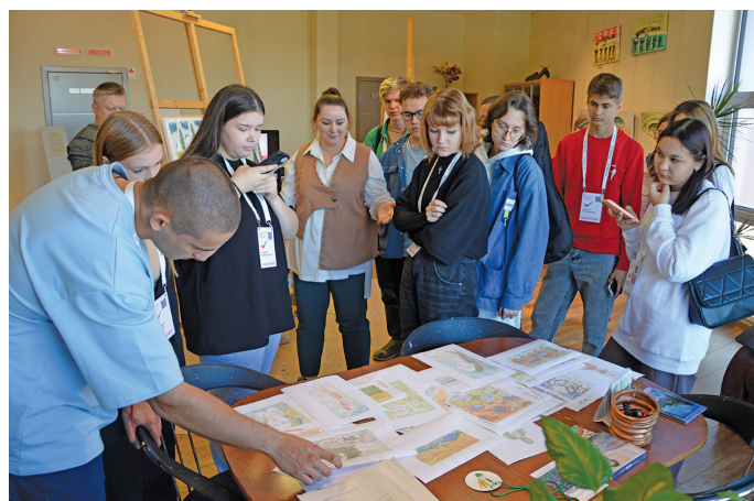
Айлат ёх хурāt ванлтāt. П. Молданов верум хурāн