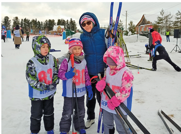
» Нявремәт пида лухәң кәсупсийн