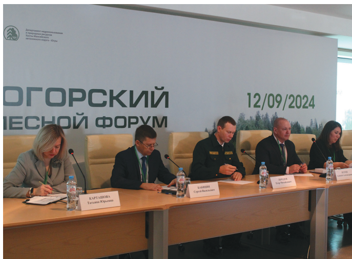
^ Вэн мирхот пурайн