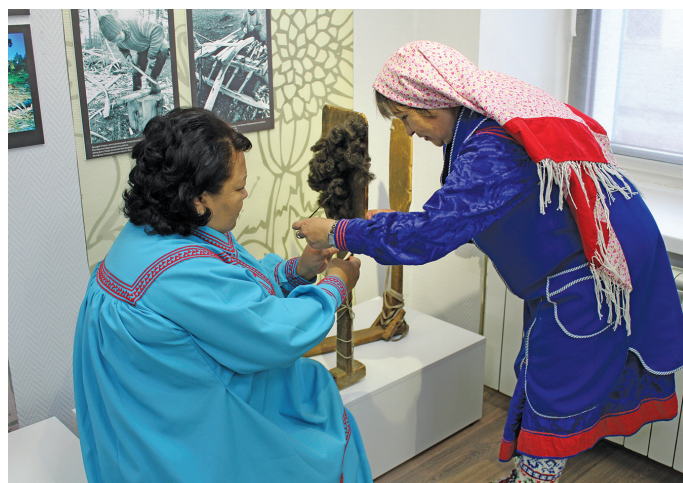
Имеңан ош пүн ларналтәләт. П. Молданов верум хурәң

Там акупсәта юхтылты ёх – щит арәл пеләк тәп мүн Югра мүвев эвәлт юхтылдум ёх, там пүш па Ямал эвәлт мойң ёх юхәтсат. «Торум Маа»