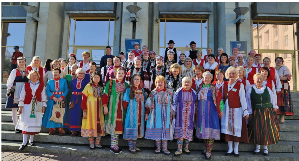
Фестиваля юхтум мир. И. Фирсова китум хурăн

Щăта мойң ёх ещăлт «Самоварочки» немпи рўщ арăт ариты тăхи ёх хурамăң арăт арисăт. Ёхăт па арсыр финно-угорской па самодийской мирăт ариты-якты тăхет ёх етнхот альсат, щит «Линнуд» («Ай тухлăң войе») водь мир нявремăң тăхи, «Армас» («Мосты ут») вепс мир ариты тăхи, «Елле» саами мир тăхи, «Лампачей» бесермян мир ариты тăхи, «Увăс хурамăт» хăнты мир якты тăхи па па тăхет ёх.