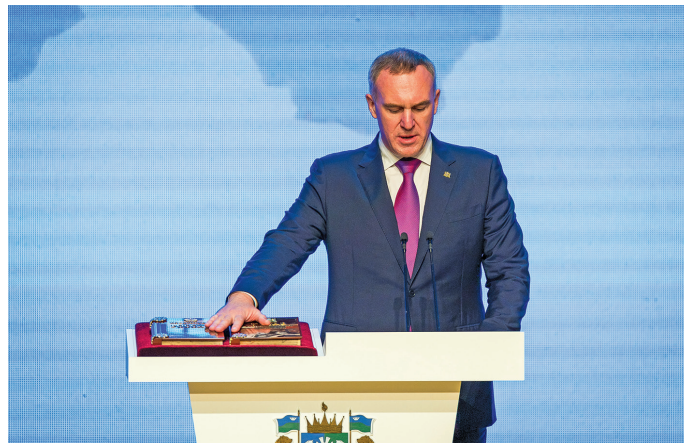
▲ Р. Н. Кухарук. admhmao.ru сайт эвāлт вўюм хур

Ям вўща ясāт округев кēщя Россия мўевн «Совет Федерации» кēща