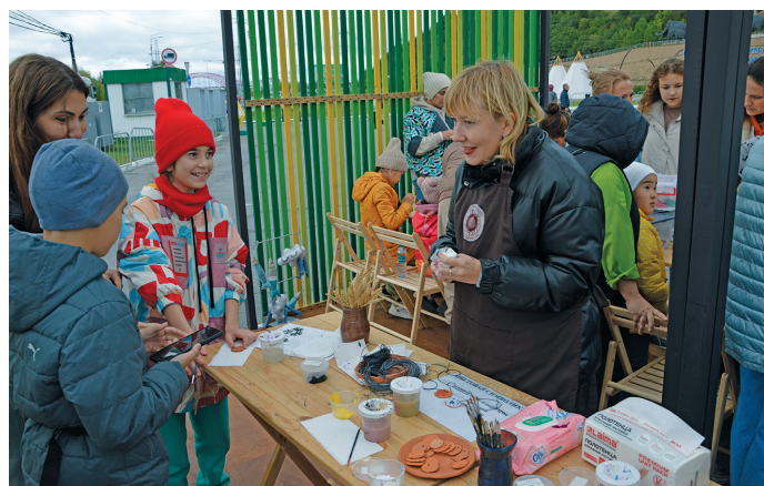
Айлат җхлӓд ӓктупсыин

тынессыйт, вера ар нюхи ӓвӓлт верум детут вӓс, җсум ийӓк ӓвӓлт верты детутӓт, вӓнт мӓвн җнумты воньшумутӓт пӓ арсыр җплӓң нянят, щит Тюменской, Курганской, Кемеровской, Московской па па арсыр областят ӓвӓлт. Тӓтӓ лӓтты пиш вӓс мавӓң детут, арсыр нюхи, мӓвн пӓ юхӓтн җнумты воньшумутӓт, арсыр хӓлдӓт пӓ щорсӓн кӓтлты ийӓк вой детутӓт, нянят, тулхӓт пӓ вӓнт воньшумутӓт, арсыр турн шайт.