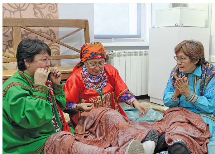
Верантты имет дон эвәлт пун верләт

музей ёх щиполаңан вәлдәт па күтәлн лыв мойңа яңхты питсат.