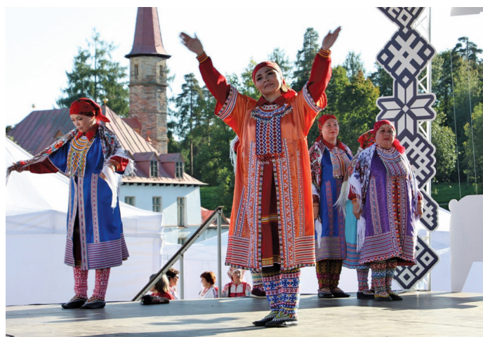
«Увăс хурамăт» неңăт якăт

Щи тумпи «Хоттел ёх. Йис верăт – щит мўң мўвев ёр» немпи финно-угорской па самодийской мирăт вэлупсы олăңан хурăң ванлупсы вэс.