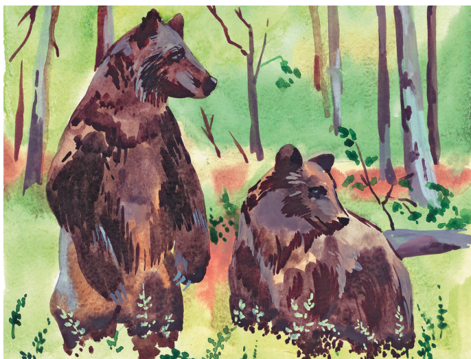
▲ Н. Жеманская хӓншум хур