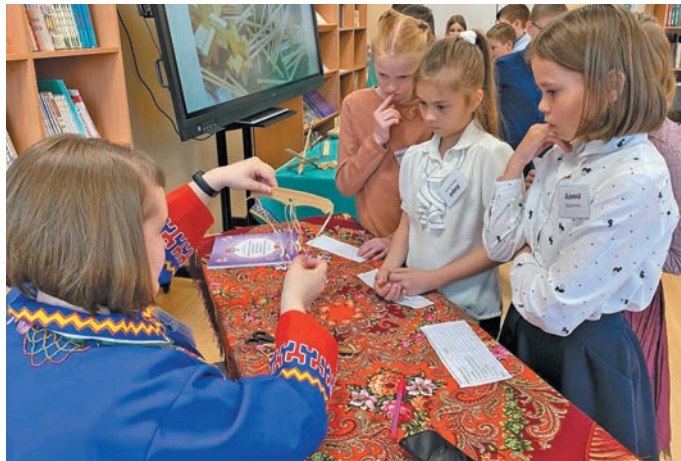
▲ Н.А. Васильева нявремәта шуши мир юнтутәт вәндтәл

Айтәлн Наталья пут кавәртты хуята йты ләңхәс. Щәлта вәндәта ювум