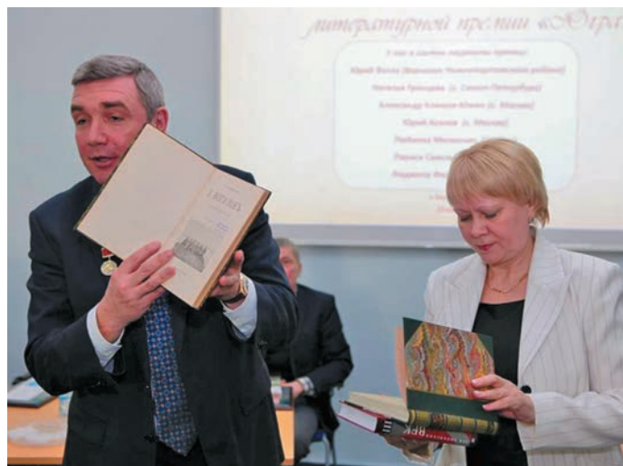
Д.А. Мизгулин киникаел олңан лулл, mizgulin.ru эвалт вўюм хур

самлўв нэхлумсайман, Щинумсемтам пураванты самем шумардаюм.