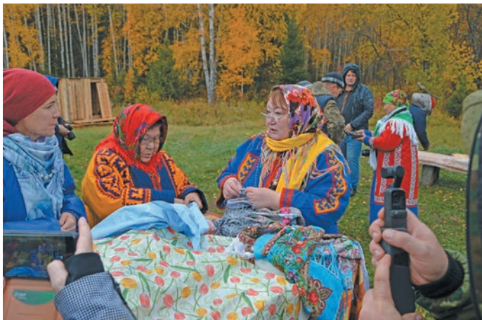
Калташ Аңкия йирты сухат