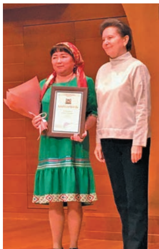
Т.Г. Казамкина кәща неңевн ишәксы

иса муй верәс, ләдн ханты, вухаль па мадыр мир ийха йис ясаң, йис вәлупсәд олаңан уша ат версәт па елды лавәлман ат тайсәт – щит хәлум мир пәта итащ!