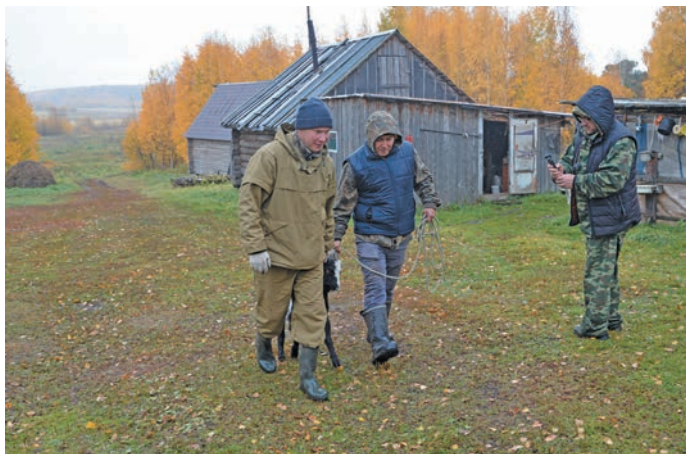
^ Ай вош хӑрн