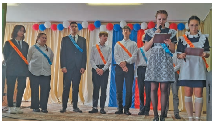
Полнавәт ашкола апрәң нявремәт

Щи тухалпи тәмхәлт «Класс года» немуп кәсупсы олңитсы.