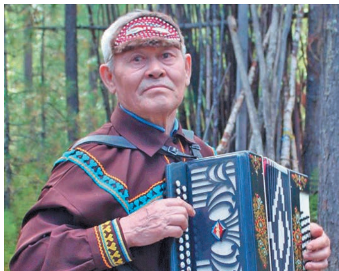
П.Я. Айваседа. З. Казамкина миюм хур

Щащиём хуща сора лундум, Ёмаҗхәтл пида ям ясңәт луплум, Тынәң, тәпәң щащиём, Еша омса, әл термала, Уяңа-пищәңа, яма вәла, Хўв йис, хўв нәпәт нәңена, Тәлаңа вәла, тынәң щащиём, Нәң киньщена щимәш ям хуят әнтәм.