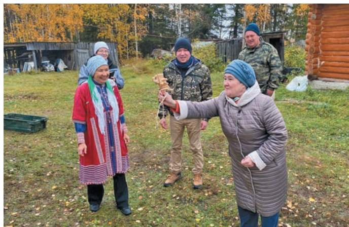
Әмәщ верәт. П. Молданов верум хурәт

щит «Торум Маа» хуща рәпитты ёх йир-поры верты питсәт. Йис ёх иты лыв йир-поры верләт, хән Калташ аңки хутәң ёмәң хурәлн па мұва пәрләл па ши хурәлн и юхи керләл.