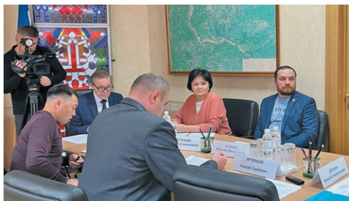
Шуши мирәт ассамблея депутатәт. dumahmao.ru эвәлт вүюм хур

Шәлдә Алексей Дре-нин путәртәс, хутыса 2022-мит олн округев хүваттынн нявремәт вәндтәты верәт олаңән поступсы рәпитәс. Интам внеурочной щирн иса әшколаятн нявремәт рәт ясаңа вәндтәты питлдыйт. Әңкета-әщета пириты мосл, дәлн нявремәл хәнты муй вухаль ясаңа ат вәндтәсы. 2024-мит ол лыпәт хойты тыләщн иса