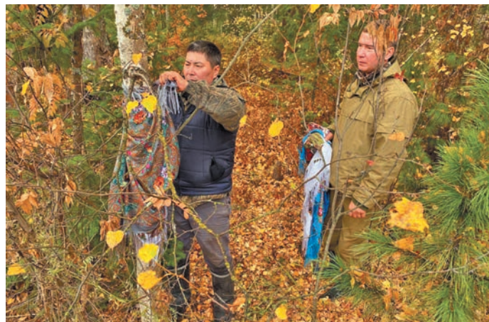
^ Сухӑт йирты вер