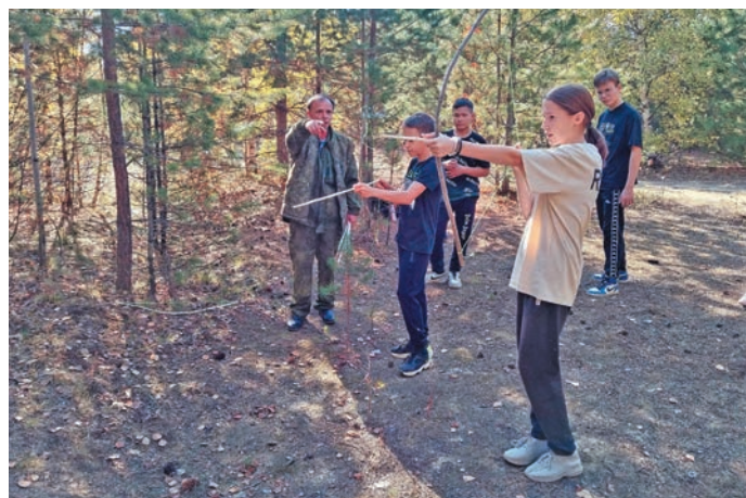
Әхәл эвәлт нәл есәлләт

Мет сыры мўң «Пәнәт непекән» мәсыюв па лупсыюв, муй щирн вәнәт