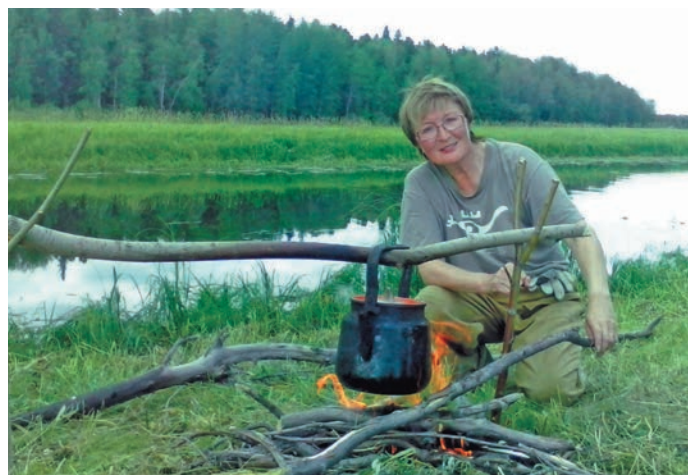
З.С. Рябчикова рат Тэк картан

Милем, кувщем щих муртсаюм. Ма иса халлум хуят ущхуль путар... Мин кўтемн, алпа, мосан,