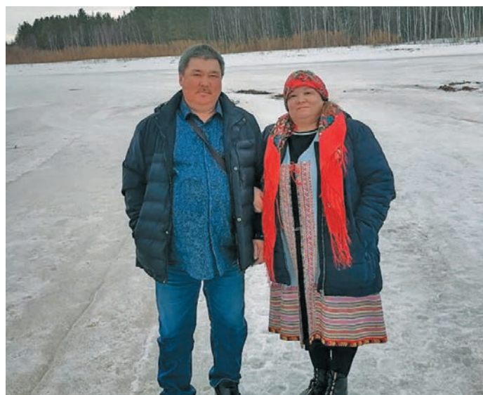
▲ Анатолий Александрович Наталья Александровна имел пила

» Әңкем әхәт оләт вәнты вой вәлпәсләты яңхиләс, щит шеңк каркам па рәпата пелды сәмәң ими. Ин вәнты хўл вәлпәсләты яңхәл. Вэнт кэртэвн Татьяна упем па Вячеслав апәлем хотәң ёхләл пила вәлдәт, иши вой па хўл вәлпәсләләт, вэнт кэртэвн арсыр воньшумутәт, овощетенмәлләт, ши тумпи вәнтән воньшумутәт, тулхәт әкәтлүв. Әңкем хәнты пурмәсәт ин вәнты ёнтәл, ши тумпи сухта эвәлт пурмәсәт верты хошл. Вэнт кэртэва мойң ёх тәтәдлүв. Лывелда ванлдәлүв, хутыса йис