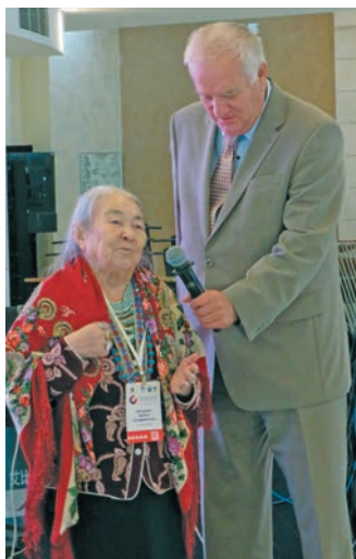
Ханты мир поэтесса ими М.К. Волдина ям ясңат лупл