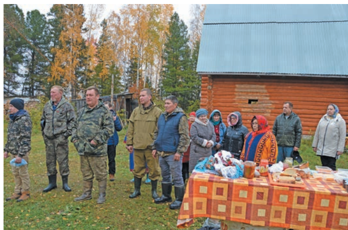
Поры пәсан хоңәнән