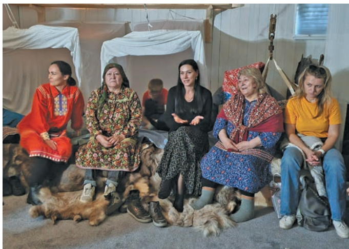
» «Вэлум хот» пўншты пурайн

» Ма музейн рэпитлдум, мўң иса пўш проектāt хāншты партлāюв. Вошиев хуты ай, ар мир тыв āн юхтыйллдāt, музейева мир хущты мосл. Щāлта па мўң вошевн арал пелāк увāс мир вэллāt. Ма нэмāссум, муй лывела хэллāнтты па вантты эмāщ,