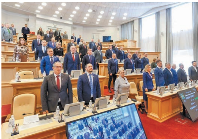
Округ дума ёх мирхотн. dumaha.ru сайт эвәлт вўюм хур

Щәлта вәлты хотәт омәсты вера, щит субсидия вухәт мәты щит