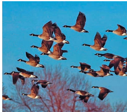
cultura.ru сайт эвэлт вўюм хур