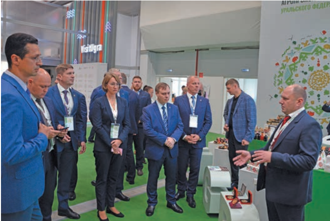
Кэща ёхлўв летут ванлдӓт