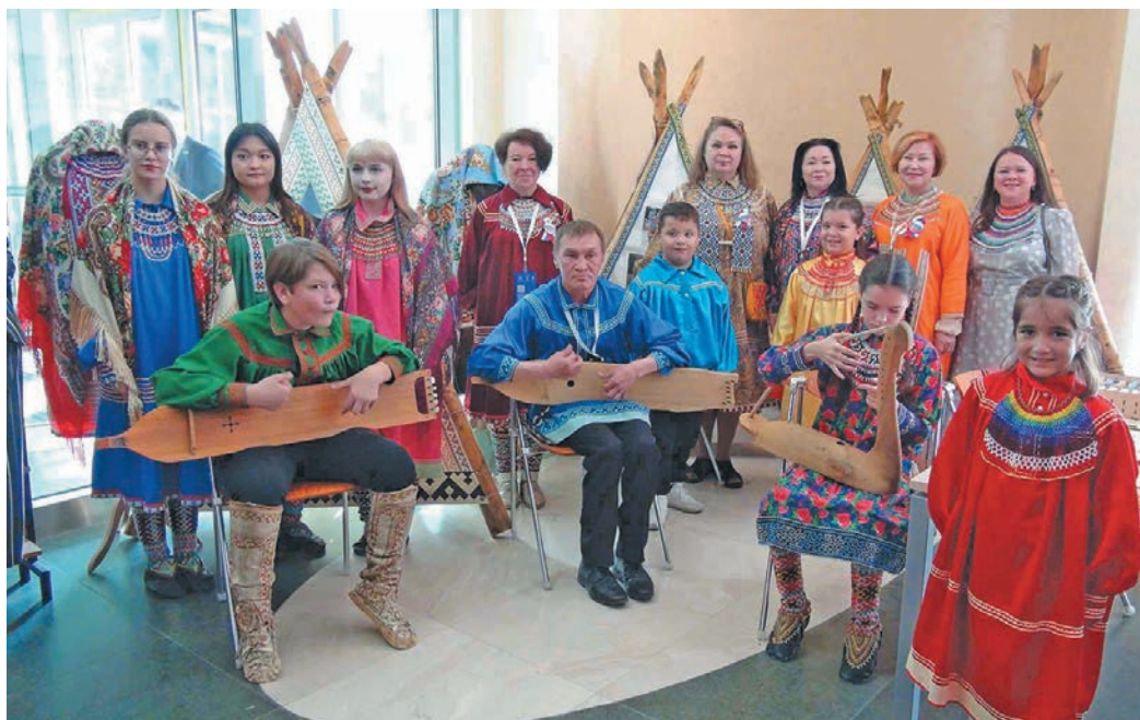
▲ «Лылаң союм» тәхийн рәпитты ёх нявремәт пида

Нявремәт вәндтәты хуятәт ёмәңхәтл елпийн «Лылаң союм» хуца пушхәт пида рәпитты неңәт-хәйт «Хоттед, ёх ратхәр» нәмпи етнхота әк-тәшсәт, ләдн кашәң хәннәхә лүв рәтләл, әңкидал-ащидал, опрашдал, щащидал олаңән нәмәлмийс. Щиты интәм мўң айкел тәлүв, мәта ёх эвәлт учителят вәлдәт, муйсәр дәрәт тәйләт па сәмләдн тәйтты вулаң нумсәт вәлупсы олаңән нынана хәншлүв.