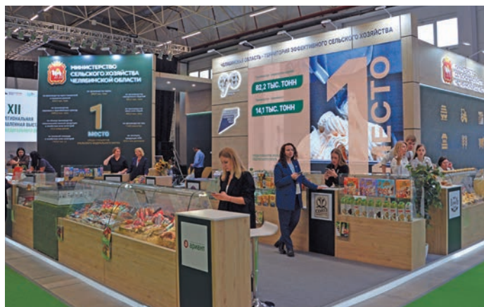
Челябинской область вандтупсыӓн

Югра хуща Ӕмвошн иса пӓш хӓлӓт эвӓлт арсыр летут версыйт. Ин тӓм вошн хӓлӓӓн верӓт юремӓты ӓн питлайт, щимӓщ проектӓта кӓща ӓх елды нӓтты питлӓт. Югра хуща ӓн юремӓлӓт мисӓт ӓнмӓлтӓты мирев, ӓсум йиӓк пӓсты мирев па арсыр войт ӓнмӓлтӓты ӓхлӓв. Тӓмӓщ верӓт нӓтлӓт Российской Федерация президент Указ щира вӓлупсы лӓщӓтты, муй тӓхийн хӓншман, ши арат