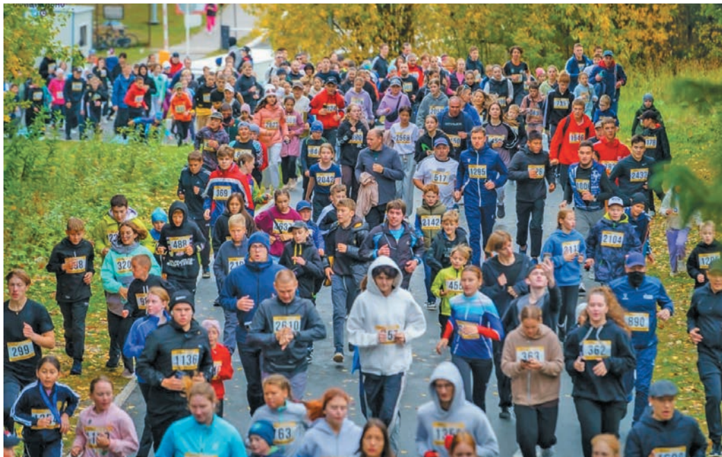
«ЮграМераСпорт» сайт эвӑлт вӑюм хурӑҕн

Тӑм хӑхӑлды кӑсупсын арсыр щирн кӑсты рӑхӑс: «Будь в движении» немасыя хӑхӑлды кӑсты ут, ийӑха 1 500 метра хӑваттын хӑхӑлды вер па хоттел, ӑх кӑтлӑн кӑссӑт. Щит тумпи немасыя щирн ван 350 метра хӑват «Женское движение Единой России», «Молодая гвардия» па Югра мӑв Молодёжной