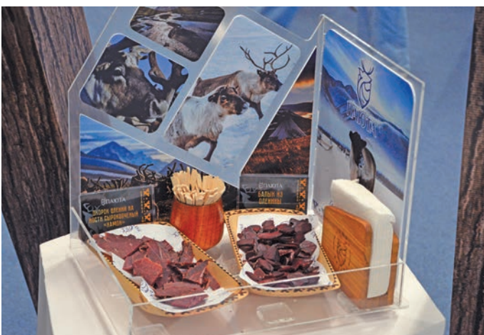
Ямал эвӓлт вўлы нохи