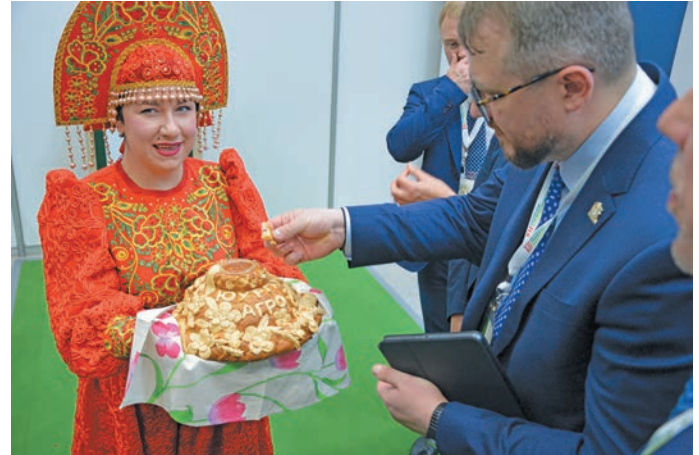
Рўщ нянян мӓдыит