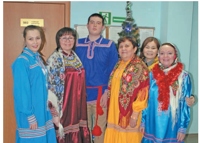
«Ханты ясаң» газетайн хәншты ёх