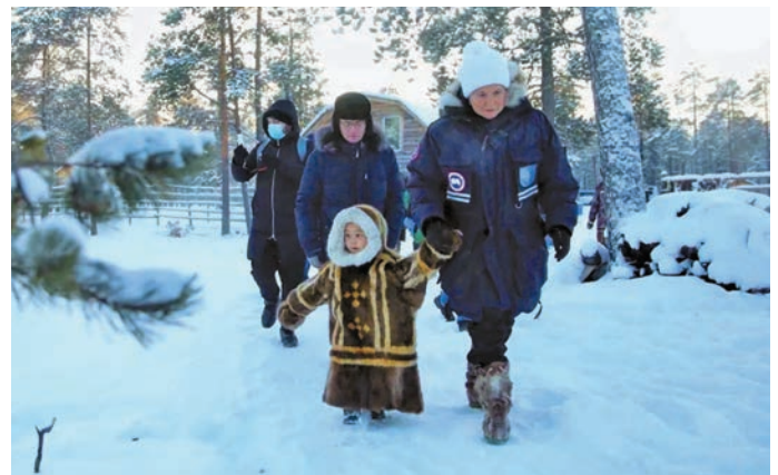
Вәнт кәрт ванлтупсы пурайн

кәщәев Клим Кантерова вәндтәты вер оләңән сертификат непек мойләс. Интәм онлайн щирн хәнты айдат хә елды вәндтәты пищ тайты питәс.