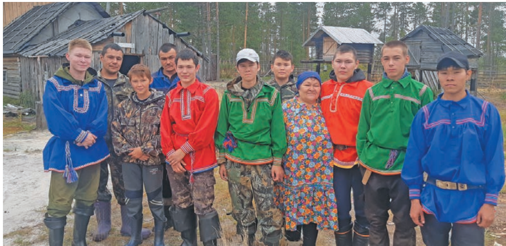
Няврэмт Саккяр ёх вэнт кэрта юхэтсэт

холдәсум. Аңкем-ащем тәдн юхәтсәңән, ма лын әхдәна омәссум палупсум: «Тәлтаса немәлт тәхия ән мәндум».