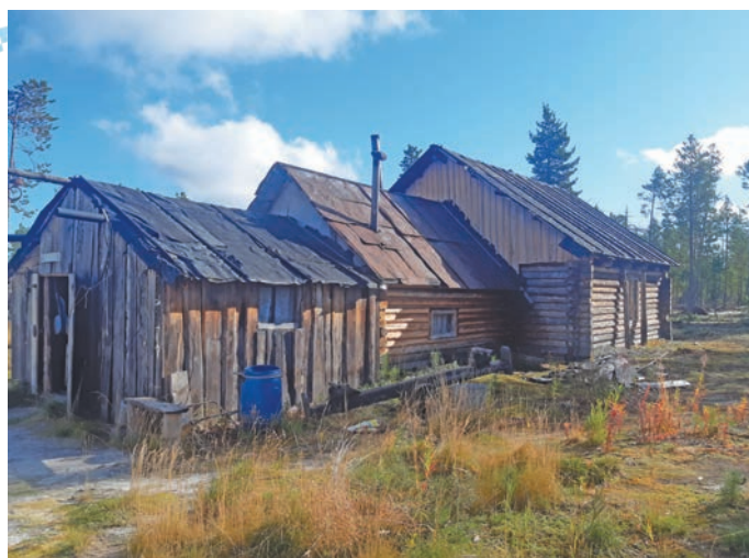
Кәртәң мир хотәт

» Ширн нюки хотн ар ими рәпитәс, лыв мәнәма вера нәтсәт. Нәмләм мет әмәщ вер, щит хән нюки сорәлтәсүв, па тохум тәхет ләп әнтсүв. Кәртәң имет, айт-пирщәт хулыева ким етлүв, ариман әнтәслүв. Ши мурт әмәщ вәс! Па и әмәщ вер – щит вүды кирты вер. Хоптәт вошитдәйт, имет хулыева ким етләт, нәтты пәта. Ма няврәмдам ләмәттәлдам, ким тәлдам па имета нәтты ши дольлум. Ши мурт әмәщ, ши мурт каркама па әрәңа ширн йилдән, ясәңән лупты пищ әнтә! Па и вер тәм хәтл вән-та йма нәмләм – няврәм сема питумн нәтсум. Ма ши күш пәлсум, ши күш сәмем торийс, тәп ясәңән ши лыпи нумәс хән ванл-тәлдум. Павла нумәс йм тәхи пела керәттты пәта, иньщәссум тохтурәт эвәлт хәлән-тум ясәндам, щикүш ши кемн нәмәссум: «Муй ши ясәң эвәлт мәнәма уша йил, ма тохтур хән». Верэв йма мәнәс, Татъя эви сема питәс. Ма немемн немәтса. Ин хән вәйтәнтыйлдумн, эвантыйлдумн-мосл-тыйлдумн, – лупас Т. Захарова.