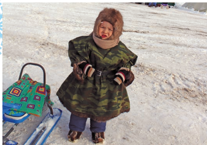
Владислав пухән. Н. Рагимова верум хурңән