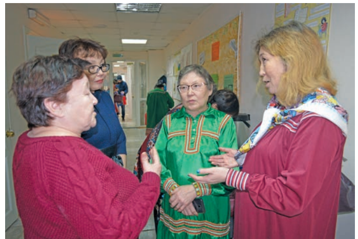
▲ Т.В. Волдина рәтнадал пида путәртман долъ

мәсы. Лўв йилуп тыләщ 9-мит хәтәлн сема питум хәтләл. Мўң, «Хәнты ясаң» газетайн рәпитты ёх, вән вўща ясаң китлўв!