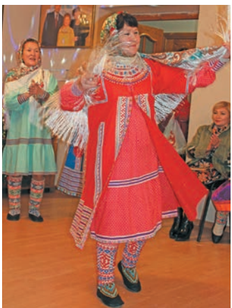
^ А. Зверева «Куренька» як ванләтл

ар мойңа юхтум ёха ванләсәт. Ма щиремн, ләщәтум етнхот вера самәңа па хошма тывәс. Ариты вер сухнум юпийн әктәщум неңәт-хәйт мавәң-лантәң па няняң пәсана омәссәт. Щиты ләхсәңа па әмщә оса верәт тәты арәң неңәт Югра мўв ёмәңхәтл постәты щира па йилуп ол йиты кеша ёмәңхәтл щи постәсәт.