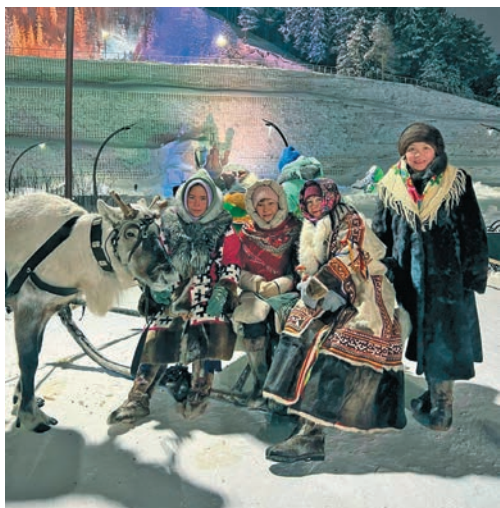
Мойңа юхтум неңәт