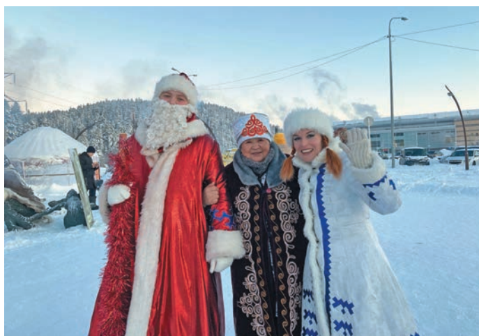
Киргиз хот кәща не Ищки ики па Лоньщәң эви пида