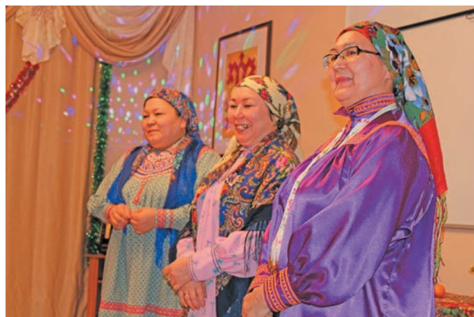
^ «Луи сам» арәң имет

Югра мўв сема питум хәтл вўраңан па йилуп 2024-мит ол постәты вер едлийн «Югра дьлнуптәты» оса тәхийн әмәщ «БАТЛ» немуп вәйтантупсы версы. «БАТЛ» немпи английской ясаң, хәнты щирн лупты ки, щит кәсупсыя питл.