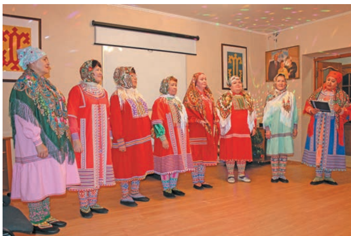
^ «Ёмвош ёх» ариты неңиет