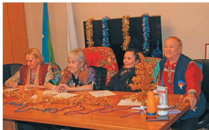
^ Арталәты ёх

«БАТЛ» немпи кәсупсийн мет арәң ёх пириты щира немасыя артащты хуятәт вохсийт. Щит пе-