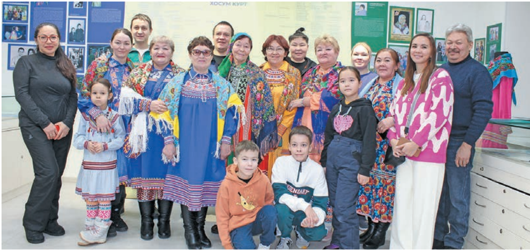
^ Неттинӑт рӑт ӗх «Торум Маа» тӑхийн ӑктӑщӑт

Ван хӑтлуп тылӑшн «Торум Маа» тӑхийн эмӑщ вӑйтантупсы вӑс. Щӑта Неттинӑт рӑт ӗх олаӑн ванлтупсы пӑншы. Щи вӑйтантупсыя Нуви сӑнхум, Сӑмӑтвош районӑт, Советской вош, Полнавӑт, Тӑк кӑртӑт эвӑлт хӑннехуятӑт юхтыйлсӑт. Лыв хулыева Неттин рӑт эвӑлт ӑерлӑл тӑлӑт.