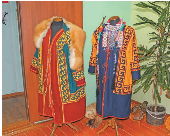
▲ Лўв ёнтум хәнты нәй сәхңән

Щи тәхийн араттелн 10 хәннехә вәс: нял хә па хәт не. Хәйт па ар пеләк иса луңәлтуп якты-ариты щирәт арсыр мирәт едпийн хурамәңа тәсәт, мўң – әл хәнты неңәт – якәт яксўв па вәлты-холты щирлўв олҔән арәт арисўв. Сыр-сыр ай кәртәта па вәншәк вошәта мўң Югра мўвев луватн иса щи яңхсўв. Еша әхәтшәк па Пулңавәт воша Ямал мўва тәтәдьясыюв, хута мўң верум «Мойпәр