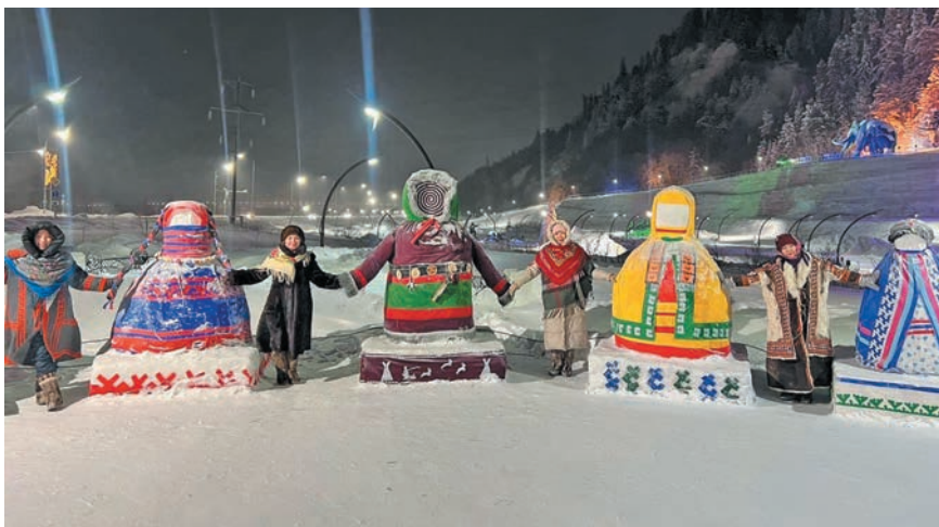
Югра мўв Йилуп ол постаты ёмәңхәтләң тәхия мойңа юхтум неңәт. «Лыләң союм» тәхи хурәт