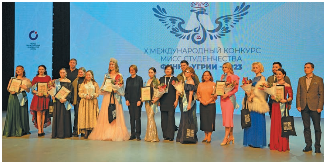
Кӑсупсийн кӑсум эвет худыева мойдӑсийт

Ёмвошн ван хӑтлуп тыдӑщ 14-16-мит хӑтлӑтн «Финно-угорский вектор в креативной экономике» немпи III-мит мирхот вӑс. Ищи артӑн «Мисс студенчества Финно-Угрии – 2023» X-мит кӑсупсы верӑнтсы. Тӑмӑщ ӑктупсы округ Югра кӑща ёх па финно-угорской университетӑт Ассоциация яха пилтӑщман лӑщӑтсӑт.