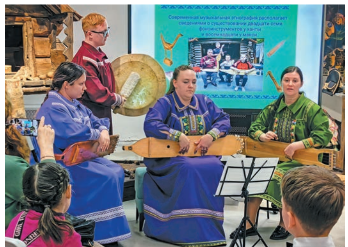
^ Вухаль имет нарәсләт. Н. Костылева китум хур

Вухаль ех лупләт: «Ар – щит ям дәхәс, ар ариман