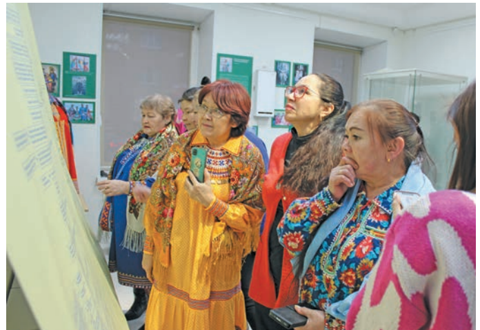
Неттинӑт ёх рӑт лӑрдал вантӑт