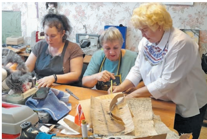
Тунты пидӑ рӑпитты вӑндтӑйлӑт