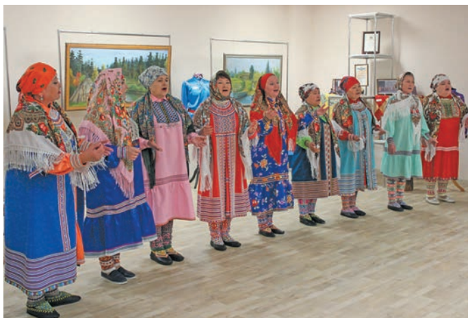
▲ Мойң ёха «Ван рәтәт» ар ариләт

Айтәлн Фая эвие якты вер пелы сәмәң вәс, кашәң ёмәңхәтл, пурайн юлн етнхот ләшәтыләс, арийс