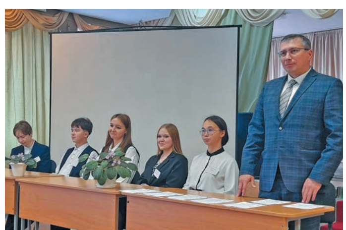
^ Мирхотн мÄнум хÄтл олÄңÄн путÄртÄсÄт