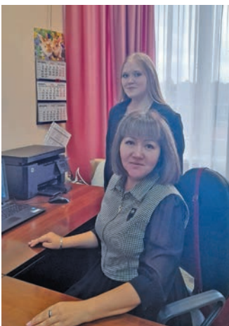
^ А.Е. Вахат рÄпатАел олÄңÄн путÄртÄс

ПолнавÄт кÄртÄң Äшколайн 9-мит классÄн вÄнлТÄтылДты эви