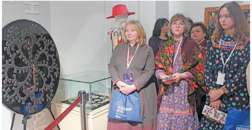
Мойң әх әмәщ хурамәт ванлтәт. И. Самсонова верум хур

Васы мәнты тыләщ 10-11-мит хәтлңәнән Ёмвошн хурамәң ләмәтсүх ләщәтты па ёнтты, щи ләмәтты сүхн яңхты па иса хурамәңә вәлты вер мосман тайты әх вән мирхота әкәтсыйт. Тәм әмәщ мирхот па тынесты ванлтупсы «Югорская коллекция» па «Мўв-авәт па Хәннехә» йис пурмәсәт әкәтты па шавиты тәхеңән унтасн мәнәс.