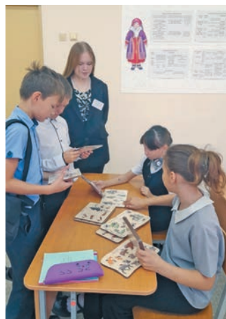
^ «ХÄнты ясÄң» урок пурайн