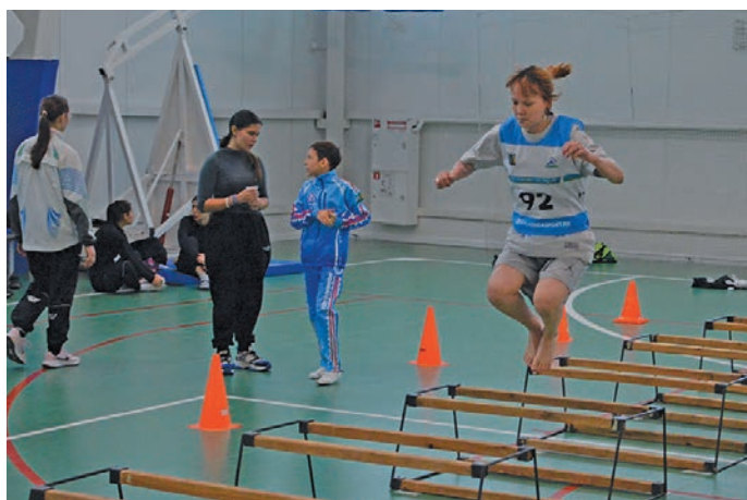
▲ Эхэл элты навэрл

Кэсупсы етшум юпийн тамэщ ёх олаң тэхета питсэт. Иса тэхетн кэсман