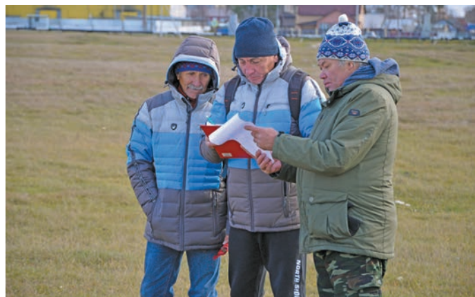
▲ Нявремэт кэсты вэндтэты хуятэт

Там кэсупсыя сот мултас айлат ёх юхэтсэт, дыв мўң Югра мўвевн арсыр муниципальной мўвэатн вэлты ёх. Тамэщ кэсупсэт 1960-мит олат вўш эвэлт тывты питсэт. Кашэң ол мўң мўвевн хўл каталды, вой велпэслэты па вўды тайты ёх хэтлэт верэнтсыйт, щата иса пўш ёх кэсман вэсэт. Ин Югра мўвн щимэщ ёмэң хэтлэт хулна ищи вэллэт.