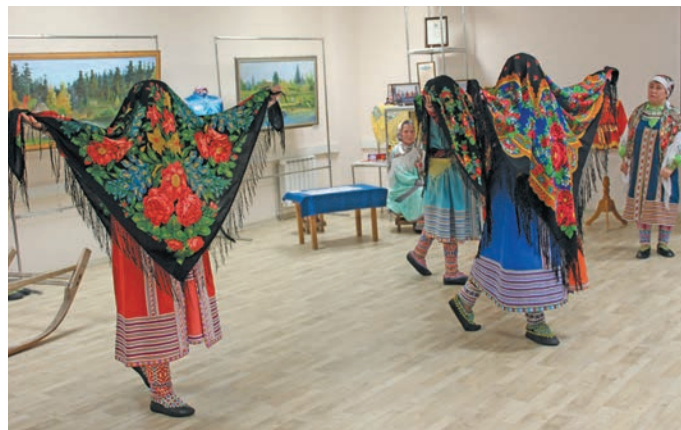
Ӑмӑн ухшамӑн як