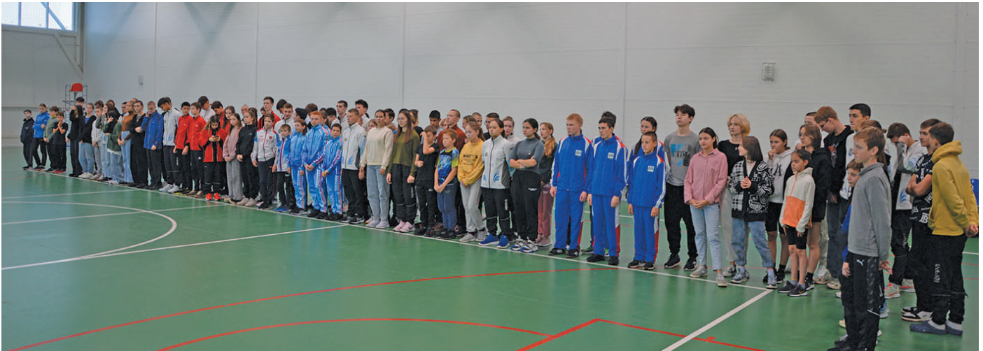
Кәсүпсыя юхтум ёх

тәмәщ командайт сырыя вәсәт: олаңмит тәхи – Нефтеюганской район; 2-мит тәхи – Ёмвош район; 3-мит тәхи – Сәрханл район.