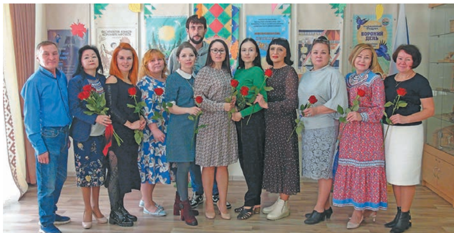
«Лыләң союм» тәхийн нявремәт вәндтәты ёх

хәрши па вешкат неңә вәс. Мўң геометрия хўват экзаменәт иса «4» па «5» посәтн мәслүв. Лўв олңәлн нявремәт путәртсәт: «Лўв мойпәр па вәндтәл!». Ма әңкәмн тәс әша китсыюм, нявремәт вәндтәты неңә йисум.