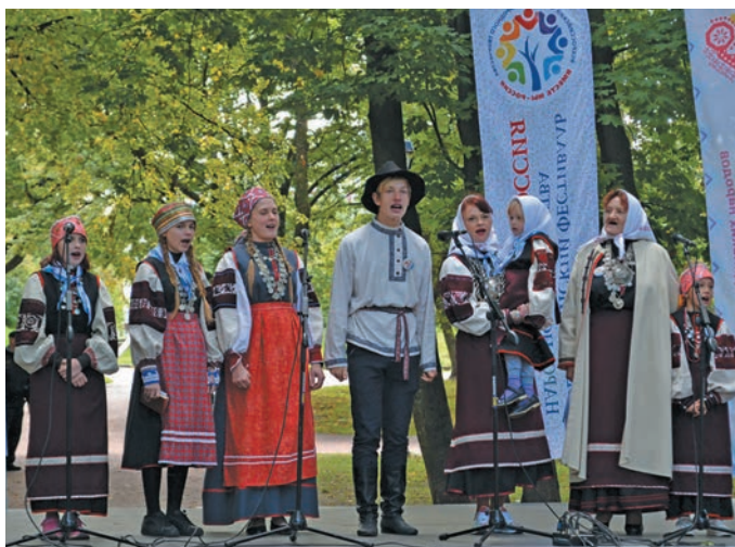
▲ «Tsirgukoso» («Пушхиет») ариты тәхи нявремәт ариләт. Л. Гурьева верум хур

– Тәм вән ёмәңхәтлән нәң «Tsirgukoso» («Пушхиет») немпи ариты тәхев нявремәт арәт хәләнтсән. Щит 2003-мит одн Печоры