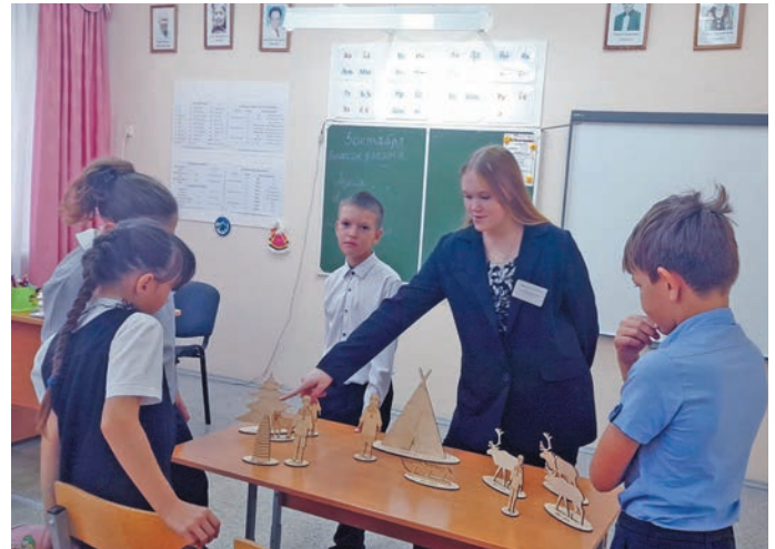
^ ВÄнлТÄты ёха йма ясÄт лупсУв

«День самоуправления» хÄтлÄн нявремÄт Äшколая алÄңшÄка юхÄтсÄт, дÄлн вÄнлТÄты ёха лыв ёмÄңхÄтлÄлн ар йм па хошум ясÄң лупты.