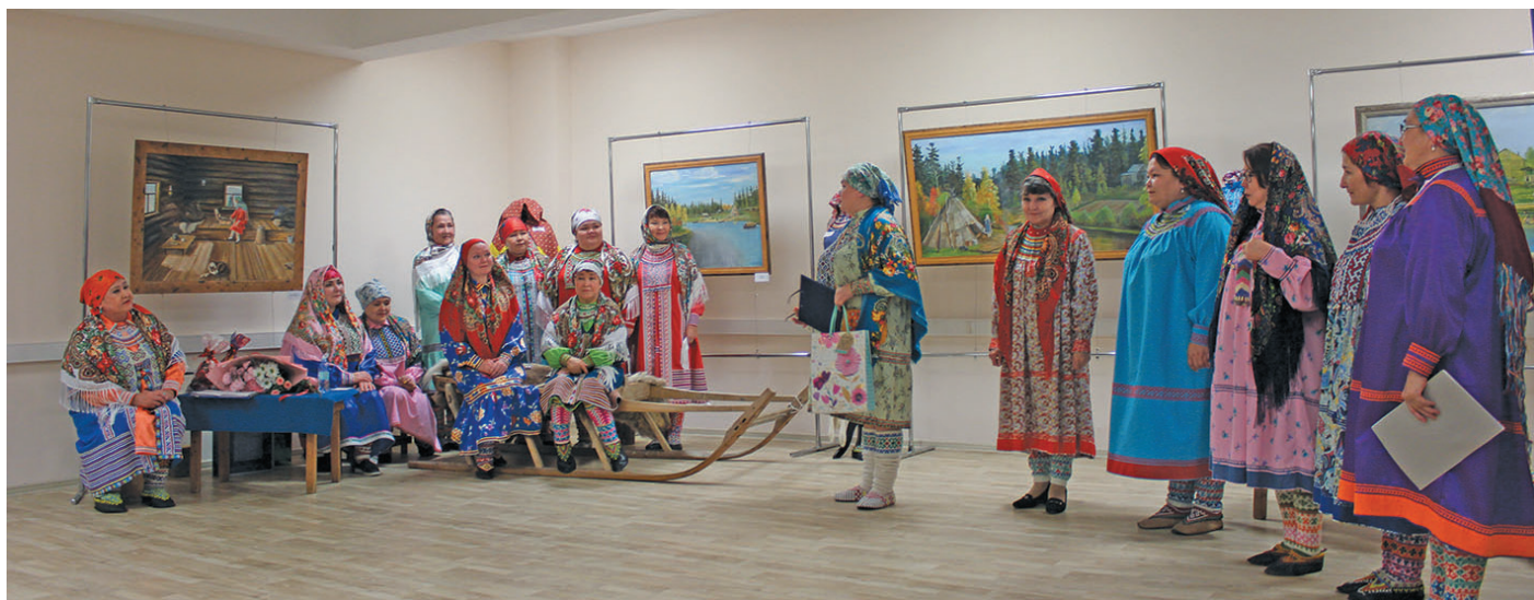
▲ «Луи сам» вухаль ариты тәхи неңәт йм вўша ясаң лупләт