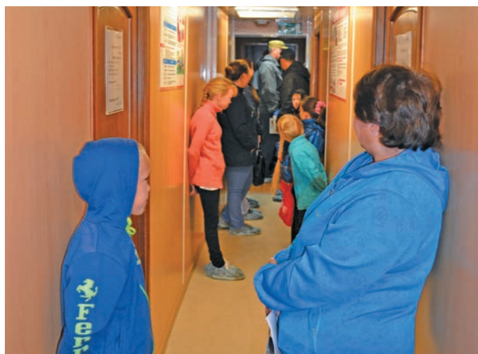
▲ «Н. Пирогов» тугәң хопн. Н. Рагимова верум хурәң