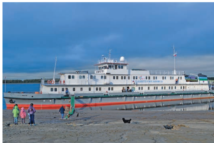
▲ «Н. Пирогов» нәмпи леккәр хоп

Тата мосванән Ёмвошн Ас потты тылащ олаң хәтәлн «Югра» нәмуп айкеләт әкәттн тәхийн «Центр профессиональной патологии» тәхи вән тохтур хә Николай Ташланов пида вәйтантапсы вәс.