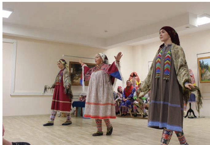
«Хәтл» театр неңәт як якәт

Ғмвоша касәлсәс, имухты «Ғмвош Ғхә» пилтащәс.