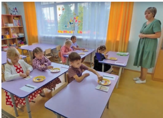
▲ Нявремәт вәнлталәтләр

» Сүмәтвош хуща вәлты няврем вәнлталәты әш-колайт па сыр-сыр тәхет худыева тәм «Сащмәлтәты әш хұват» верәт вана вўсийт, карты щўңкәт мухты арад пеләк нумсәт мўңева китсәт, арад пеләк непекәт рәпитты верәт олаңн хәнсәт. Щәлта па щи китум непекәтн хәншум верәт мўң па щи едды карты щўңкәт мухты иса мира ванлтәсүв. Щи пәта «Банк передового педагогического опыта» версүв, мәта тәхийн кашәң хәннехә лўңәтты