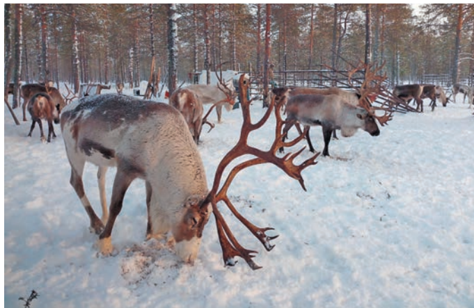
Г. Покачев вўды ташл

няврем тайлдәңән. Лын атәлт вәлдәт, хәлумьяңкем вўды тайлдәт. Ащел ай пухл пида па тәхийн вәлдәт, иши вўды таш тайлдәт. Геннадий ащелн иса верәта тәса вәндтәсы, юх эвәлт арсыр утәт верты, вўды лапәтты, хирты, давадты, вой па хўл велпәсләты. Ин лўв ши верәта нявремдәл, вәндтәллә.