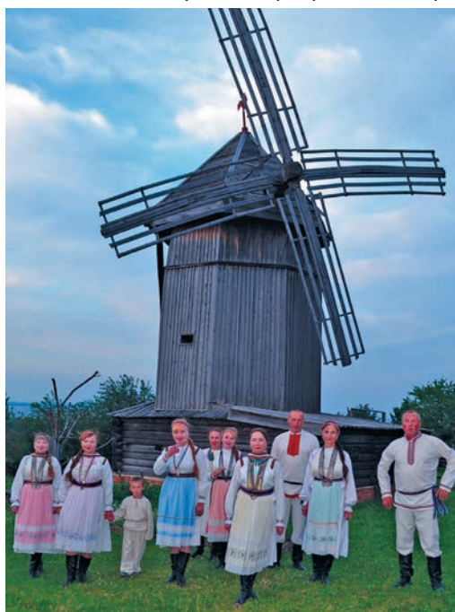
▲ Горномарийской драмтеатрән юнтты ех нянь верты тәхи пўңәлн