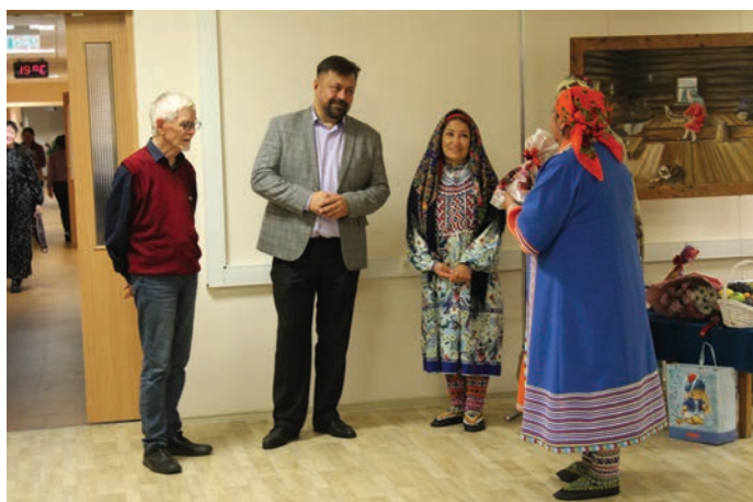
▲ «Хәтл» немпи театр ёх етнхота юхтылдсәт