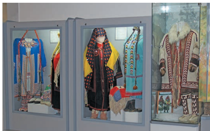
Хәнты па вухаль неңәт ләмәтсукхәт

Сырыя катрая ювум павәрт хотн музей вәс па әхәт, 2003-мит олң, лүв йилуп кирмәщ эвәлт верум ләщкам хота каслуптәсы. Ши пәта сыр-сыр йис пурмәсәң ванлтупсәт тата ләщәтты веритлүв, ям арат хәннехуятәт кашәң пўш тыв юхтыылды питсәт.