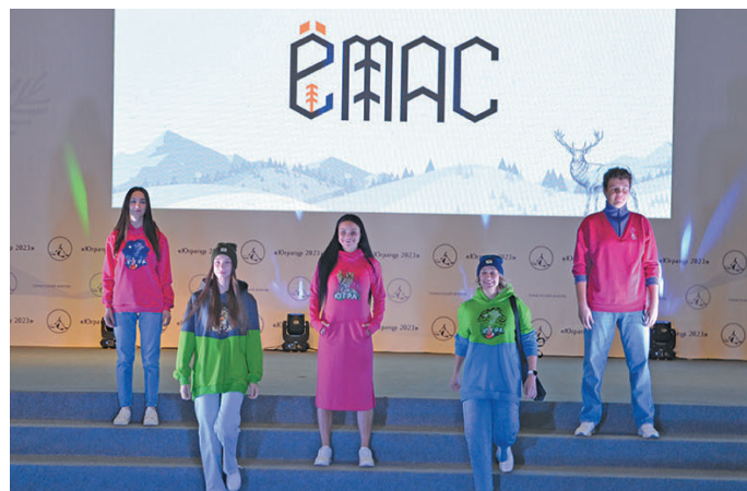
» Югра мӑв ӑрнас сухӑт ванлтӑлӑйт

» Мӑнӑма вера ӑмӑщ вӑс, хӑн тыв юхӑтсӑт арсыр ӑх,