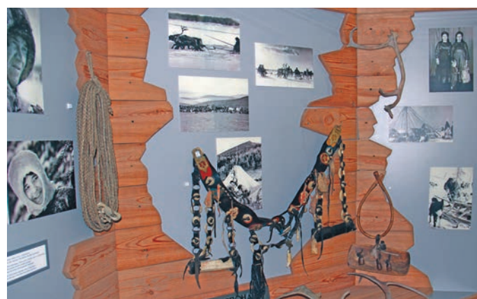
Шуши мир пурмәсәт