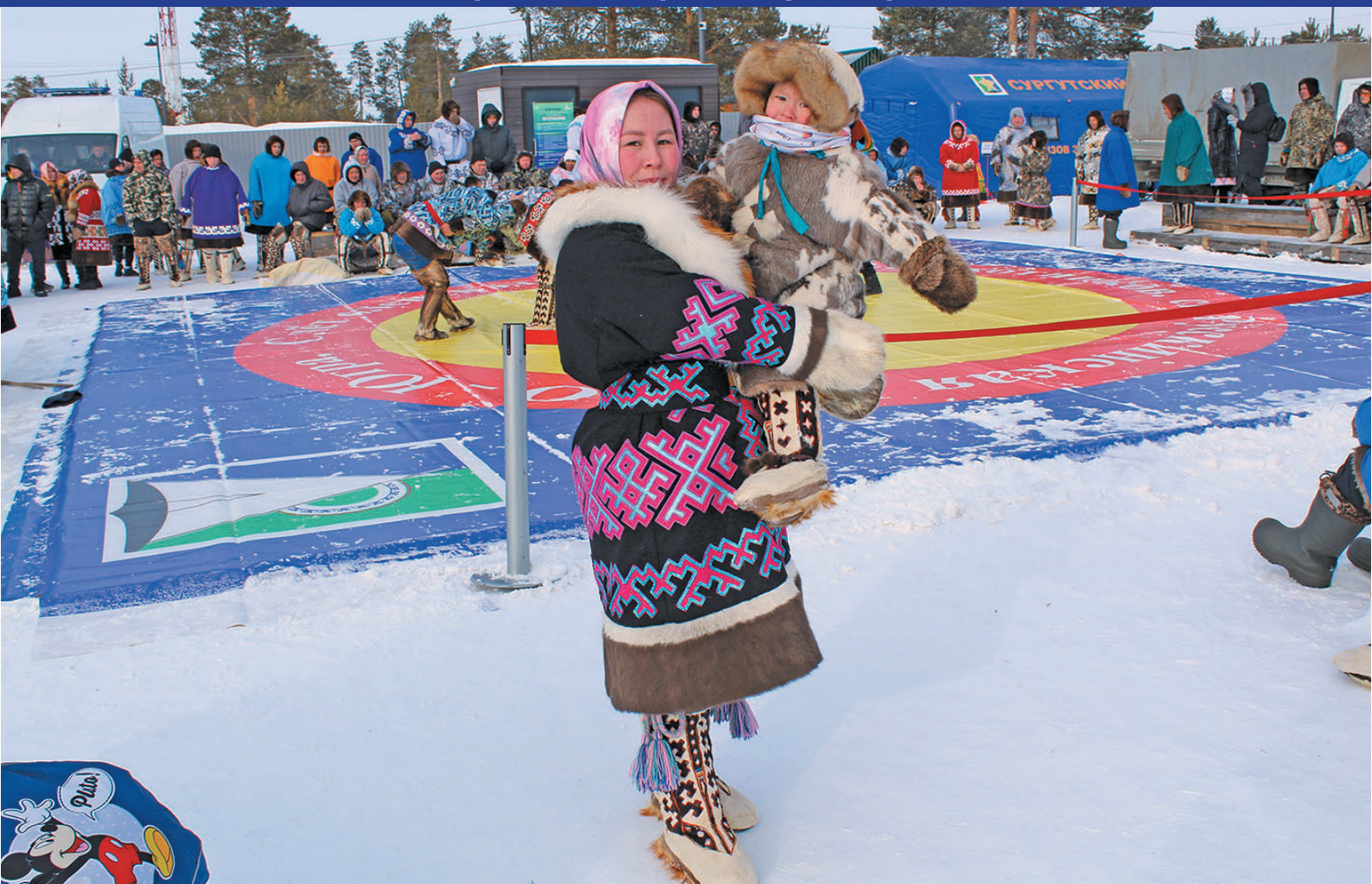
Ханты не Фая Ефимовна Мултанова пухл пида Русскинская вошн. Н. Рагимова верум хур