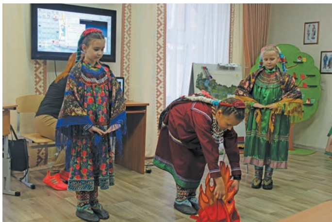
^ Эвет юнтупсы ванлтӓдӓт