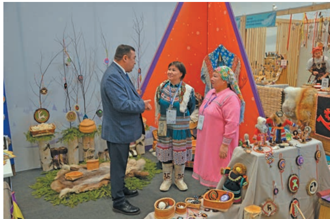
▲ Россия мўвев сенатор А.В. Новьюхов вандтупсыя юхтәс

Ёмвошн Ас потты тыләщн 10-11-мит хәтлңәнән «ЮграТур 2023» вандтупсы вәс. Щит «Югра-Экспо» хуща пўншса. Тәмәщ вер Югра кәщә ёх ләщәтсәт.