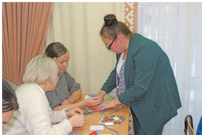
^ Акань ёнтты вер ванлтӓды