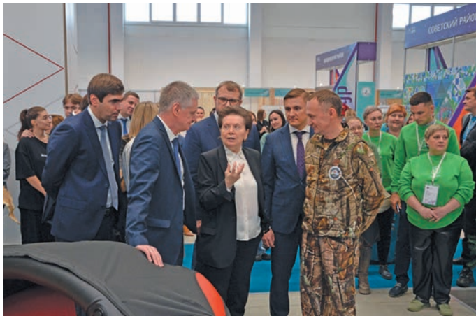
▲ Югра кәщә ёх вандтупсы вантлёт