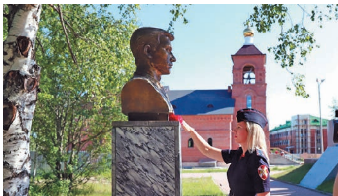
Рәт мўвн кев хурасл верса