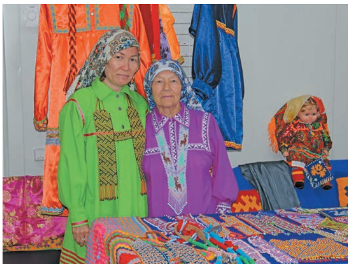
Л.Г. Возелова аңкел пида Муши вошн. В. Енов верум хур

Любовь Геннадьевна, муйсър хоттел, ех хуца нăң сема питсэн, мата тăхийн енумсэн па хута ашколайн вэнлтыйлсэн?