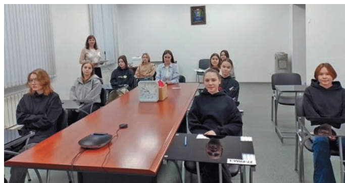
Ёмвош технолого-педагогической колледжаңан вэндтыылдыт эвет иши кассат

Колледжа́тн вэнд-тыылдыт айдаат эх ханты, вухаль, юрн ясңатн кассат. Иса там пүш 75 хуят олимпиада щирн рэпата ханшас. Лыв эвэлтэда ханты ясңан – 39 айдаат эх, вухаль ясңан – 31 хуят, юрн ясңан – 5 хуят. Рэтысңатн Сэрханл, Нуви саңхум вош, Лаңки пос, Игрим