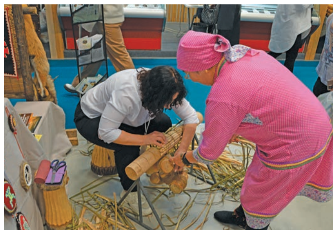
» Верӑн ӑх лӑпи верлӑт