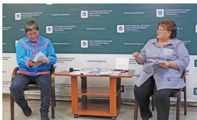
Вячеслав Кондин киникайл олаңан ай тэл

амаш путрат – щит аңкетнащетн моньщум моньщат. Вантэ, дыв вэйтлэт, муй нявремата мет амаш, муй дыв тэса хэлантлэт. Амаш ки, дыв елды моньщты вохты питлэт. Югра мўв нявремата «Ёмаш реп моньщат» киника амша лўңатты ат питл!