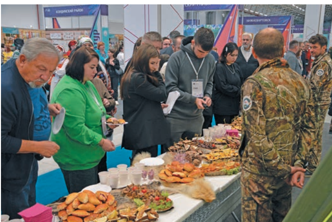
▲ Юхтум ёх летут пўләт арталәләт

Югра кәщә нәцев па айлат ёх олаңән пугәртәс. Иилпа енумты нявремәт па айлат ёх тәм мўвн сема питсәт, тәм мўвн енумләт, тәм мўвн елды рәпитты, елды вәлты питләт. Щи пәта вера мосл дыв сәмдал, дыв нумәсдал мўң йиңкев-мўвев пелә керәтты. Округев хуща тәм луват ям вер пәта «Социальные сертификаты для путешествия детей» проект верман вәл. Щи вер вана вўсы па Россия экономика Министерства хуща рәпитты кәщә ёхн вухн нәтса. Тәм вер ки иса пўш яма ләщәтты, щирн әшколайн 5-9-мит классәтн вәндтылды нявремәт мўң Югра мўвев хўват яңхты пищ тәйты питләт. Тәм ол щимәщ проект ләщәтты олңитса, тәм вер мухты 5 щурәс няврем мўң мўвев хўват вошәт, кәртәт вантман яңхсат. Щи вер олаңән нявремәт вера ар ям ясаң лупсәт, әңкидала-ащидала нявремәл тәмиты рўтьщәты вер пелә вантты ищи әмәщ, па