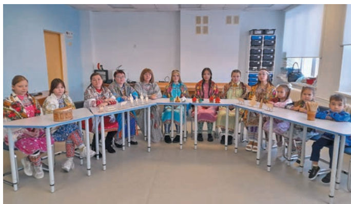
▲ Вāйтантусыя āкмум мир

И.Ф. Пермяков немпи Полнавāt кәртāң ашкола вәндтāты ёх па нявремāt «Вўт ашколаен олāңн путāрта!» немпи Россия мўвтел мир кәсупсийн кәссāt.