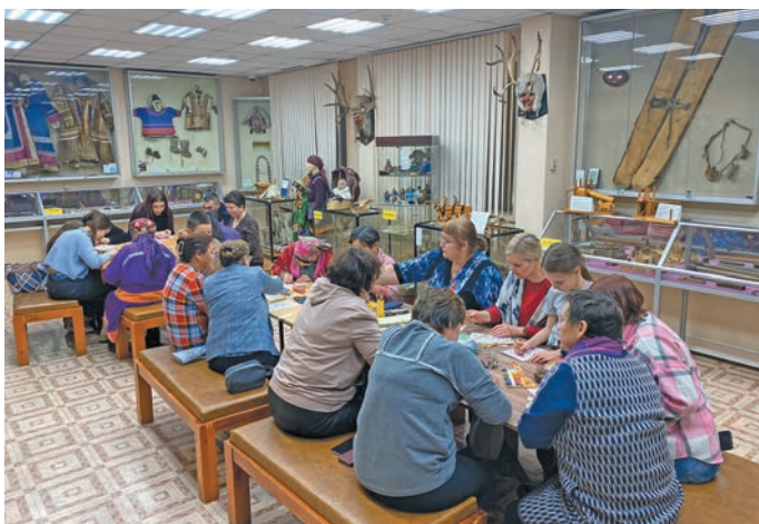
Мирхота юхтум юх ӑхтын хӑншты вӑндтӑйдлӑт