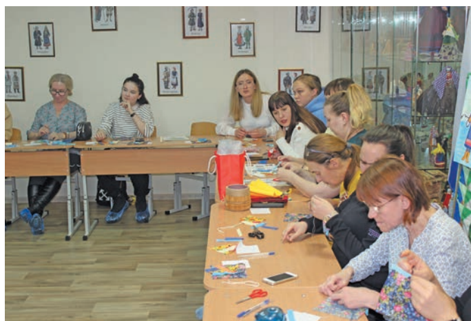
^ Мирхот пурайн