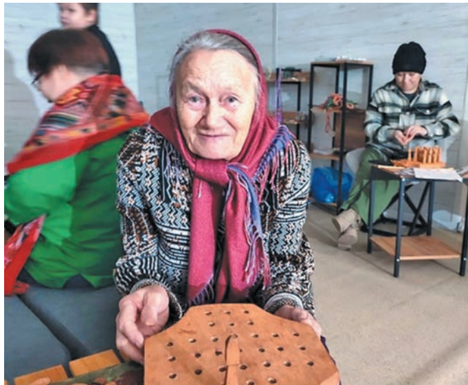
М.М. Канева С. Рандымова верум хур

верса, йилуп нуви хәрәп пәсанәт, омәсты пәсанәт омсәлсыйт.