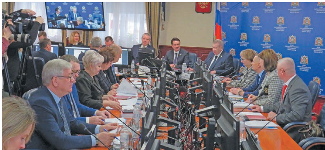
Мирхота әкмум ёх