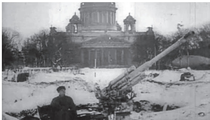
Ленинград вош даль пурайн. Президентской библиотека тәхи хур