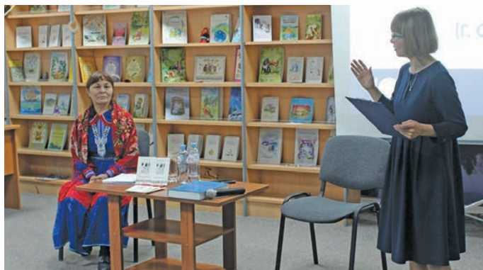
▲ И.М. Молданова мойң нә олаңан ай тәл. Л. Гурьева верум хур

» Евдокия Серасхова – хәнты мир поэтесса, шуши мир оса верәт тәты нә, хәлүм пўш депутата вәс. Лўв приуральской хәнты нә, 1965-мит одн Ямал мўв Приуральской район Зелёный Яр кәртән сема питәс. Пулңавәт вошн педучилище етшуптумал юпийн вўдең хәя икия мәнәс. Вўды тащл пида касәлсәт, щемьейн хәт эви сема питсәт. Щи пурайн лўв лўңәтты арәт хәншты питәс. 2008-мит одн «Хәнты ның эвие» немпи киника етәс. Щәта хурамәң Увәс мўв, Йис вәлупсәв, хурасәң неңәт олаңан стихәт хәншман вәдләт. Лўв арсыр литературной кәсупсәтн кәсдыйл па нух питыйл. Лўв стихдал Ямал мўв «Дух авт» хән-