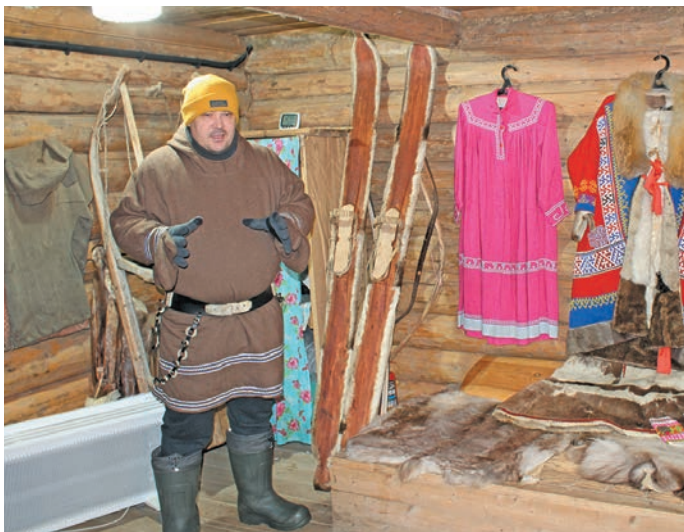
«Торум Маа» музейн рэпитты хэ С. Конев. Н. Рагимова верум хур

Ёмвошн вэлты па тыв мойңа юхтылдты мир хэнтты па вухаль ёх вэлупсы олаңан уша павэтты ки лэңхалэтр, дывела вэнт кэртэтра яңхты ан мосл. Щи олаңан Ёмвошн «Торум Маа» музей хуца уша павэтты рэхл.