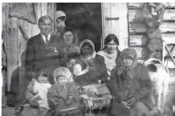
▲ Рандымовәт хоттел ёх

Щәлта Касум вошн «Казымской» совхозн рәпитсәт. Хән пенсия пура я йис, лын рўтьшәты пенсия мәнсәңән. Щи рәт хәннехуятәт щиты вәсәт.