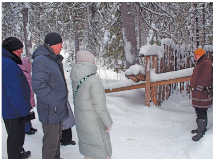
Мойң ёх вой велпэсэтр олаңан уша павэтлэтр