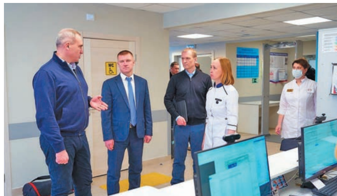
Р.Н. Кухарук Сүмәтвош пәльницәйн. vk.com/kuharuk_ruslan тәхи эвалт вүйом хур

Ишиты Р. Кухарук районной краеведческой музей тәхийн вәс, щәта лүв сыр-сыр ванлтупсәт вантәс. Щит шуши мир вәлупсы ширәт па 1953-мит олн Западной Сибирь мұвн мет олаң вәйтум газ тәхи олаңән уша верәс. Мосл лупты, тәм музей