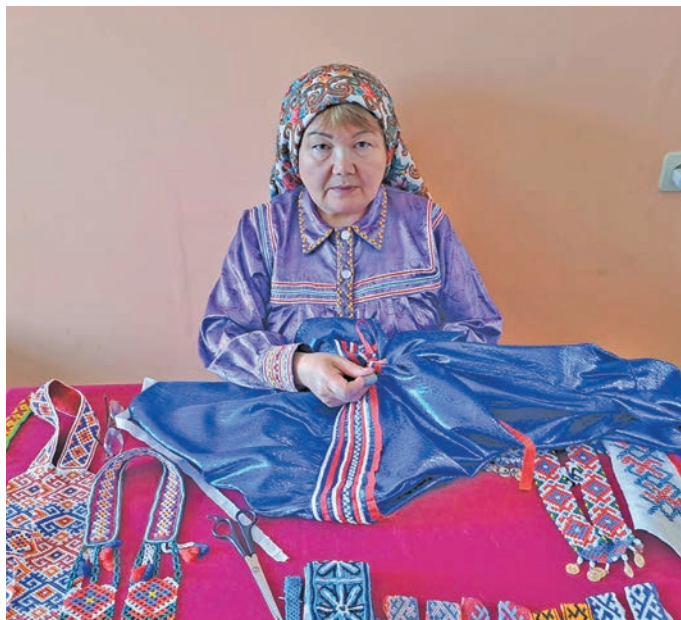
▲ Т.И. Енова па лүв ешңаладн тәса верум пурмәслад. В. Енов верум хур

тантыйлтыя питсүв. Лүв, вантэ, шеңк яма баянән юнтас па мўң щи унтасэвн арят арисүв.