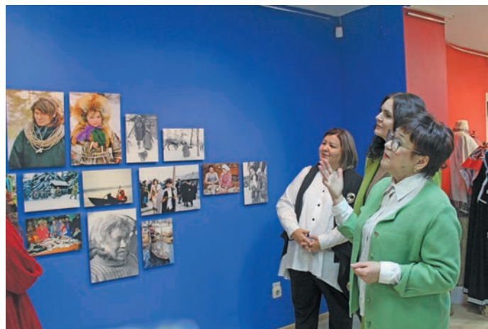
Верӓнты ӓх ванлтупсы ванлтӓт