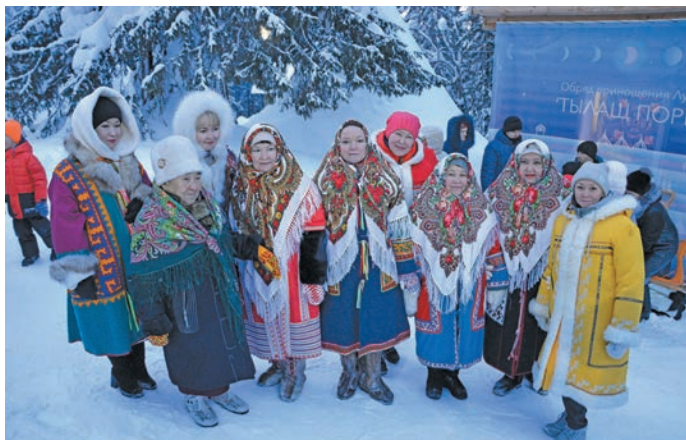
^ Ёмвош ёх