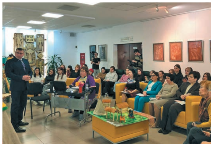
▲ Рәт ясәң олаңән путәртләт

Тәта шуши мир па па ясңәта вәндтәты хуятлүв, ясңев дерамтты верәт вантман тайты ёх, искусствәйт верәта вәндтәты неңәт-хәйт айлат ёхләд пида, «Лыдәң союз» нывремәт йис верәта па рәт ясңәта вәндтәты тәхи учителят, Ас-угорской научной институт эвәлт