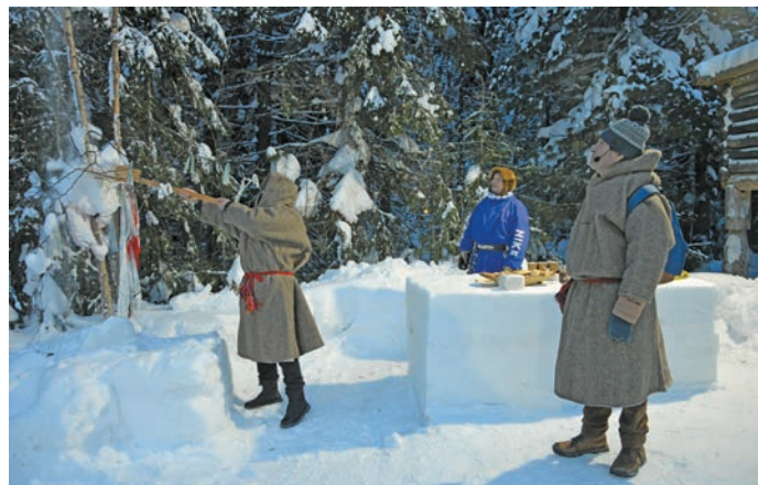
^ Икет пойкщӑлӑт

Ай кер тылӑщн 4-мит хӑтлӑн «Торум Маа» музей хуща реп ух пӑтыйн етн олӑнӑн тылща пойкщӑты хӑр верӑнтса. Йилуп Най-пуха, йилуп Вӑрт-пуха ши пойкщӑсӑт. Йисн щит хӑнты мирев пойкщӑты хӑтл вӑс, тӑм йисн вош тел мира пӑта верӑнтыллӑ.