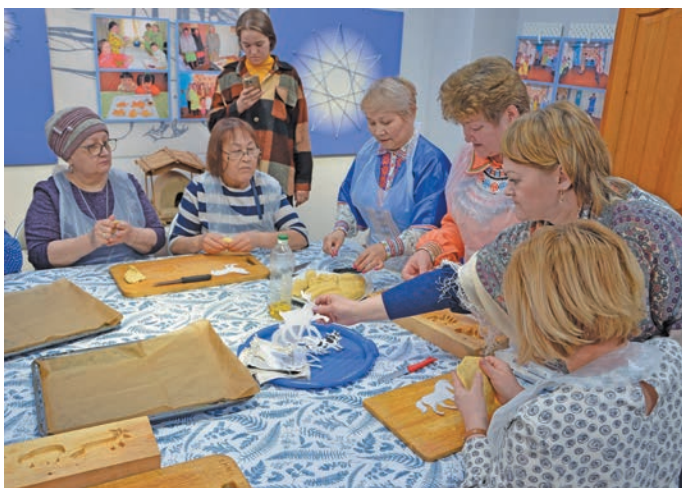
^ Нянь вой вердэт