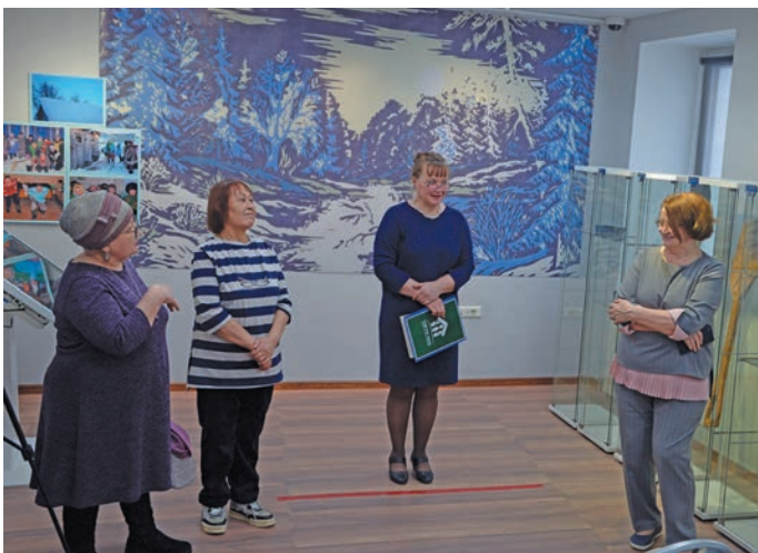
^ Ванлтупсийн вэлум ёх