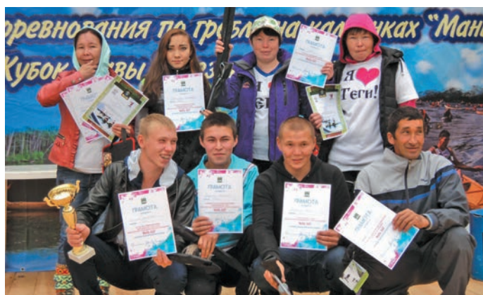
▲ Н.Л. Яркина (кўтупн) Тэк кәртәң кәсты ехдал пида

» Ма дәнхалум пугәртты, хуты лыпәт тыләшн 2022-мит олн мўң Тэк кәртәң