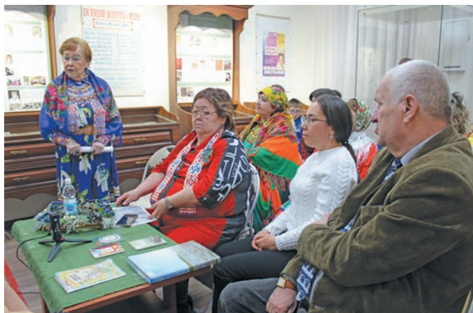
▲ Е.А. Нёмысова Микуль Шульгин олаңан путәртл

Әмәщ вәнтеп питы, Вўтәң Асем иты, Вән Кев доньщ иты, Мәнем мосл щиты.