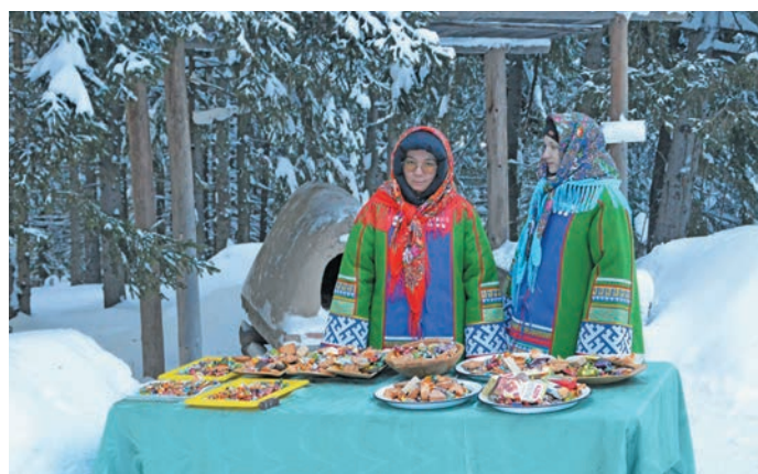
^ Айлат ёх летут ортлӑт

Тӑм йисн «Тылӑщ поры» пойкщӑты хӑтл па щирашӑк верлӑ. Вӑн вошн хотӑт хуваат ӑн яҗхлӑт. Ин мирев летут «Торум Маа» хуща тӑтылӑт па шӑта сӑҗхуп ух пӑтыйн доньщ пӑсана верлӑт. Щӑлта па сыры хӑтлӑн мир яха ӑктӑшийлӑт па нянь вой верӑнтлӑт. Тӑм ол ве-рум «Тылӑщ поры» вера ар мир, сыр-сыр мӑвӑт, вошӑт эвӑлт юхтыйлсӑт, дыведа хӑнты верӑт вантты ӑмӑщ. Ши пӑта тӑм пойкты хӑтлӑн ариты-якты па питсӑт. Тӑм пӑш тыв «Салы Лӑнх» немуп ансамбль юхтыйлсӑт, щит Саранпауль эвӑлт юхтылум айлат ёх. Тӑм вошевн вӑлты вӑна ювум