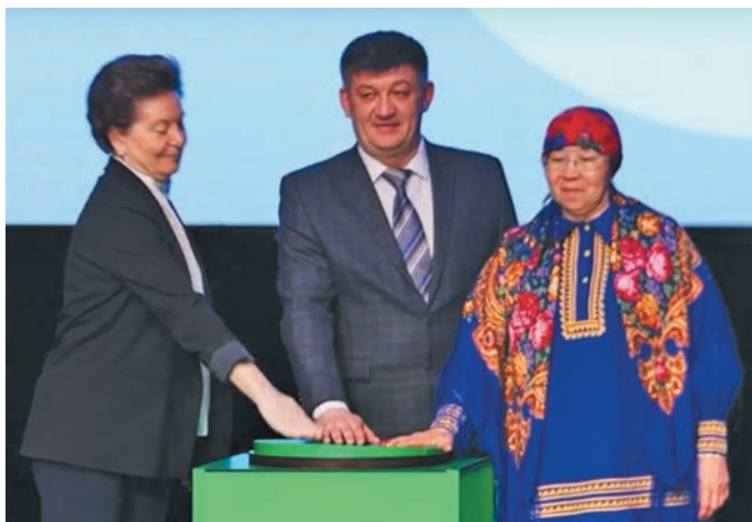
«Няврёмәт вәндтәты па вантман тайты хуят ол» пүншсәт

Тәм ол тови пура олңитумн Ёмвошәң па мойңа юхтум мир әнтә тәп товия амәтсәт, вантә, ипүляң хәтлән «Няврёмәт вәндтәты па вантман тайты хуят ол» пүншсы. Тәм вер пәта «Югра-Классик» араң-якәң тәхийн вән ёмәңхәтл ләщәтсы.