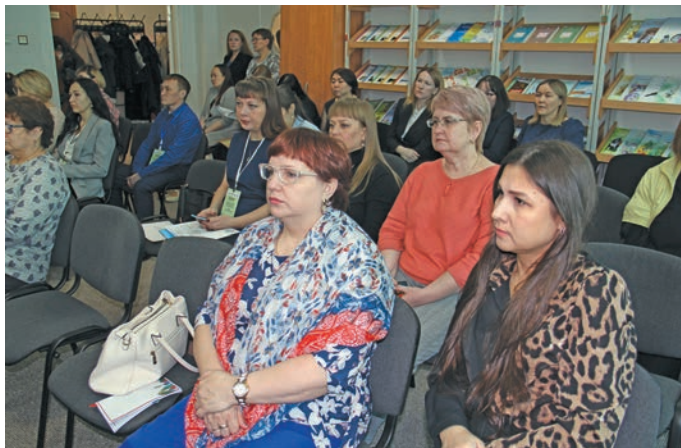
▲ Мирхотн вәлум няврем вәндтәты неңәт

Сырья дыв елпелн Ас-угорской институт кәшә не Виктория Сподина йм вүщә па айкеләң ясаң тәс. Лүв лупәс, хуты тәм йисн хәнты муй па вухаль мирңән ясаңтн шеңк шимл хәннехә путәртәл. Щи пәта ин дыв ясеңл айдыева иса юремәты веритләт. Тәмхәтл округ луватн хәнты па вухаль ясаңа, литература па культура айләт әх сыр-сыр ай кәртәтн па вән вошәтн вәндтәты хәннехуятәт ийха юхәтсәт. Институтәв хушә вәдты научной рәпатнекәт ши верләл олаңән сыр-сыр айкеләт уша павәтсәт, мәта ут унтасәлн нәмәсты питсәт, муй ширн ши нявремәт вәндтәты хәннехуятәт елды вәдты ширәтн нәтты рәхл, дәлн рәт мир ясаңт елды ал юремәты.