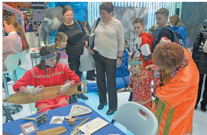
Вэйтантупсы пурайн. П. Молданов верум хур