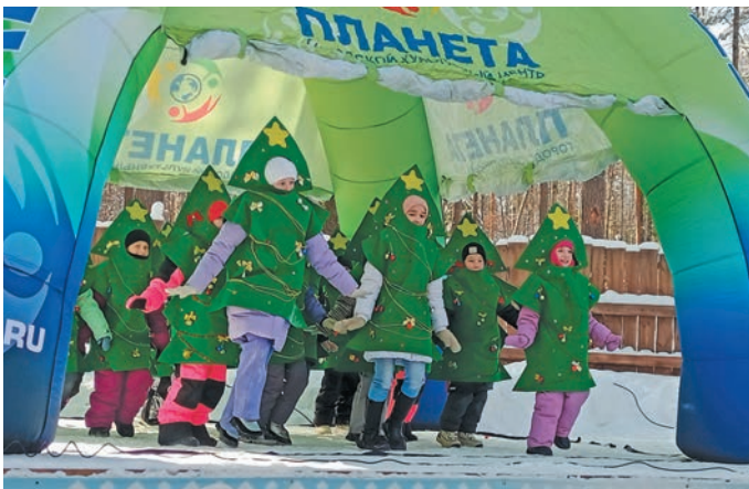
▲ «Жемчужинка» немпи тЌхи нявремЌт яксЌт