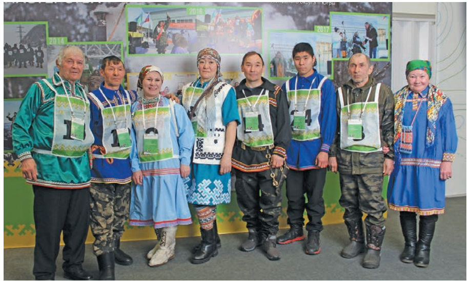
Касум вош вӱдең ӛх