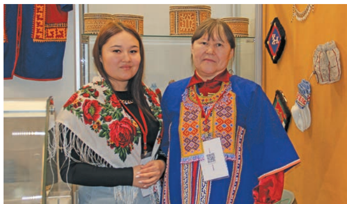
▲ М.И. Игишева Лола хиднеңал пида. В. Енов вююм хур

Юхи хашум олэв суханты кемн ван хатлуп тылэщ нивалмит хатл вүш эвэлт хэлум хатл мар «Товары земли Югорской» немуп арсыр летутат, пурмасат, дэматсухат тынесты-лэтасты хэр ёмвошн манс.