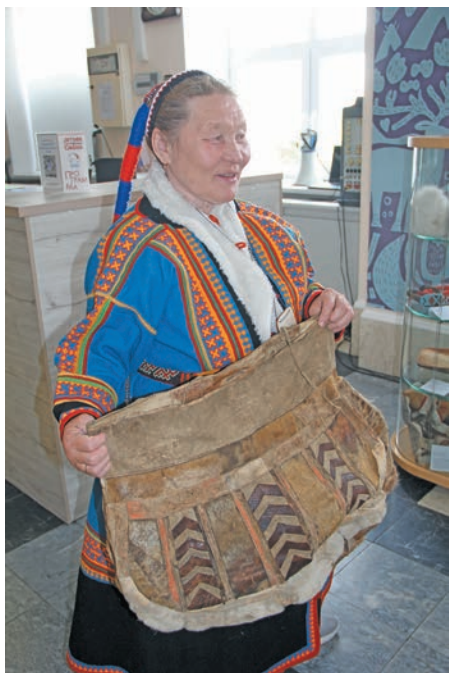
Иис пурмăсаң ачисупсы верум не К.Х. Вануйто катра ёнтум юрн хирал ванлтл

Ёмаңхатл поридаты хатлэт пураитн араттелн Ямал округ па сыр-сыр па мўвэт эвэлт ийха 300 мултаскем ханнехэ юхтылдс. Щиты юрнэт па хантэт, селькупэт па саранэт Лорвош, Красноселькупской, Ямальской, Приуральской, Надымской, Пуровской районэт па Пулңавэт, Надым, Лапэтнаңк вошат эвэлт ийха юхтылдсэт. Ёмаңхатл лэщатум пураитн щата арсыр шуши мират хурамәң якты-ариты хотат версат, пурмăсаң-ләмәтсухаң лэтасты па тынесты хәрәт пүншийдсат, ванлтупсэт версат.