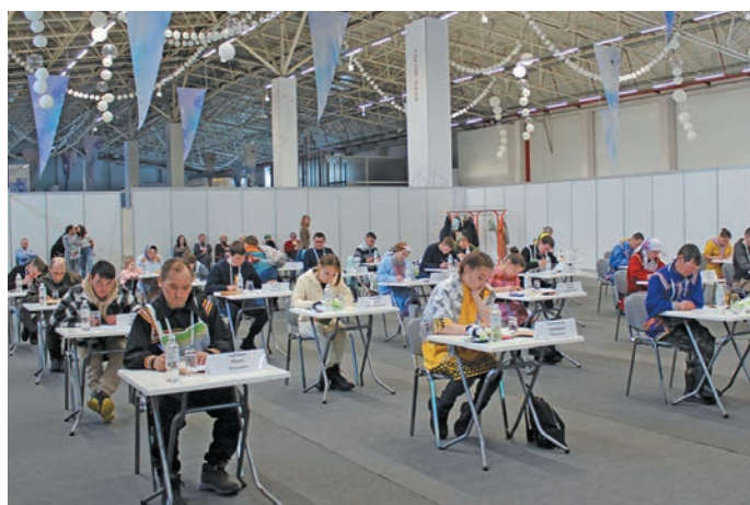
Олаңмит хәтлән иньщасупсәта мосты ясаң хәншләт

омасман вәсәт. Лыв щата хәнты мир летут леты, ләмәтсүх ләмәтты па щиты хур вўты, хәнты мир йис вәлупсы олаңән уша паватты щир тәйсәт.