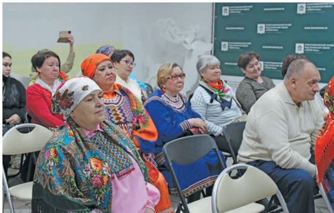
^ Вэйтантупсыя юхтум мойң мир. Н. Вах верум хурңан