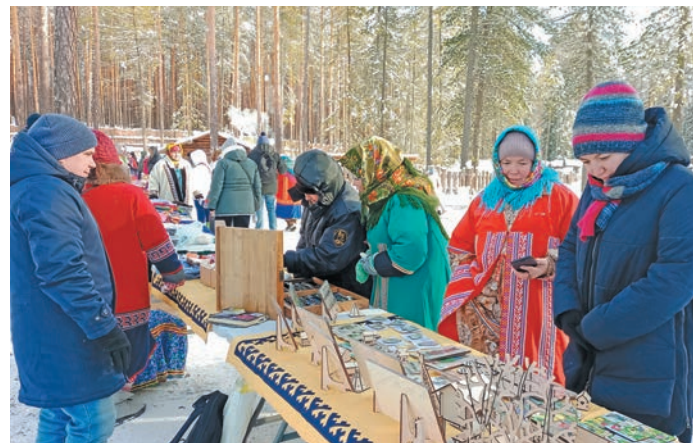
▲ Тынесты хЌр рЌпитЌс. Л. Гурьева верум хурЌт