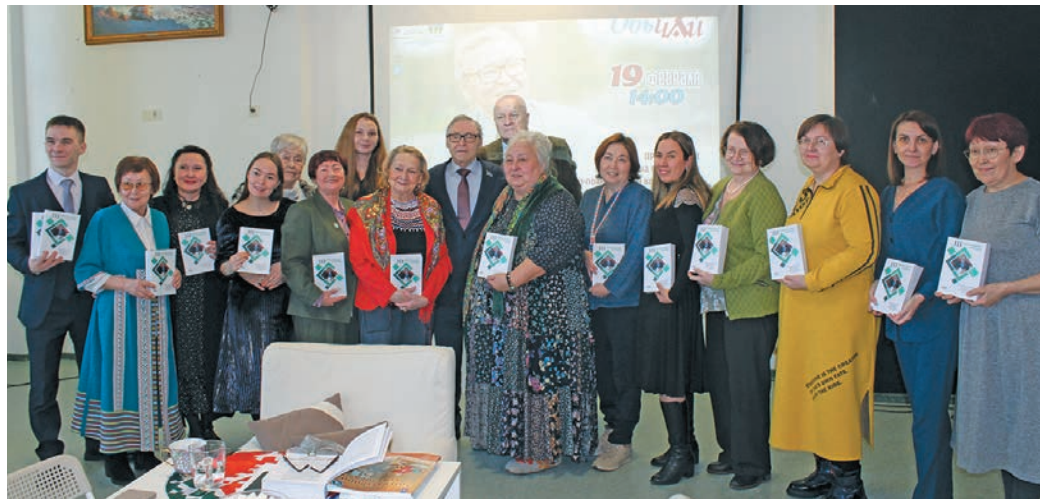
Мирхота юхтум мойң ёх. Н. Рагимова верум хурңән

Мәһнүм 2023-мит олн Манстәр районән Уньюган кәртән хәлмит пұш «Айпинские чтения» немпи мирхот мәнәс. Щәта учёнойт, нявремәт вәндтәты ёх па пушхәт научной непека́т лўңәтсәт. Ин щи непека́т киникайн есәлдсийт. Тәндлуп тыл҃әщ 19-мит хәтлән Ёмвошн щи киника мира вантәсы.