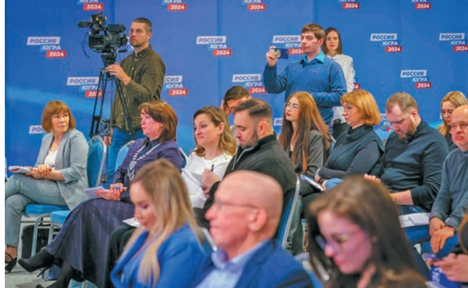
▲ Вәйтантупсыя юхтум хуятәт