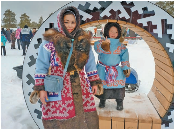
▲ В.В. Вылла пухл пида

Ашкола юпийн Виктория Викторевна Муравленко вошн техникумн вэнлтылс, щалта щата интернатн воспитателя рэпитас.