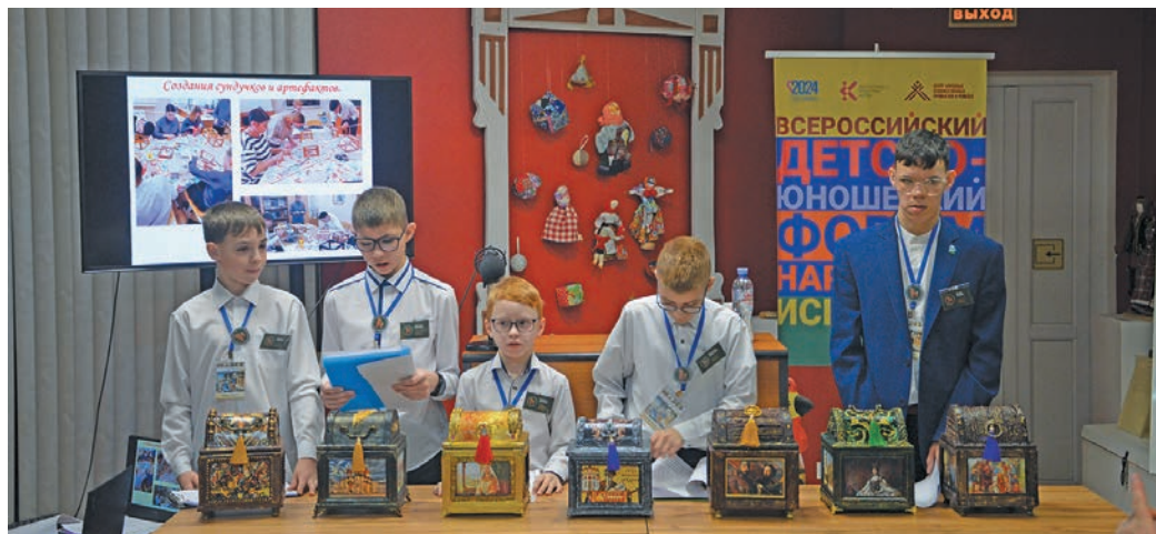
▲ Нявремат аќтупсийн рэпитлат. П. Молданов верум хур

Ёмвошн ай кер тыдэщн 28-29-мит хатлэнан ремеслайт центр хот хуца Россия луват аќтупсы вэс. Тата йис верат верты нявремат па айлат ёх аќтупсы. Иса аќтупсийн 150-кем няврем вэс, итэхат там воша юхатсат, итэх нявремат па карты щуќкат мухты путартсат.