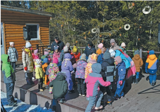
Няврёмѧ тыхѧл верлѧт