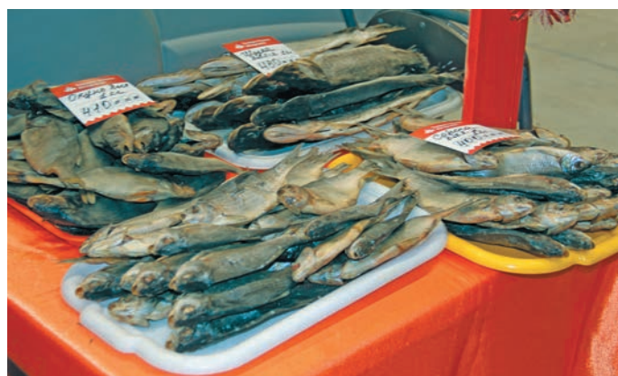
▲ Тынесты хәрн вәлүм әл хўләт

есум йиңкәт верлүв, мис вуй па сыр-сыр летутәт ләщәтлүв. Щәлта ай мисәт ищи нюхия ин енмәллүв. Пәрәщ нюхи кашәң пўш ищиты арсыр тәхет эвәлт па мўңев мосты арат ләтлүв. Катра пурайн совхоз хуща ищи пәрщәт енмәлсүв па әхәт щи вер иса нух вулытсүв. Вантә, дыв пурайн иса мулты вевтам мәшәтн юхәтлдыйт. Ма щиремн, щи пәрәщ вой енмәлты рәпата – щит шеңк лавәртәң па щухласәң вер.