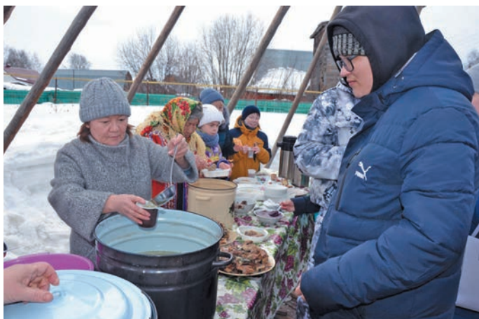
МойЌ ёх хошум йицкЌн лЌпЌтлЌйт