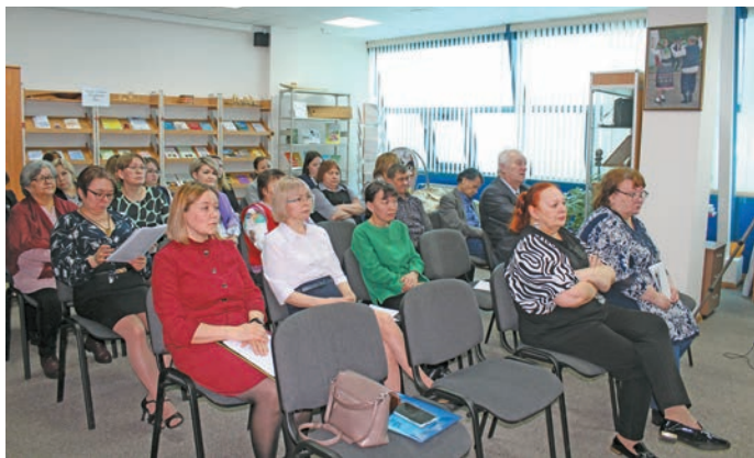
▲ Мирхота а́кмум ё́х. Л. Гурьева ве́рум хур

Там пўш вэн мирхот «Ёмвош округевн там йисн йилуп щирн рэ́т яса́ңа па литерату́ра я вэ́ндта́ты вер» нем тайс. Мирхот кэ́тсыр щирн лэ́щэ́тман вэс: очной па онлайн щирн. Ийха лўна́тты ки, соткем хуят ши мирхот вантса́т, щит эва́лт 50 хуят онлайн щирн. Щит Ю́гра, Яма́л, Мари́й Э́л Респу́блика, Санкт-Петербу́рг вош, Ленинградской о́бласть эва́лт ханнехуя́тэ.