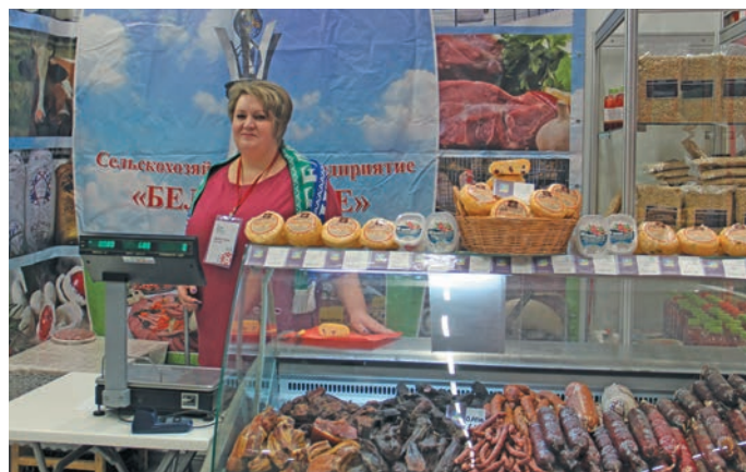
▲ Д.И. Видеман. В. Енов верум хурңән

Мет олаңән, вантә, вўды нюхи, хотәң вой нюхи, пәрәщ нюхи, щәлта па щижкүрек нюхи. Тәмхәтл совхозсәв хуща әнтә тәп карәң пушәх верлүв, мўң худна бройлер немуп щижкүрекәт нюхия енмәллүв. Вўды нюхи па тәта Касум вош вўды тәщәң тәхи эвәлт иса кашәң ол мәр мўңев мосты араткем ләтлүв. Хотәң вой, вантә, мўң ямкем ар енмәллүв. Тәп ин мўң хущева 180-кем пәсты мис тәйлүв. Щи пәта арсыр