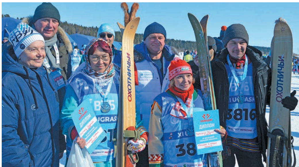
▲ Округ кэца нэ Н. Комарова шуши кэсты ёх пида. П. Молданов верум хур