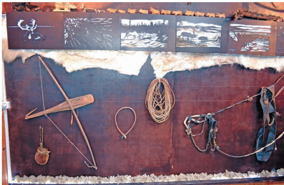
«Ма пӑнтэм» вандтупсы. Н. Вах верум хурӑн