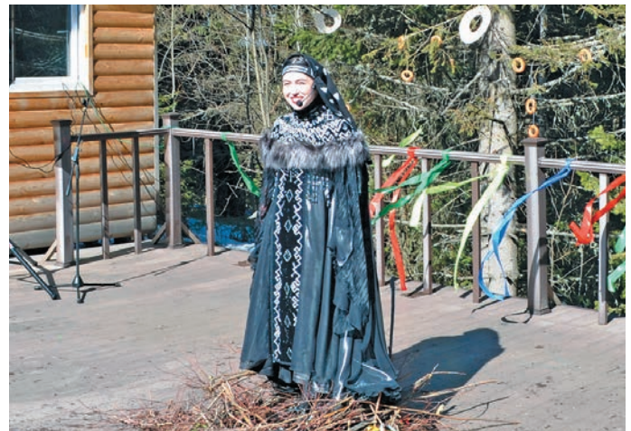
Вурѧ имиев. Н. Вах верум хурѧт