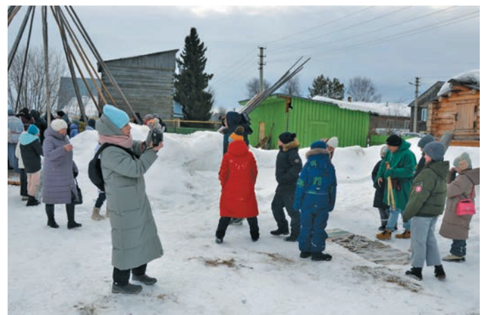
НявремЌт юнтлЌт. К. Супрун миом хурЌт