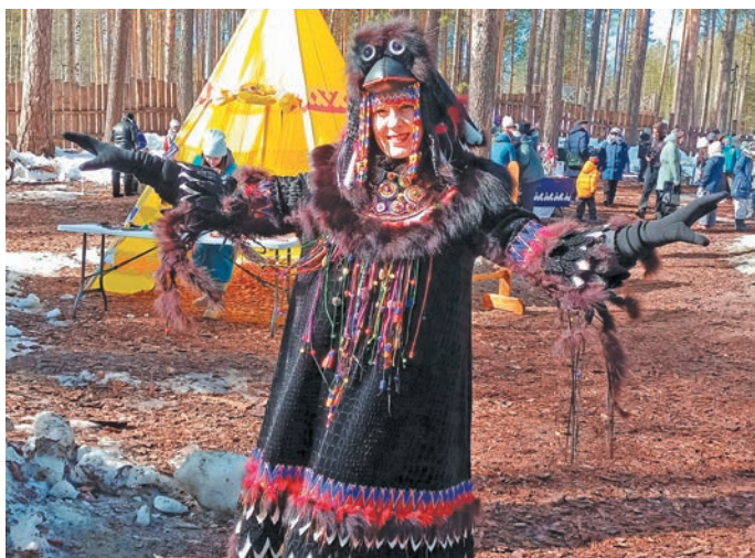
Вурґа ими юхтӑс