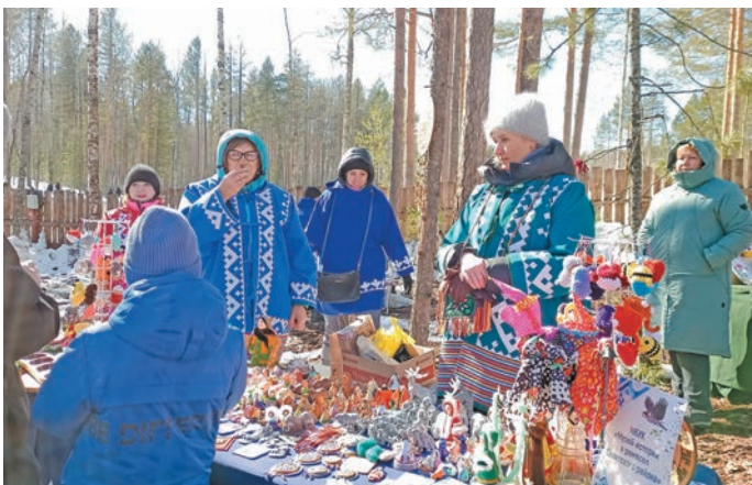
Тынесты хӑрӑт рӑпитсӑт. Л. Гурьева верум хурӑт

Хур вӑты щира вӑн вурґа мӑрк версы – кашӑґ хуята щӑта хӑр верты ӑмща вӑс. Ши тумпи ӗмӑхӑтлӑ юхтум мир хӑнты па вухаль мирӑґӑн еплӑґ, летутӑт лӑсӑт. Мира Вурґа ӗмӑхӑтл шеґк мӑстӑс.