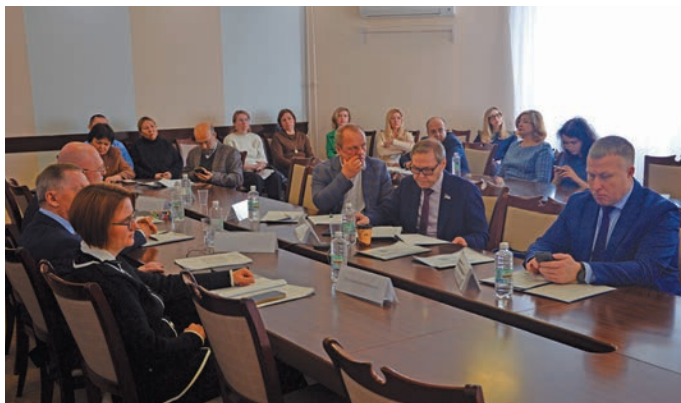
Мирхота юхтум хуятәт. П. Молданов верум хурнән

Щи верат олаңан путартты щира тыв арсыр тәхет эвалт мир ақумсәт, щит Россия Минобрнаука арсыр мўватн айлат ёх вәндтәти хәннәхәйт, поступсы лэщятты щира рәпитты ёх, сүтәт тәхийн рәпитты мир, Югра па Российской Федерация арсыр мўвн государственной па муниципальной тәхетн кәщя рәпитты ёх.