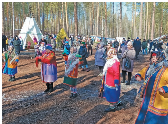
Вошӑґ па мойґ ӗх яклӑт