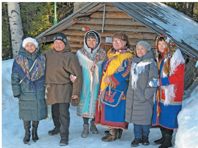
Увѧс мир хуятѧт ѳмѧнхѧтлѧн

» Вурѧ хѧтл ма пѧтема, щит хотѧн ѳх ѳмѧнхѧтл, няврёмѧт пѧта лѧщѧтты ѳмѧнхѧтл. Ма тѧм хѧтлѧн ѧнѧкем-ѧщѧм нѧмѧлмѧлум, хутыса юлн тѧм ѳмѧнхѧтл порылѧсѳв. ѧнѧкиѳм алѧн саты нух кил, еплѧн нянят верл, соламѧт кавѧрл. Щиты тѧм хѧтл постѧсѳв.