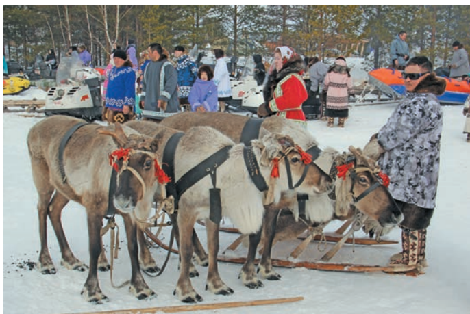
^ Вўдең хăннехуятăт кăсупсыя лэщăтыйлдăт

Щиты па хѣлмит ясăң Югра мўвев Дума хот депутатта па ивулапа «Лу-