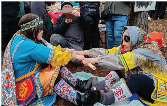
Неңӕт ӕр таллӕт

Шуши мир щирӕлн, ӕмӕнхӕтла ӕктӕшум мир еплӕн лӕтутӕтн лӕпӕтсыйт па шайн еньщлтӕсайт. Хӕл хошум йиңк кашӕн хӕннехӕ тӕта еньщты па лӕты веритӕс.