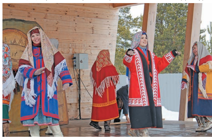
» «Хэтлые» немуп Ас-угорской театр эх ванлупсэт лэщэтлэт

Хэн «Вүлең па вой-хүл велпэс эх» эмэңхэтл елды версы, щипурайн кэртэң