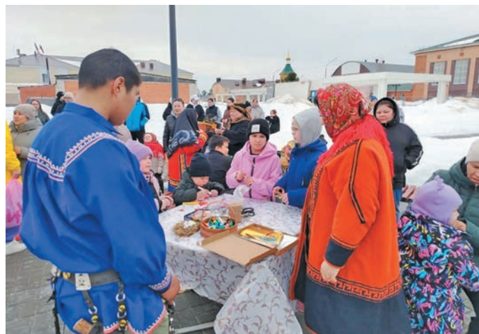
Касум кӑртӑн мир Вурҗа хӑтла юхӑтсӑт

Хӑнтӑт луплӑт: «Вурҗа сыры ки юхӑтл – щит тӑрмев тови пӗда щит пилт, еша вӑд морты мўв эвӑлт войт щит юхӑтлӑт». Вурҗа имев мўцева тови хошум тӑд. Тӑнӑл па тӑм ол Касума, Вўтвоша па Тӑрумлора мириева вурҗа имев ар няврӑм тӑс. Щит йм айкелӑт, хути мўң кӑртӑвн мирев кўтн аршӑк хӑннехӑя йис. Касум вошн ёмӑхӑтл пурайн мӑнум ол па тӑм ол сема питум ай пушхиет мойлупсӑтн мойлӑсыйт.