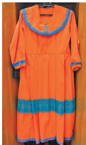
^ Лүв ёнтум хәнты ёрнас