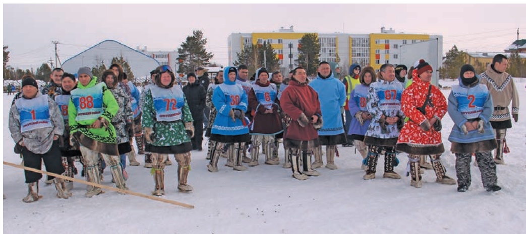
» Вүлең эх кэсупсы щирэт вантлэт. В. Енов верум хурэт

» Тэм йис хэнты эхлүв эмэңхэтл, кашаң пүй арсыр кэсты верэт түйңширэңа тата лэщэтлүйт, тыв юхэтты арсыр мир хэйт-неңэт күтэлн ямсыева па лэхсэңа вэллэт. Ма нэмэстемн, мәнэма тэмхэтл округевн вэлты шуши мирлүв эвэлт ям вүща ясаң Югра мүй правительствата тэхия, Сэрханл район па Русскинской кэртэв кэщаита, образования, культура мүй кэсупсы щирэт лэщэтты хотэртн