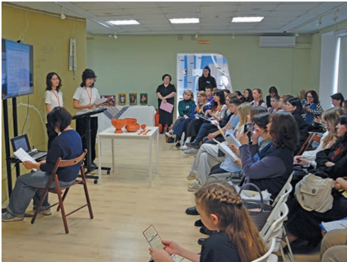
▲ Айлат эвет путәр тәләт П. Молданов верум хур

Ёмвошн ай кер тыдәщ 28-29-мит хәтлән ремёслайт Центр хот хуща Россия луват вәйтантупсы вәс, щит кашәң ол а́кәттә вәйтантупсы. Тәта йис верат верты нявремат па айлат ёх а́кумсәт.