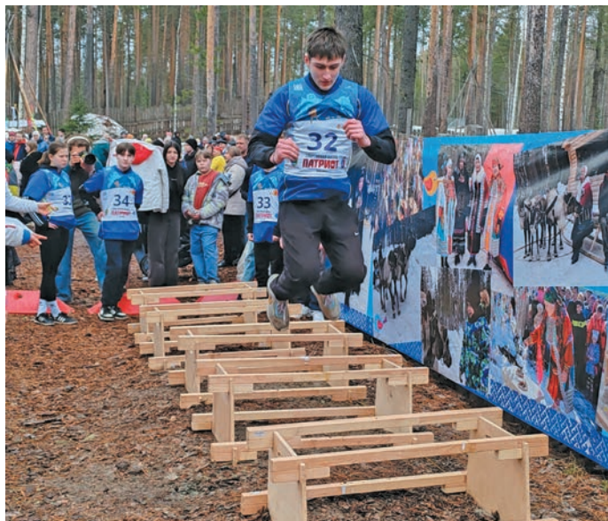
Мир юнтты па кӕсупсы хӕрӕтн

вӕсӕт. Нявремӕт тынщаң вала тӕхты вер ванлтӕсӕт, ай ӕхлӕт шӕпи навӕрсӕт, хӕва навӕрмӕты пиш па ванлтӕсӕт. Щӕлта нух питум нявремӕт ишӕк непекӕтн мойлӕдайт.