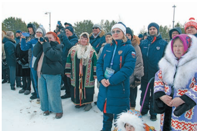
^ Ёмăңхăтла юхтум арсыр мир хăннехуятăт кăртăң хăры кўтупн