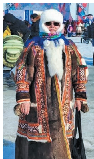
^ Лүв ёнтум сәхн