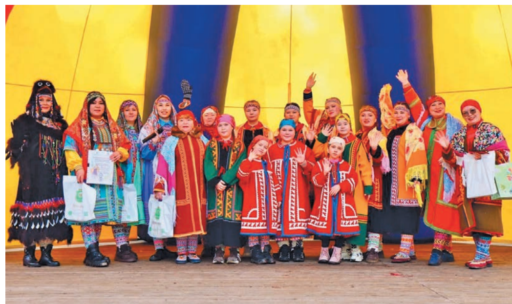
» «Увас хурамат» якты тахи нечат. Н. Есаулкова китум хур

» Худыева ханты мира ма китлум вуща ясач! Талана, яма валаты! «Вур- ца хятл» пида! Ин вурца юхатл, айдта товия щи йил. Вурцаен кертата юхатталн вент кертат кимлатн ян- хал. Мулды нянь шукат, харн шай еньщсан ки, мудты пул хайсан ки, щи вурцаен товия юхатталн, доньщ эвалт щи утлан елпа питлат, щи акатл. Талана, яма валаты, ху- дыева мирев! Худыева