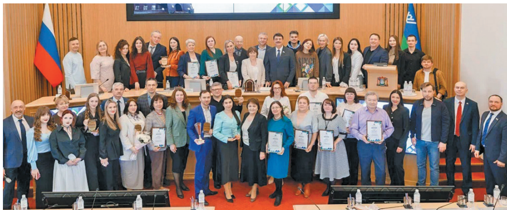
Кăсупсийн кăсум ёх. dumahmao.ru тăхи хур

Тăмăщ ар хурасуп мирев ийха кăсты тăхи – щит вера ям. Щăта щи щира