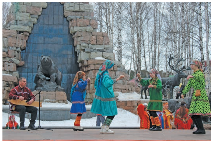
^ «Моньщ ёх» эвиет яксӑт. Л. Гурьева верум хурӑт