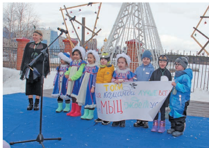
«Тови хоттел ёх» па кёсупсийн лывел ванлётёлт

мир пурмёсён ванлупсёт тумпийн ёма лёлпётёлт-ёншёлтёлт, хётл этна пёлка питёлт кемн юхлы пёлы воша тёлт.