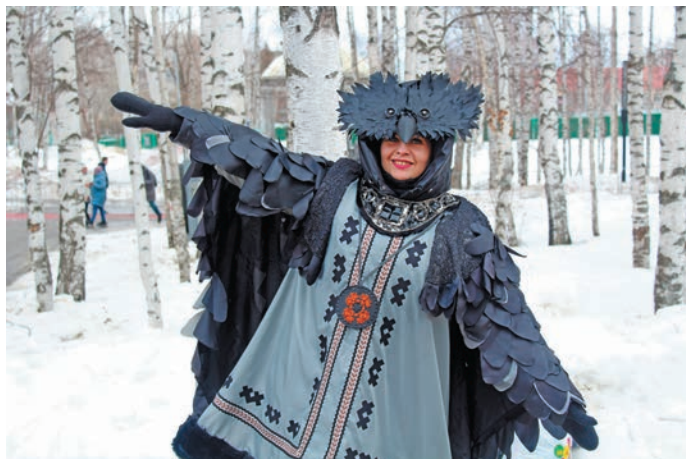
^ Вурҥа имиев юхтӑс...