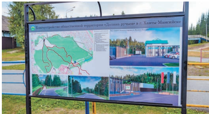
▲ фото: gov.admhmao.ru

Тәм пўш тәм верн 16 муниципальной тәхи эвәлт вошәтн 42 оса тәхи ләщәтлы. Щит Излучинск, Когалым, Лаңки пос, Лянтор, Мегион, Нефтеюганск, Нижневартовск, Нягань, Пыть-Ях, Радужный, Советский, Сәрханл, Урай, Ёмвош,