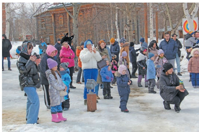
Сэрханл вошён сыр-сыр мирён хэннехуятёт ёмёхётёлн