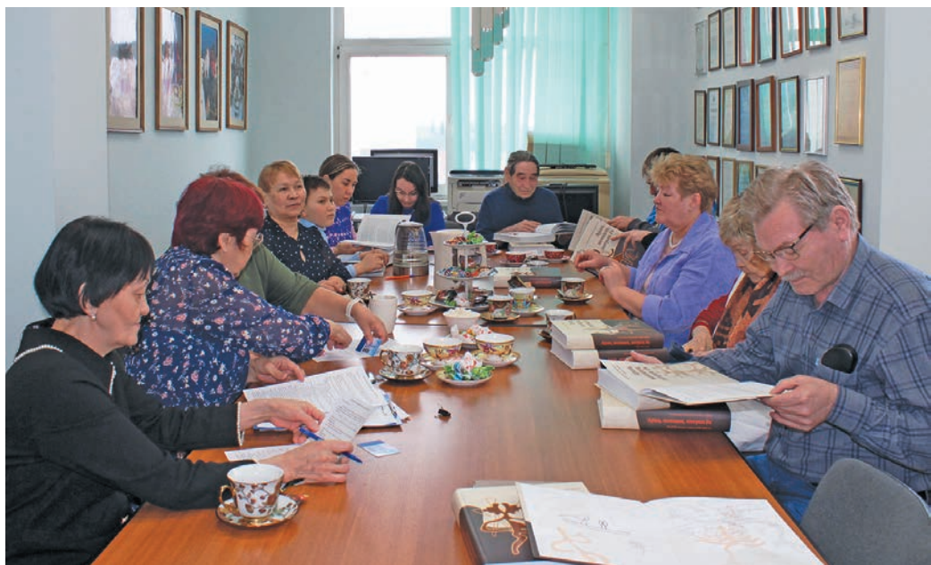
Югра мӑв хӑншты ӑх ӑкӑтсӑт. Л. Гурьева верум хурґӑн

Ям арат ол тӑм вӑн киника лӑщӑтты олӑнт- мемн ма ӑн па вӑсем, муйсӑр лавӑрт рӑпата. Мӑнема нӑтты ӑха па рӑт хӑнты ясӑевн хӑншты ӑха вӑн пӑмаципа ястӑлум.