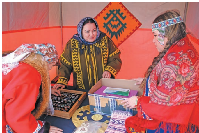
Сэрханл шуши мирёт тэхийн рэпитты неёт ай пурмёсыет тыныты хёр версёт. В. Енов верум хурёт

Лыв «Юганская этно-деревня» кёрта ёнхты мойлупсийн катлуптёсёлт, хуты арсыр шуши