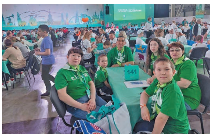
Н. Яркина китум хурат

Әмәщ, хуты касупсыя юхтум кашаң хоттел ғх хуцатәпхәтхәннехәвәнты ра́хәс ма́нты. Яркина́т-Отшамова́т-Миляхова́т хоттел ғх хуца та́лаң яң хуят вәс. Щит: