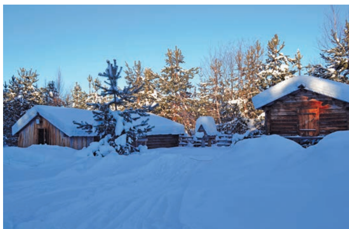
▲ Касум музей тәхийн. Н. Вах верум хур

Екатерина әшкола етшуптумад юпийн Ялуторовск воша дётут кавәртты неңа вәндтйлдты мәнәс. Щәлдта кәртәда юхлы кердәс, Касум кәртәң әшколайн дётутәт кавәртты неңа рәпитты питәс.