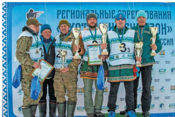
▲ Нымәлн кәсты хуятәт