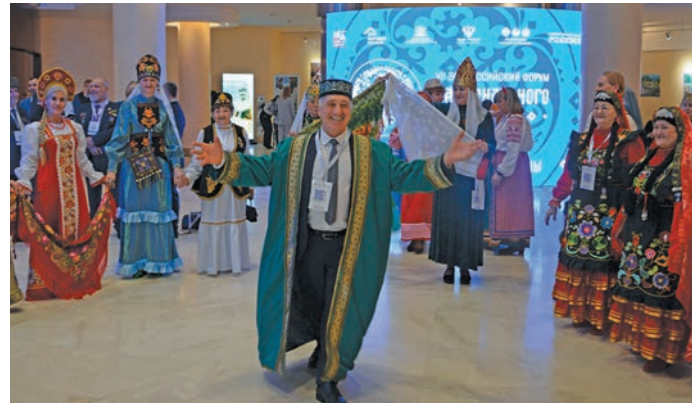
А́рсыр мират я́ха актэщийлды́т

Кимат хатлан атэлт та́хетн вэнлтыйлды щир хара́т верантсайт, щата путартсат, муй вўрн йилпа енумты