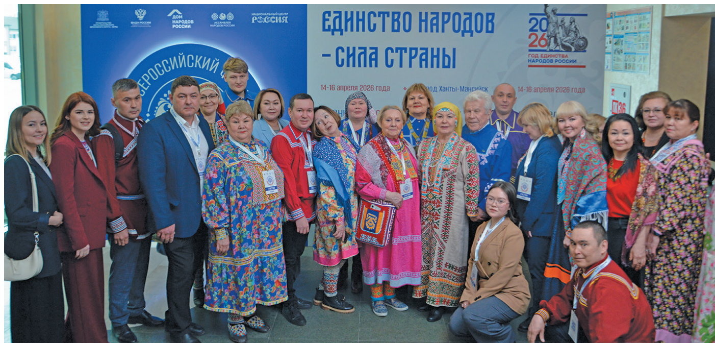
➤ Шуши мирлӱв мирхота юхӑтсӑт

Вэн кер тылӑщн 14-мит хӑтл вӱш эвӑлт па 16-мит хӑтл вӑнта Ёмвошн мирев ийха пилтӑщман вӑлты щира верум VII-мит Всероссийской ӑктупсы вӑс. Щит мӱвев луват вэн вӑйтантупсы, тӑм тӑхия вэн кӑща ӗхлӱв, учёной щира вӑлты мирев, ӗх пида рӑпитты хӑннехуятлӱв па кашӑн мирев тӑйты вэн непекӑн ӗх ӑкумсӑт.