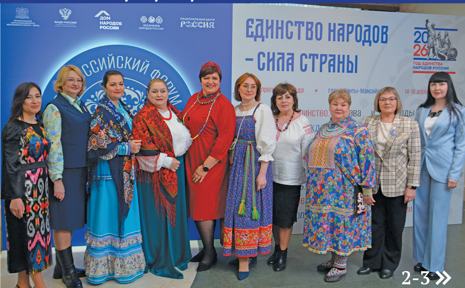
Ёмвошн арсыр мирәт йаха пилтәйщәтман вәлты щира Россия мўвтед VII-мит айтупсы вәс. П. Молданов вөрүм хур