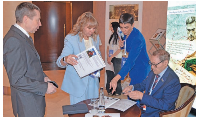
Е.Д. Айпин киникайл ванлтэл. П. Молданов верум хурат

нявремата па айлат ё́ха мирев йис верат вэнлтаты па щир та́хета хушты. Хэ́н арсыр мирев вэлупсы вэнлтыйлды питлайт, щирн щир йис верат айлат ё́х вўша юхатлдат.