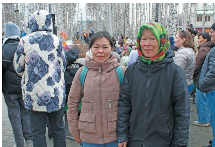
» Татьяна Ивановна Лозямова Вера эвел пилла