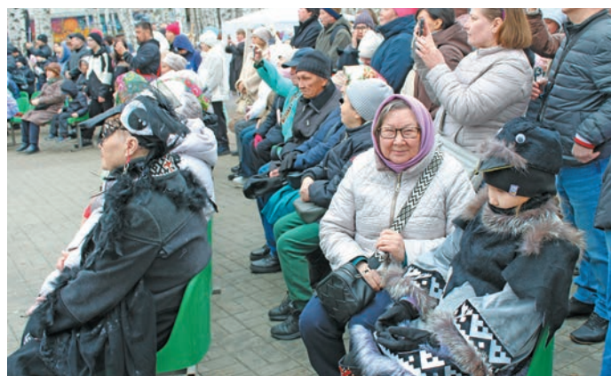
Етн хот вантты юхЌтсЌт. Н. Рагимова верум хурЌт

» Ин ма ЫемЌЌ мЃвн щи вЌллум, пирЌщ вЃлылЌм – ма хущЌма. ПухЌЌлам ищи