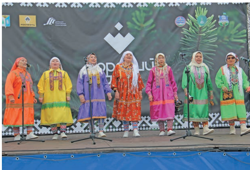
» «Сорни най» җкты-ариты хот неҗҗт. В. Енов верум хурҗт

Ёмҗхҗтлҗ «Сорни най» немуп җкты-ариты тҗхи