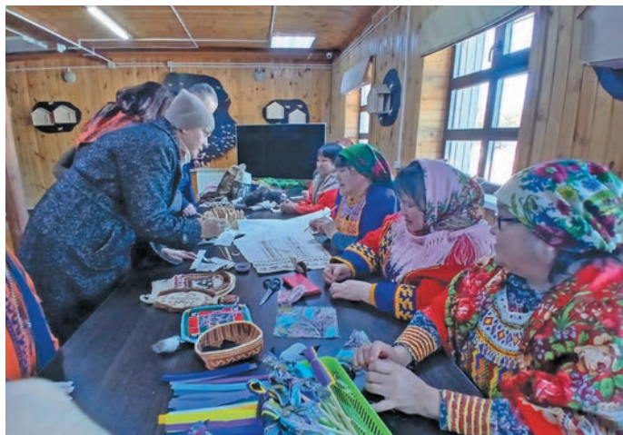
Мойң ёх Касум воша яңхсәт