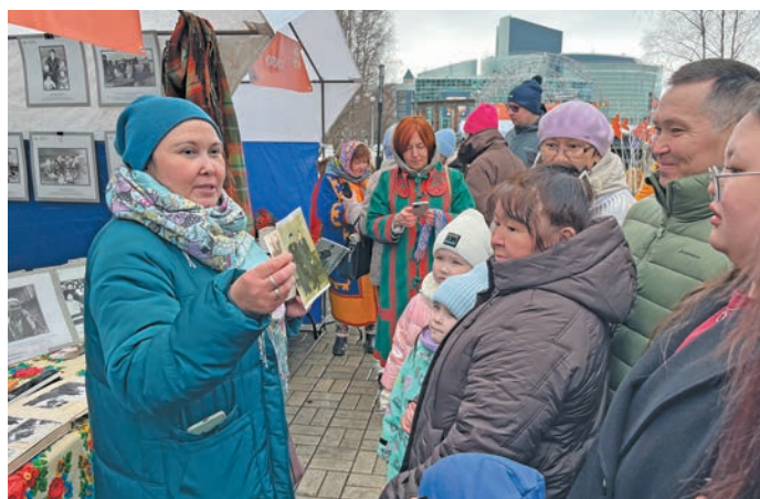
» А.Р. Иштимирова-Посохова ТуевЌт рЌт ёха ванлтум хурЌт олЌґн путЌртЌл

Округ мир творчества хотн па «Почта России» хуща рЌпитты ёх тЌм олн «Кар-Кард» немпи кЌсупсы лЌщЌтсЌт. Тыв 333 вохты непекаґ китсы, щит Югра мЃвев 18 вош, Москва па Ёкатеринбург