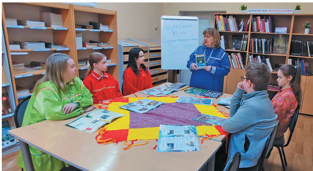
▲ А.А. Горлова айдат ех оса верәт тәты вәндтәйлдәт

«Увәс тәрүм түт етәр» – щимәщ тәхи, хута йис вәлупсы па тәм пура