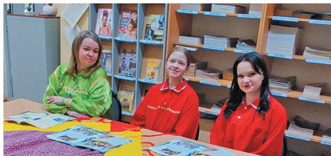
▲ Айдат ех мирхотн

«Увәс тәрүм түт етәр» немпи моньщәң, непек пә-