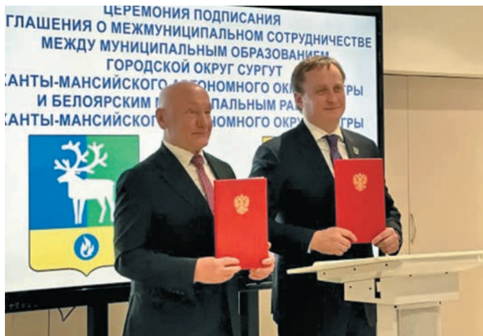
Кэщайңан кашащты непекн ёш пос пунсаңан