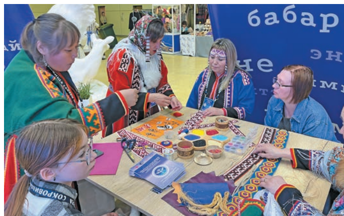
Мойн јх арсыр мирјт јйс верјта вјнлтјсыйт

эвјлт тыв юхјтсўв, кјт јурн хот тјсўв. И јурн хотн тјта лјтут кавјртлўв, кимит јурн хотн сјран па вухалъ мир вјлупсы ванлтјлўв. Шјта ис јса мосты пурмјсјт вјллјт – кјр, пјсанјт, дэмјтсух, јунтутјт, анјт-сјнјт, јхјл. Шциты кашјн хјннехј уша павјтл, хутыса мўн мирев вўлјт дјвјлман вјллјт. Мўн тјл јш хўват ис јс пурмјслўв Ёмвоша тјтљясўв, шјлтл Москва воша вјн машинјн. Мўн нюхи, хўл па па ис јса мосты лјтут тыв иши тјсўв, тјта кавјртлўв.