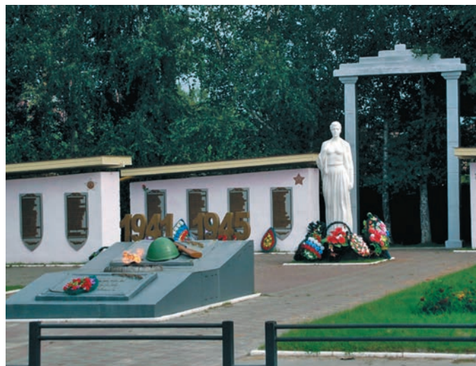
Сүмәтвошн даль хәрн ухдал пунум ёх пәта лэщәтум кев хурасәт