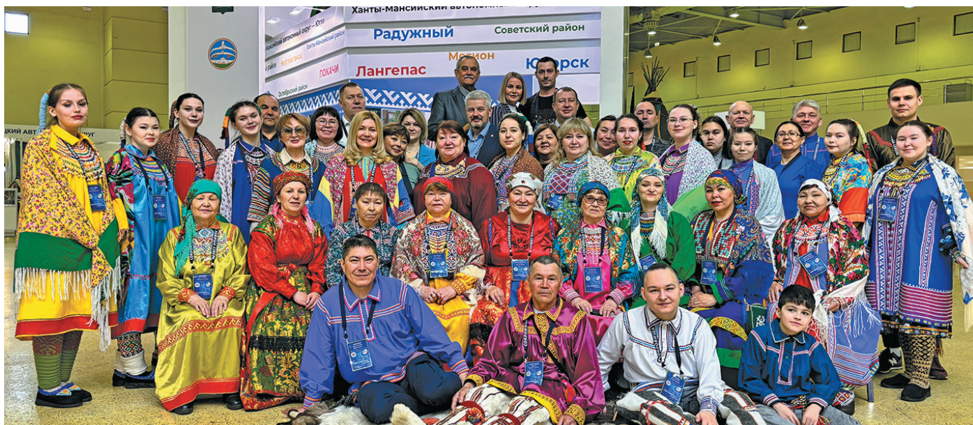
Югра мўвев эвЌлт «Сокровища Севера» ванлтупсыя юхтум ёх

ТЌм ванЌн Москва вошн «Экспоцентр» немуп тЌхийн XIX-мит пўш «Сокровища Севера» немпи ванлтупсы вЌс. Тыв Россияевн вЌлты УвЌс мўв, Сибирь па Дальний Восток мўвЌт эвЌлт арсыр мирЌт юхтыйлсЌт – щит Алтай, СЌран, Карелия, Тыва, Удмуртия па па мўвЌт ёх. Лыв мирлЌл йис вЌлупсы, культура верлЌл ванлтЌсЌт.