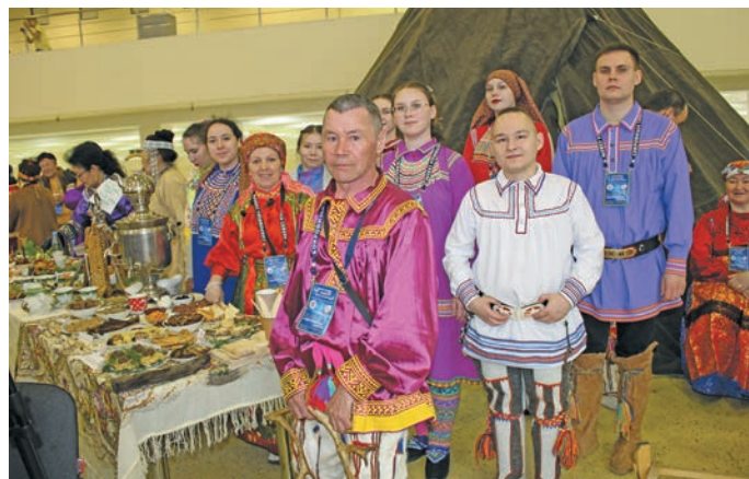
Сјран мир лјтут ванлтјсы. Н. Рагимова верум хурнјн