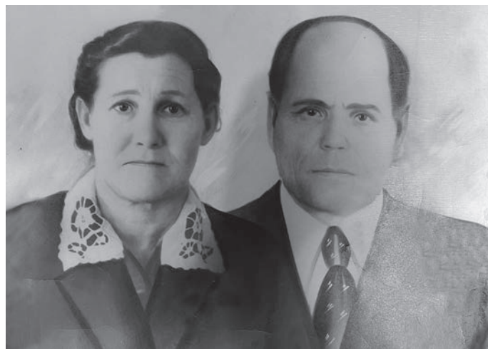
В.Г. Плеханов имел пида

Ас нопатты тылащ 1942- мит олн дая мәнты щира мет сыры Омск воша юхтас, тата связиста вәңлтылас. Щәлта вәщ тылащ 1942- мит ол вўш эвәлт «Рабоче- крестьянская Красная армия» (РККА) немасыя увас мир дивизияйн Сталинград вош эвәлт вуракат вошитас, әхәт Курской дуга хуца та- рәңләс, юхи хәщум артән па хон пелак Венгрия мўв Будапешт хон вошн