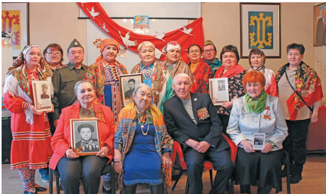
^ Етнхота ақтәшум ёх