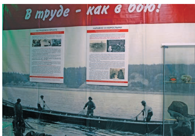
Н. Вах верум хурӑт

тӑхи па па ар тӑхет рӑпитсӑт. Иса мир мӑң мӑвев фашистӑт ӕхтыйн нух питты пӑта ӕрлал, ӑн шалитсӑт, атл-хӑтл арсыр тӑхетн кӑпӑртсӑт.