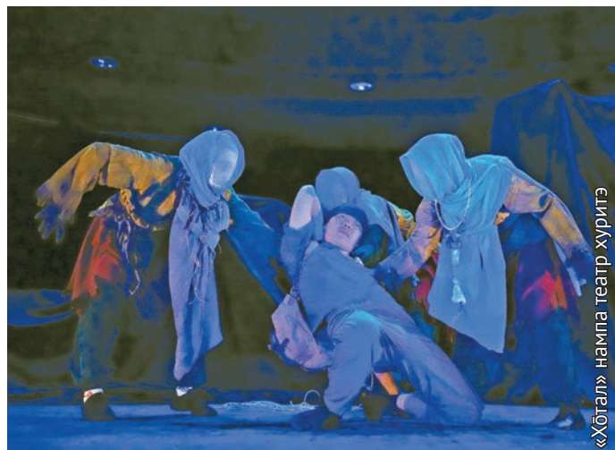
«Хотал» напта театр хуритэ

Нуми Төрумн пиным ёре тавён мощщга ёмтыс, тав мот уйхулыт пилатолункве патыс. Хотрохтуптахтын уйит танки ёраныл тавён вос мыганыл. Тащирыл пуссын ала ты халмалтахтасыт. Тувыл