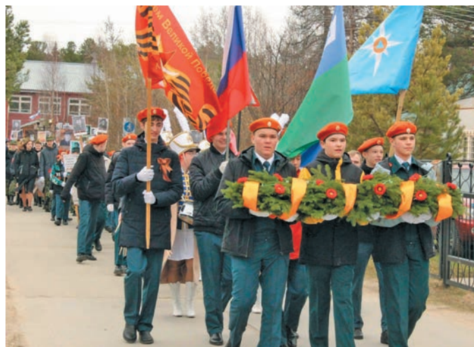
Сārтын школат ханищтахтын пыгыт емѣгыт

Элалы ялпың хӧтал сыв сāvсыр каснэ вāрмалит ос мастер-классыт ӧлсыт. Тувыл Фортуна колт «По приказу совести» ос «Мы из будущего» нампа