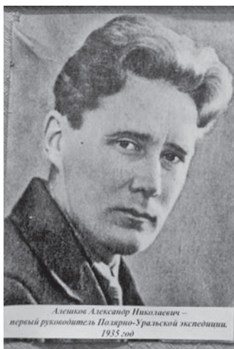
Александр Александрович – первый руководитель Полярно-Уральской экспедиции, 1935 год

Саранпавылт рупитам экспедиция нёр ахвтасыт осн-винэ йильпи мät хөнтсыт: Омега-Шор, Зейка, Хусь-ойка, Централь-