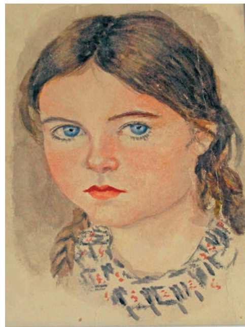
Сургут ус агирищ пӧслыстэ. 1952 тӧл

Я ңк нӧтнэ этпос 18 щислат музей-колывт янытлан мирхал хӧтал ӧлыс. Ты ялпың хӧтал кастыл Ханты-Мансийск уст «Геннадий Райшев. Графика. Избранное» намп суссылтап рӯпитаңкве ӧвылтахтас. Ханты ӧйка 1960-2000 тӧлытт хаснэйывыл ос ӧльпыл пӧслум хуриянэ ань выставкан акван-атвёсыт.