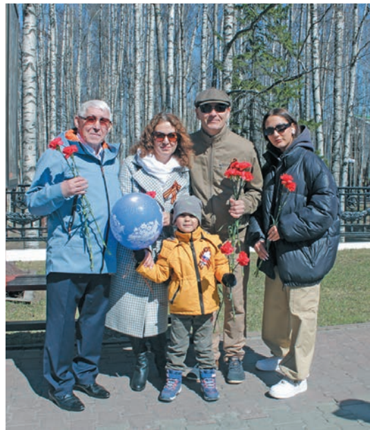
Д.В. Лельхов агитэ, вәпсэ ос апыгрищаге

луңкве ялсыт. Ветера- ныт кәсың колтәгылт өл- сыт. Ам война юи-пәлт самын патсум, улпыл лов тәлум өлыс, номилум, төнт мән, нәврамыт, хөнтлын мәныл эхтум хөтпат эт потыртасүв, та пылщмаң пора урыл китыглахтасүв.