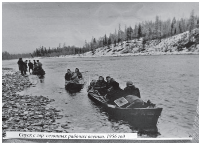
Спуск с гор сезонных рабочих осенью, 1956 год