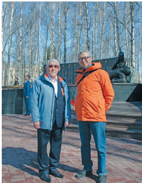
Д.В. Лельхов ос Виталий пыге

– Атям рүт щирыл Ярлиныт, омам щирыл Лельховыт хөнтлын мән вāt арыг хөтпа тотвэсыт. Төваныл тот хөт тыпсыт, порслувэсыт, төваныл сакватавэсыт, юв эхта- ласыт, нюлмияныл савал- сыт. Новинские пәвыл- ныл мәнәщи щемьятыл Тынзяновыт, Анимовыт, Ярлиныт, Яркиныт хөнт-