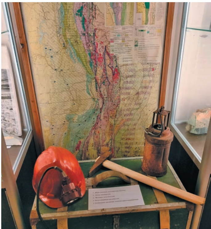
Геологыт рүпитам пормасыт

ный Поток, Стеклоанное поле ос Верхний Парнук. Ханты-Мансийский округ комитет кўшаит ты экспедиция-колыл туп 1958 тәлт пүмчалахтуңкве патсыт. Ты элы-пәлт экспедиция рүпитан махум 1956 тәлт мус Москва пәлыл сәвсыр кўшаитн аква уральтавәсыт, тувыл геология Министерстван уш паттувәсыт. 23 ювле хульгум тәлыт сыс округт тот нәматыр ваңкве ат тәртвәсыт.