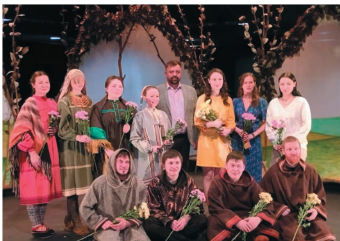
«Дар Торуума» суссылтан хотпат