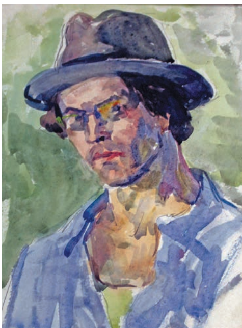
Г. Райшев таквинатэ пӧслыс. 1960 тӧл