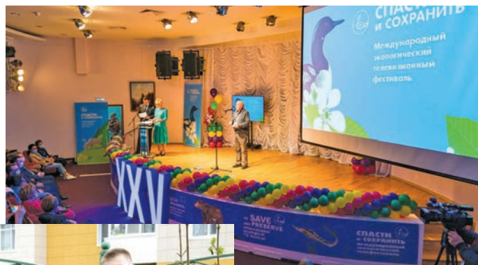
Кина суссылтан фестиваль

Ты хәталыт миннә порат мәньлат мәхум сәвсыр проектит тәстысыт. Лүпта әтпос бөвил хәтал-