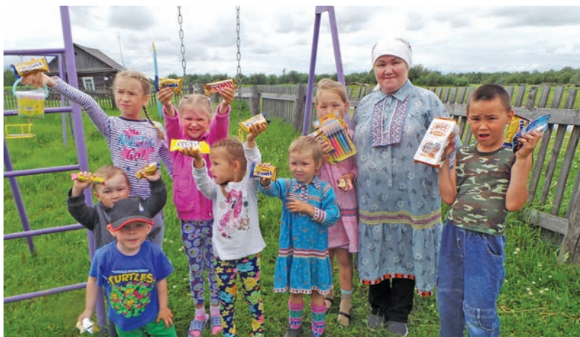
Колтагыл мүйлупсал майвёсыт

Екатерина Жукова ос тав ётэ рупитан махманэ яныг, эрнэ рупата вәрёгыт. Нъяврамыт йильпи маснудыт, мүйлупсал ёвтыяныл ос тыщирыл сәв щәгт тәнанылн тотэгыт.