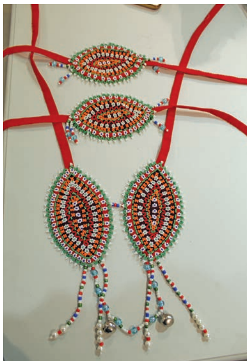
Атын вәрнэ хорам