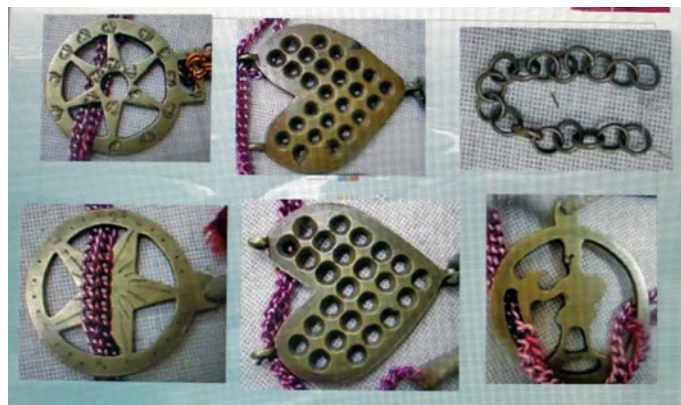
Тамле кӧрыт сагын тагатавет

Мӧньщит ос ханты пуҗканыл ос ӧтаныл ӧргалӧлнӧ мӧгыс сагыл сагыглавӧсыт. Ты ӧти нас сагыг, ӧвлӧт ӧтыт котлӧныл киттыг тӧрамтыяныл, тувыл саг квӧлгыг сагавег, руц щирьл тӧн «накосникыг» лӧвавет. Тув сӧвсыр кӧр лӧквыт тагатавет, тох ӧлумхӧлас ӧмщакв ӧргалаҗке