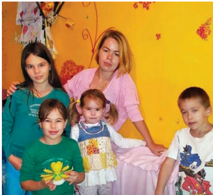
Ника нявраманэ ёт послым олы, Израиль

Ендыревыт ат касашасыт. Тав щакван ос атянэн янмалтавес. Витя ос ман палтув олыс.