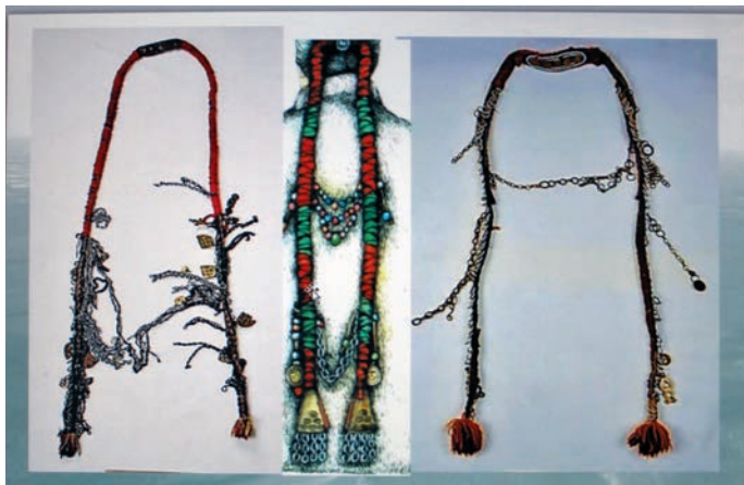
Ты сагыт Тэк павылт Е.Г. Федорова пöслысанэ