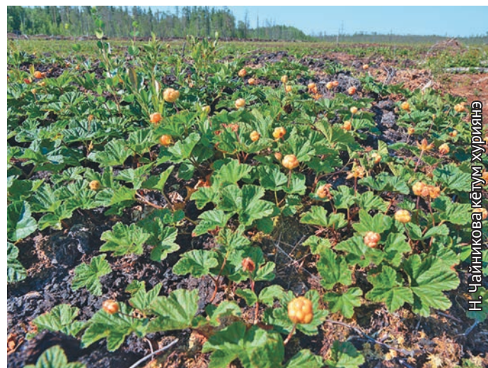
Морах пилыт яныгмасыт