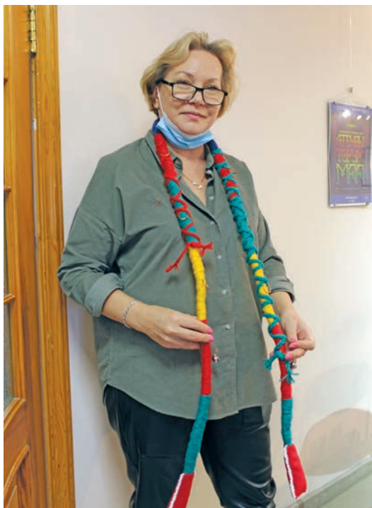
С.А. Харитоновна сагыг суссылты

Ам рүтанум пуссын тувыл өлэгыт. Төнт номылматсум, пёс порат мәхманум насати тамле