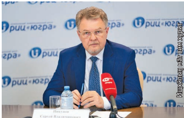
Ищйпың мәтвим хуриг