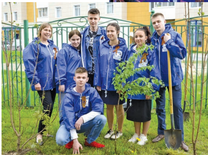
Ййвыт ұнттум мәньлат әгит-пыгыт