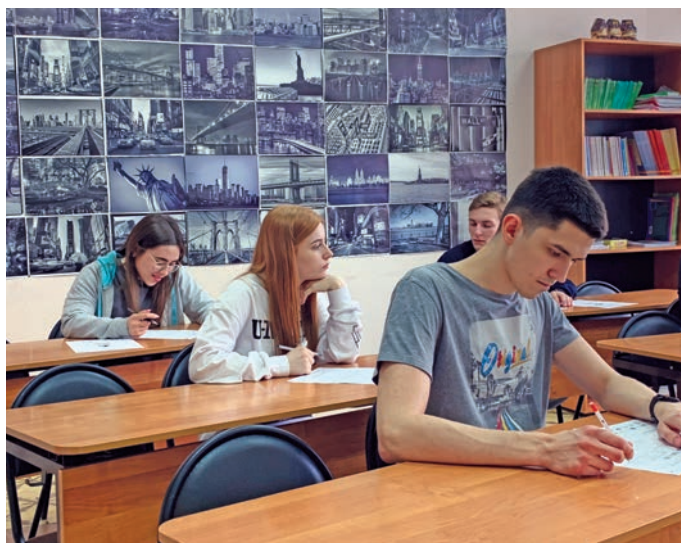
Хулюмсүнт пәвыл 11 классыт ханищтахтам нъяврамыт

Мән округув янытыл ань 9 класс 656 сосса нъяврамыт а́стласыт, 11 класс – 343 агит, пыгыт. Тән пуссын «региональный перечень профессий» нампа нэпак щирыл элаль ханищтахтуңкве ань вөрмөгыт.