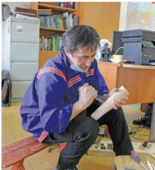
Я.Н. Тарлин сыпаль вэри

Ам пёс тэлат овылтыт акваг пумшалахтэгум, матыр-ати катыл вэрэгум.