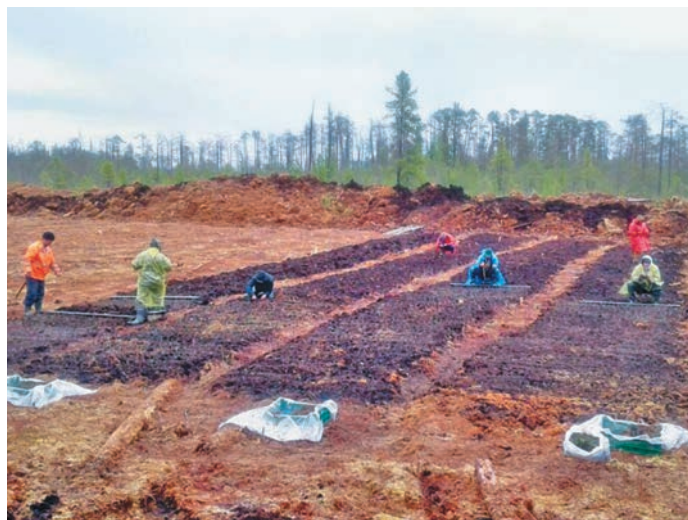
Саңквлыпил тārсыт үнттувёсыт