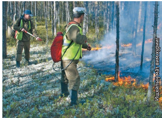
Ищхыпың мят вим хурииг

Октябрьский район Малый Атлым павыл пөхыт акв хум матыр вәриматэ вөр нөх-пёламтастэ. Ты най вөр хосыт минас, павылн ёхтыс. Тот ампарыт ос акв өлнэ кол найн ёсвёсыт. Ань тав полициян хөнтвес, ты бвыл вәрме магыс сутытаңкве тах патаве.