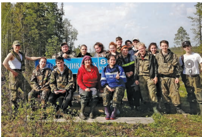
Агит-пыгыт морах үнттуңкве ёхталасыт