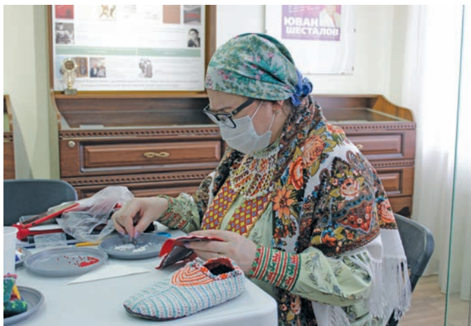
С.М. Астапович щаквщим унлы