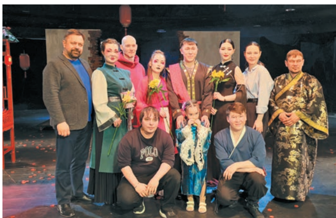
Спектакль щӒпитан мӒхум

Лүймә сәрипос (Северная заря) № 11 (1365), 11.06.2026 Соучредители Дума, Правительство ХМАО – Югры Издатель Департамент внутренней политики ХМАО – Югры