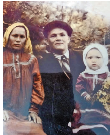
Наталья омаге-ащяге ёт

акв тәлэ төвлыс. Гена ань щёмьяң тәгыл Нягань үсн вәнтлысыт. Ойка-мёнтыл мён вәт нупыл ат тәл блсу-мён, тувыл тав илттыг атимыг ёмтыс. Нёрныл Саранпавылн вәнтлысу, ам пүльницат налыман нупыл хөт тәл рүпитасум. Ос клубт рүпитан тәла ат ёрувләлыслум, ялпың хөталыт пор-рат сәвсыр касылыт ман концертыт щёпитәлсу, мөт павлың хөтпат ёт эргысу ос ййквсу.