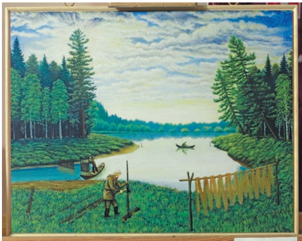
Юрий пöслум хуритэ