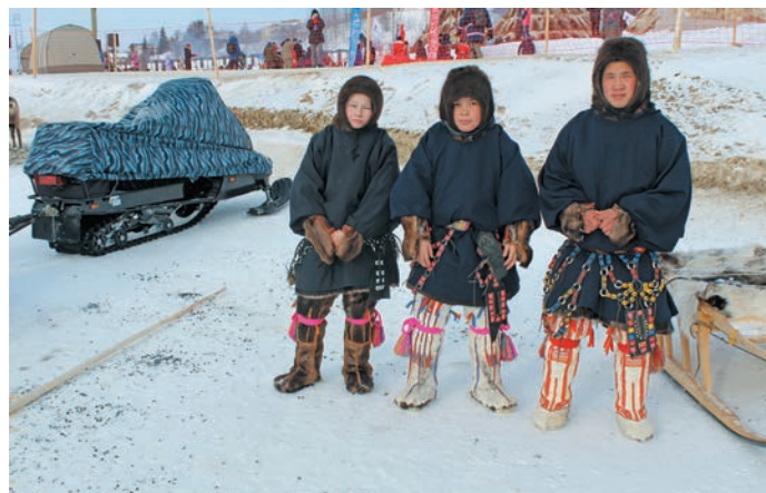
Н. Тользин ёмаспал нупыл лүбли, тав пōхет апщитә

пластикыл якытләгум, пēs Энтапыт нупыл сунсәгум, тән сәлы аңытныл ёргим бләгыт. Тув сунсым акв тамле хорамыт ёргашләгум, амти мāхманумн Энтапыт вәрәгум. Касай сыпалит ос тох хорамтыянув.