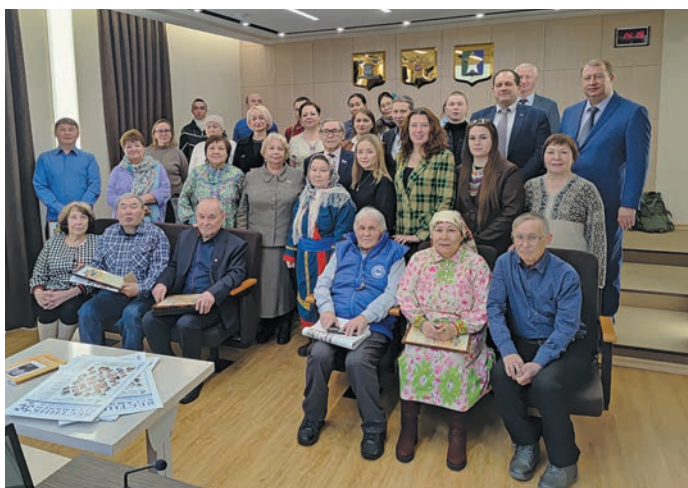
Соссa хōтпат ос кўщайт