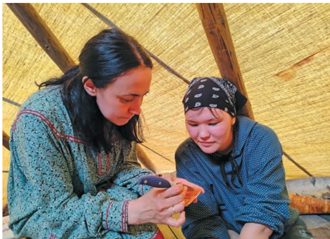
Настя Е. Вьюткинан ханса щуртуңкве ханищтаве

Ам тыгыл э́лалъ о́с тамле декоративно-прикладной тэ́лан ханищтахтуңкве таңхэ́гум ос няврамы́т ё́т рўпитаңкве патэ́гум. Пөслуңкве ос кәтыл матыр-а́ти вә́руңкве ам сака кәсащэ́гум.