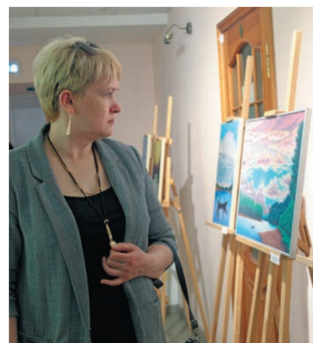
Нэ хурит сунсыглыянэ