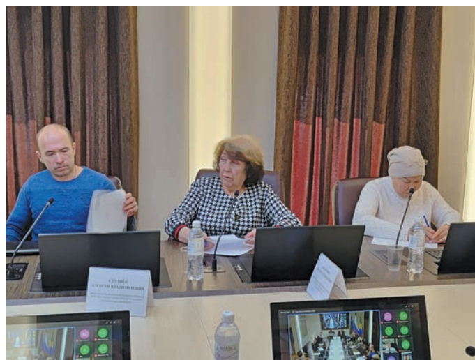
Л. Когончина котильт ўнлы

Тувыл вōрт атам пила-ныл, нёхыс сованыл тыналан мāгыс мāнавн мыганыл, тэнут-пормас ёвтэгыт ос ювле та минэгыт. Сакати ты хосыт тāна-