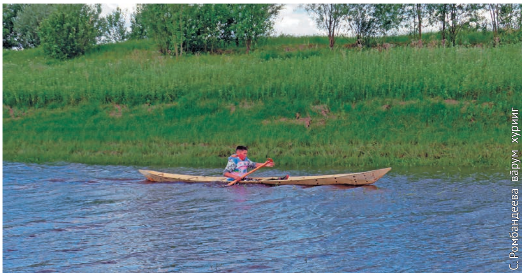
С. Ромбаңдеева вәрүм хуриит

ЮГУ колт рұпитан нә Ли́ка АНДРЕЕВСКИХ хансум потыр мәннычи ләтныг Галина ДУНАЕВА толмашластэ