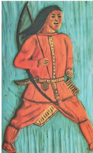
Артём ёргум хуритэ