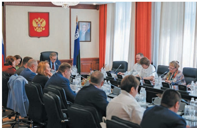
Мирколт атхатам мәхум

нә нә Людмила Алфёрова 2025 тәл сыс вәрүм рүпататә урыл потыртаңкве тув вөвыглавес. Соссa мәхум үргалан хөтпаг тав мөлты тәл лүпта Этпост паттувес.