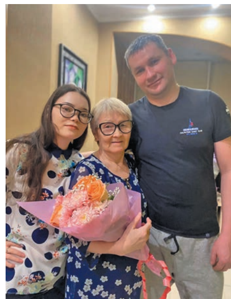
Наталья арге ос пыге ёт

Мән таи бс вәглүв, Наталья Ка-листратовна таккет аты хультсас, акваг хотты няврам янмалтым блыс. Тох Вася ащитэ аги Александра