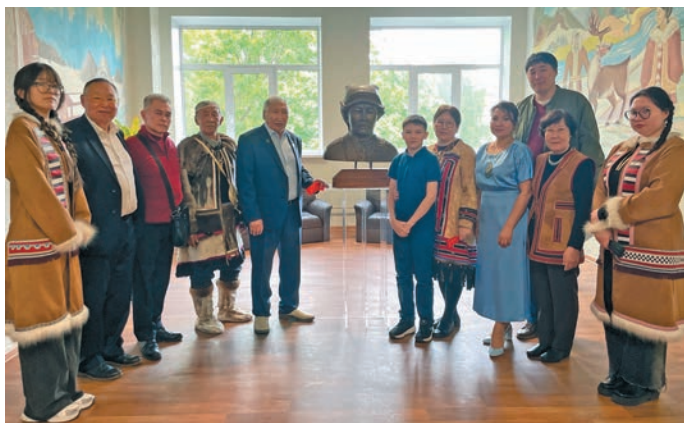
Тэки Одулок хури ляпат пбслахтасыт

Ос аквта хөтал И.Л. Набок нэпак суссылтасыт, махумытта нэпак ёвтуңкв вёрмысыт. Ты нэпак 2026 тәлт тәратавес, тох намтым «Словарь-справочник по этнической культуре народов Севера, Сибири и Дальнего Востока России» блыс.