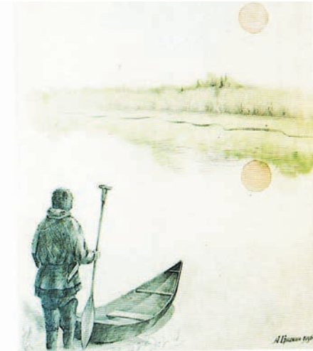
Анатолий пöслум хуритэ

Анатолий öлюпыл ос хаснэй-выл хуриянэ пöслыс, йивныл, лувныл аныщаранэ ёргыс. Öлупса нупыл такви щырыл сунсыс, такви номтанэ пöслыс, тыимäгыс хуриянэ мöт хурипаг тэлсыт. Акв хурит мä-вит пöслас, ос тувыл котилыт öлумхöлас самаге пöслысаге – китсырыг, хансаң самыг. Ты хуритэ «Мä-вит сунсы» намаястэ. Мöт хурит нётнэ мä элн пöслыс, ос ты элы-пäлт яңк кўтьвыт хайтэгыт, ос тувыл яңк хорамыг тэлапёгыт. Хуритэ «Хорам нэглы» намаим öлы.