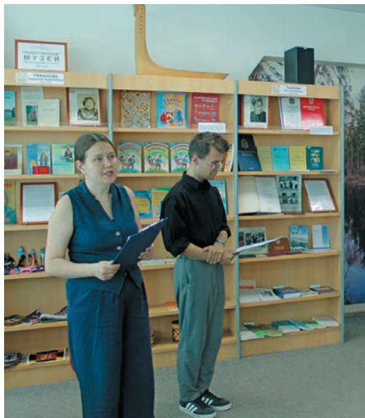
Ас-угорский институтыт рүпитан хөтпаг

Нина Алексеевна Эстония мәт ханищтах- таме порат такви щәнь ләтңе элаль тотуңкве патыс ос ты вәрмалы щирыл учёный хөтпаг ёмтуңкве номылматас. Тонт научный рүпататэ