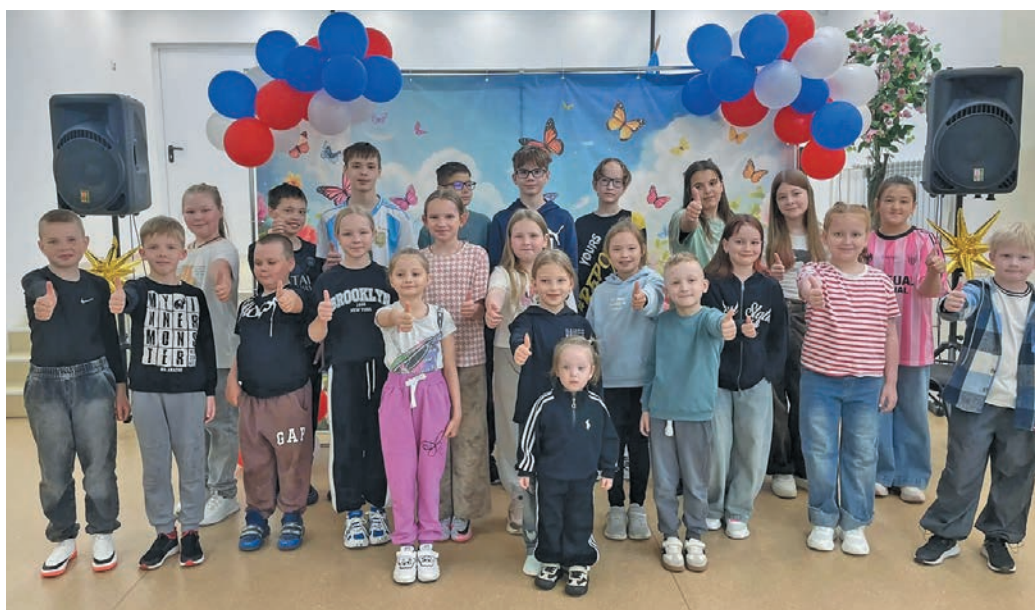
Лагерьн ялантан Хулюмсўнт няврамыт

Тох ты Хулюмсўнтың няврамыт туи сыс ұщлахтэҗыт. Школьный лагерь ұщлахтын каныг ёмтыс, хөт няврамыт ёмщакв ұщлахтэҗыт, сав йильпи номт тыгыл выгыт ос халанылт юртыңыщ ёлэҗыт.