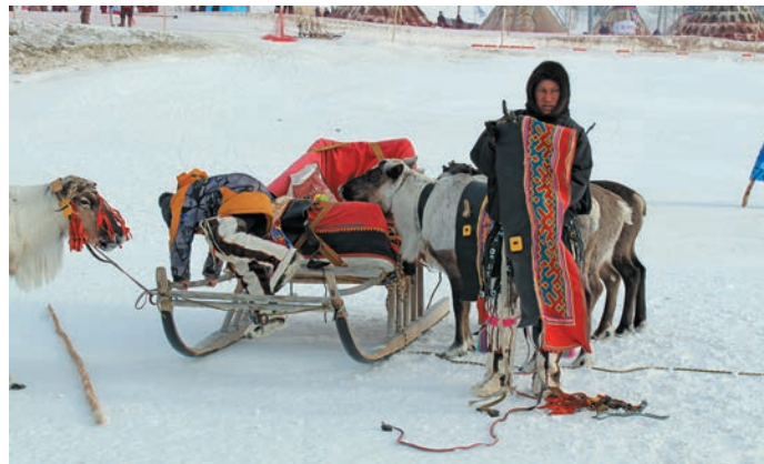
Хум сәлыянэ тәри