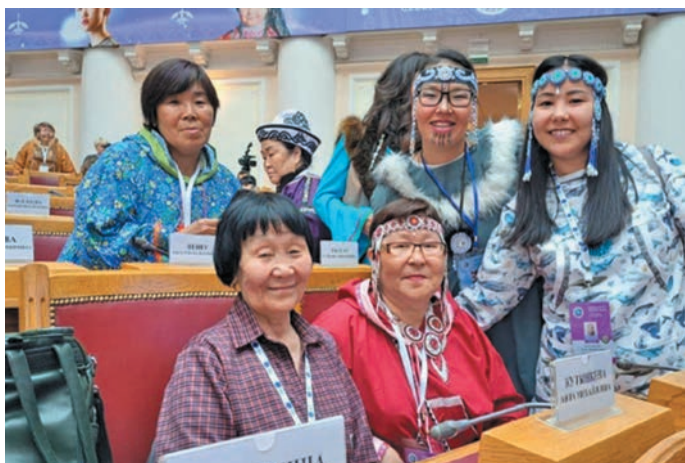
В. Пенет вөртыпал нупыл пöслым öлы