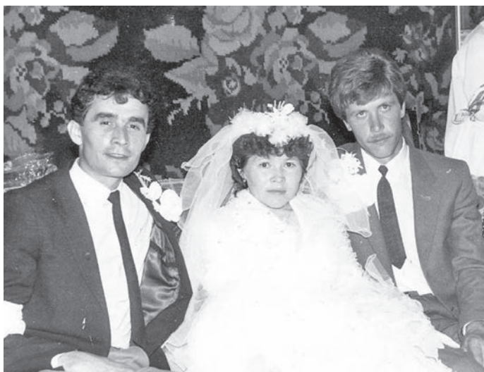
Пури вәрманыл порат

Ам тонт смена щирыл рӯпитасум. Итипәлаг җхтысум, палатан щалтсум, китыглахтәгум: «Поята хотьют?» Тав тәра рбңхувлас: «Ам». Ләвыслум: «Минымән, уколыл вәрилум».