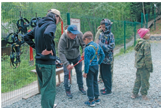
Нъяврамыт хāхталахтын пормасытыл маставет