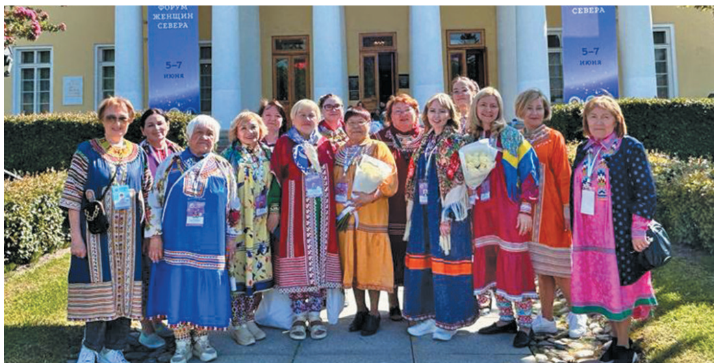
Югра мәныл ялум нәквет

Санкт-Петербург үст хұрум хөтал сыс сәв яныг кўшайт мир ёт хөнтхат-тыгласыт, мөт-мөт вәрмалит урыл потыртасыт, сәккон-нәпакыт хултсыт, тән хосытаныл вәрмалит эрнә щирыл вог минэгыт.