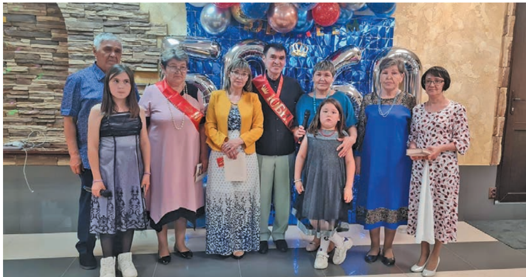
В. Сайнахов Экватэ, каңканэ-увшиянэ ос апыгрищанэ ёт пөслым олы

нъявраманыл яныгмасыт, төванылщёмьяңыгёмтсыт.