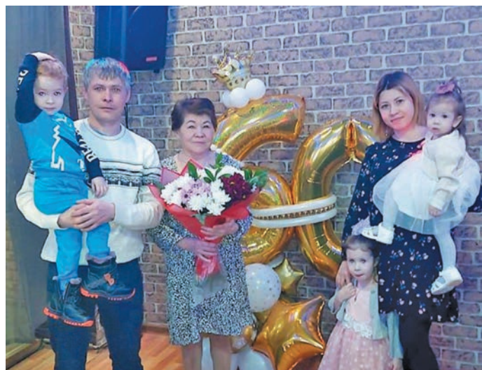
Няврамаге ос апыгрищанә җт