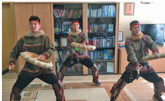
Ёрн пыгыт ййквөгыт