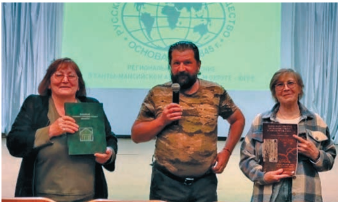
А.В. Кениг котилът лѳли