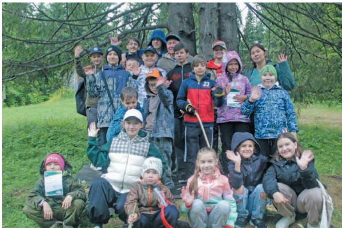
Лүпта Этпост ханищтахтам нъяврамыт