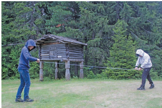
Пыгрищиг квāлыг сōхтэг