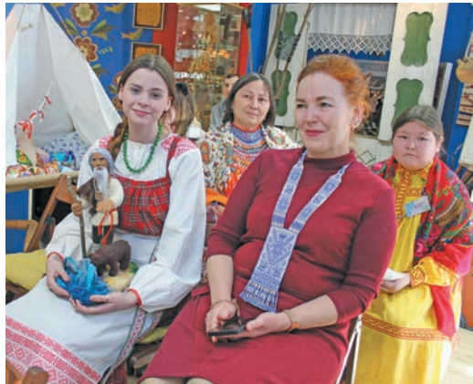
Ханищтан нэтэ ёт