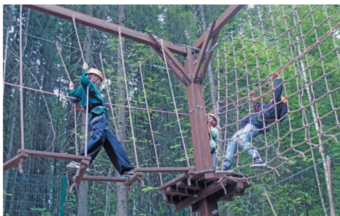
Паркыт нумынт лаквёгыт

– «Тāксар мāхум» программа нъяврамыт мāгыс щёпитаслүв. Кāсың туи тāн ётаныл рүпитэв