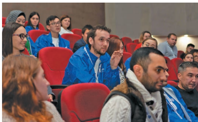
Д. Вынгилев потырты

Д енис Вынгилев «Төрүм Аҗ латың» ишхыпың ут хосыт мәньши латың толмацлан проектэ бвылтыт китыгласлум. Мблалнүв тав аквьёт рупитан мэхманэ ёт ты рупата астылсаныл. Ань мэхум щёпт общнэ телефонанылт манос компьютеранылт мәньши ләтнүв руц ләтнүв толмацлаңкве вёрмёгыт.