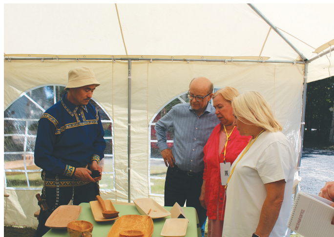
Ханты хум Е. Наков кўцаит ёт потырты