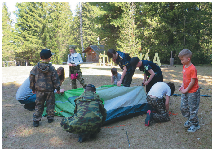
Дети ставят палатку