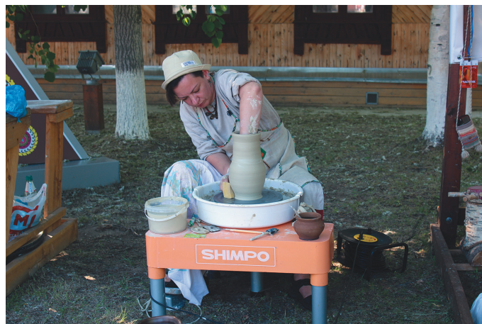
Руц нэ рактныл пöщги

нётнэ хурит пöслысыт, сыплувн тагатын хорамыт вәрсыт, тисгын ут вәрунқк ханищтавёсыт, сәвсыр аканит юнтсыт.