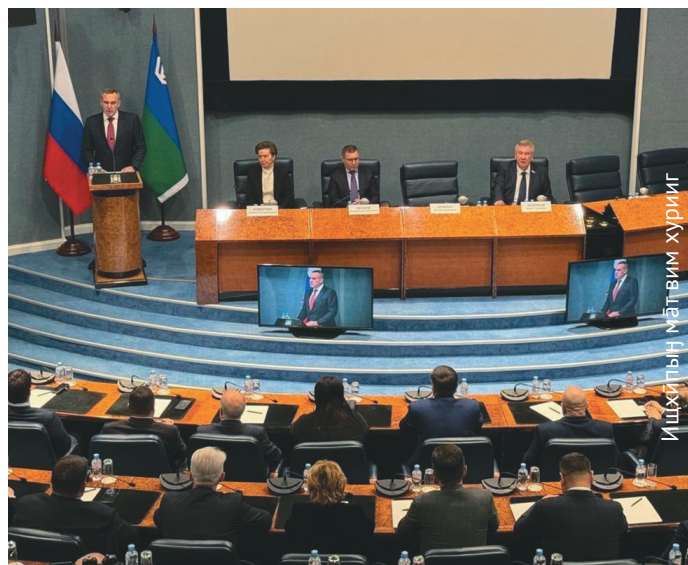
Кўщайт Дума колн акван-атхатыгласыт

әстламе юи-пәлт мирколт рўпитаңкве патыс.