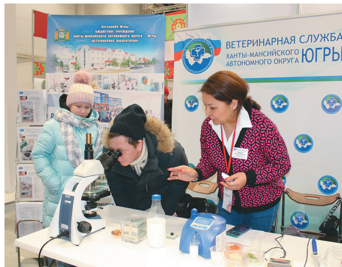
Хум сорыгуй сунсыглы