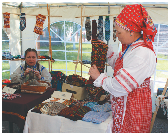
Саран нэ шулкин суссылты