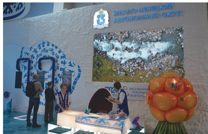
Ямал ты щирыл Москва ўст суссылтаве

Хурит пöслым Ямал мät öлнэ ёрн нэ наме Нечей Сэротэтто, тав ётэ мён Москва ўст вайхатсумён. Тув савсыр маныл махум ёхталасыт, танти мираныл ос блупсаныл урыл потыртасыт.