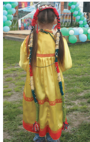
Евгения мәнъщи сагыл сагвес

ёнгилыт кәсаласанэ, пүмшчаласанэ, няврамыт ёт мощ ёнгасас. Тав каңкыг-апшигг оныщи – Рома ос Миша.