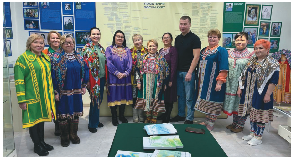
Нина Николаевна диктант хансум сосса мэхум халт пөслым блы