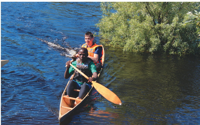
Уганда хум ос ханты пыг товэг