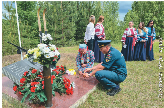
О.А. Актаева МЧС хум ёт исвещә пәламтәг

Митинг җлум порат мәхум ветераныт ёмас ләтңыл кәстысаныл, тән яныг пилыщма сунсым мав фашистытыл хотвуйнтасаныл. Төват тот та порсысыт ос хотыют юв ёхталас, тән война юи-пәлт странав мәгсыл