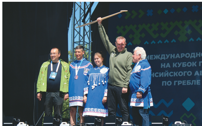
Р. Кухарук тупыл мүйлүптас

тэлсыт, тэнатэн аквьёт то- вуңкв эрыс. Вәим, ханты хумыт сака молях ос ёмащакв товёгыт, таи- мәгыс щар акв хәп ёри ат ёңхыс, пуссын я вәта мус молях ёхтыгпасыт. Тот Виталий Русскин турок пыг Бурак ёт нөх-патсыг.