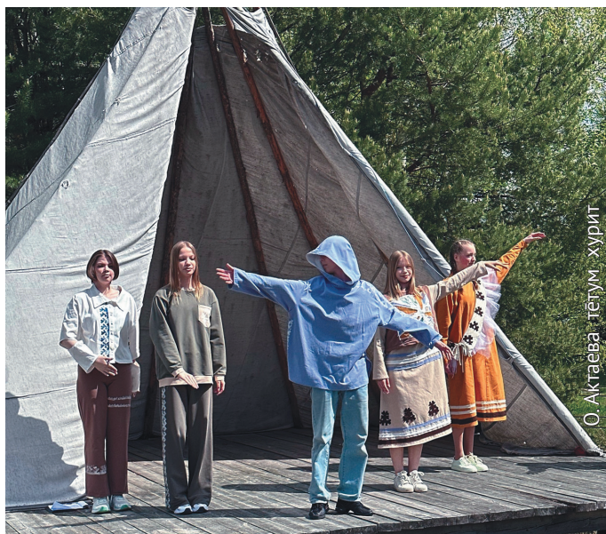
Ныврамыт мөйт суссылтэгыт

Ты тув сьс ныврамыт мәгсыл лагерь вәрөв, ныврамыт ұщлахтын пора «Юрсил» намыл ләвилүв. Ань хурум смена вәруң-кве патэв, тәнаныл өс сәвсыр щирыл намтсанүв. Өвыл сменан «Богатыри Югры» өйттур этпос 22-