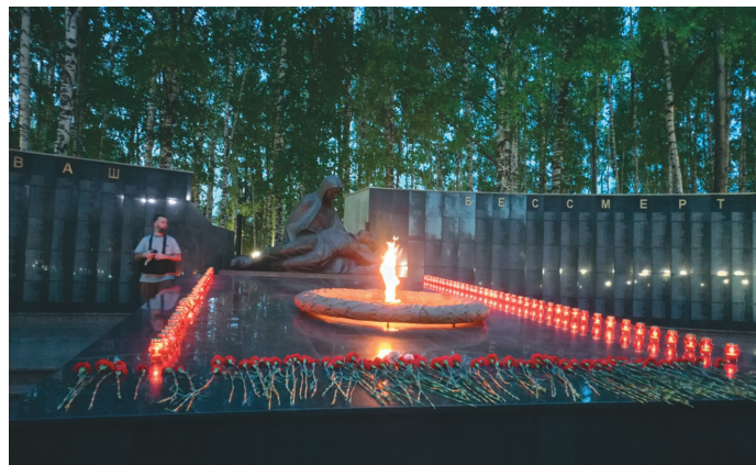
Исвещат тох пәламтавәсыт

2009 тәлныл сәвсыр ұсытыт Победа намба кананылт исвещат пәламтаңкве патсыт. Ос ты тәлт мэхум «Огненные картины войны» намба мирхал акция вәрыгла- сыт. Тох Ханты-Мансийск