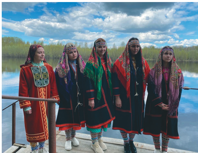
Агит Сакв мәнъщит нуйсахил масхатым өлэгыт

– Ты хўрум осың тарыгйив аңквалыт ёрнкол хольт тўщтувёсыт, коны-