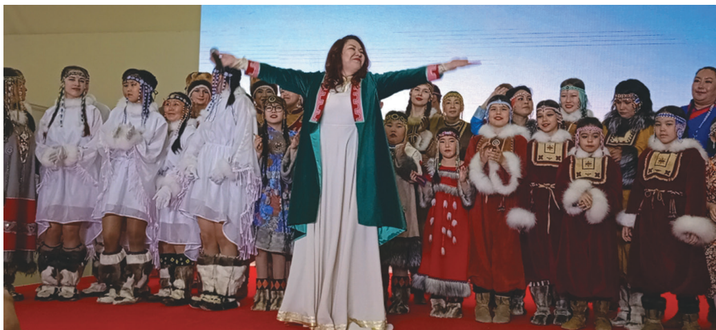
Лүймā мāныл өхталам мирыт эргөгыт