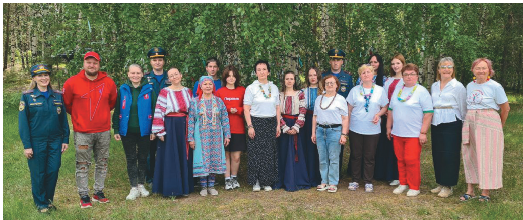
Силаван ёхталам мәхум

Вәрим әхвас тармыл намыт хасвёсыт, та пөхат тит товтыг тўщтым җлэг ос хөнт порат хөнтлым писалъ – автомат. Памятник карыс сып вәтат вәрвес, тав сака нётнэ мәквет җлы. Тох ты хөнтлум хумыт номавет ос тәнаныл янытлавет!