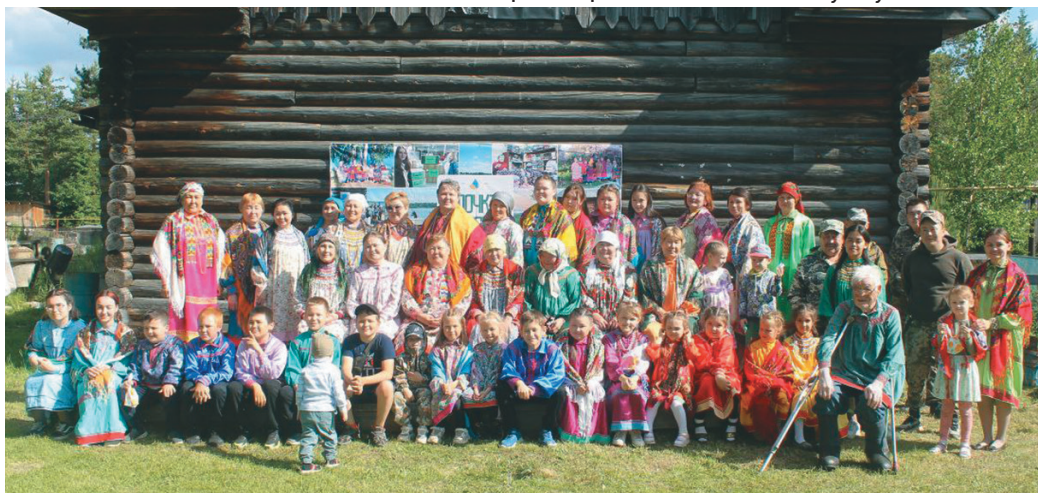
Пуссын акван-атхатыглам ныврамыт ос яныгмәхум

Тахольтыл Александра Михайловна Васильева тамле үщлахтын нак мәнәвн щәпиталас. Әлалы ыс тох вос патнүв. Тыт рүпитам ос үщлахтам мәхмытн ос ныврамытын яныг пүмашипа!