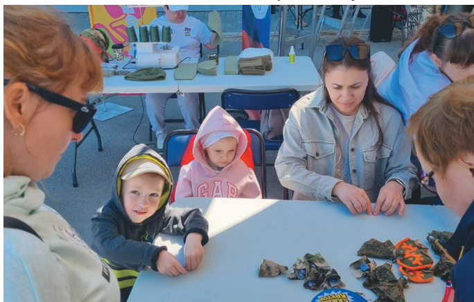
Әканил юнтуңкве ханищтахтэгыт

Ты Арт-резиденцият мүй мәхум тамле әканил ос тувыл акв нэ агитэнтыл ангелочкат вәруңкве ханищтасанүв. Няврамыт ос тахольт пуссын мән палтүв ёхтыгпәлэгыт, уласн үнтэгыт ос матыр вәрёгыт. Агиришит-пыгришит патриотизм-тэлан мәнә тагыл ханищтаңкве эрёгыт, тох тән ләтың хүнтлын хөтпаг элалё яныгмёгыт.