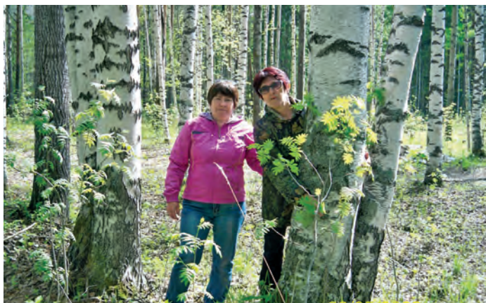
Юрт нэ́тэ ё́т вёрт ё́мыгтэ́