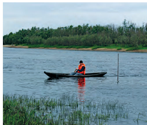
Хум мāньхāпыл тови