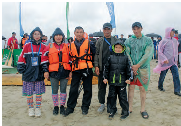
Светлана ос Алексей Тарлиныг Касум хотпат халт лйлөг

Ференц ос Норберт хумыг таи лāвсыг, тэн Югра мāt олнэ соссa мир ёт потрамаңкве сака таң- хēг, лātңув хұнтамлаң- кве. Мāнав тāнти палта- ныл Венгриян вōвиянэн, тув мүйлуңкве вос ялэв, кāсың хотпан щāгтэгыт. Виталий лāвыс, хумыг венгр щирыл тох лāвсыг: «Венгрия вас ждёт с открытым сердцем».