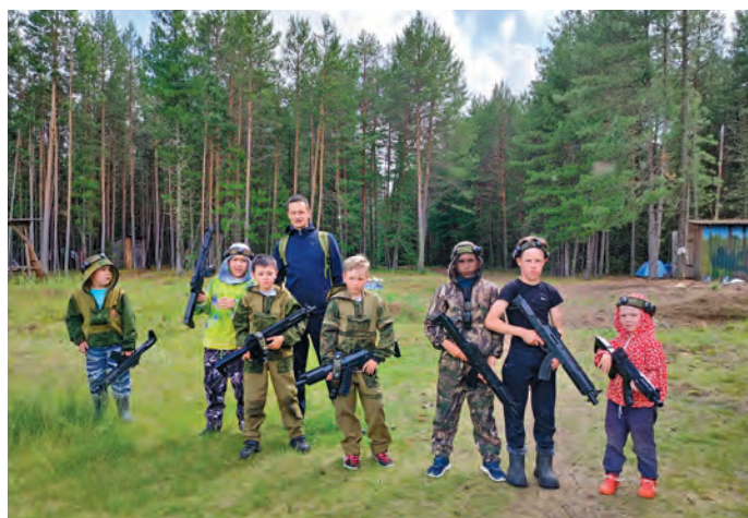
С. Сетов ос пāтлуптым ёнгасан пыгрищит

Кāсың тув «Мāнь Ёсквен» няврамыт ёхтыгпё-гыт ос ўсаныл суиңыг та ёмты. Ты ўщлахтын мā Хāльўс район Ясунт пāвылт блы. Ты тув сьс нила смена вāраве. Ёвлёт кāтыл мāщтырлан мāгсыл няврамыт тув атыглавёсыт, та пораныл «Мастеровая» смена лāвсаныл. Титыт – ты щāнь лāтың ханищтан пора блыс, тот ёйттур ётпос 1-7 хōталыт сьс мāньщи ос саран лāтңыл няврамыт потыртаңке ханищтавёсыт.