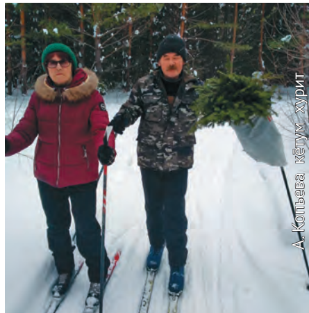
О́йкаты́т ё́т товты́л ё́ме́г