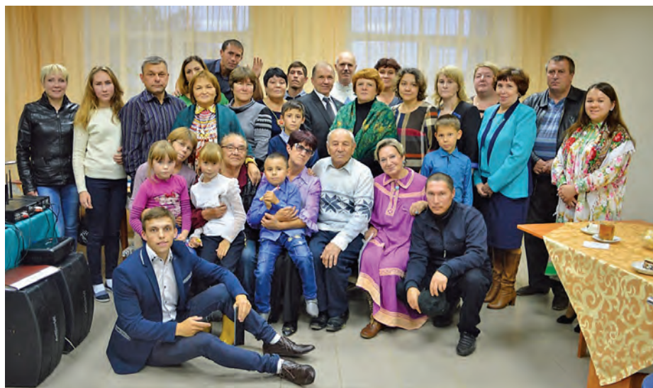
Маныщи мир хөнтхатыгламаныл порат

Пенсиян патхатаме мус сав тал почтальоныг рүпитас. 2022 талт Хөнтаң район 100 талэ төвлын кастыл сав тал рүпитаме мағсыл мағлын тагатан пөсыл майвес. Ты коныпал миркол палныл сав янытлан нэпакыт ҫныщи.