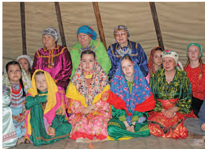
Нёт ос āгит ёрнколт ўнлахōлэгыт