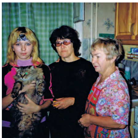
А.С. Глу́хих ё́т по́слахтасы́г

Алла Фёдоровна хосат та́гыл пенсия́н патхатас, тувыл тэ́ла та́л щар ат ӊлы. Нйвраманэ́н не́ты, апы́гришанэ́ ё́т у́нлы, колсори рӯ́пата ва́ри, тэ́лы пораттовты́л хайты, туи вёрн аква́г яланы́. Ты ва́рмаль