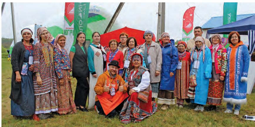
Сāvсыр мāныл ёхталам мāщтыр мāхум