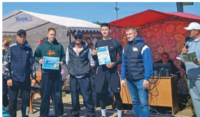
Нөх-патум махум Хальус район кущаин янытлавет

– Матьёмас тамле ялпын хотал варвес, ам тыт тасавит ванэ хотпанум кәсаласанум, щәгтым потрамёв. Ам Хальуст «Альянс» колт рупитэгум, тыг ос культура мат рупитан хотпатн вөввёсум, товункве хәсэгум те, вос касэгум. Ам тәра кәсәщасум, тупыл товункве