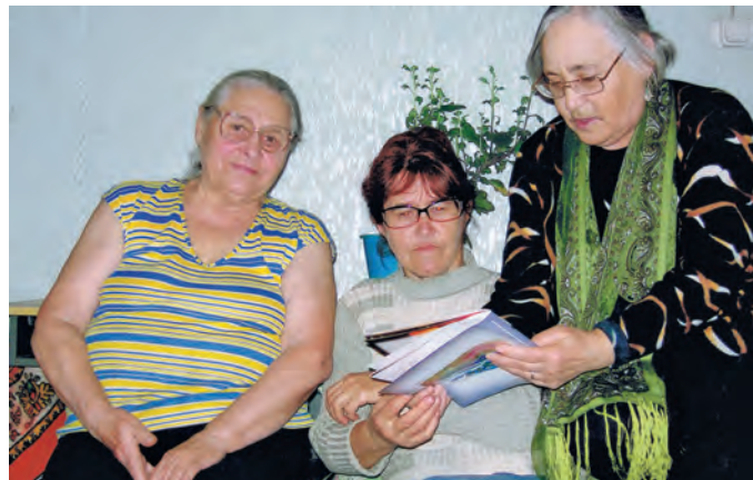
Хӧнта́н райо́нт ӊлне́ э́кваг ё́т

2012 та́лт та па́вылт «Чумбардия» на́мпа фести́валь ӊлыс. Ма́хум яны́г у́сытны́л, ма́нь па́влы́тны́л э́ргы́т э́ргу́нкке, стихи́т, потры́т лови́ньта́нкке тув ё́хталасы́т. Алла Фёдоровна ӊс тув вѳвы́главес. То́нт та́кви стихи́анэ́ лови́ньтан ма́гсыл «Поэ́т» на́мпа но́минация́т яны́тлавес.