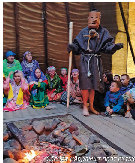
Сәснәл няврамыт палт ёхтыс