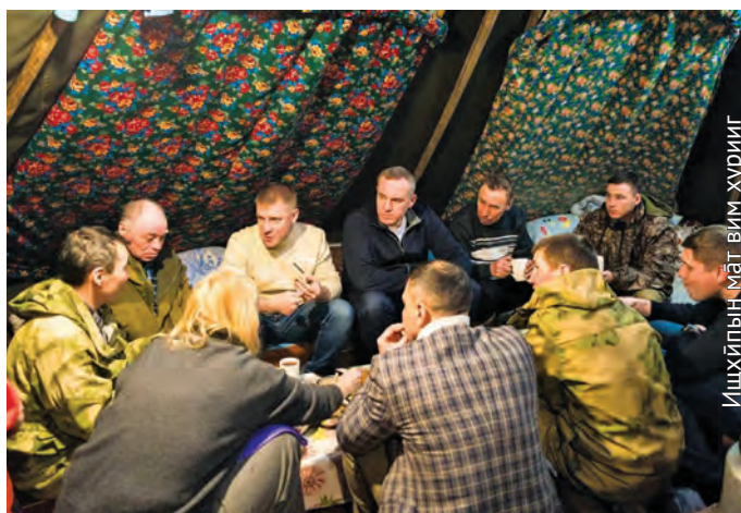
Ишхыпың мат вим хурийг

– āгит салың пыгыт хумыг вос вāрияныл. Салы янмалтан тēла элалы вос ылы, мāнылат мāхум салы ўруңкве вос ханищ- тахтэгыт. Ань мāн палтув төва хумыт нэ тотэгыт ос экваныл нёрн салыңколн минуңкве ат таңхёгыт,