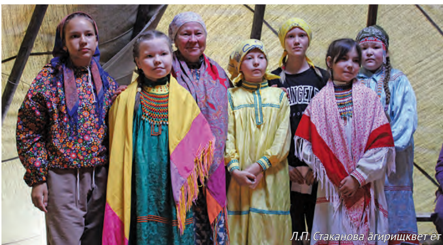
Л.П. Стаканова аҗирищкет ёт