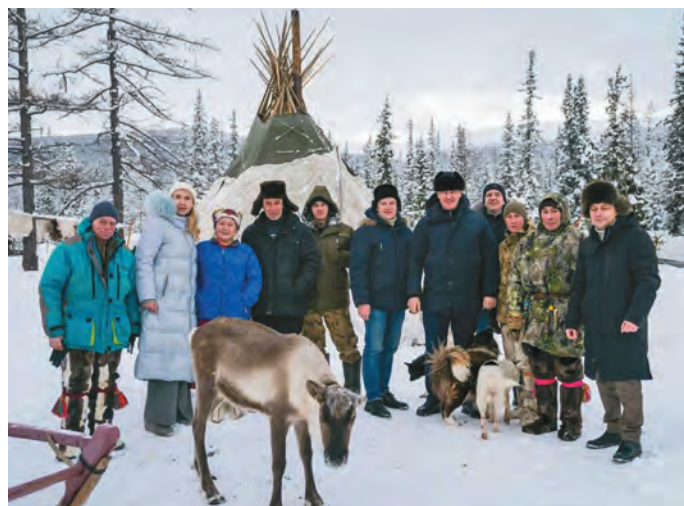
Яков ос Валентина вөртыпал нупыл лёлёг, тән халэнт кўщай нэ Н. Огородникова, хумыт халт карс хум Р.Н. Кухарук лёлли

Ятил нэквен ос тав щёмьятэн мāн пустāгыл