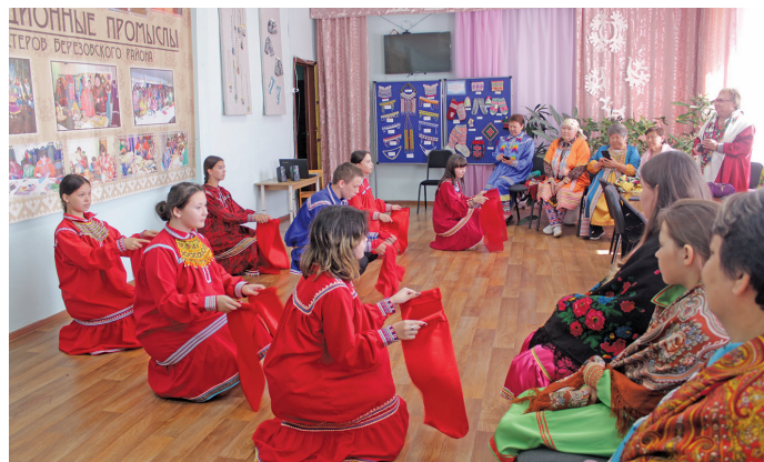
Тэк павыл аги-пыгыт ййквёгыт

Эргын-ййквнэ ятил махум, мәнщлат аги-пыгыт ос няврамыт, Хальүсн ёхтумын магыс номтанув сака ёмасыт. Тынакт