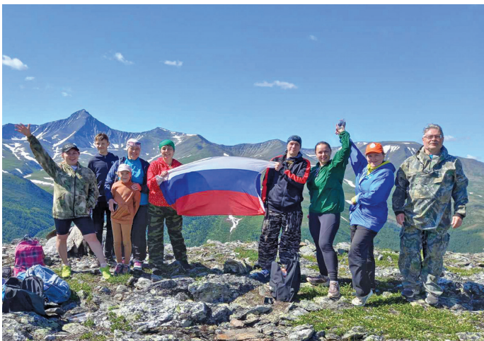
Нёрн ялум мэхум