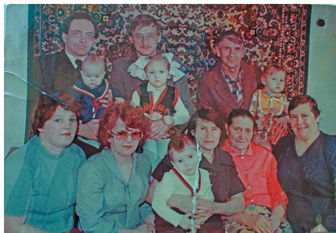
Рүт мәхманә әт