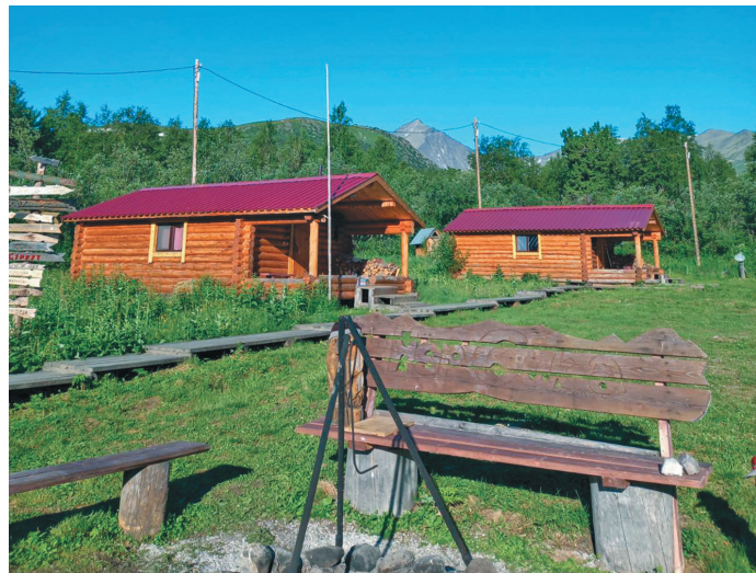
«Нёр-Ойка» ушлахтын ма

Т ы туй бйттур этпост ам бвыл щёс Нёрн ялсум. Ты элы-палт ват сәграпнал этпост округут блнэ сосса мэхум «Комунадо» нампа сапрәнин Ханты-Мансийск үсн вбвыглавесүв. Тонт мән пуссын ләкква-үртхатсүв ос проект-нәпак хассүв. Ам мәнщи, ханты хөтпат эт «Нёр-Ойка» нампа ушлахтын ма урыл потыр хассум.