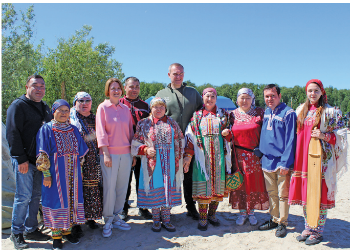
Округ ийльпи кўщай Р. Кухарук ёт пўслахтасыт