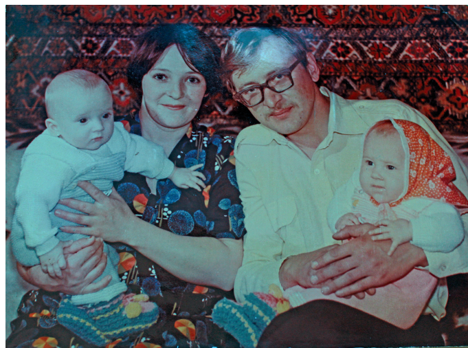
Коля ос Катя юртың-нәврамагән

Әтәм акв-кит мәныщи ләтың вәс. Әргуңкве сака хәсыс. Тав вөраян хөтпаг рүпитас. Колувт акваг вөрүй совыт тәслым ханасыт. Әтәм яныг щәмьят яныгмас, щәщәкв ам ос бәпам сәв нәврам ощсыг. Рүт сәв бәныщәв. Әквум Юмас пәвылт бәлыс, әтыл колтәглә әт тыг вәнтлас. Тав бәс сәт нәврам янмал-