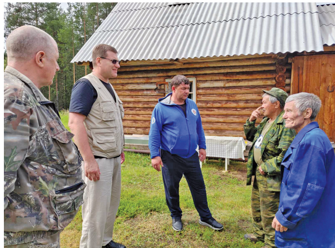
Өлупсаныл урыл китыглавет