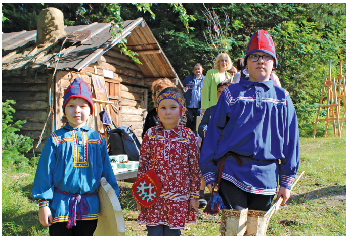
Шапша павыл нйврамыт