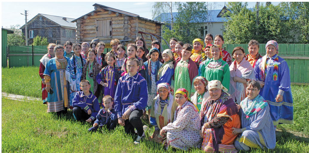
Эрыг-ййкв тотнэ махум

Ты сосса махманув хумус ханищтахтасыт, ййквсыт, эргысыт, ты урыл акв хотты газетат ловиньтэн тах.