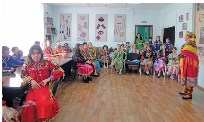
Ханищтан нэ Ф.П. Иштимирова потырты

ханищтапув хурум хөтал сыс мины, нән ань халанынотрамён, вайхатэн.