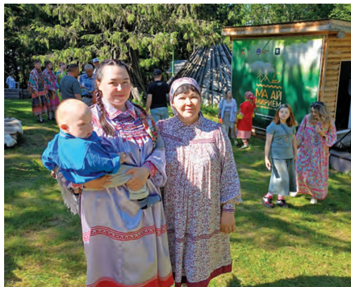
«Нильтаң павыл» ансамбль эргын-ййквнэ нэг

Тувыл муй махум мәгыс ханты ос мәнщи эргыт эргувёсыт, ййквсыт. Овлэт Югра пәлыл сасса махумныл ООН колт посолыг лавнэ нэ Вера