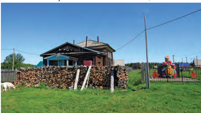
Сүкыръя павылт хөнтлум нак кастыл памятник вәрвес