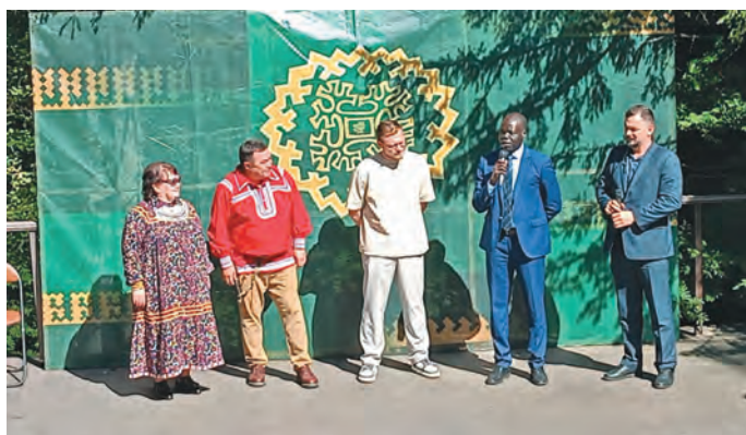
Хон мәныл ёхтум кўшай хум сасса мирыт янытлы

Махум музей карс урмыт муйлыныл сыс матыр мащтырлаңкве ханищтавёсыт, сыре-сыр касылыт касуңкве вёрмысыт. Тувыл пуссын муй махум лүптаң атың щәйл айтвёсыт ос курт вәрнэ атың нәнил титтувёсыт. Тән лавнэныл щирыл, посың хоталың хоталыт такем ёмщакв ўщлахтасыт, төват тәнки халанылт сав пора акван-хонтхатәлсыт, ань тахольт вәщиньтахтасыт.