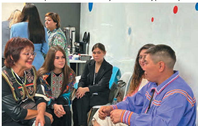
Мўй хōтпат В. Кондин потре хўнтлэгыт

Ханты-Мансийск ұсыт мāхумыт политика вāрмалъ ханищтасыт. Ётылнув тāңки проектаныл ловиньтыяныл, тувыл в-янтыяныл.