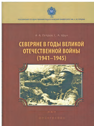
Йильпи нэпак вәрвес

Ю вле хультум нотт яңк нәтнә Этпост онтолов щислат яныг хөнтлам вәрмалы ойгпас, ос таимәгыс Нөх-патум хөтал 80 тәлэ төвлынәт кастыл мән сәв потыр бһыщев. Мәхум хөт-әти акван-атхатнәныл порат акваг ты тәла бһыттыт кит-хүрум ләтың ләвөгыт.