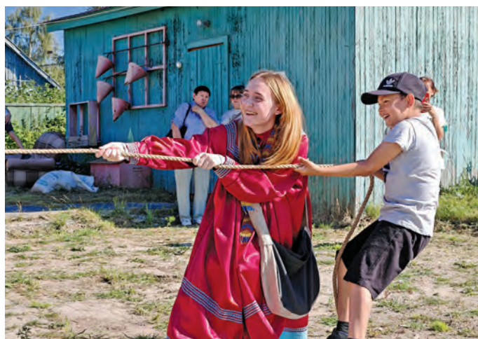
Няврамыт халанылт касЭгыт