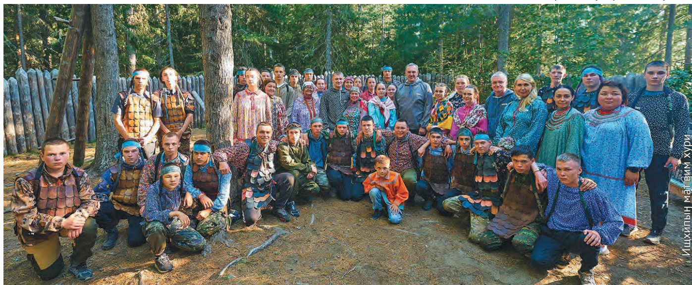
Ищхылын мāt-вим хури

Хунь Руслан Николаевич мāхманэ ёт ёхтысыт, пыгытн пёс павылн вōв-вёсыт. Та мā руц щирыл тох лāваве: городище. Ты хōнтлын манос алхатан мā. Мўй мāхум мāнлат хōтпатн китыглавёсыт, кāсашёгыт те, тāн ётаныл вос ёнгасэгыт (алхатэ-гыт). Хальўс район кўщай