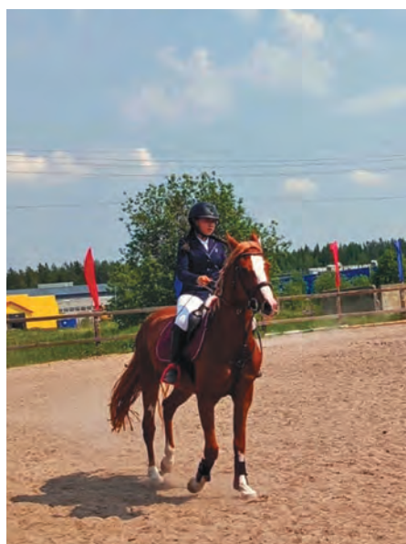
Виолетта лув тармыл мины

– Сүкыр этпост ам 12 талум төвлы, 6 классыт хаништахтүгке патэгум. Югорск үст блуңке анумен сака мұсты, ам тот сав юртагит оныщегум, классувт 24 агиришит ос пыгришит хаништахтэгыт. Щар мак эруптан урокум – биология.