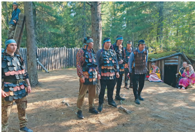
«Мәнь Ыскве» пыгыт потыртэгыт