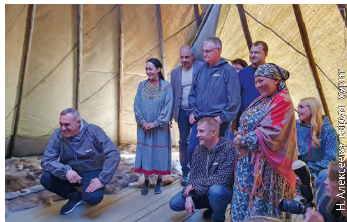
Мүй хөтпат мөйт хұнтлэгыт