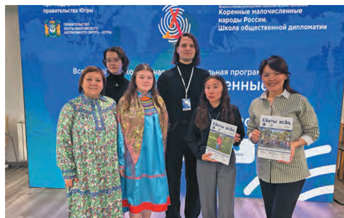
Ты хурит Н. Алексеева, М. Сатина, Г. Дунаева, Уланей, Анна ос Юлия пōслым блэгыт

Āс-угорский институт урыл мāхумыт потыртасыт. Лāвсыт, манхурип исследованият вāрэгыт тувыл манхурип проек-