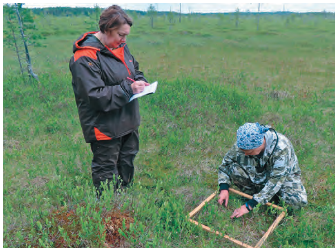
Нэквег яныгмам пил ловиньтэг

Ос аква яныг түр «Пәңктүрыг» лававе. Туи витэ хунь маңиг емты, лап-яныгмаве, тонт сака пасы. Раңкитүр яңкыл мат олы, тав мощ