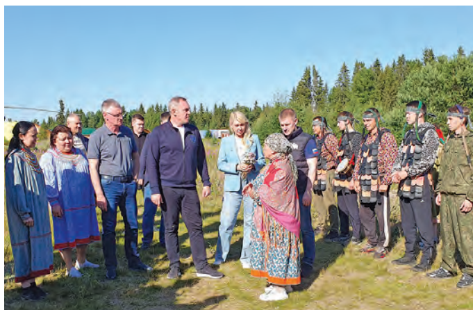
Мўй мāхум Ясунтын ущты ёхтысыт

Мāнавн, яныгхōтпатн ос мāнь мāхумн, округ кўщаин суссылтаңкве эрыс – хумус олэв, маныр ханищтэв, пёс наканув хумус ўргалыянўв, элаль тотыянўв, та маныр. Ты мāн ёхталан няврамыт кāсыңьёмт танти мираныл урыл сāv потыр хўн-