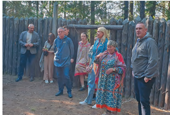
Мүй хөтпат пыгыт нупыл сунсэгыт