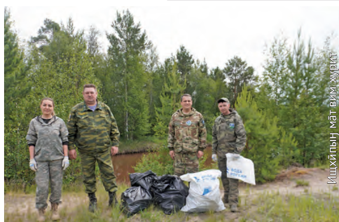
Ишхипыҗ мӱт вим хури

ӱс аква отделыт рӱпитан мӱхум нӱврамыт ханищтӱгыт. Агиришит, пыгришит вӱтихал мӱн палтув ӱхталӱгыт. Мӱн тӱнаныл ӱцлахтын хӱталыт порат вӱрн тотыглыанӱв, тот мӱн яныг кол ӱнӱщӱв. Тот нӱврамыт ӱт хӱлӱгыт. Мӱ-вит ӱргалан тӱла урыл потырытыанӱв, манхурип ййвыт тот яныгмӱгыт, манхурип вӱрӱит, товлыҗӱит ӱлӱгыт, ос сӱв мӱттӱлатурыл пӱмщалыанӱв. Тамле