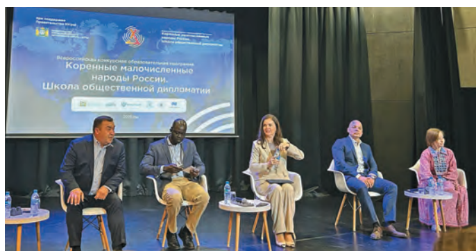
Яныг кўщайт ос мўй хōтпат потыртэгыт