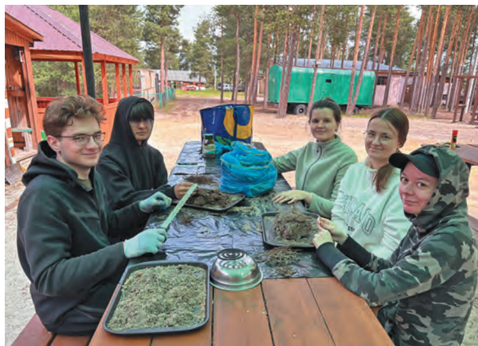
ЮГУ колт хаништахтан маңылат хөппат