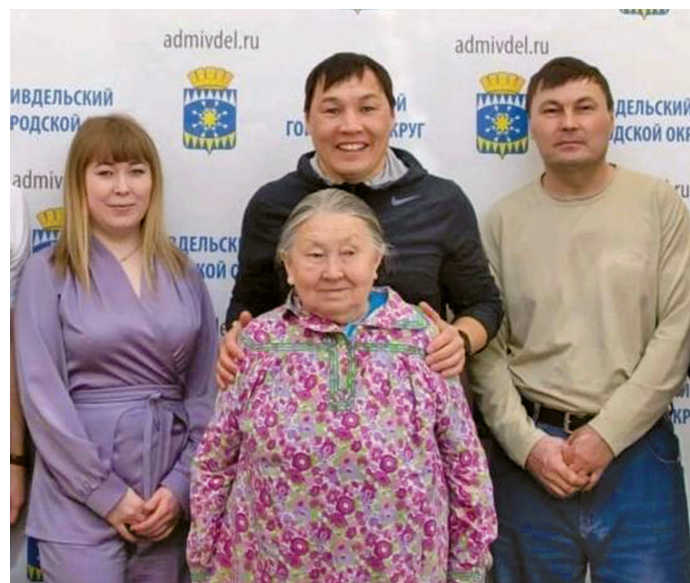
А.А. Анямова котильт лӓбли

Мощақв тотвесӓв, тот ӓс сӓлың лӓх. Элаль ӓста лӓглыл ёмёв. Хотит юв хулыты – канпеткал мощ мыганэ, та ёмёгыт. Савалап нйврамыт колн тув хотталь Бурмантовн та вӓнттавесӓв, детдомыг лӓввес. Тӓнт тай сӓв мӓньци.