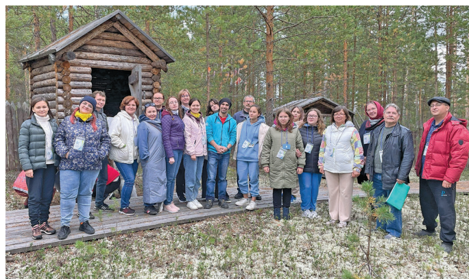
«Тумп ұс» суснэ вәрмәль

«Хөнтаң тұрыт» мән ялмув порат, тот рүпитан нэ А.Ю. Есельгендинова ты мән урыл тох потыртас: «Тыт хурум яныг тұрыт өлэгыт: Аран-Тур, Пон-Тур ос Ранге-Тур, халанылт Ах напта посал өви, тав вите Хөнтаң-ян паты. Тыт мувлахи сәв нярыт, яңкылмат, хорит өлэгыт,