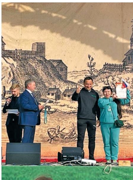
В. Алгазина янытлаве