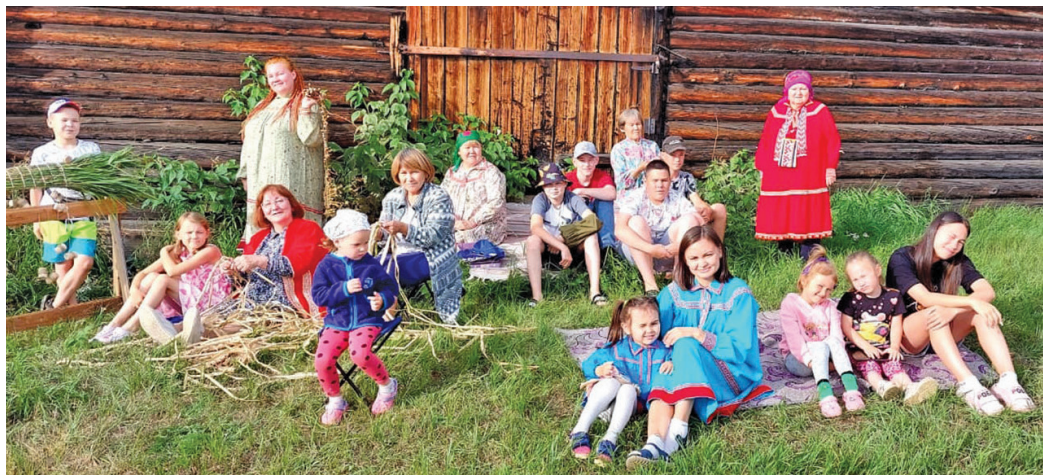
Мүйлум мэхум пёслувёсыт