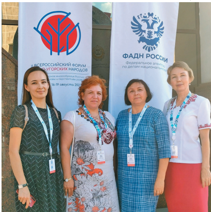
Марий Эл мәт өлнэ нәт