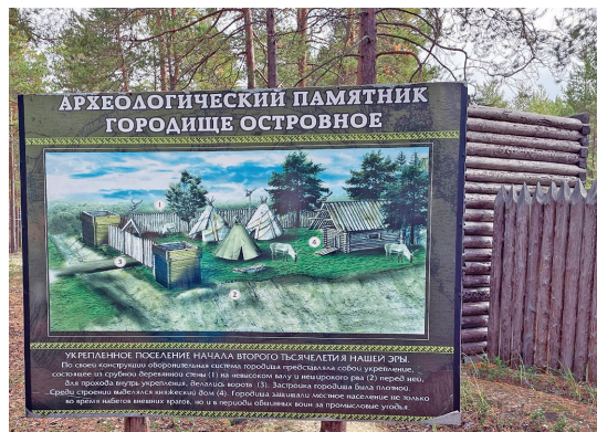
Мәнщит пәс порат өлум ұсаныл