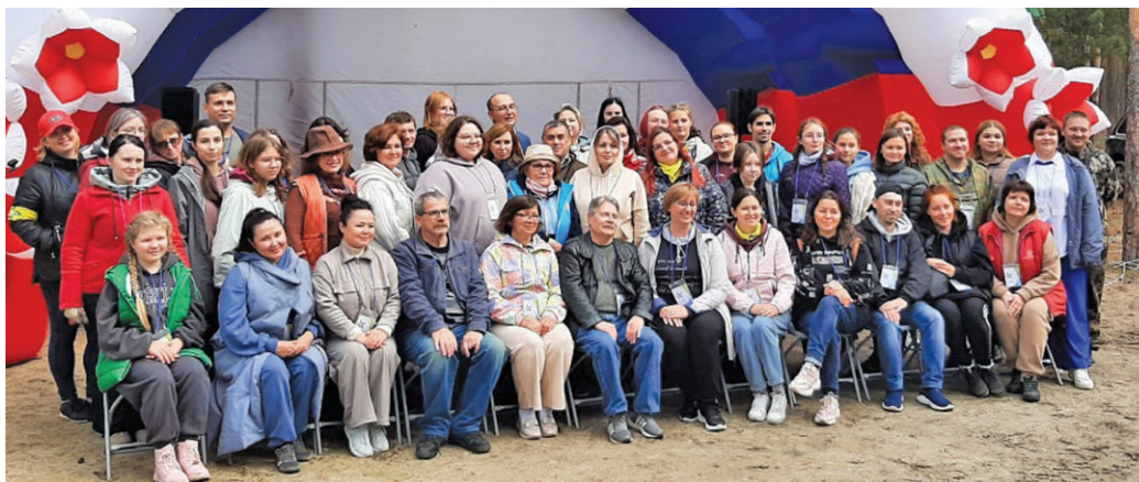
«Арантур совыт» нампа мāt атхатыглам хōтпат

В бртур этпос 26-27 хōталыгт нэпак хаснэ хōтпат магыс «Звёзды Арантура» нампа акван-атхатыглам вәрмал Советский районт блыс. Тамле вәрмал ты тāl атынтыг вāрыглālвес, махум «Кондинские озёра» мән ялсыт.