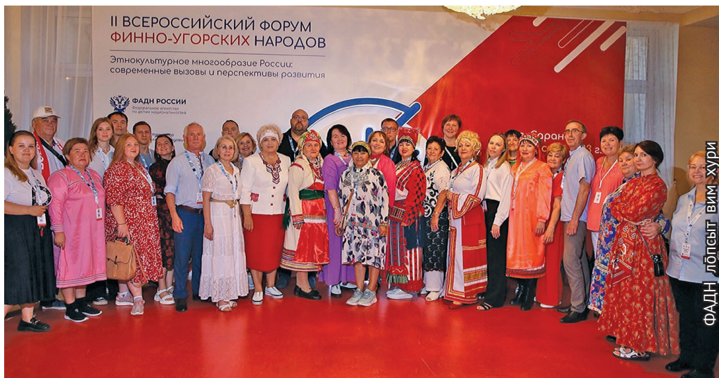
Саранск үсн ёхталам хөтпат

Тән халанылт 8 хөтпат тәнки өлнэ мәнылт мирколанылт кұщайлахтэгыт, 5 хөтпат савсыр ВУЗыт кұщаиг өлэгыт, 15 ханищтан хөтпат өс тот рүпитэгыт, тувыл савсыр наукат яныг нам өщнэ хөтпат, мөтаныт общественный