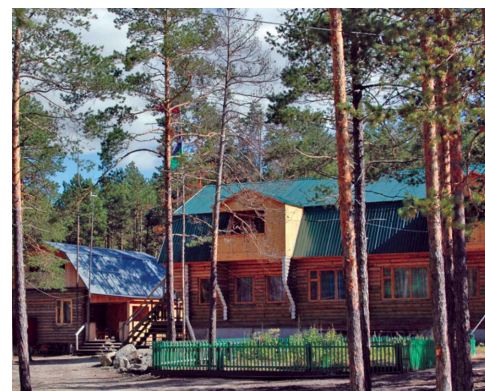
«Хөнтаң тұрыт» пәвланыл