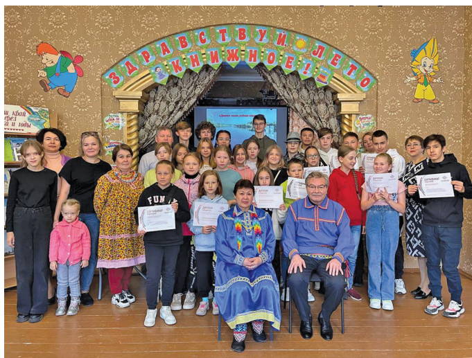
В. Енов котильт унлы