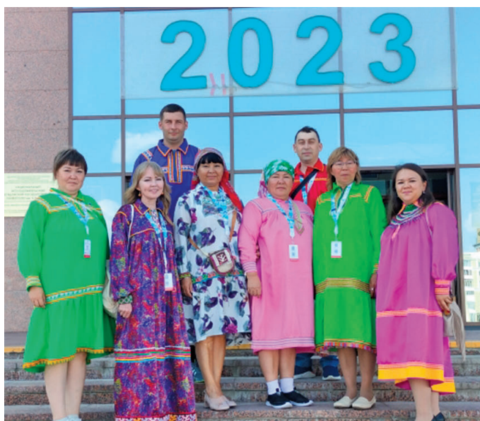
Мән округныл ялум мәхум