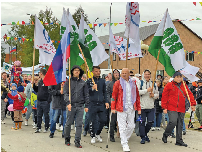
Хальүс хосыт ёмёгыт