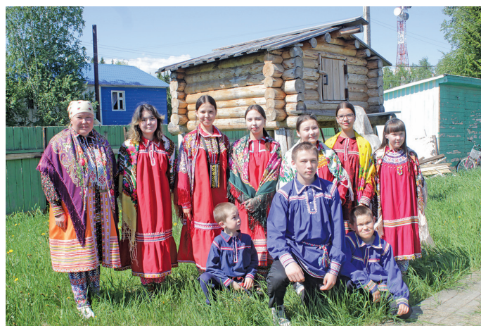
«Ӑс нӕ» эргын хӕтпат

ӕтаныл урыл потыртасум, мори маснут ул вос маса-пӕгыт, пӕс мӕхманув манхурип маснутыл ӧлсыт, тамле маснутыл вос ӕмыгтӕгыт. Мӕнщи манос ханты тӕр вос пинӕгыт, ӕтаныл сагыл вос сагияныл. Ты ос мӕт сӕв тӕлат урыл потыртасум, ханищтасанум.