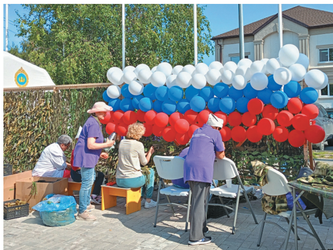
Лап-пантхатнэ ўсма сагёгыт