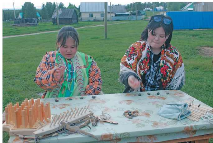
Мәньщи әгиришиг Нина ос Юля