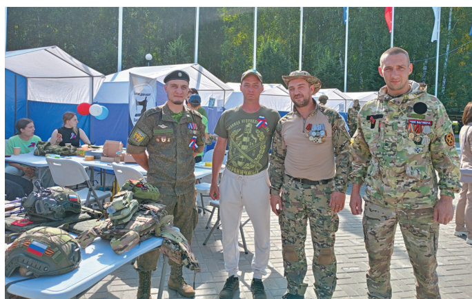
Хōнтлын мāt хōнтлум хумыт

исмитыг пāйтнэ мāгыс лāкква-уртавет ос хў- рысовн пинавет. Ос ты щирыл щёпита́м тэ́ну- таныл хōнтлын мән кёты- яныл.