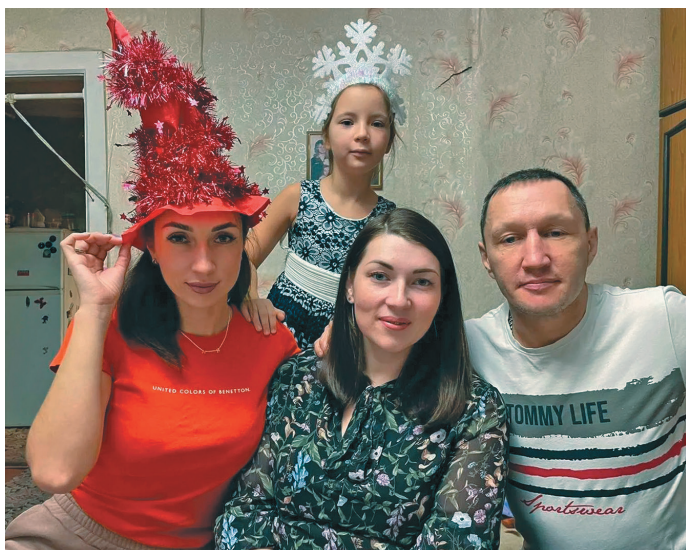
Агияге, пыге ос апыгрище

Түяг Конда я вәтатэ хот-сыстамтылүв, порсыт акван-атыянүв. Пәвлув үскант мән кәсың тәл