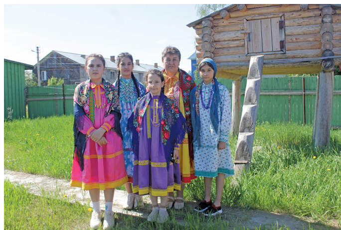
«Ойнас» эргын хотпат