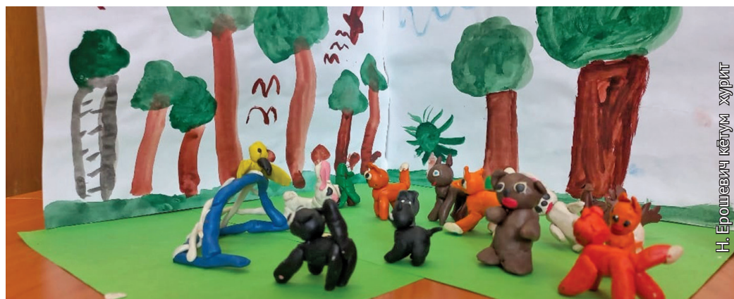
Н. Ерошевич кетум хурит

Ты рұпатат әгирищит-пыгрищит тәнки режиссёрыг ос хурит пёслын