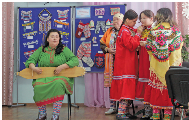
Эрыг тотнӕ мӕхум