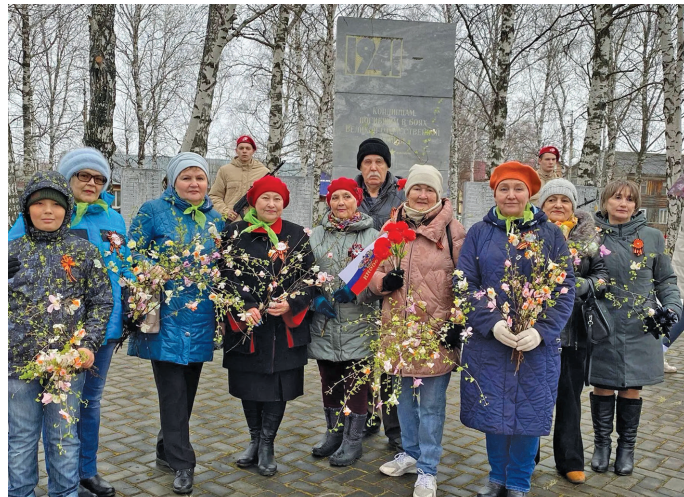
Кондинский павылт блнэ мэхум

хорамың лүпта үнттэв. Ос туй сыс ныврамыт ёт ты лүптат аквьёт янмал-тыянүв, уралтыянүв.