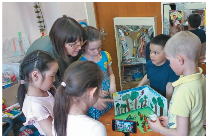
Телефонын пōслуңкве ханищтахтѣгыт

Мультикыт вāрнэ кāсың хōтпа такви рӯпататэ янас вāритэ, тыи олн ойтнэ хōтпа, сценарий хаснэ хōтпа, режиссѣр-