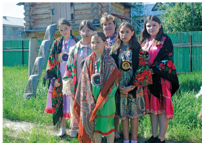
«Султум» эргын хӕтпат

– Ййквыт урыл потыртасум, лӕвсум мӕнщи ос ханты ййквыт ӧлӕгыт, вос вӕганыл, ханьщияныл. «Кӕринька» ӧс сӕвсыр щирыл ййквале, тав кӕсыӕ коллективын вӕве. Супаныл, тӕраныл ос