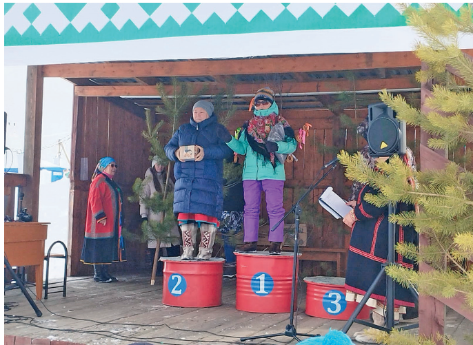
В.Р. Хозумова түяг каснэ мат титыт места вис

Ты кәркам нэкве 60 талэ төвлум кастыл сака янытлылүв, элалъ блнэ нотың хөтал, элалъ блнэ посуың хөтал тавён лавёв! Апанэ тавён вос нётэгыт, акваг вос уральтаве, юрт нэнэ ёт ёмщакв вос мүйлэгыт, яныг намхөталэт таглың пасаныл мүй хөтпанэ ёт вос үнлахдөлэгыт. Төрүм ёт, Отыр ёт, пус кат, пус ләгыл!