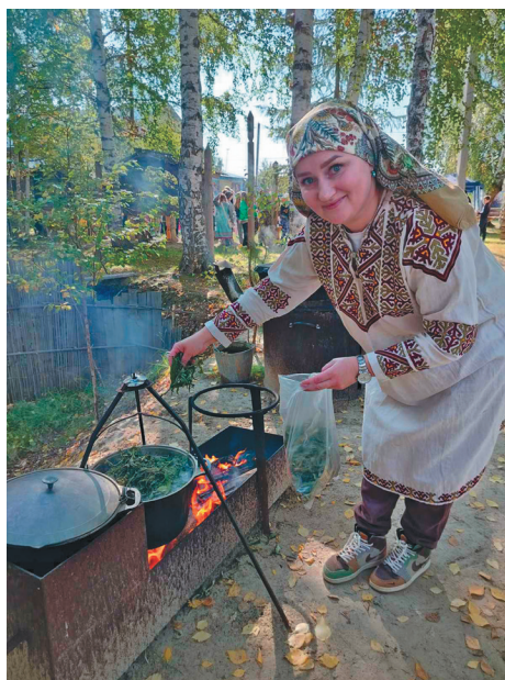
Т. Хомякова щай лұпта тарты