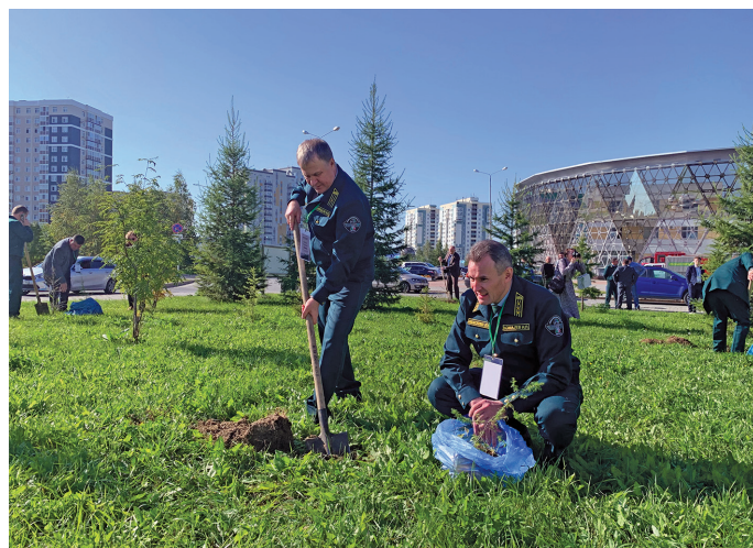
Вөр үргалан хөтпат мǎнь ййвыт ўнттэгыт

– Юи-өвыл тǎлыт мǎхум вөр үргалан хөтпат рупитаңкве щар ат кǎсащёгыт. Ань округув янытыл өлнэ лесничестват вөр үргалан 28 хөтпат ат төвылхаты. Мегион ос Лангепас ўсыгт тамле рупата вǎнэ хөтпа щар атим. Мǎхум пуссын мǎ-вөй нөх-вуим рупитаңкве воратэгыт, вөр үргалаңкве ат таңхёгыт. Школан ялантан нǎвврамыт ёт ань сǎвнув рупитаңкве эри. Ты элы-пǎлт округ янытыл 21 школьный лестничестван ялантан агирищит, пыгрищит ты яныг сапрǎнин ёхталасыт, ты тǎл туп 8 команд Ханты-Мансийск үсн