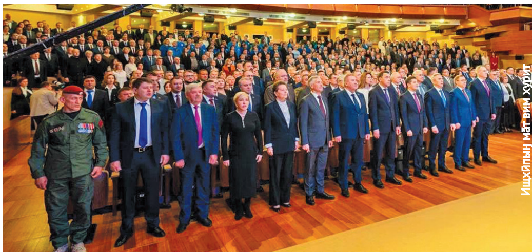
Ишхйпнн мәт вим хурит

Кұцай хум ань ат тәл рүпитаңкве депутатытн пёриявес, тавён састум ләңх ос элаль олнэ пөсың хөтал ләвёв!