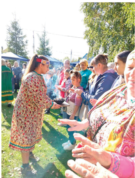
В.Еремеева посым ёт ёмыгты