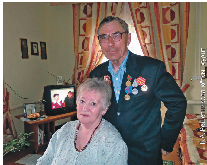
Омаге-агае, 2010 талт