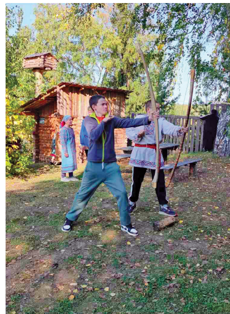
Пыгыг нял пәхвтэг