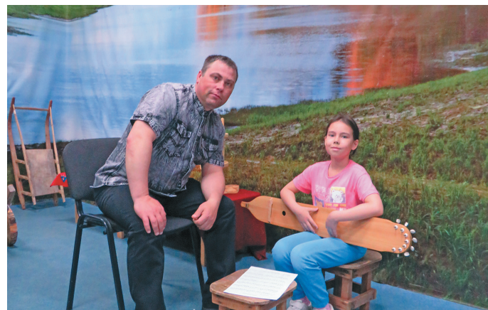
Ханищтан хум А. Решиков ос Янесса

Хүрум хөтал сыс а́гирищ нила Эрыгсов тәныт ханищтас, сәңквылтапыл сәңквылтас – «Сбвыр сбюм», «Күринька», «Сәлыкве» ос «Сәлы үрнэ хөтпат ййкв». Ты тәныт ханищтаңкве тәрвитуң-кос, ос Янесса а́гирищ-