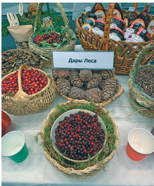
Вөрт атнэ тэнутыт

Кǎсың тǎл сүкыр этпос хўрмит ўщлахтын хөталэт Россия янытыл вөр үргалан хөтпат ялпың хөталыл вǎрыглавет, руш лǎтңыл «День работников леса» лǎваве. Ты тǎл янытлан хөталаныл сүкыр этпос 15 числат блыс. Ты кастыл тǎн кǎсың тǎл тамле яныг сапрǎнин тǎнки рупатаныл урыл потыртаңкв атхатыглэгыт.