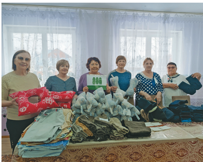
Пенсият олә лёккарыт маснutyт сәлтатыт магсыл юнтэгыт