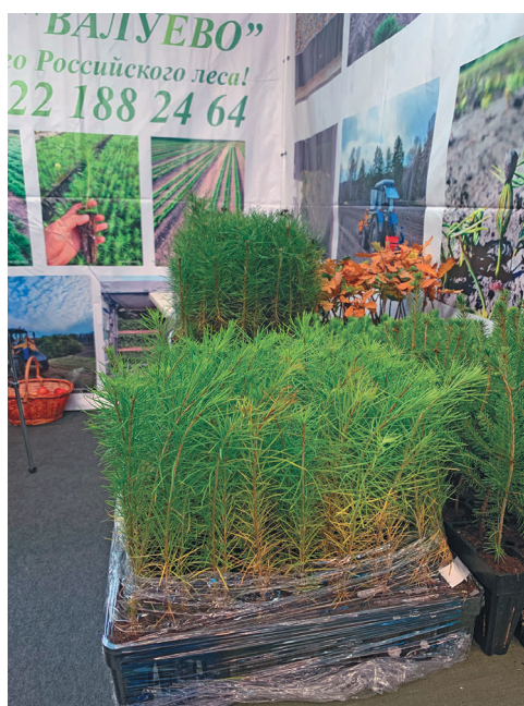
Мǎнь ййвыт тох янмалтавет