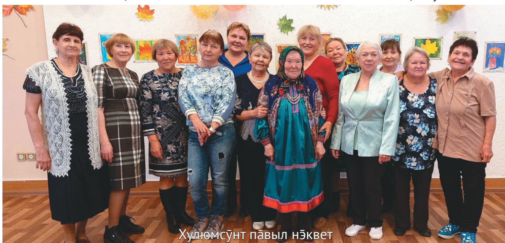
Хулюмсүнт павылт нёквет

Миркол палыл ДК «Фортуна» колт яныг муйлын пасан щёпитал-вес. Школа искусств колн ялантан няврамыт яныг махум магыс мань концерт-ломт суссылта-сыт.