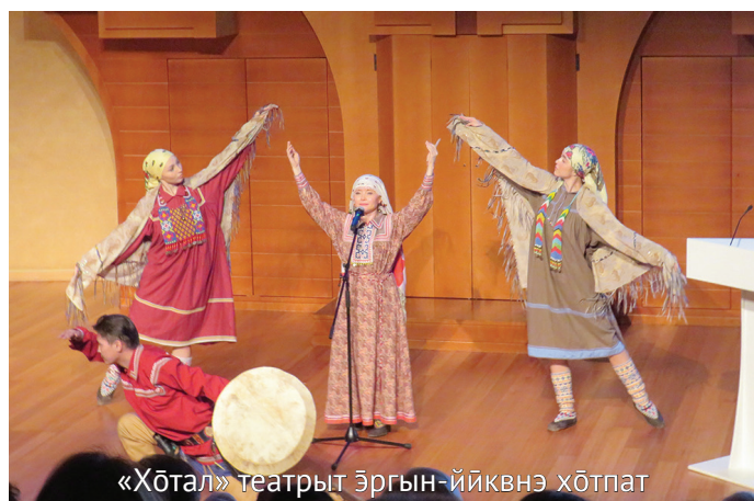
«Хөтал» театрыт эргын-ййквнэ хөтпат

– Щәнь ләтың – ань ты олэв, номсэв манос нэпак хансэв, ты мак эрнэ вәрмалъ. ЮНЕСКО организациян ань олнэ лов тәлыт сыс щәнь ләтың янытлан тәлыг намаявёсыт. Таимәгыс Россия янытыл олнэ сосса мирыт сәвсыр проект вәрёгыт, ань ләтңаныл мөт хон мат вос вәвет, вос ханищтавет. Потрыт манос стихыт шар ущ хансуңкве овылтахтам хөтпат янытлыянүв, сәв ёмас ләтңыл ләвиянүв. Олнэ мананылт кәсыңаныл намың-суиң писателитн вос нётнувет, литературный конкурсытт аквёет вос рүпитәгыт, хансум нэпаканыл акв-тём вос сунсыглавет, ловиньтавет. Округуйт