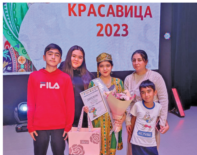
Узбек ағи такви щēмьятэ ёт

лавēsыт ос матыр-āti наканыл бвылтыт потра-ныл хўнтлувēsыт. Тувыл нōх-патум кāсың ағи наме лāvвес ос мўйлупсал майвес. Тох нэмхотыют мўйлупса тāl ат хуль-тыс, ань «Мисс Вдохновение», «Мисс Грациозность», «Мисс Доброта»,