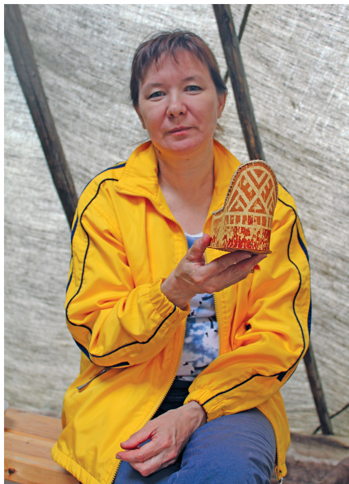
А. Еловицова ёнгын мәнйши апа суссылты, ты А.С. Мерова юнтум апа

– Ати, ам 2007 тәлт Искусство школан рүпитаңкве вöввёсум, тыт пәвлувт музыкальный школат пöслын отделение олы, тыт ам няврамыт пöслуңкве, сакныл