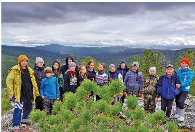
Саранпавыл нъяврамыт нёрыт пёслуңкве тотыглавёсыт