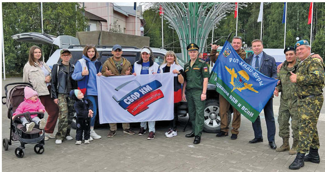
Ханты-Мансийск үст өлнэ мэхум акван-нётхатым СВО магыс рүпитэгыт

Ань та рүпата коланыл тәлэ төвлум кастыл тән палтаныл сәв мэхум тананыл янытлаңкве щалсасыт ос мүйлупсат тотсыт. Тох округ депутат нэ Наталья Западнава бензопила мүйлуптас, үс Дума депутатыт өс акв тамле мүйлупсат вәр-совет. Совет Федерацият