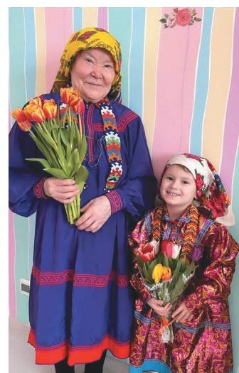
Г.К. Алгадьева Полина апге ёт

анёквам вос ёлсын. Амки анёквэгум-щашёквэгум мөт павылт ёлэг, ты павылт анёкв-щашёкв ат ёньщёгум». Ты әгирищ ёс касың хөтал таве уральтаңкв ёхталы, тән акваёт щәй аёг, потрамёг.