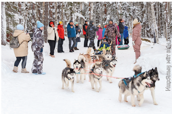
Тэлы порат тән палтаныл мэхум ампың тагыл ёхталэгыт