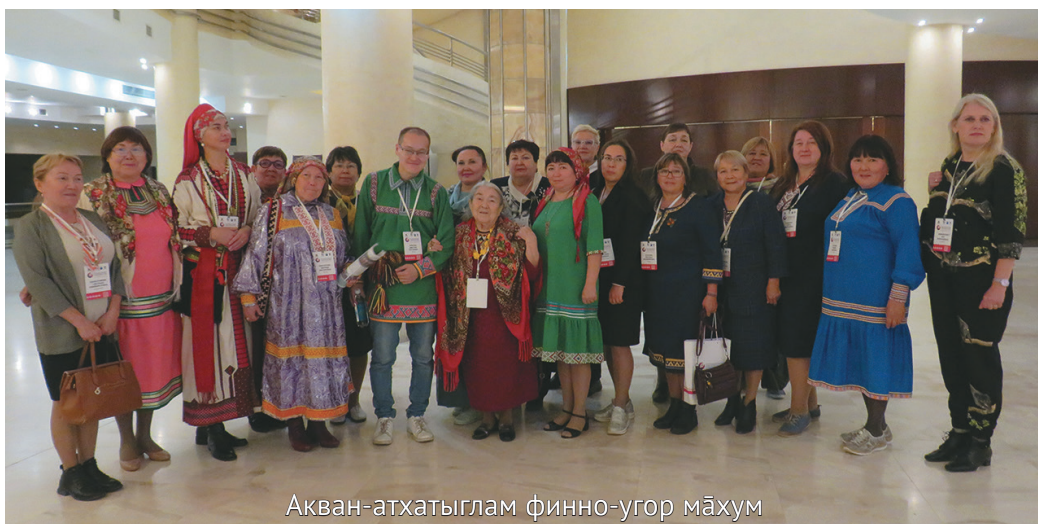
Акван-атхатыглам финно-угор махум

Борис Сергеевич сав ёмас тэла вэрнэ хотпат янытласанэ, диплом нэпакытытл ос магылн тагатап пёсытыл мисанэ.