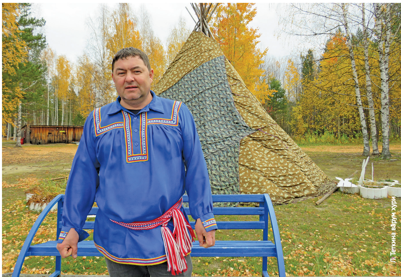
Л. Теткина вӑрӑм хури

Хӑнтаӑ мӑнӑщи хум Виктор Вискунов «Мансийская деревня Старая Мулымья» Советский районт рупитан общинат кӑщаиг ӧлы. Тав Югорск ӱст ӧлум яныг сапрӑнин ӧс ӧхталас. Мӑхум манхурип тӑрвитыӑ вӑрмаляныл урыл тот потыртасыт, та ӧвылтыт 4-5 лӧпсыгт ловиньтӑн.