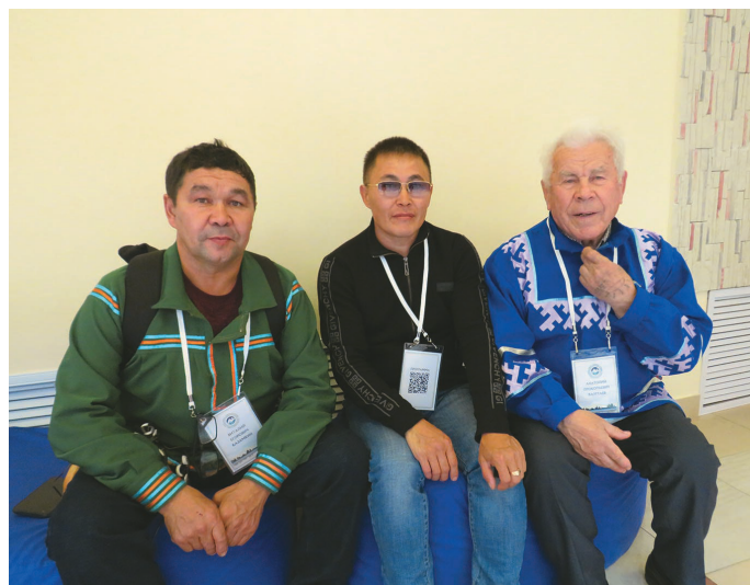
Нижневартовский районный ёхталам хумыт