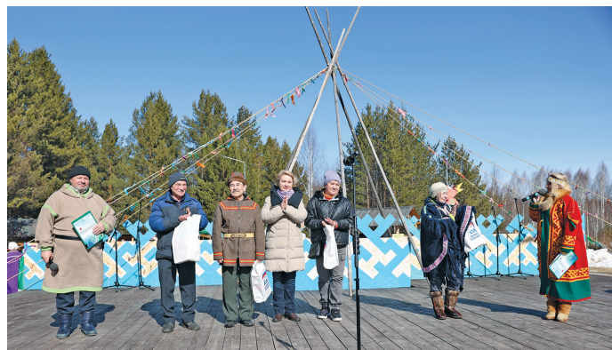
«Уринэква хөттал» янытлэгыт