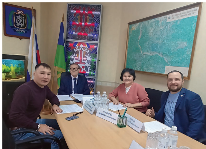
Сossa мир Ассамблеят рўпитан хөтпат

ювле компенсация щирыл тах мивет. Ты кастыл бс сәккон пирмайтавес.