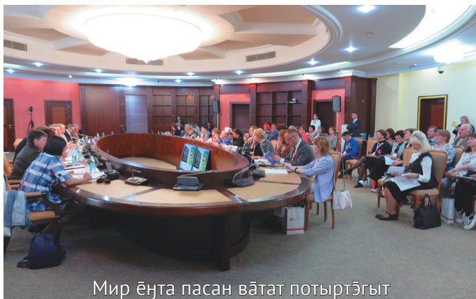
Мир ёнта пасан ватат потыртэгыт