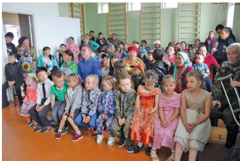
Кимкъясүй пәвилт өлнә мир