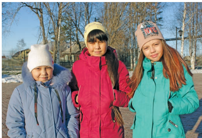
Хурит пёслын агиришит

Й ильпи тал та ёхтыс. Ятил маньщи мир, округт блнэ махум, нананн Саранпавыл няврамыт сав ёмас, сымың латың кётэгыт. Касың хётпа пус кат, пус лагыл вос блы, агиришит-пыгришит щань латың вос хаништэгыт, танти мираныл вос янытлыяныл, пёс йис блупса вос пумцалыяныл.