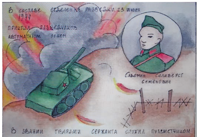
Н. Плачек нэпак-лөпсэ

кит-хүрум ләтың ләвыс. Юграт экономика кұстырыг нōх-паттуңкве рөви, тыт йильпи производстват ос пёс накыт акван-вәрнэ щирыл ке тотавет, таимәгыс мә-вит үргалым вос өньщияныл.