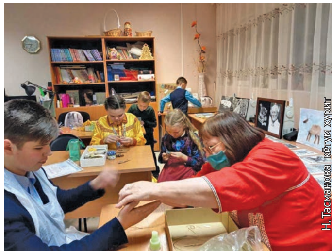
Н. Тасманова кетум хуриг