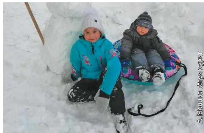
А. Моина кетум хурит

Күщай хум хансыс, «Информационная инфраструктура» ос «Цифровая экономика» нампа