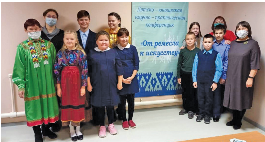
Потрыт ловиньтам ос мәщтырлам нъяврамыт ёт Н.К. Тасманова ос Н.К. Маслова лёлгә