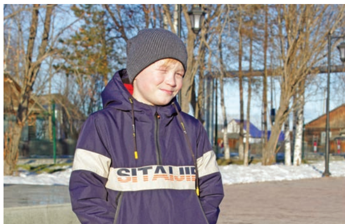
Яныг колтаглыт яныгми

Радмила 3 классыт хаништахты, аэробика вэрнэ тэла палт яланты, музыкальный школат эрги.