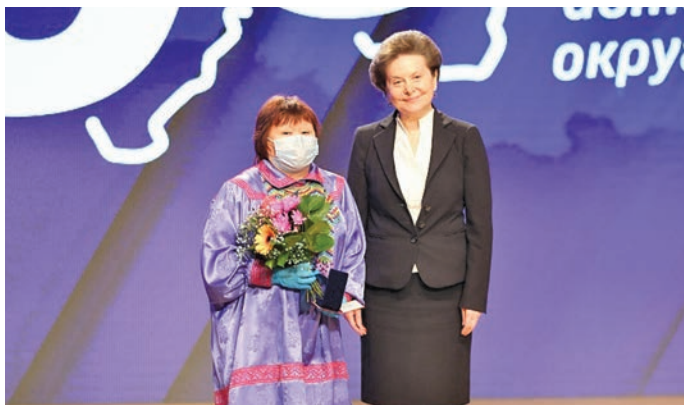
А.Р. Станиславец янытлавёс