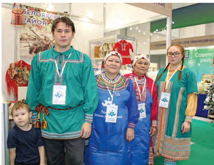
«Няrsa» ос «Потум союм» махум

К асың тал ват саграпнал этпос округу янытлан хотал кастыл Ханты-Мансийск уст «Товары земли Югорской» намба яныг суссылтап щёпиталаве. Мёлты тал округу янытыл өлнэ махум ватыт щёс тыналахтуңке үсн вёвыглавёсыт. Нила хотал сыс махум савсыр атың тэнут, нётнэ пормасыт тот тыналасыт.