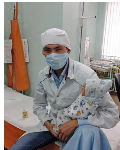
С. Анямов лēккарыг ханищтахтас

гилыт вāрыглэв. Тыньщан пāхвтуңкве ханищтыанум.