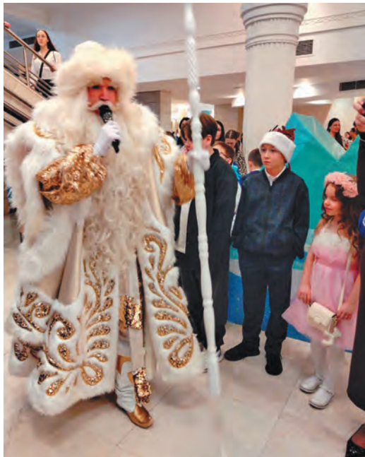
Ащирма ойка няврамыт палт ёми