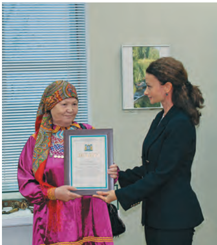
Н.В. Албина янытлаве

Геннадий Райшев колт «Живая нить традиций» нампa тēла палт кит суссылтапыт акван-вāрвесыт. Өвыл суссылтап «Семейные реликвии обских угров» намаим ōлы. Сакв я вātат ōлнē мāньщит, Касум, Āс я ос Юган я вātат ōлнē ханты колтāглыт пѣс пормасаныл суссылтаңкве тотсаныл.