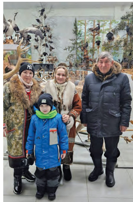
Т.К. Самбиндалов агпанэ ёт пөслувес

1. Нёлме витын ат ханаве, такем та луйги.