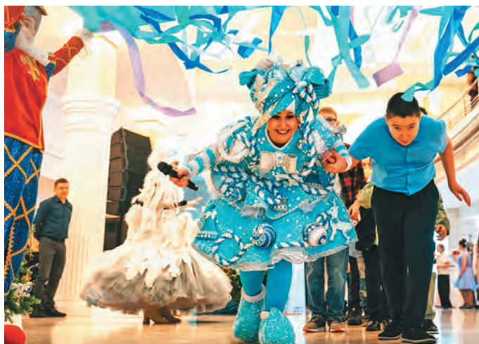
М. Кондин хорамың маснугың аги ёт хайтэг

Мәныщи агирищкве Мирослава Мальчикова Хальүс район Хулюмсұнт пәвылныл омагэ ёт ёхта- лас. Мирослава школат ёмщакв ханищтахты ос