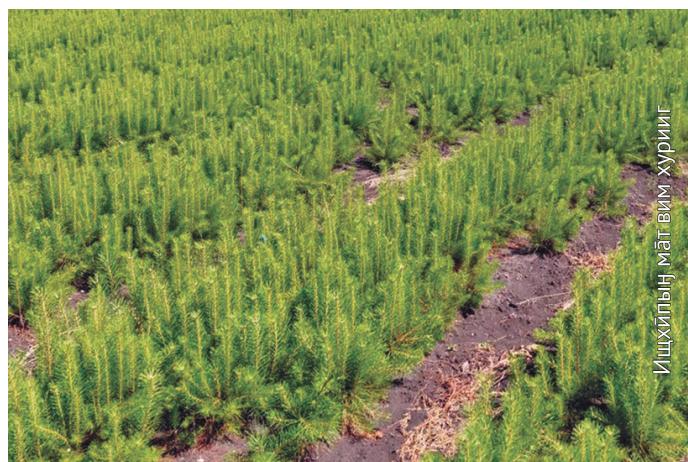
Ишхйлыгн мāt-вйм хуриг

урыл пўмшалахтаңкве питомник-мāн акваг сāv мўй мāхум ёхталэгыт, нйврамыт экскурсиян бс вāтихал тотыглавет.