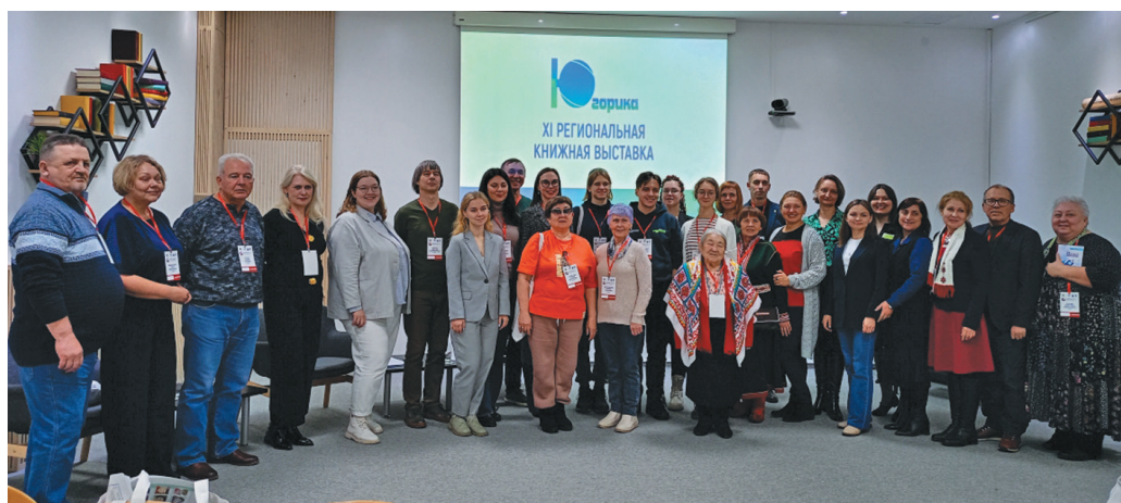
«Югорика» нампа касыл урыл потыртасыт