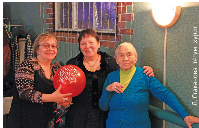
Л. Стаканова тегум хурит

Институт әстламе юи-пәлт, 1956 тәлт тав Саранпәвылн рүпитаңкве тётвес. Тав ётә ёхтум тит әгияге У.Н. Зуева ос Т.П. Стрельцова ёт тән Арда-лыон Вокуюев колт ылуңкве ләввёсыт. Тав кол тәра кәсың әлпыл акв мәнчат пыг рүпитаңкве ялантас, тох тән вәйхатуңкве патсыг ос Павел Филиппов ёт акван-миносыг.