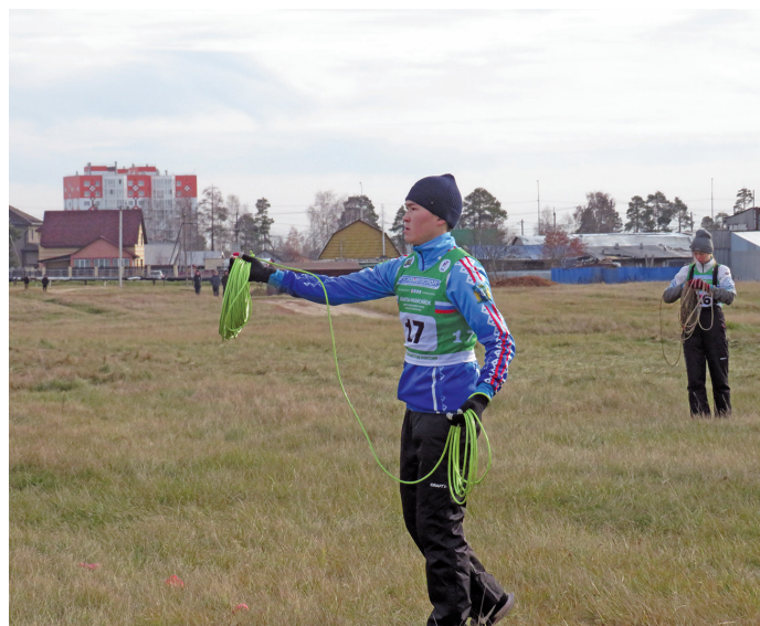
Пыг тыньшаң рёпыгтаңкве щёпитахты

Ань ос акв тәрвит олы, маң сәв тәл сыс таквсы нъяврамыт Сургутский район Солнечный пәвылн вёвыгласанұв. Тот ёмас хәра ма олыс, ань тот сәв яныг кол-капаит ұнттыгпавёсыт. Тыммагсыл ань нъяврамыт сәграп пәхвтуңкве, тыньшаң рёпыгтаңкве Белый Яр пәвылн тотыгласанұв. Ты пәвылквет пуссын Сургут ұс пөхат олэгыт, тамле хәра ма ань тот сака мощца.