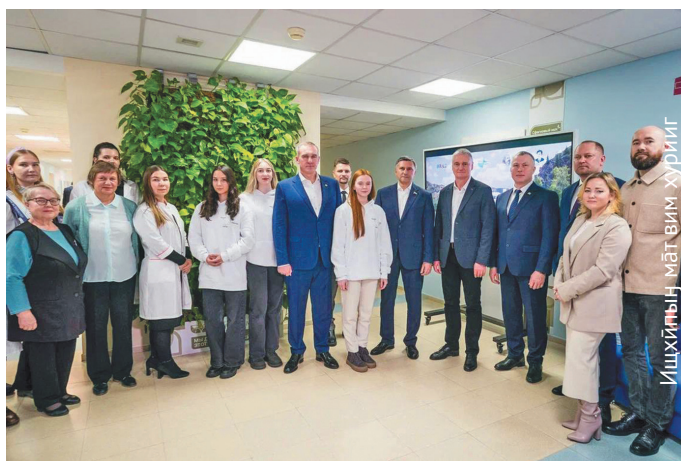
М̄ахум ̄т х̄нтхатыгласыг

– Россиявт м̄-в̄й ос газ йильпи м̄т х̄нтэ порат м̄ан акваг н̄тмил в̄р̄ев. Ань Юграт м̄-вит үргалан, норыт т̄астын ос м̄т с̄авсыр проекты в̄рнэ х̄тпат ̄т потра- мас̄ув. Ты р̄упатанын н̄ан сака м̄схалыг ̄лалы тотылын. М̄тынтыг, хунь ̄с акван-атхатэв, ты т̄ланув урыл ̄мщакв потыртэв тах.