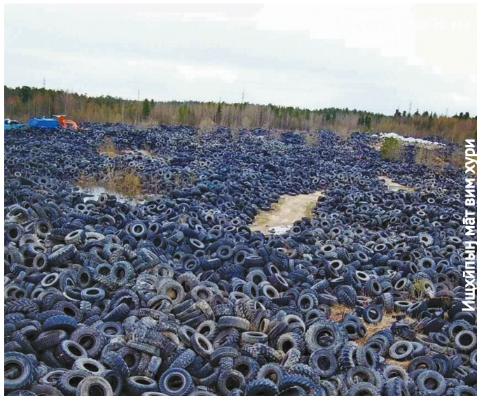
Ишхипыг ма́т ви́г ху́ри