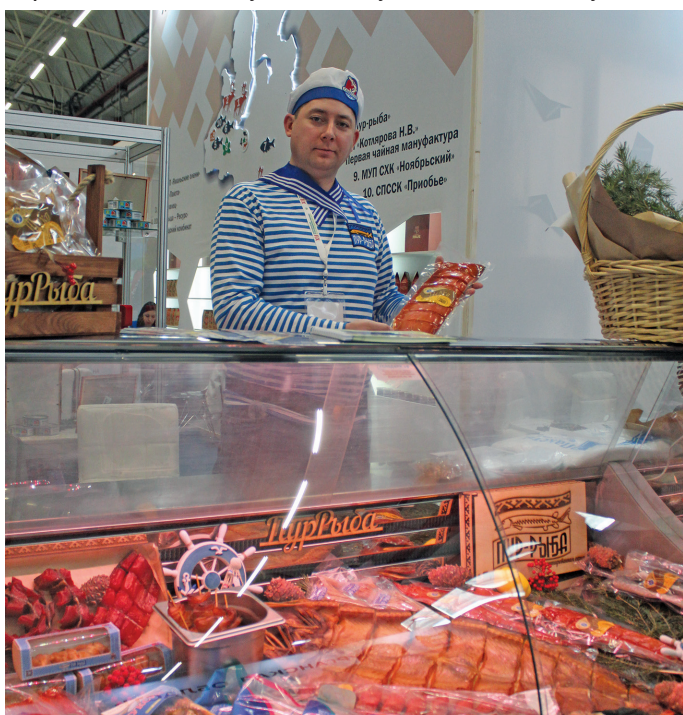
Б. Бубон хұл тыналы