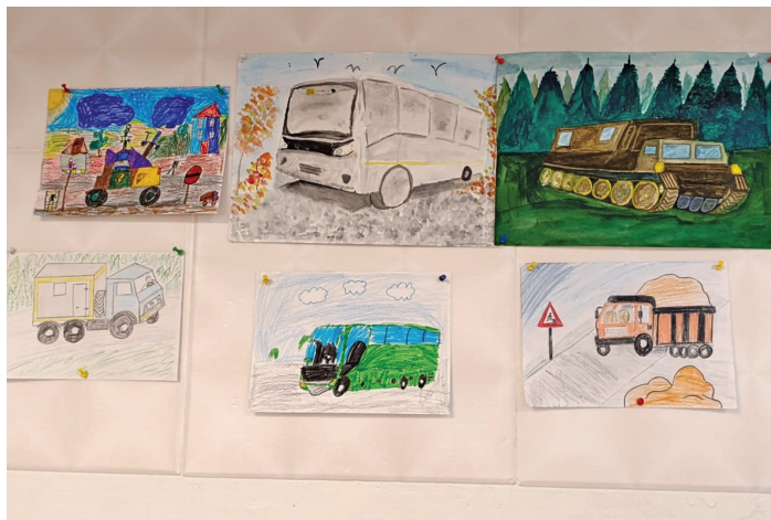
Няврамыт пәслум хуриг.

Ты хөтпәт – кос лөх щөпитан бульдозерыл, кос сэй хартнэ самосвалыл, кос мәхум тотыглан камазыл ман автобусыл яласан хөтпәт – пуссын кәсың әлпыл лөккар нән сунсавет, тувыл ущ рүпатаң тәратавет.