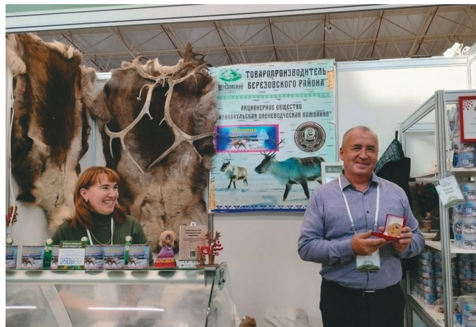
Сāлы нёвлиң тэнут тыналэгыт

Сāвсыр касылытн ты вāрим тэнутанув тув кётыанўв, жури-хōтпатн колбаса ос тушёнка пāнкат ёмщакв уральтавет