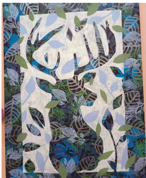
Сӓлы нӓтнӓг пӓслы