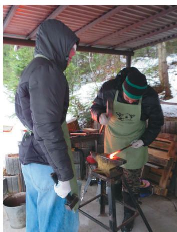
Хумыг кӅр толтӅг