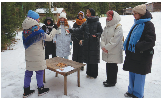
Школат ханищтахтын Ӆгрищит Ӆнгынугыл суссылтавет