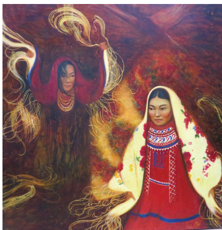
О. Мерцалова катыл пӧслум хуритэ