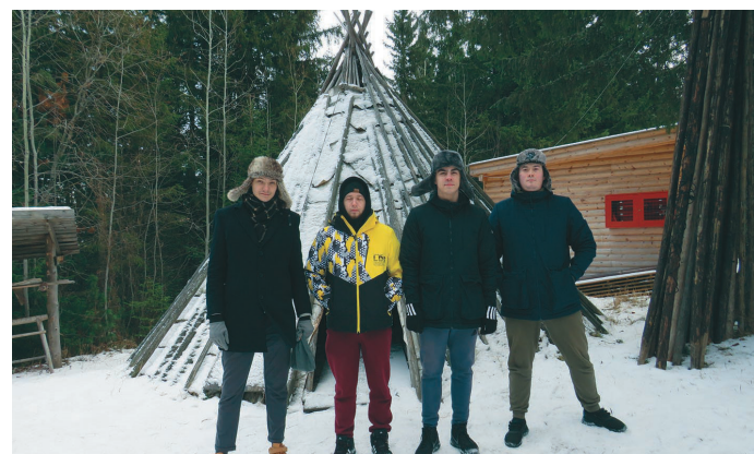
ЮГУТ ханищтахтын пыгыт нӅврамыт Ӆнгалтаңкве нӅтсыт