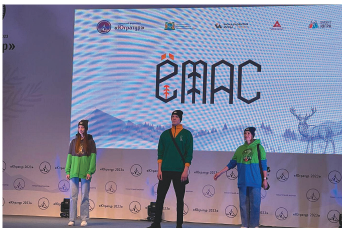
«Ёмас» маснутыт суссылтавет

Т ы эппост Ханты-Мансийск үст «Югратур 2023» нампа туристский форум вәрыглавес. Овыл тамле вәрмалы 2001 тәлт блыс, та пәсныл кәсың тәл мәхум тыт атхатыгләгыт, сәвсыр регионитныл ёхталәгыт, сыресыр вәрмалит тәра-паттәгыт. Ты яныг форум округ миркол, развитие Югры фонд ос конгрессно-выставочный центр «Югра-Экспо» щәпитыяныл.