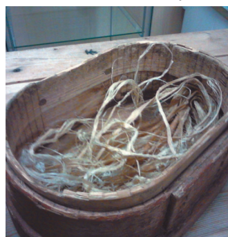
Саран ләтңыл ты тәтап ләваве – «куд»