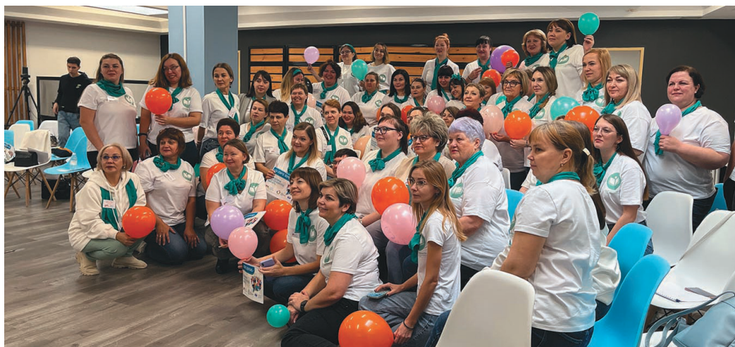
Няврамытн ханищтахтуңкве нөтнэ хөтпат