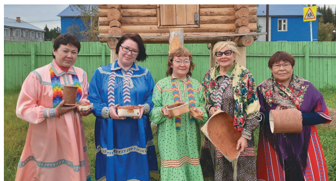
К. Супрун мәхманэ ёт вөртыпал нупыл лүли

отделын рүпитаңкве ёхтысум, культура кол пёс ос сака ащирмаңыг олыс. 2020 талт «Светлячок» нампа нъяврамыт уральтан кол лап-пантвес, нъяврамыт «Кораблик» йильпи колн вәнтлысыт. «Светлячок» колт мән ань тыг мус рүпитэв, колпөх мә сака яныг, кол ёмшакв щёпитаслүв, мүй хөтпат ёхталэгыт, сав ёмас латың культура кол урыл ләвёгыт.