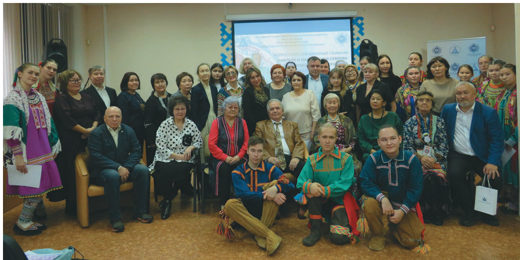
Лүимә мирыт Санкт-Петербург үст ханищтапын акван-атхатыгласыт

Тувыл Софья Александровна Урун, Лүимә мирыт институтт кұщай нэ, А.И. Гашилов намхөталэт янытластэ, яныг кұщайт кетум янытлан пищмат ловиньтасанэ. Акв телеграмма РФ Государственный Дума Федерация сапрани палыл И.С. Неверов хансум, кит янытлан Грамотал кетвес ос ма-