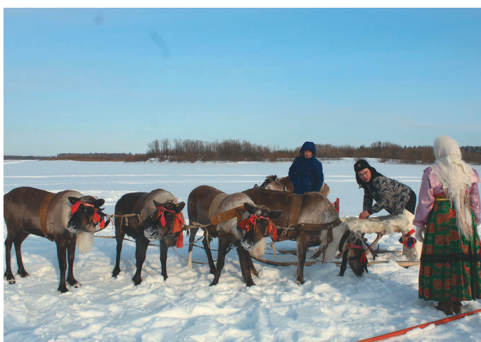
Мāнылат сāлың мāхум