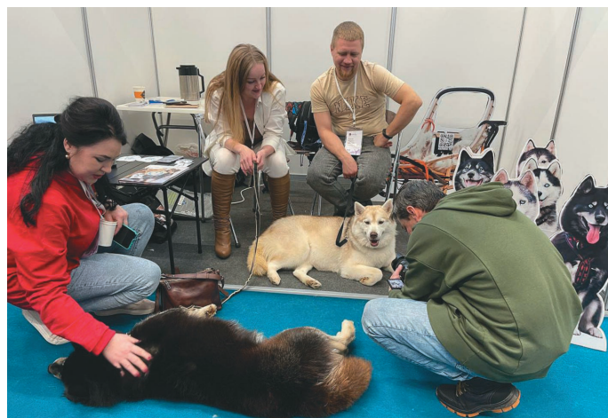
Хаски әмпыт тотыглавёсыт