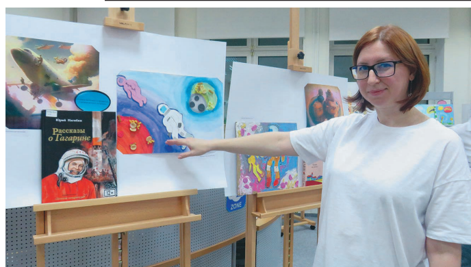
И. Грохотова ищхыпың утыт урыл потырты

граммат блэгыт, та щирыл матыр-әти вәрёгыт. Ты йильпи тәла тай сака пұмщалыяныл – акв хотты нәпакныл потыр-охса выгүв, тувыл ты урыл няврам кәтыл хури пөслы, ос уцты ләвылтам искусстванныл интеллект ут хури бс щёпиты, тувыл таве мән сунсыглаңкве вөрмилүв.