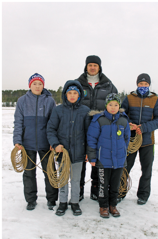
Атэй нӧврамыт халт щар мӧниг ӧлы, 2016 тӧлт

Тав Нижневартровский район Варьӧган пӧвыл- ныл тув ӧхталас. Тынь- щан пӧхвтуӧкве, сӧлыӧ сун ӧлтта поргунӧкве сака хӧсы. Атэй рӧтанӧ