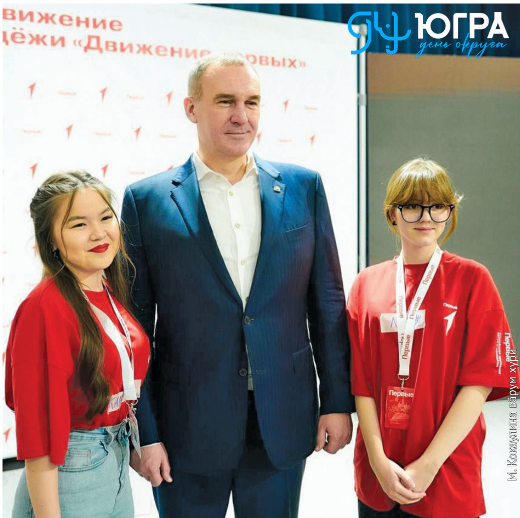
М. Коксаулицына. Вәрум хури

Ват сәграпнал этпос 10 хөталэ – өлнэ мāv янытлан хөтал !