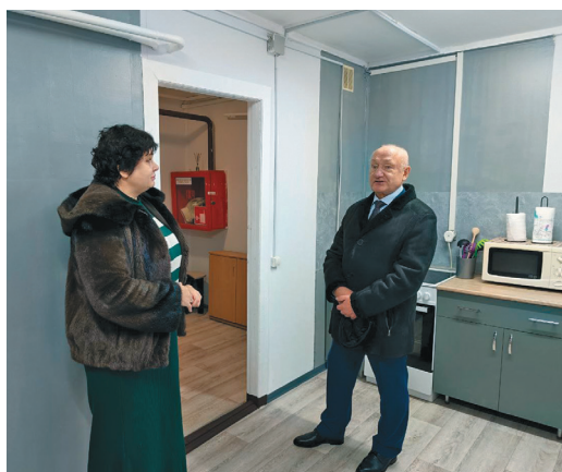
С. Маненков өхталас

Нэ ләвме щирыл, ань олныл маим юи-пәлт тән пәс кол тәра өмщакв хот-щөпитаңкве патсаныл. Сүкыр этпост тот рүпитан хөтпат колкан пәртыт йильпииг пентсаныл, нәйпос тотнэ пәс кәрквәлгыт йильпииг вәрсаныл.