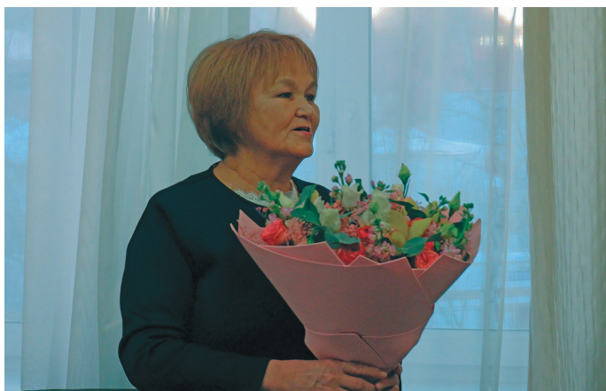
Яныг таквс этпос 26 хөталәт Т.С. Гоголева намхөталә блыс, ты кастыл сапрәни өлум порат тав махумн анытлавес