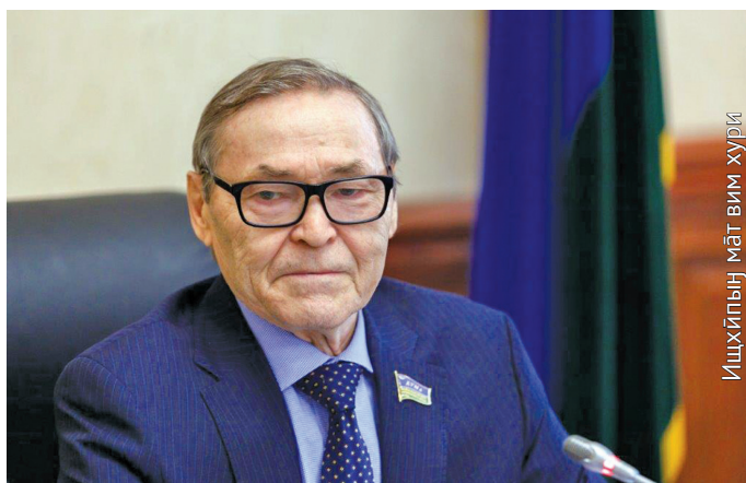
Ишхыпың мәт вим хури

Ты программа хосыт мәнщи, ханты ос ёрн махум олныл нәтавет. Мөтыт тәлт университетыт манос колледжит ханищтахтын 400 мәншат агит, пыгыт олныл тах миңкве патавет. Мән округут кәсың туи сасса махум мәнхәпыл касуңкве акван-атыглавет. Тамле касыл щәпитан магсыл мөтыт тәл нелю-