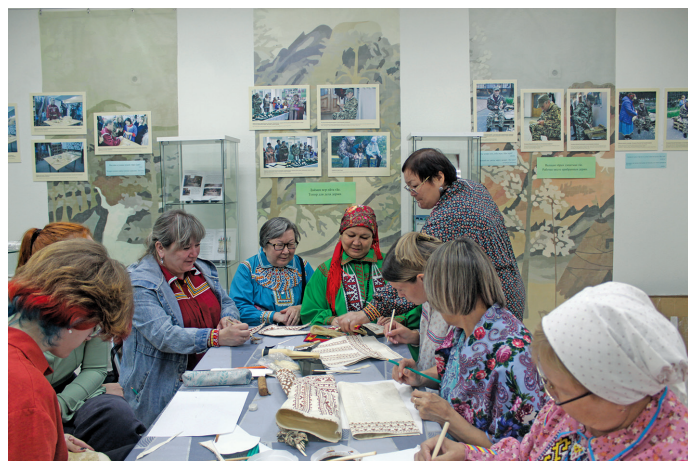
Валентина Григорьевна мэхум ханищтыянэ

вит исыглы, сун вәрнэ йиваныл тув тартыяныл. Тувыл хота мус эри, хүтылтыяныл, квәлгыл нэгсальяныл. Та торыг нәлми вәтан нэ хөтпат ос ныврамыт ёхтэгыт, оманув матыр сагёгыт, юнсахатэгыт ман тынтлахтэгыт, ныврамыт ос ёнгасэгыт, хайтыгтэгыт.