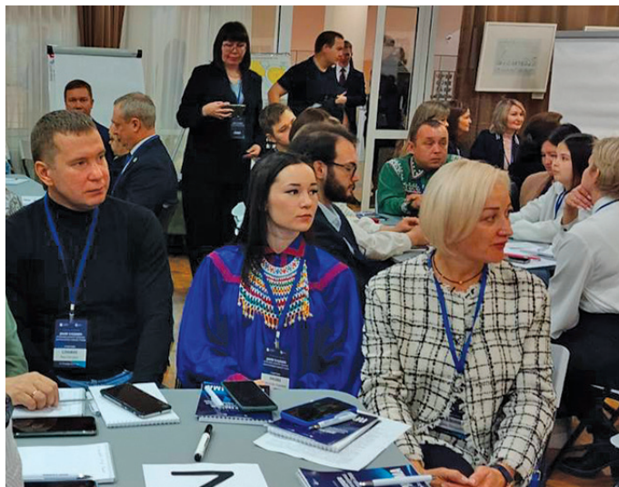
А.А. Лисова мәхум халт котилът үнлы

М әньлат әги Александра Лисова ęt ам Ханты-Мансийск үст хөнтхатыгласум, тав соссa мир акв яныг вәрмалын атхатыгламаныл порат Хальүсныл ęхталас.