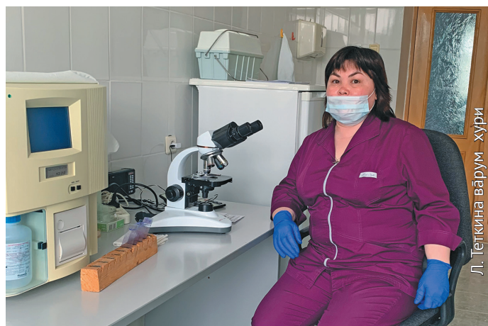
Л. Теткина вәрүм - хури

Әквумн тәкыщ ошвёсүв, мори хәйтуңкв ат тартвёсүв. Акв щёс әквум үсн минас, мән мәннкёв юн блсүв. Мән әквум әгитэтыл акв янытыг блсүмән, картошка пәйтсүмән. Аргән сәв картошка ниль-мүмән: я-а, хоталь то-туңкв? Вөрн хәйтсүмән, тот та ләкквә щивгалты-янмән. Әтэпыл үйхуланамән тыттысанамән, шар уссамыг та порат. Акв