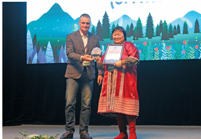
В. Тарлина А. Забозлаевын янытлаве

– Ам Ванзеват павылт самын патсум, тот яныгмасын. Пәвлувт Ас я вәтат үнлы, туи янге-мәне я вәтан атхатэгыт – хум хөтпат лувыңсун вәрёгыт, тукат, та маныр. Яныг кёр пүщка витыл пиныяныл, ёлыл аращ пәлтэгыт, хунь