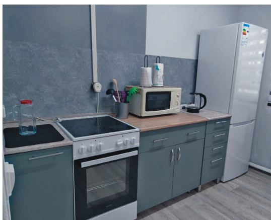
Тәнүт вәрнэ колкан