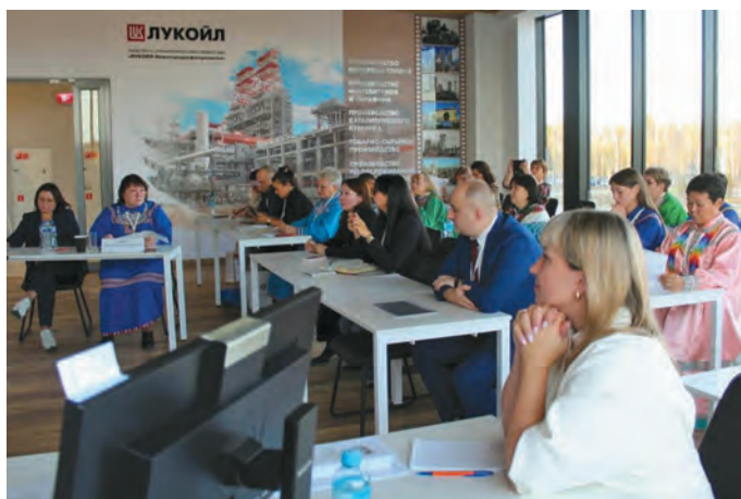
Мәхум потыр хұнтлэҕыт

Тувыл 2026 тәлт мир пусмалтым өс акв йильпи нәиңхәп витын тәратаве. Тот вәт нупыл ат ләккар рүпитаңкве паты. Тән аквторыг атпан сәвит элумхөлас уральтахтуңкве вөрмәҕыт тах. Тәлы порат ос янығ машинат ләккарың тәгыл тәлы ләңх хосыт пәвлытын ялантэҕыт.