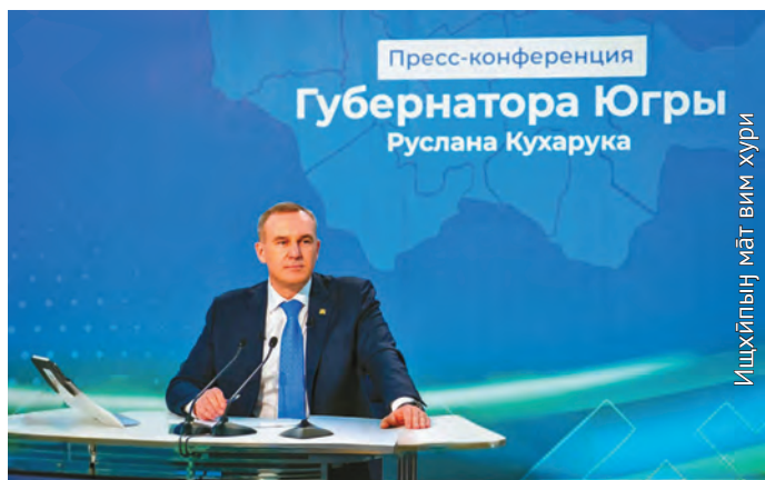
Ищхйпың мāt вим хури