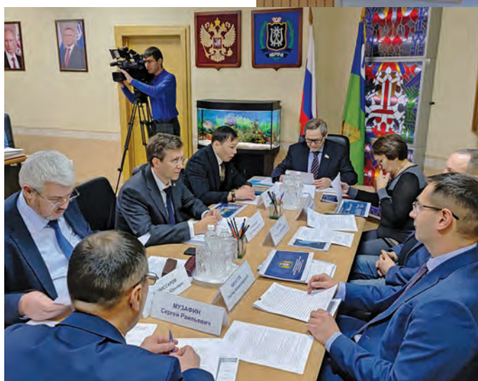
Ассамблеян ёхтум кўщайт

эт соглашение-нэпак хаснэ вārмалы үрэгыт. Ос «Лукойл» нампа компания тāн этаныл нэпак хансуңкве ат вөрмэгыт. Тāн лāвнэныл щирыл, ты соссa щēmьят тāнки йис