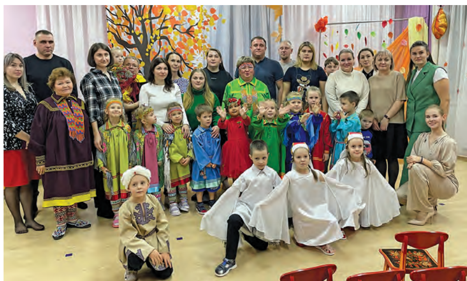
Ёнгум няврамыт ос щāнь-āщит