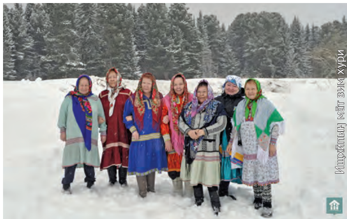
Любовь Васильевна сосса нэт халт лөли