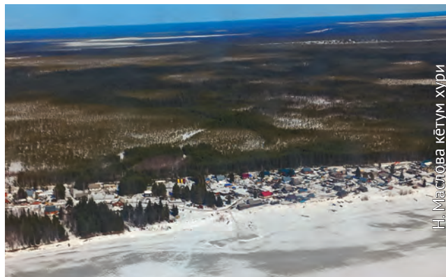
Н. Маторова кетум хури

◆ Рүпата сәв олыс. Төва хөтпат саранхәп вәруңкв кётавет Хәльүс нупыл. Төнт олөв, ань йис холыт сәвсыр уляңхәп пормас хартуңкв хунь олы. Таимәгыс яныг саранхәпыт (неводник) эрөгыт. Туи пум тотәгыт, таквсы порат мис, лув то-туңкв. Тәлы ёмты ос лувыңсуныл