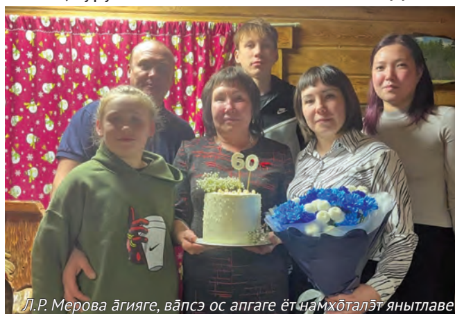
Л.Р. Меровва áгияге, вáпсэ ос апаге ёт намхөталэт янытлаве