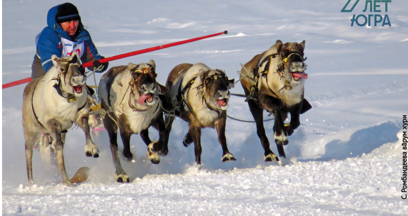
С. Ромбандеева вәрум хури

Ты хурит Хальүс район Саранпавыл сәлың хум пәслым блы. Тынакт Ханты-Мансийск үст сасса мирн нётмил вәрнэ Ассамблея депутаты́т сапрәни вәрыгласыт, йис мāt блнэ ос рүпитан сасса мāхум тәрвит вәрмаяныл урыл потыртасыт. Ты ляххал 4 лөпсыт ловиньтәлын.