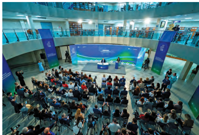
Округ кўшай Р.Н. Кухарук потырты

пыгыт сәлың сун ұлтта поргункве, тыньшаң рёпыгтаңкве, ошща йив-өвыл ёт хайтыгтаңкве ос акв мәныл элалы поргункве ос сәграп пәхвтуңкве хаништахтэгыт. Ты коныпал тот сәлың мэхум тәнки халанылт касуңкве өс вәтихал акван-атхатыглэгыт. Та районт өлнэ сосса щёмьят туй мәнхәпыл товункве ялантэгыт ос өвыл мёста акваг вуйлэгыт. Тынакт Аган павылт өлнэ ёрн пыг Атэй Лялькин Хабаровск үст мөт мәнътлат хөтпат халт касмёт, 950 щёс сәлың сун ұлтта порыгмас. Тыил савнув мән округувт нэмхотьют ат порыгмас, Атэй ань рекордсменыг хасвес. Лях-