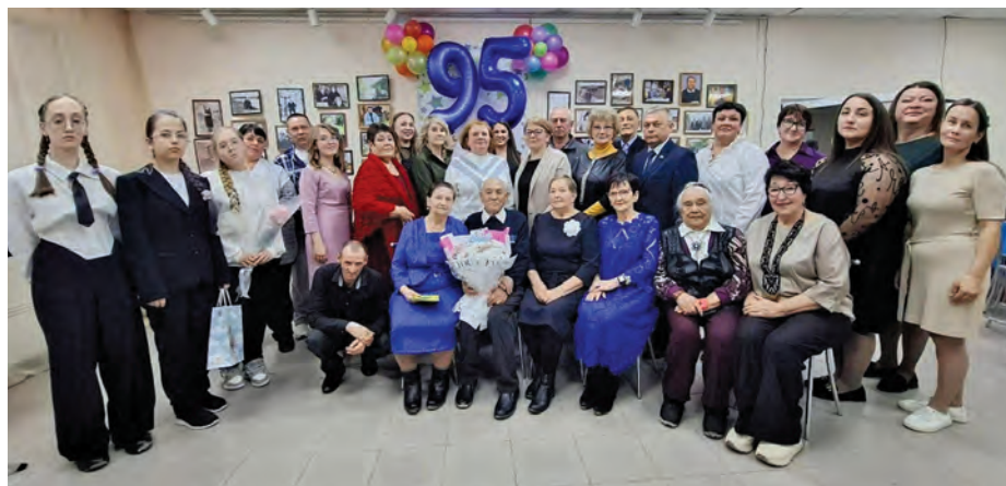
А.Н. Хомяков музей-колт янытлавес