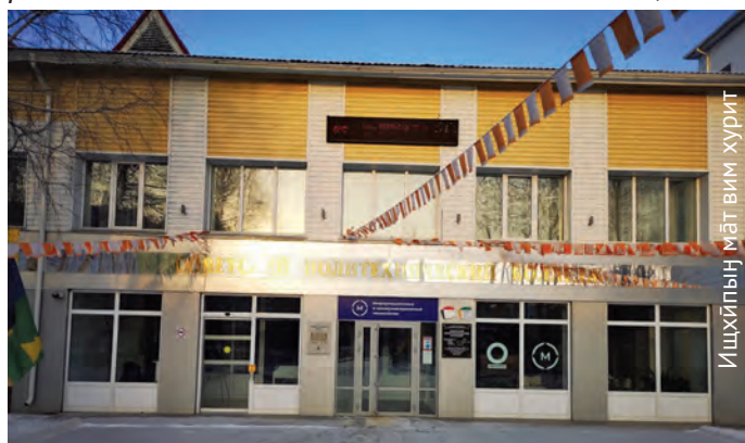
Советский ўст ьлнэ ханищтахтын кол