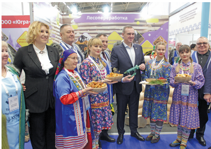
Округ кўшай Р.Н. Кухарук мэхум ёт пöслувес

В ят сáграпнал этпос 8-10 хөталытт Ханты-Мансийск үсн тэнут-пормас тыналан мэхум ёхталасыт. Ты вэрмаль руш лätңыл «Товары земли Югорской» лававе. Округ янытыл сáвсыр маныл тәнки рүпата вэрнэ китсät арыгтем хөтпат тэнутаныл ос пормасаныл тыналаңкве ёхталасыт. Төва хөтпат тыналан утаныл «Югра мät вэраве» нампа пöсыл ханлым блэгыт.