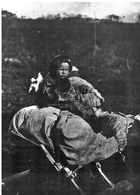
Оматэ 5 тэлэ, ёрнколт