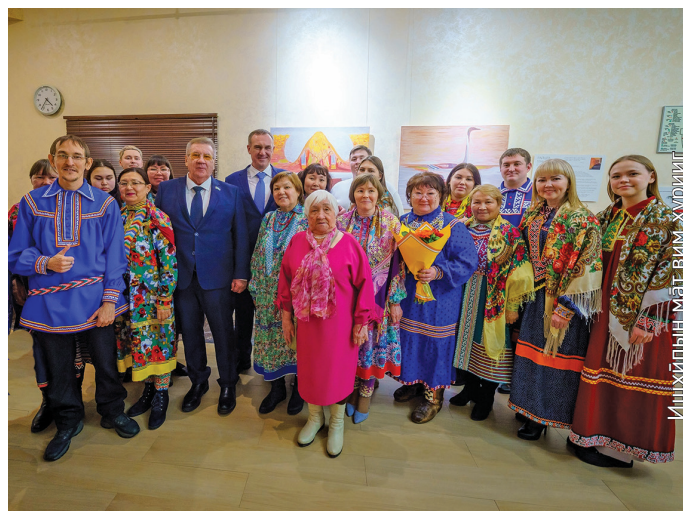
Кӱщайг ос сосса мӧхум аквӧт пӧслахтасыт