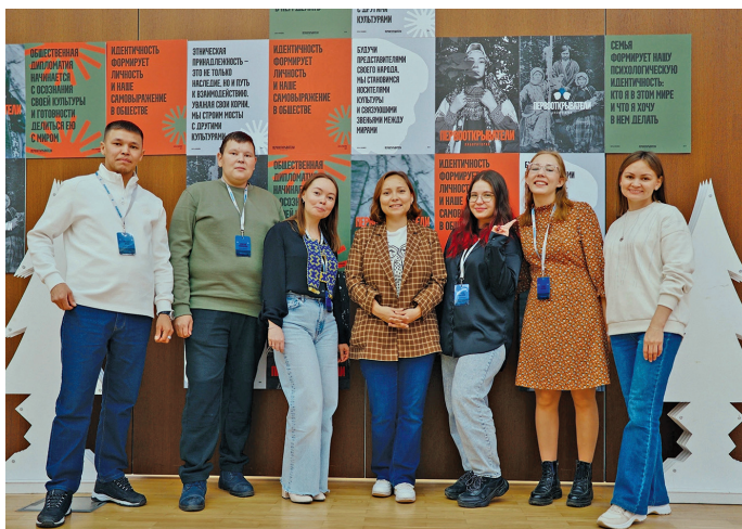
Потрыт хансум мэхум