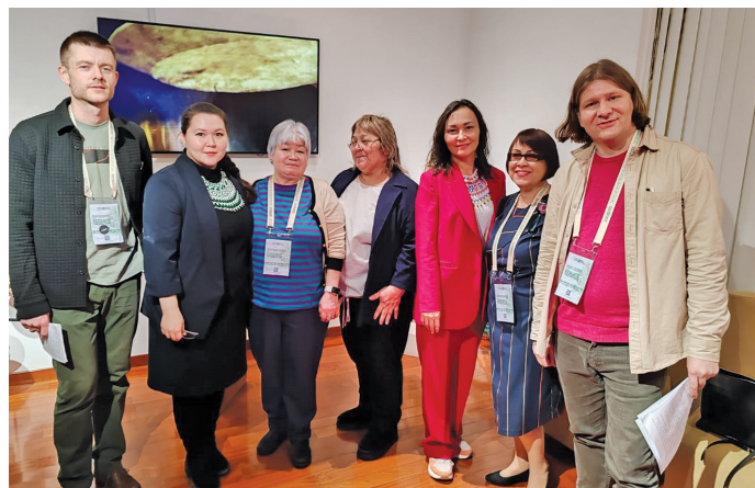
Е.А. Пивнева наука щирыл рүпитан мähум ёт

наканыл ос Төрүмн, Нäй-Öтыранылн пöикщан öвылтыт потырт ловиньтасыт.