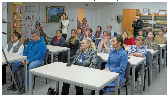
Ӓс-угорский институтт атхатыглам мӒхум

ТӒпсвӒтпӒавылт акв кол ӯнлыс. Тот Ӓстин Анемгуров Ӓкватэ Ӓт Ӓлыс. Ӓстин Ӓйка акваг вӒраим яласас.