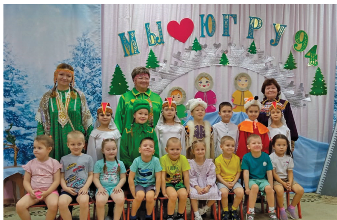
Ялпың хөтал порат