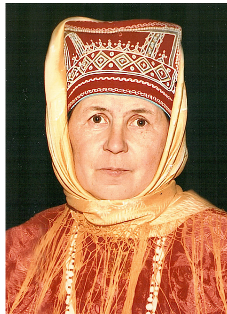
Оматэ саами маснутыл Өлы

суссану́в. Тох рупитамум щирыл ам округ янытэт яласаслум, яныг усытт ос мәнһ павлытт Өлсум, сав махум ёт хонтхатыгласум, вайхатасум.