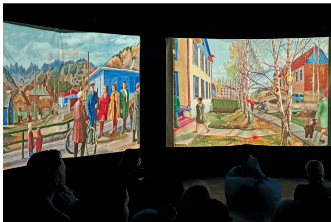
Хурит тох суссылтавӕсыт