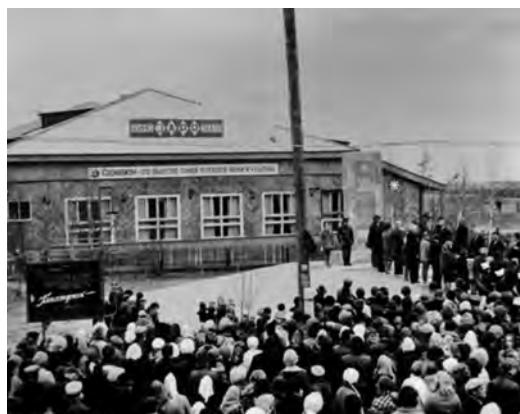
Междуреченскийт 1978 тәлт памятник вәрвес