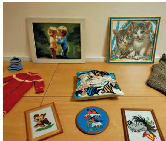
Катыл вәрум пормасанэ