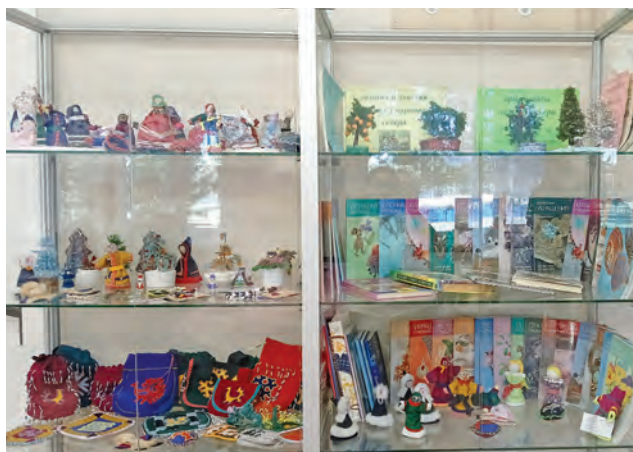
Няврамыт катыл вәрум пормасын