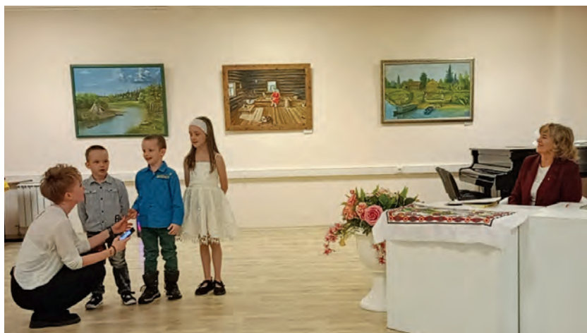
Г.С. Вакуева ёмаспал нупыл ўнлы, апыгрищанэ эргёгыт