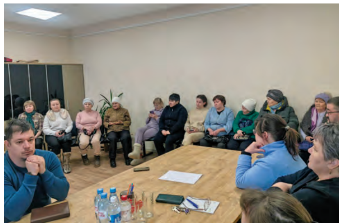
Мирколн ёхталам махум

– Ам кәсың ёмт тал котиль этпост Хальүс мām хосыт яласэгум, лов талыг ты ёмтыс тох яласанэм. Ам кәсың павылн хойглэгум, павлың махум ёт хонтхатыглэгум, тән ётаныл потыртэгум, маныр тәрвит оныщёгыт-ёл-хансыянум. Рётың юссуй этпост Думат заседание