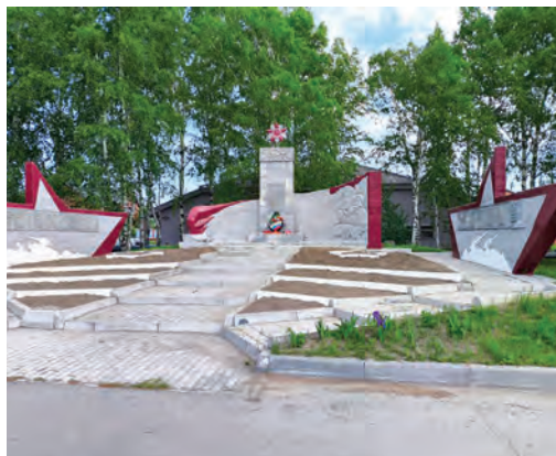
Междуреченскийт вәрим памятник