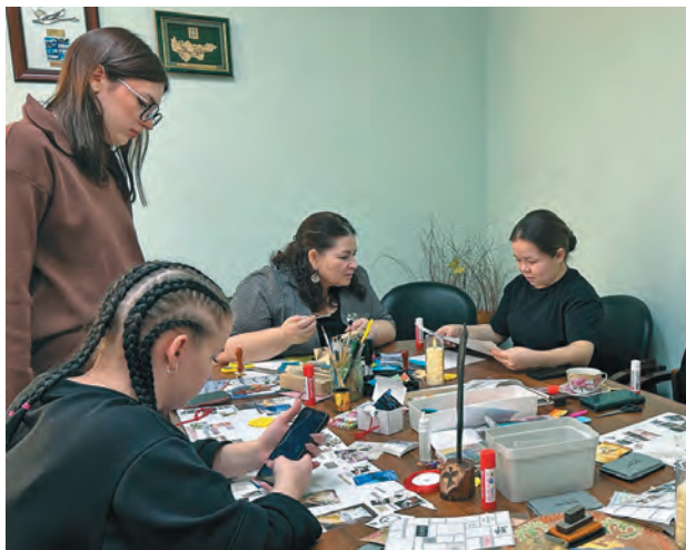
Агит хорам вәрәгыт

Т әл котиль этпос 25 хөтәлэт Россия янытыл ханищтахтан мәньлат мәхумыт ос Татьяна нам янытлан хөталыг олы. Кәсың тәл колледжит ос институтта ханищтахтан мәньлат хөтпәт янытлавет. Та кастыл музейт ос культура колыт сәвсыр вәрмалит вәрыглавет.