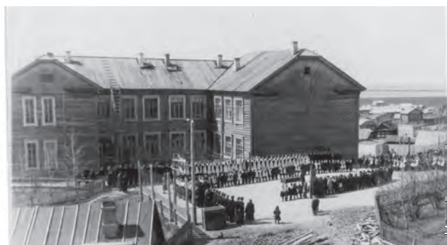
№ 2 пёс школа, 1950-1960 тәлыт порат пөслүес