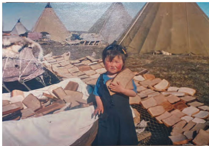
Таня мән порат ёрнколт

Тувыл ищхыпың мāt лөпс ыныщэгум. Тув ёрн ләтңыл матыр-әти пинэ-