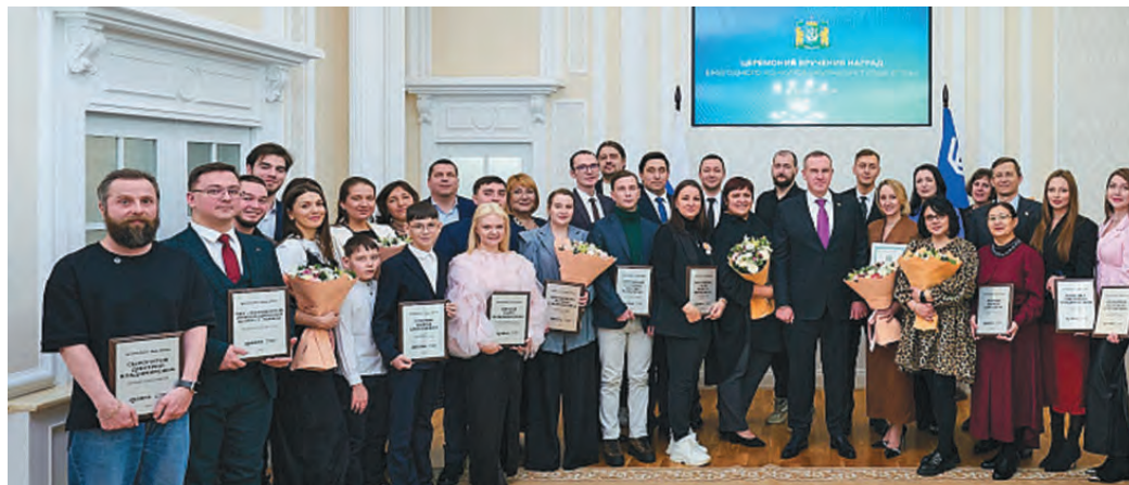
Р. Кухарук ос округ кўщайн янытлым мэхум

Мāн, редакция рўпитан мэхум, ты касылыт нōх- патум хōтпат янытल्या- нўв! Сāвнум ёмас, эрнэ ляххал мирн вос тотэгыт, рўпатаныл акваг щирыл кāркамыг вос вāрияныл!