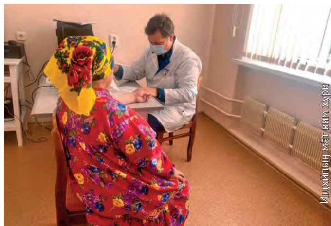
Ишхйпың мәт вим хүрә

Яңк нәтнэ этпос ойгпан юи-пәлт кит нәиңхәпыг рүпитаңкве ыс аквата тәра ывылтахтэ. Ты элы-пәлт округув янытыл сәв тәл «Николай Пирогов» нәиң-