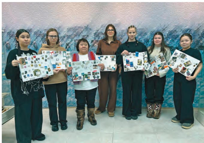
Музейн ёхталам хөтпәт