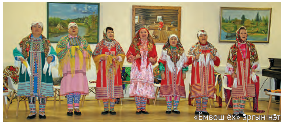
«Ёмвош ёх» эргын нэ

яныгмасүв. Алексей Семёнович бс нййт хөтпа блыс. Элаль ам Маша увшим палт яныгмасум, әтям тав мәнә эще, Сё-Яха пәвылт блсүв. Ты пәвыл Ямал мāt Обская губа намба Карский щәрщ витн лап-амарим вәтат үнлы. Тот ам аквхуйплов класс мус ханищтахтасум. Тувыл Ханты-Мансийск үсн ёхтысум, тыт