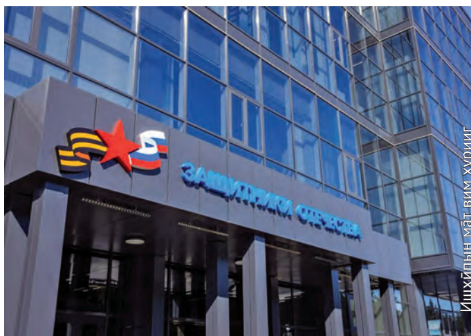
«Защитники Отечества» кол, Ханты-Мансийск ўс

щәмьяныл савыңпәлэ ЖКХ ойтхатнэ вәрмалит, нәлок-олн ойтнэ тэлат тәра-паттуңкве тув ёхталэгыт. Тувыл ос ань сав хөтпа кол ўнттын мағыс мāl-лөмт винэ урыл китыглахтэгыт.