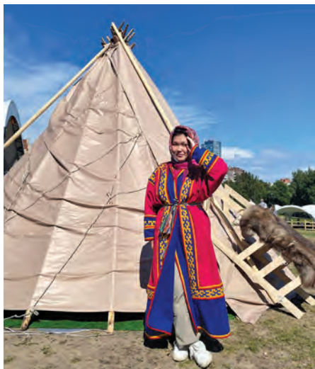
Ёрнкол пөхат пөслувес