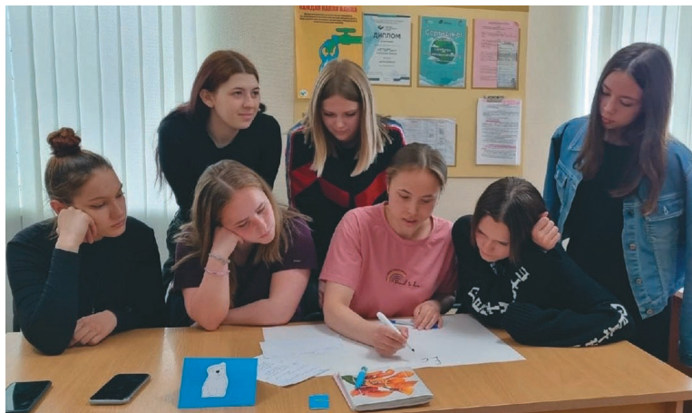
В. Тимофеева агит халт котилыт үнлы