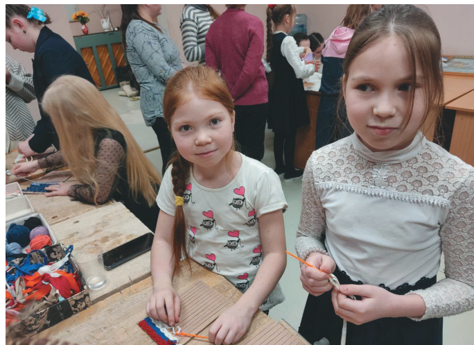
Мәньщи әгирищквег Мирослава ос Эвелина Мальчиковыг

Горайнова Вероника 9 тәлэ «Очелье» нампа потре олыс. Очелье - ты кент хольт пуңкын пиннэ ошща сәлм.