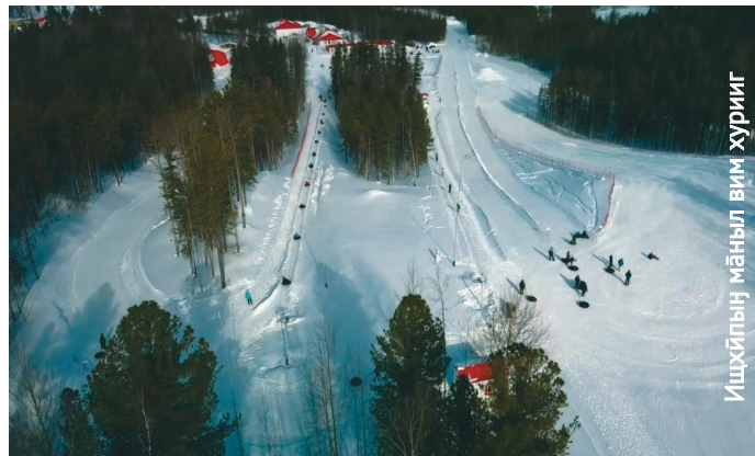
Ишхйпын маңыл вим хуриг