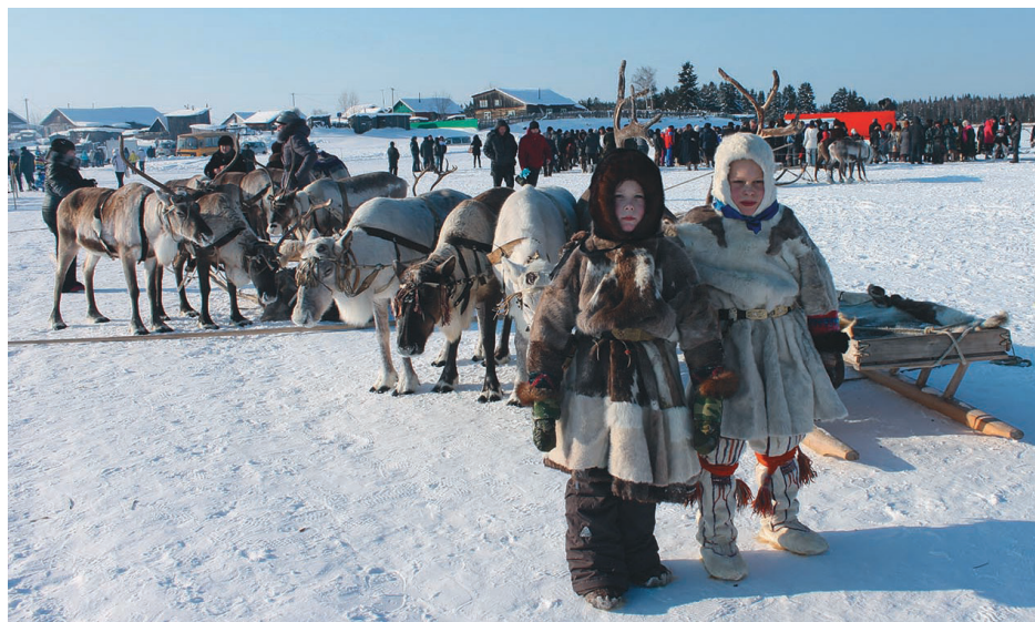
Салыңколт яласан махум няврамыг, 2013 тал