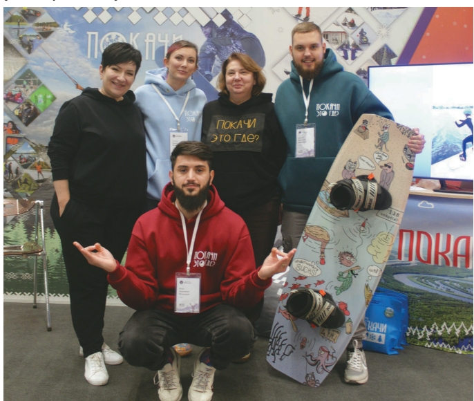
А. Звычайный ёмаспал нупыл лүли

Округт өлнэ ятил мәхум, «Урман» мән ўцлахтуңкве, тахсуңкве ёхталән. Мән касың хөтпан щәгтэв. Пустәгыл өлән!