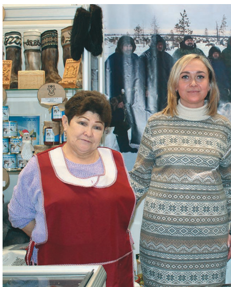
Касум павыл нӧквет

– Белоярский районт сав оленевод-частникыт рўпитэгыт, тан тӧнти салыяныл янмалтыяныл. Ман тан ётаныл договор