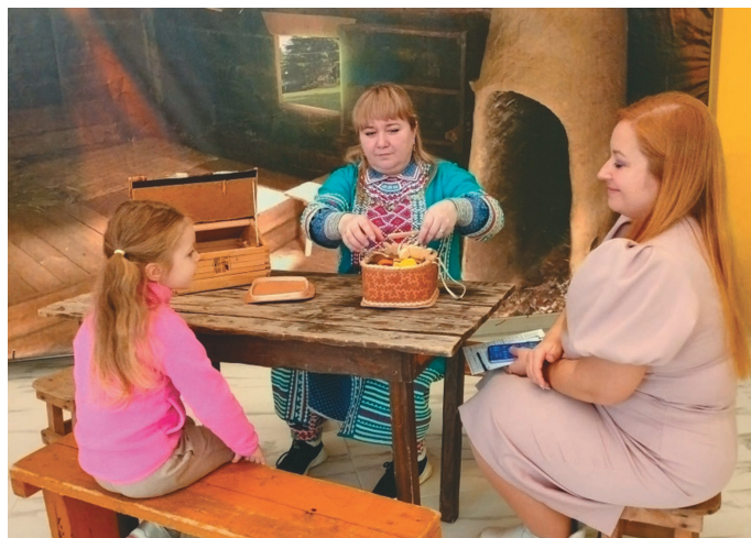
Н. Коновалова сосса өлупса урыл потырты

Тох «Төрүм Маа» музейт рүпитан мәхум ханты ос мәнщци пөс өнгилыт суссылтасыт. Тән тот мөйт мөйтсыт, әмщит әмщисыт. Куклаң театрыт рүпитан хөтпат «Варежка» нампа фестиваль урыл потыртасыт ос тәнки матыр ощхуль вәрнә тәла-