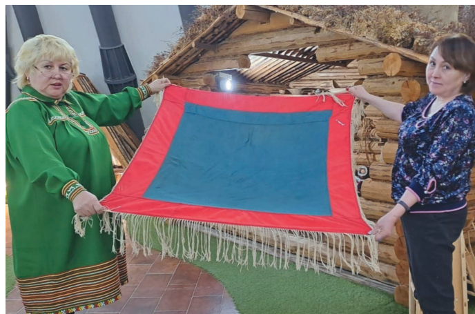
И.К.Фирсова ос В.А. Пяк вәтаңтөр суссылтэг

Раиса Загородняя ләвыс, пёс порат нэ хөтпа мүйлупсаг акваг төрыл мүйлуптәлвёс ос тав сәвсыр маснутыт коньпал самн патум нъя-