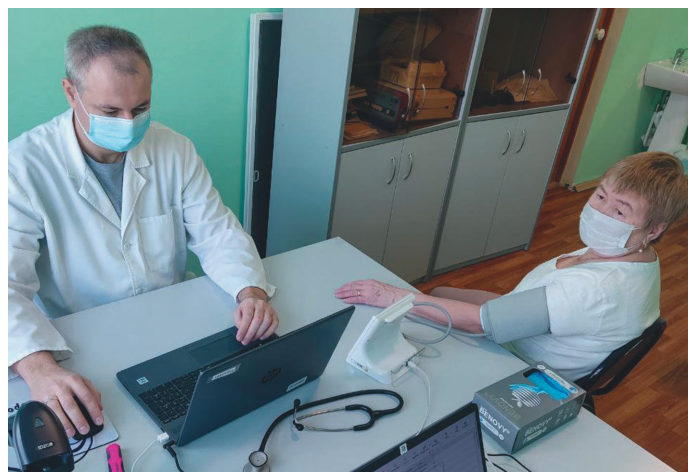
Ф.А. Мони́на лёккарн китыглаве