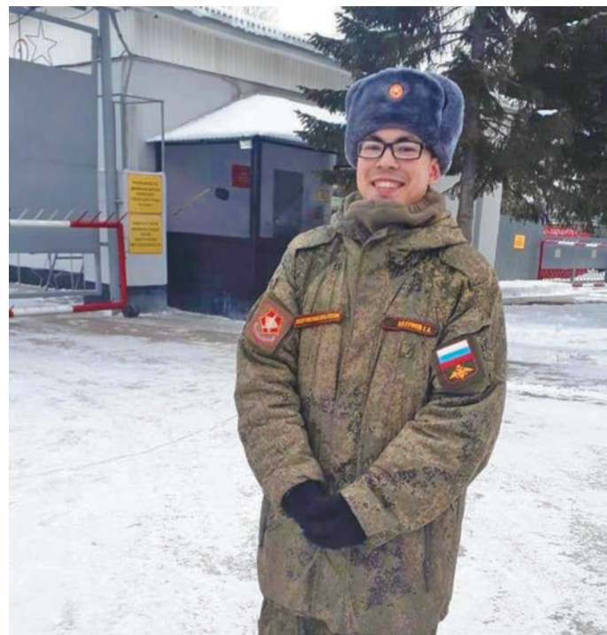
Егор лусытан мәт пөслым өлы

– Пьгын ёт телефон хосыт потыртәгыһ манос пищма хансы?