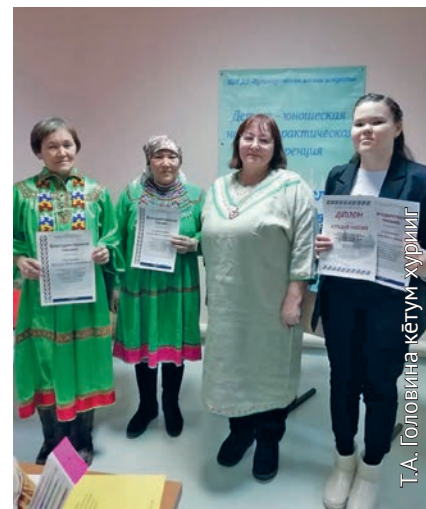
Конкурс магсыл нэпакылы майвёсыт