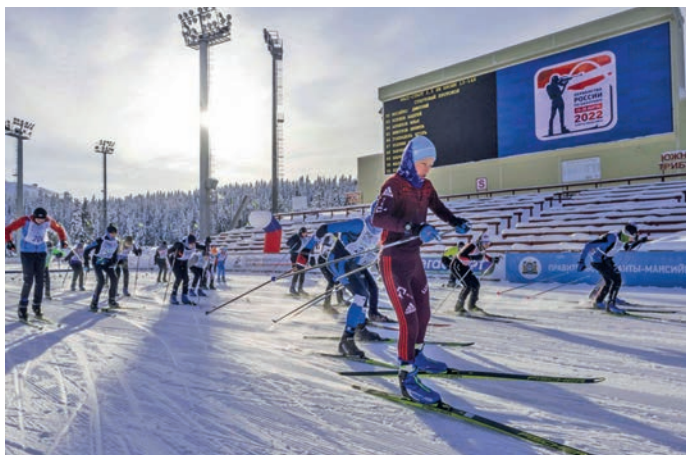
Пуссын аквторыг хайталтасыт