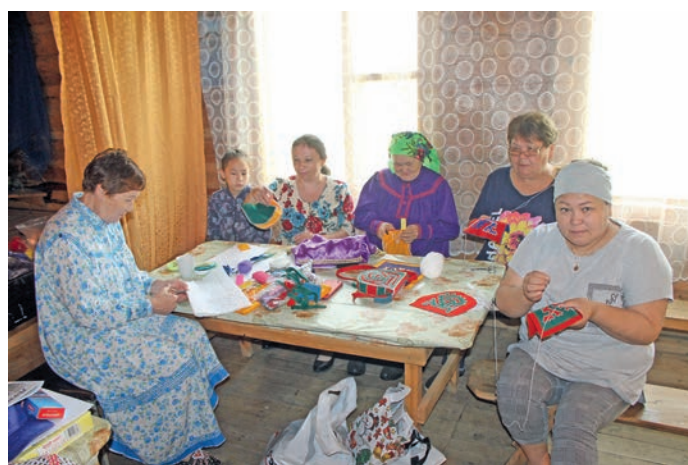
Не́ля нэ́квет ёт ю́нсхатэ́гыт

тамле тэрпит сәвну́ве тә́стэ́гум. Ня́врамыт кон хә́йтыгтым кә́таныл-ла́гланыл сылта́глэ́гыт, ме́н пыгме́нтыл ню́лмияныл хот-сы́стамтыя́нме́н ос ма́рля тб́рыл ла́п-пе́рия́нме́н. Э́лумхө́лас сака тәрвит а́гм ат ке бньщи, ме́нки пусма́л-тыя́нме́н.