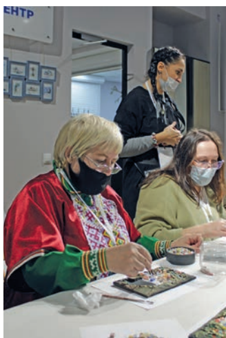
Мāнылат нэ мāхум ханищтыя́нэ