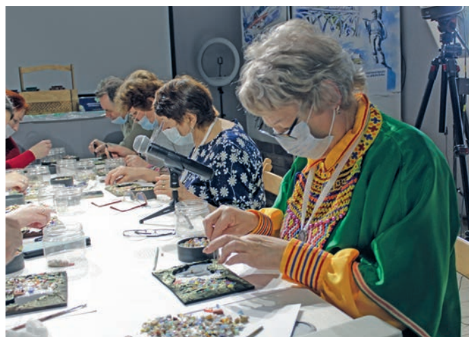
Хāльўс ос Белоярский район нэ́квет мāхар хури вāрэгыт