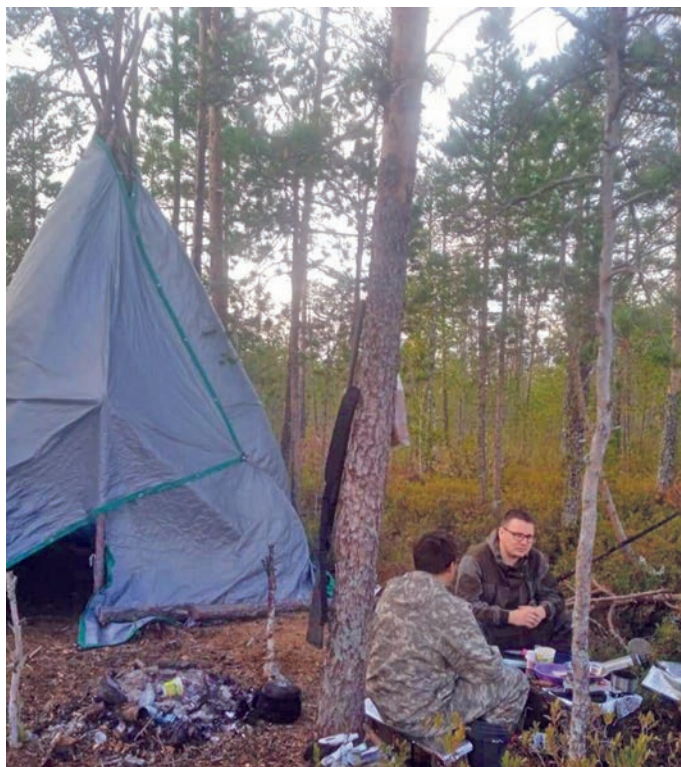
Вәраян хумыг үнлаҳләг

Хотыт вәрт писаль хәнтыс ке, тав җс Росгвардия колн тотуңкве вәрмитә. Тот ты писаль әмщакв уральтаве, хәтпа тув нәматыр вәрмалы ат ке җньщы, тав җс нәматарыл ат вәрәве. Писалит Росгвардия колн лицензионно-разрешительный рупата вәрнә хәтпатн манос полиция колн нән тотән, тот пирмайтавет.