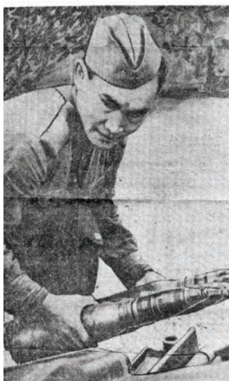
Именомец Савелий Вьюткин иэни он порочивает нарисован на СНИМКЕ: передовой вни ЗА РОДИНУ стр. 3 сентября 1964 г.

Х урит Артём Ванюта пöслым блы. Ты хуритэ ань Хальүс район Саранпавылн омаге-а́тяге палт кётыстэ.