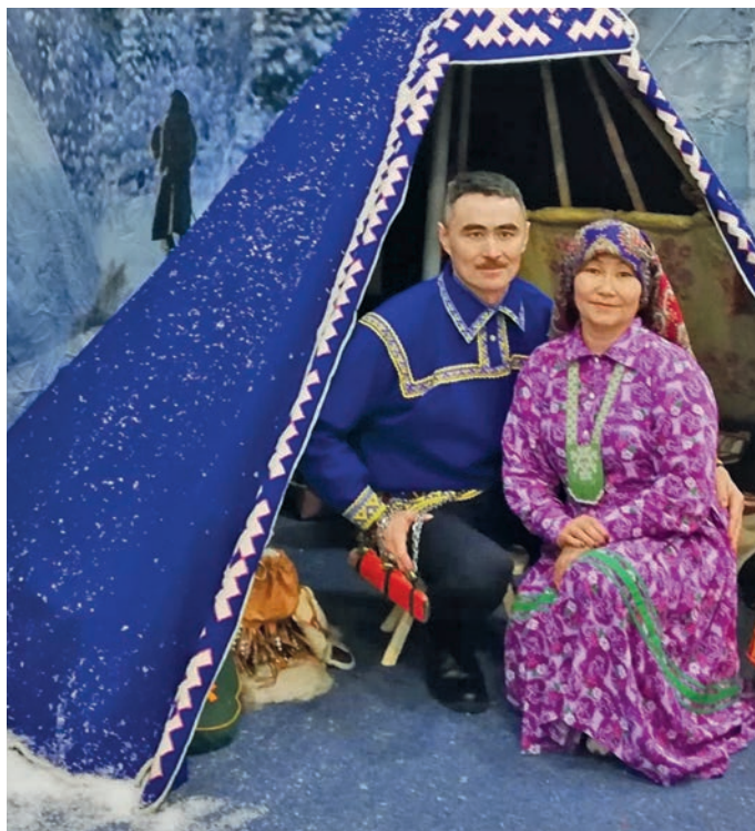
Егор Наков Роза Экватэ ёт ты ёрнкол ёт тотылгә

– Мән яныгмамув по- рат ят савсыр ёмас хул блыс, атямёнтыл супыг, мохсаң, усхул пувинтас-